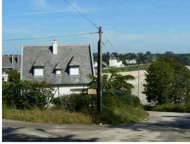
Vue de face IVR53_20072908820NUCA

IVR53_20072908821NUC