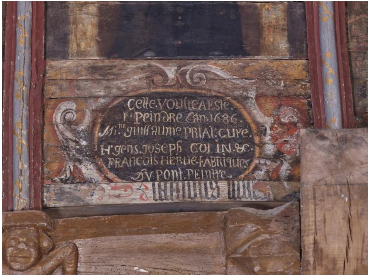
Inscription du 17e siècle sur les lambris de l'église Notre-Dame (le Quillio)