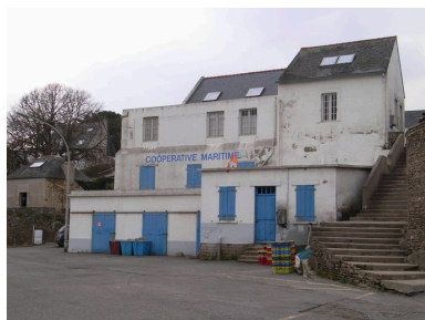
Coopérative maritime de Doëlan IVR53_20072909033NUCA

IVR53_20092909054NUCB