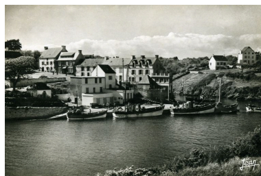
Coopérative maritime de Doëlan en 1962