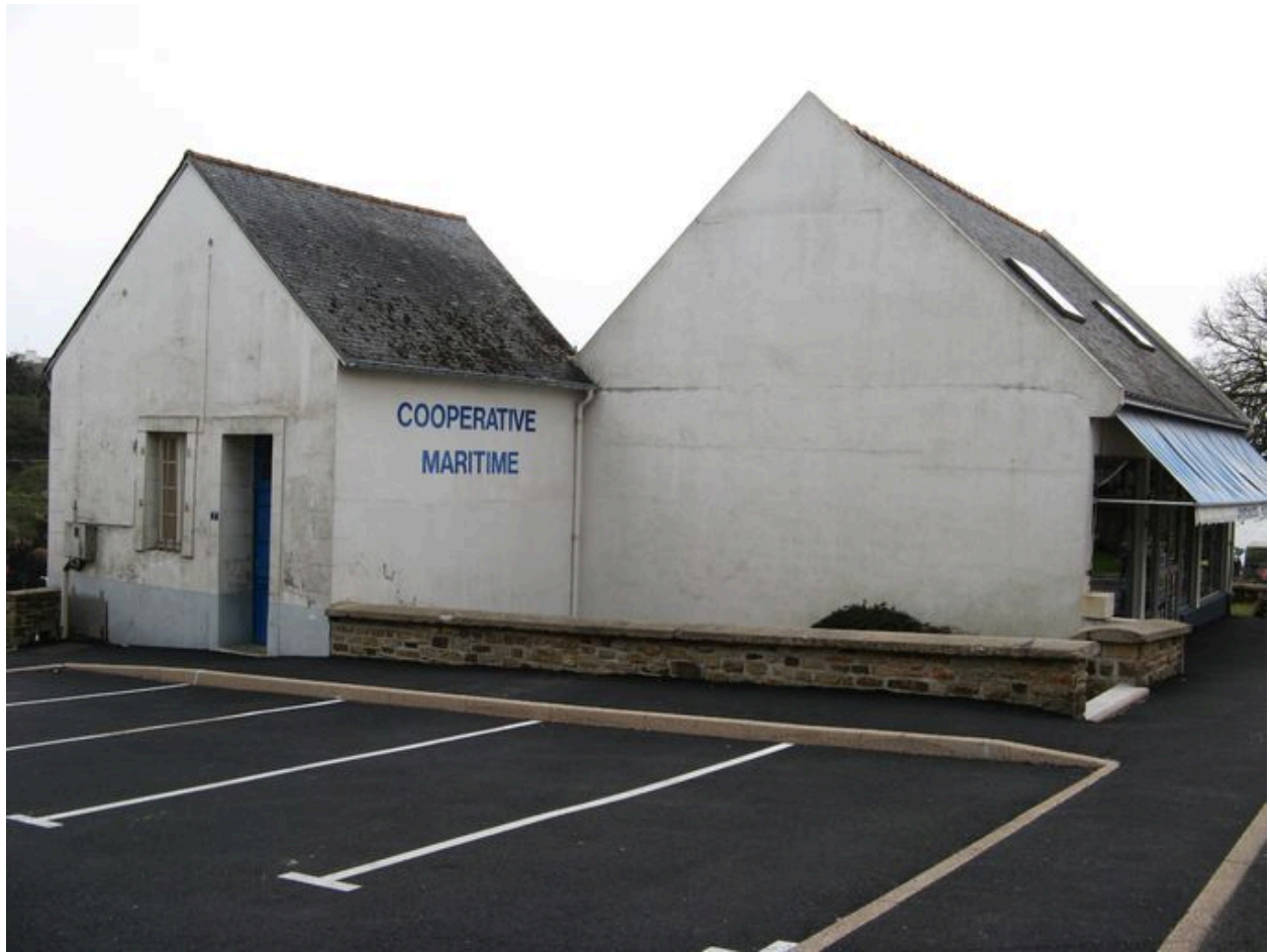
Coopérative maritime vue du parking