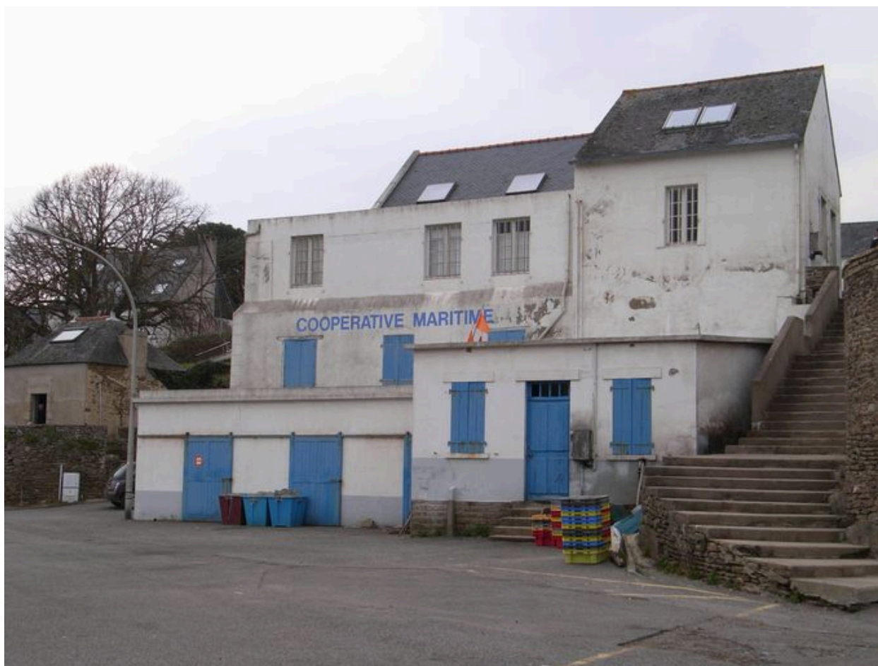
Coopérative maritime de Doëlan