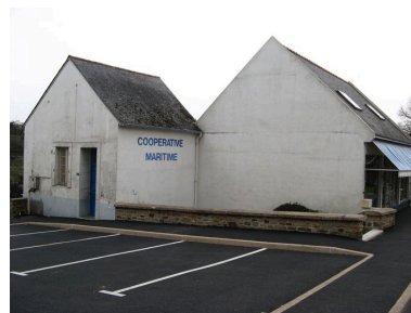
Coopérative maritime vue du parking IVR53_20072909035NUCA

IVR53_20072909032NUCA