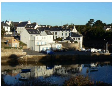
Coopérative maritime vue de la rive gauche IVR53_20072909034NUCA

IVR53_20092909050NUCB