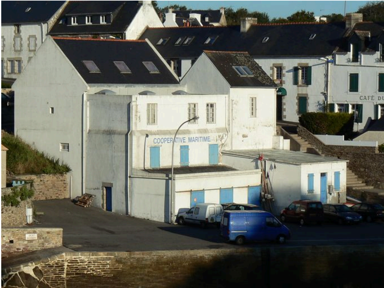
Vue générale de la coopérative maritime