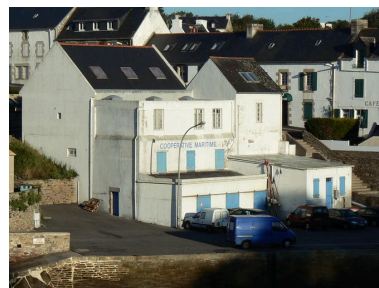
Vue générale de la coopérative maritime