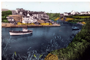
Coopérative maritime dans les années 1950