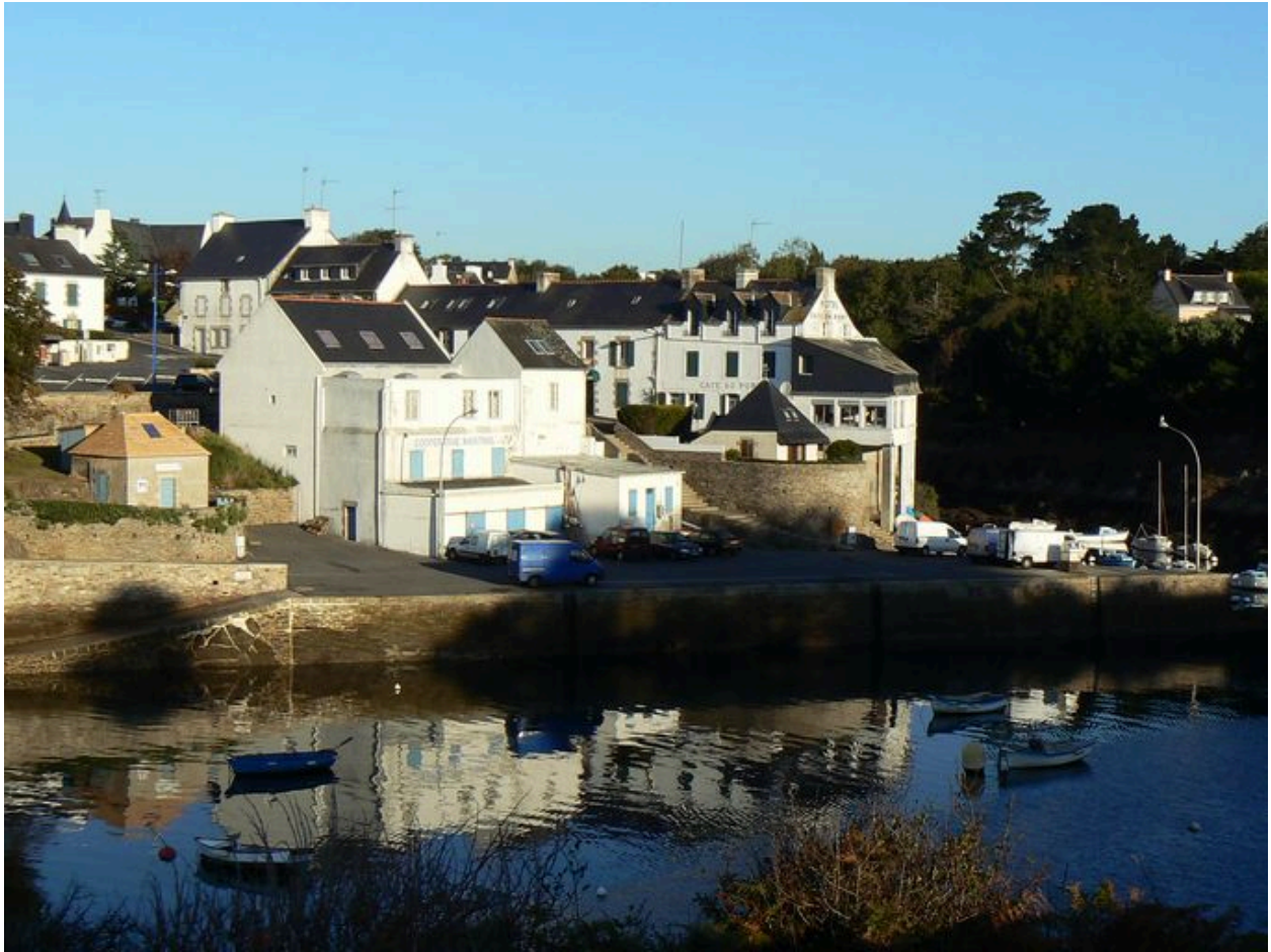
Coopérative maritime vue de la rive gauche