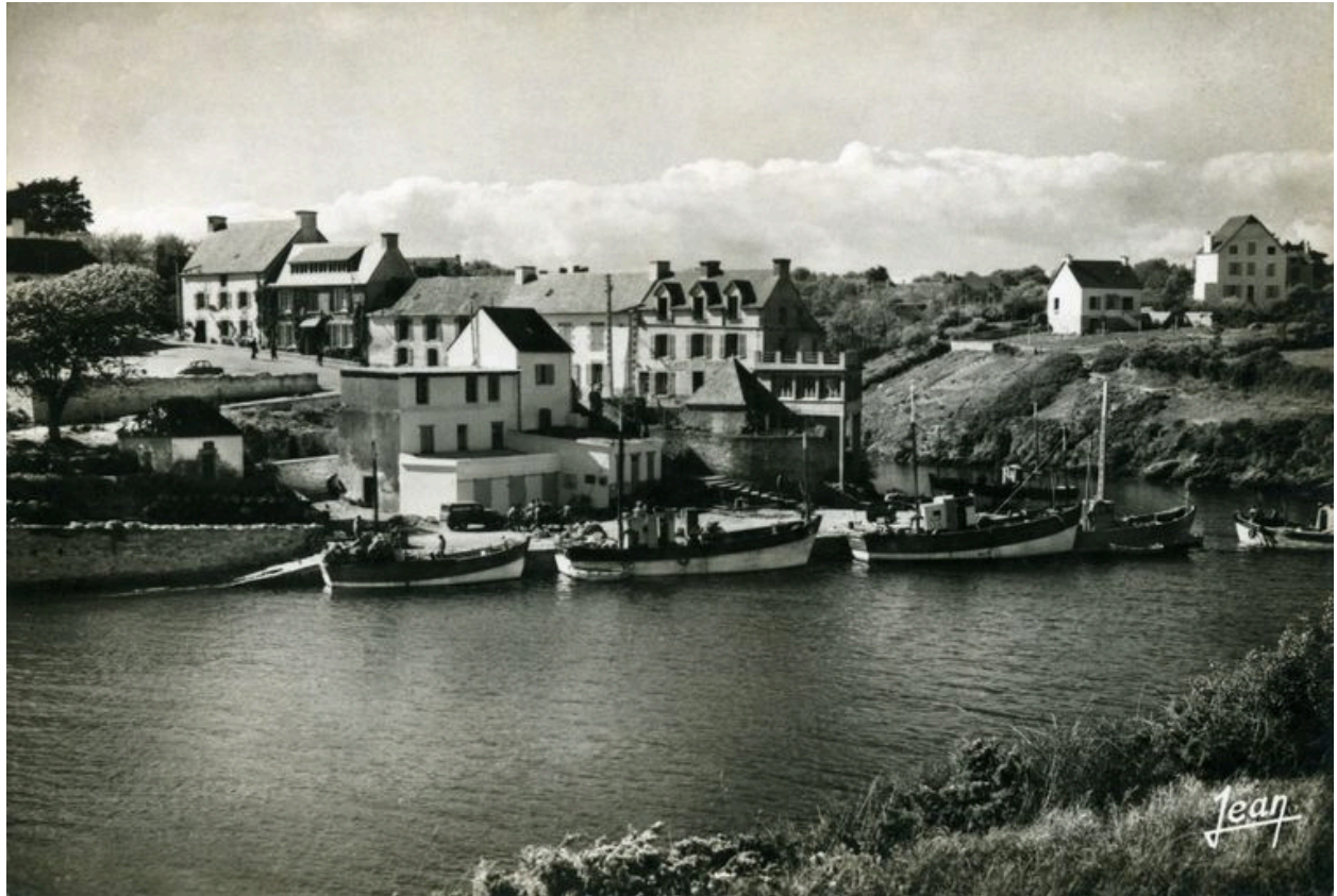
Coopérative maritime de Doëlan en 1962