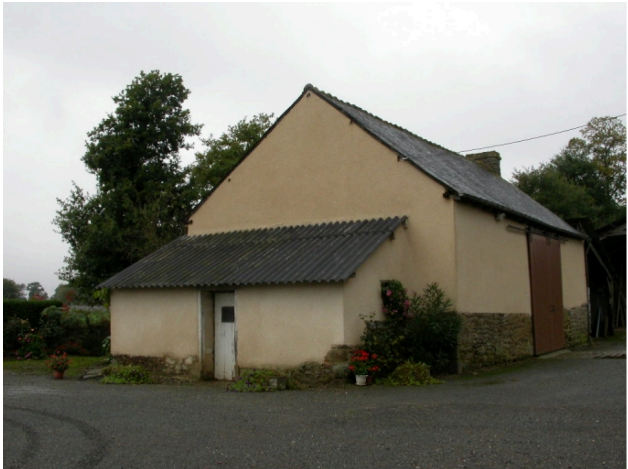
La grange et les porcheries

IVR53_20053518853NUCA Auteur de l'illustration : Stéphanie Ménard (c) Inventaire général, ADAGP reproduction soumise à autorisation du titulaire des droits d'exploitation