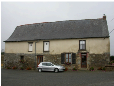
Vue générale sud IVR53_20053518852NUCA