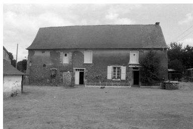
Le bâtiment en 1975 IVR53_19753501045Z