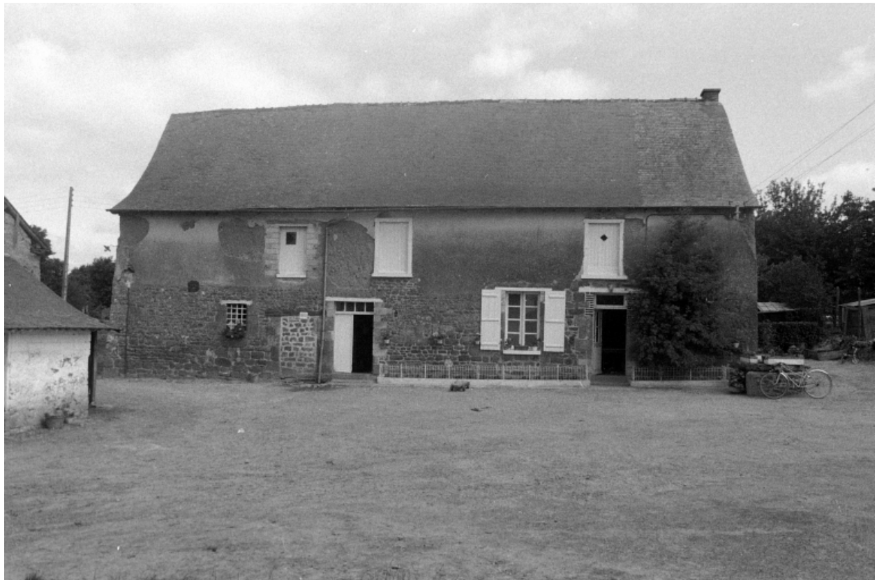
Le bâtiment en 1975