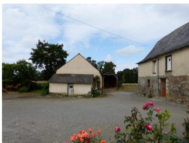
Vue générale est de la dépendance IVR53_20243531245NUCA