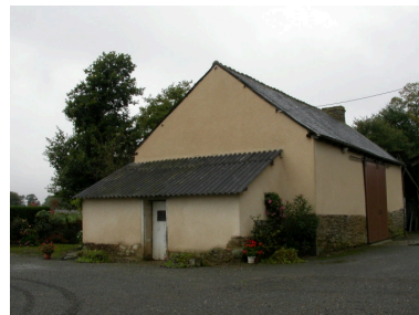
La grange et les porcheries IVR53_20053518853NUCA