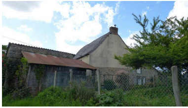
Vue d'ensemble depuis l'est IVR53_20243531244NUCA