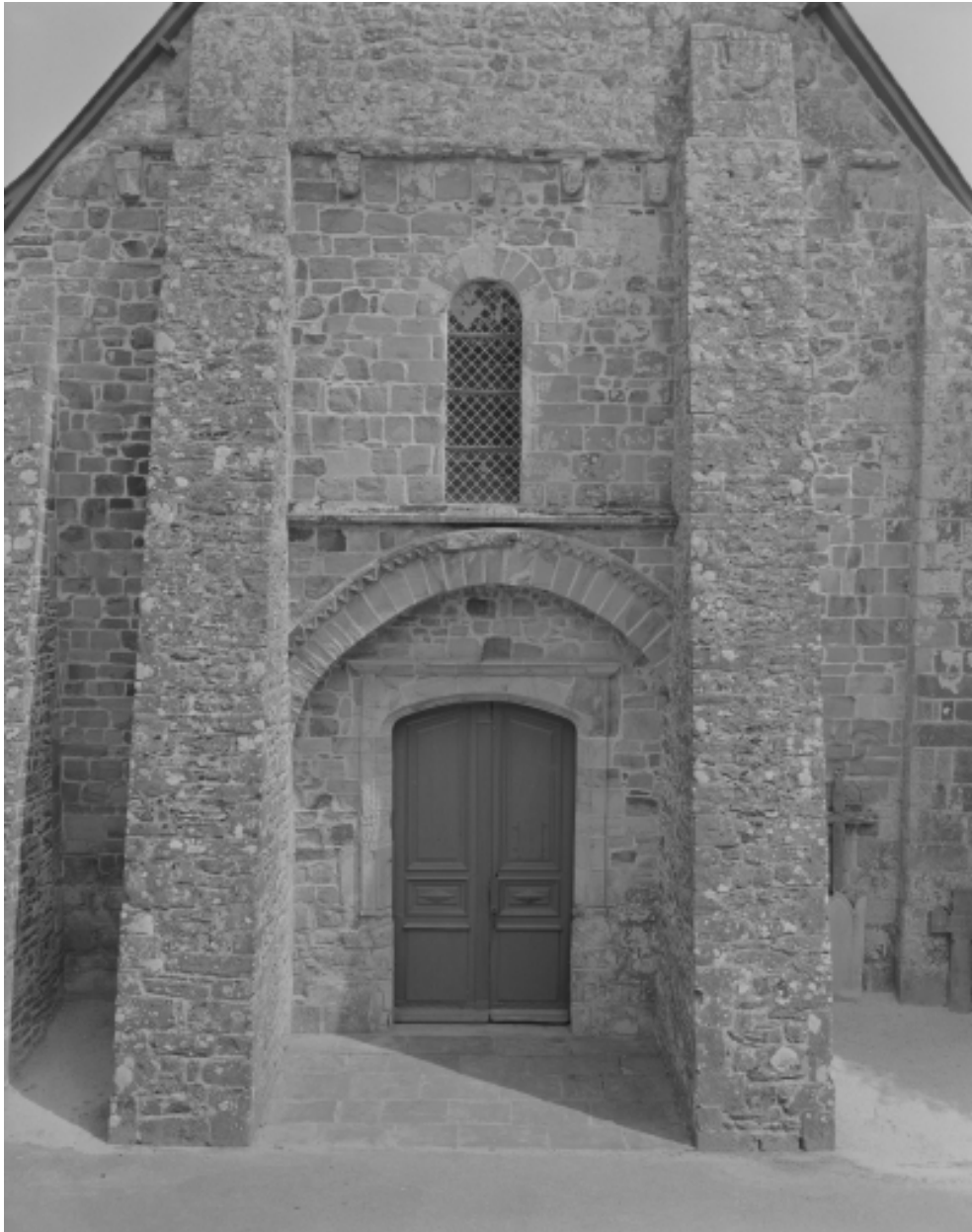
Elévation ouest, porte : vue générale