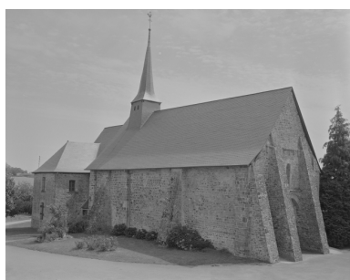
Élévation nord-ouest : vue générale IVR53_19943501421X