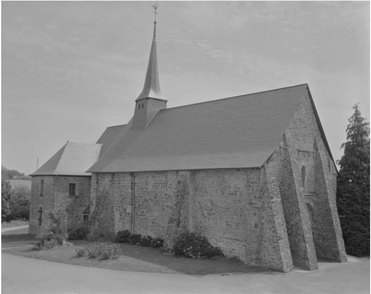
Elévation nord-ouest : vue générale