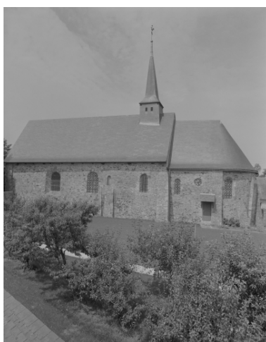
Élévation sud : vue générale, IVR53_19943501423X