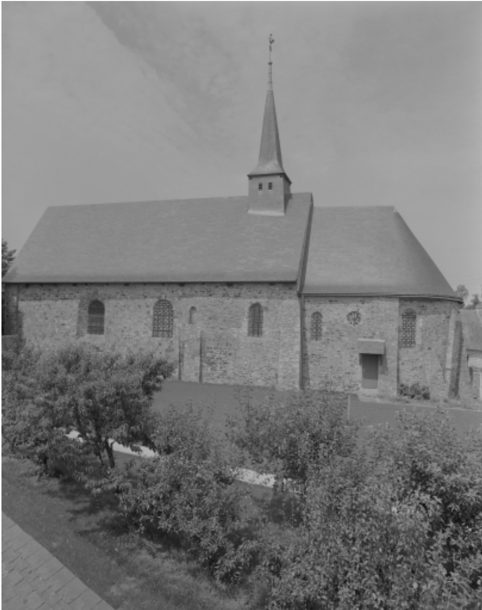
Elévation sud : vue générale