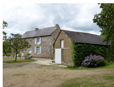
Vue générale sud est IVR53_20243531286NUCA