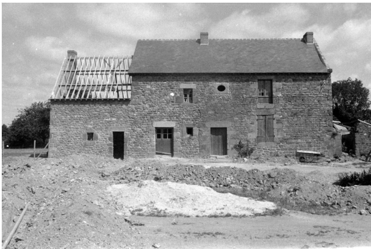
Vue générale sud en 1975