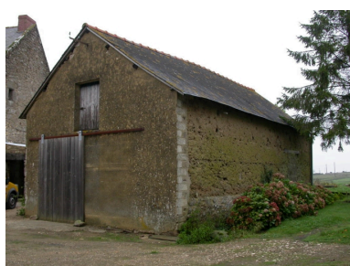
La dépendance en terre IVR53_20053518915NUCA