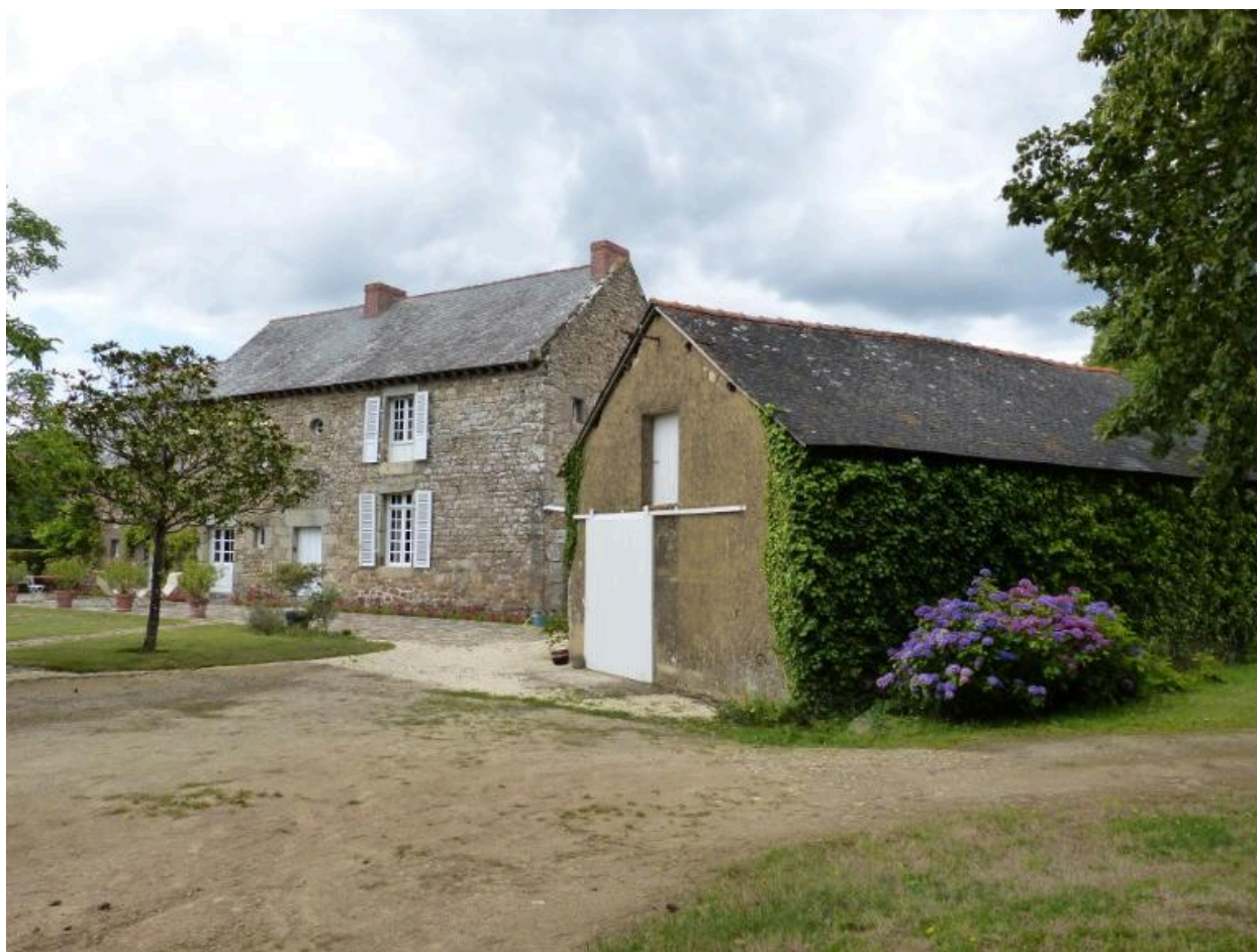
Vue générale sud est