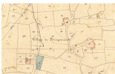
Le bâtiment sur le cadastre de 1835 IVR53_20053518912NUCA