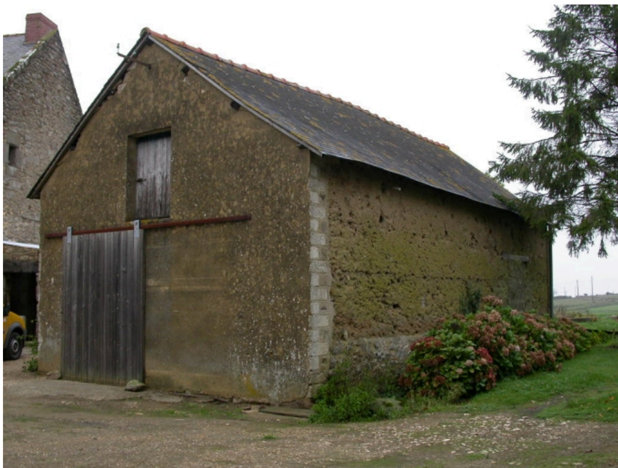
La dépendance en terre