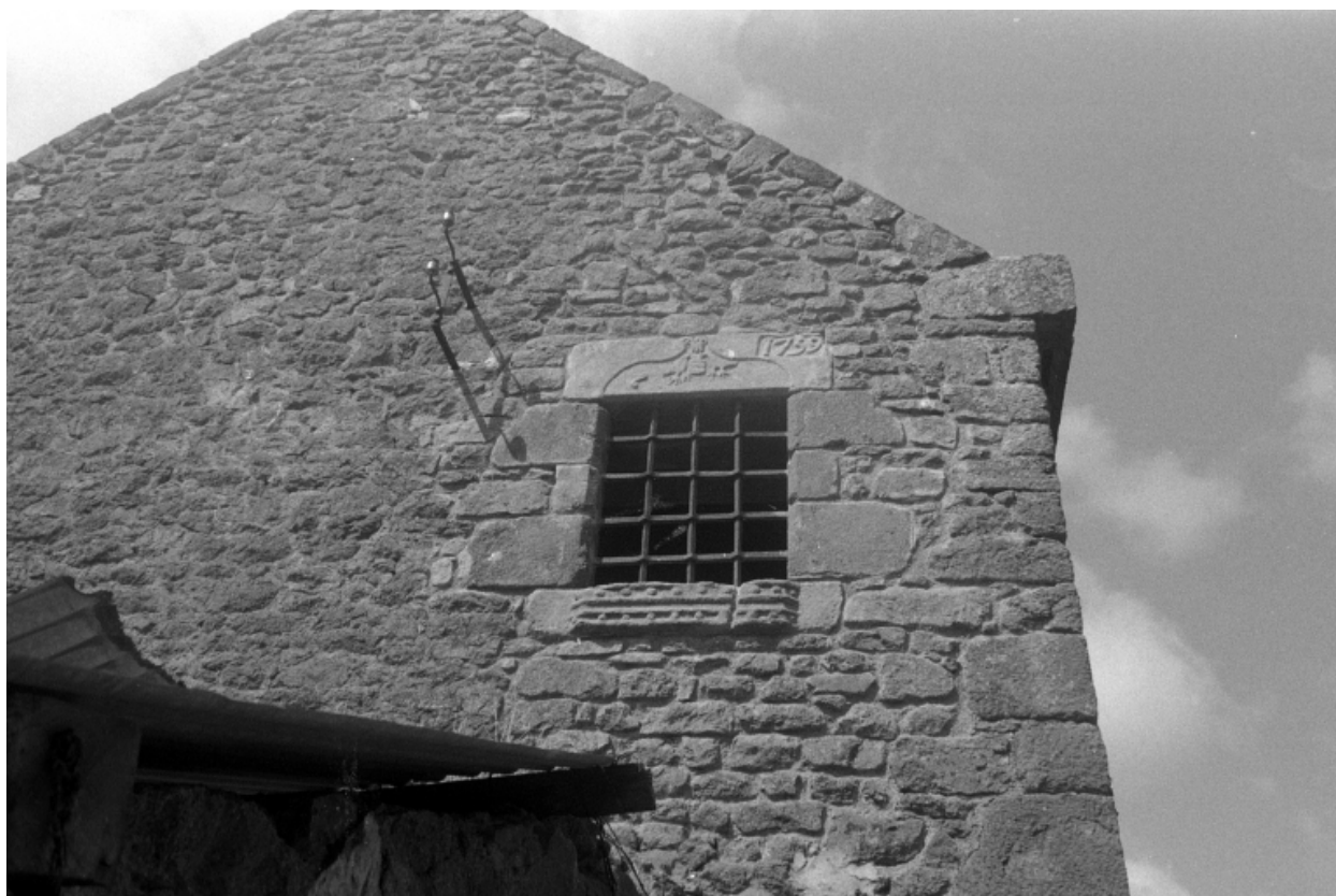
Fenêtre datée au pignon est