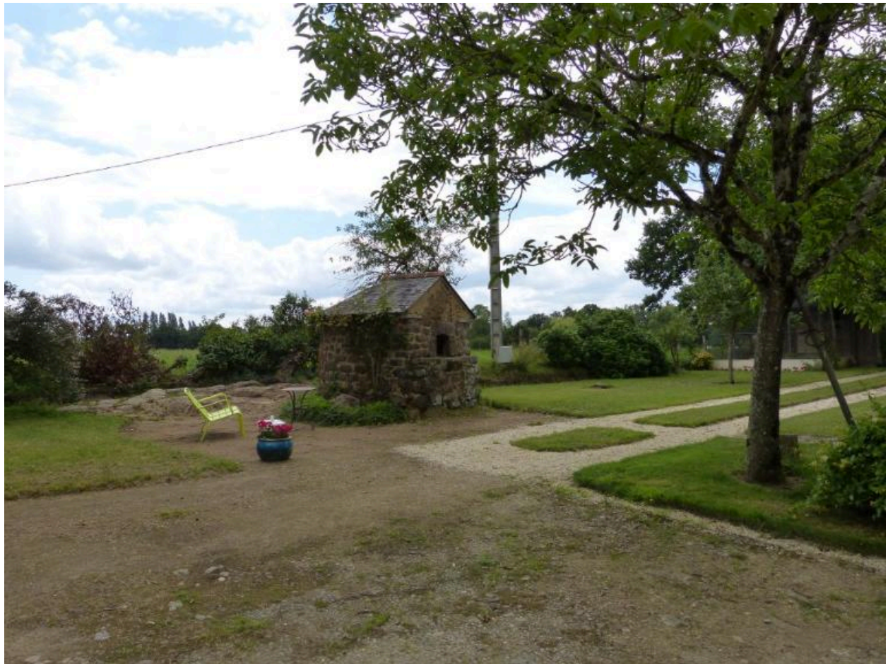
Four au sud de la propriété