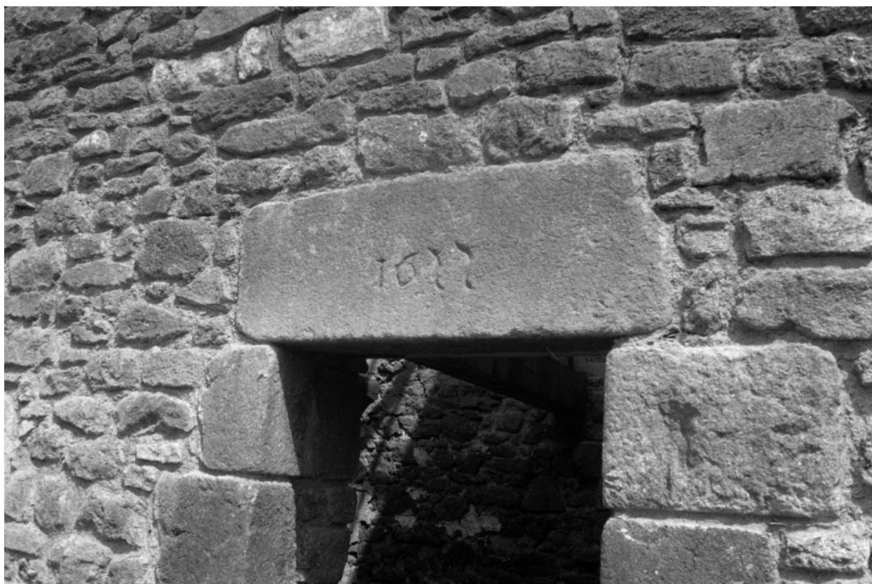
Linteau de porte daté 1622