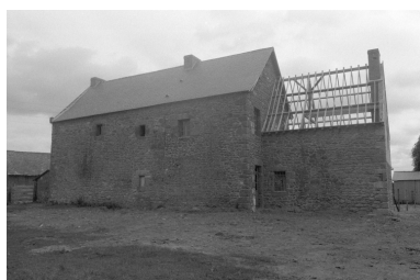
Façade postérieure IVR53_19753501065Z