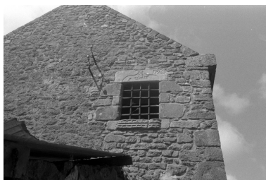
Fenêtre datée au pignon est