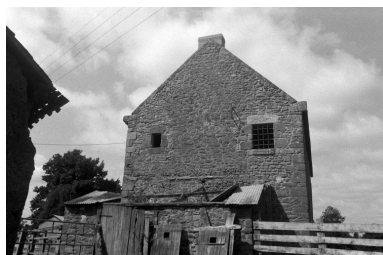
Pignon est IVR53_19753501062Z