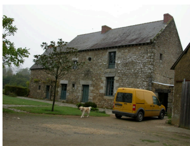
Vue sud-est IVR53_20053518914NUCA