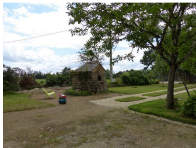
Four au sud de la propriété IVR53_20243531288NUCA