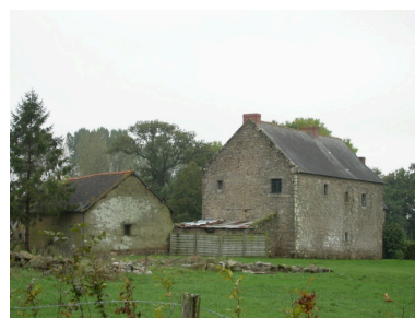
Façade postérieure IVR53_20053518922NUCA