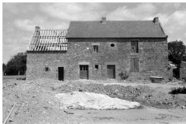
Vue générale sud en 1975 IVR53_19753501060Z