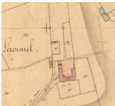
Extrait des plans cadastraux parcellaires de 1848 (AD 22) IVR53_20042205888NUCB

Vue générale, 1er quart du 20ème siècle (AD 22) IVR53_20042205489NUCB