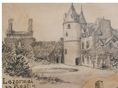
Vue générale, croquis du 2ème quart du 20ème siècle IVR53_20042205472NUCB