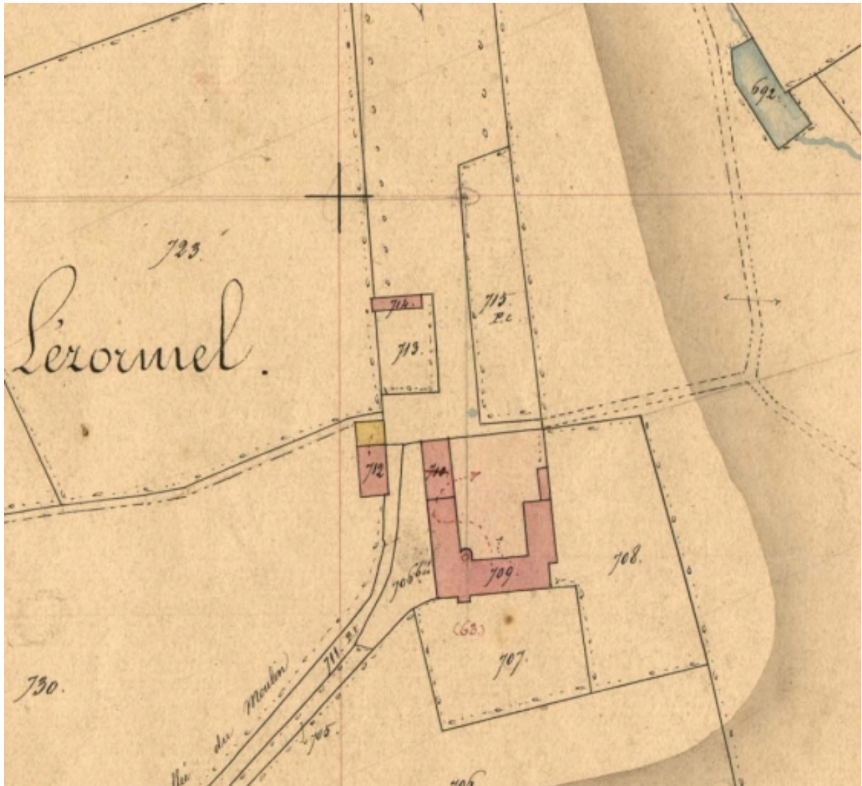
Extrait des plans cadastraux parcellaires de 1848 (AD 22)