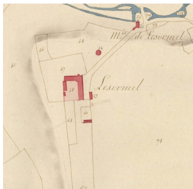
Extrait des plans cadastraux parcellaires de 1813 (AD 22)