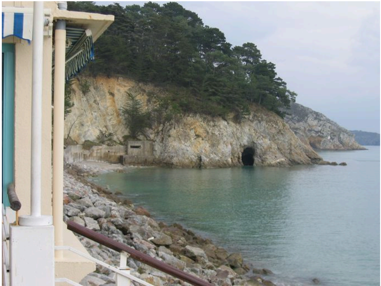
Vue de la casemate de Rulianec