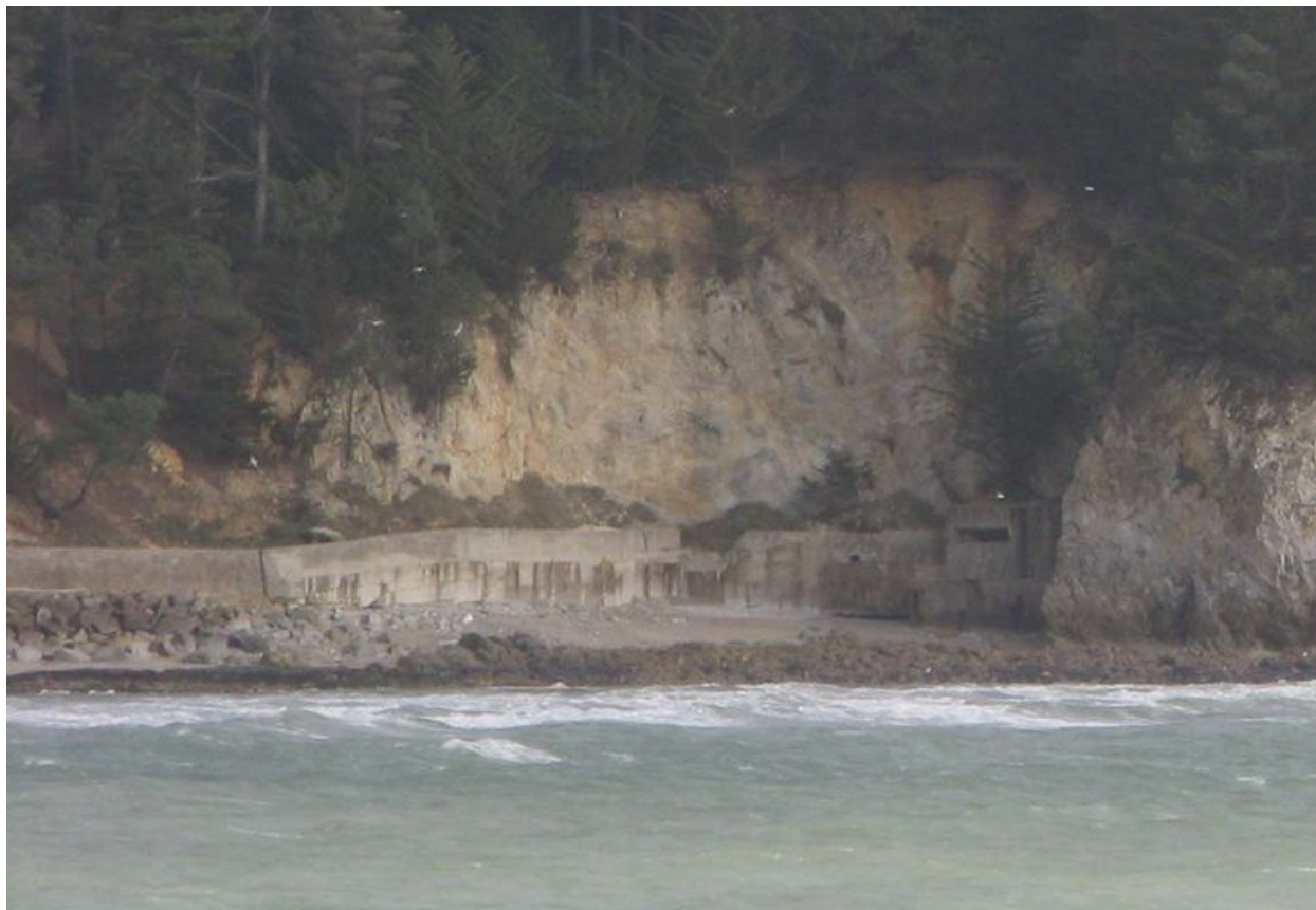
Vue de la casemate de Rulianec