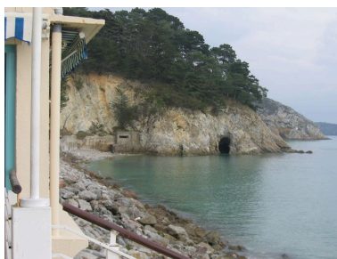
Vue de la casemate de Rulianec