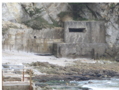
Vue générale de la casemate de Rulianec IVR53_20072908873NUCA