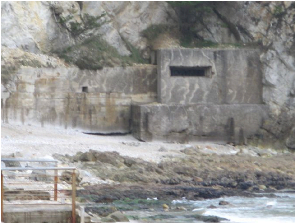
Vue générale de la casemate de Rulianec