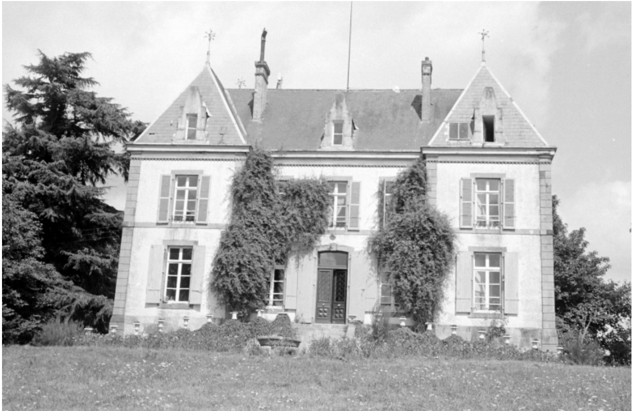
Le château en 1969