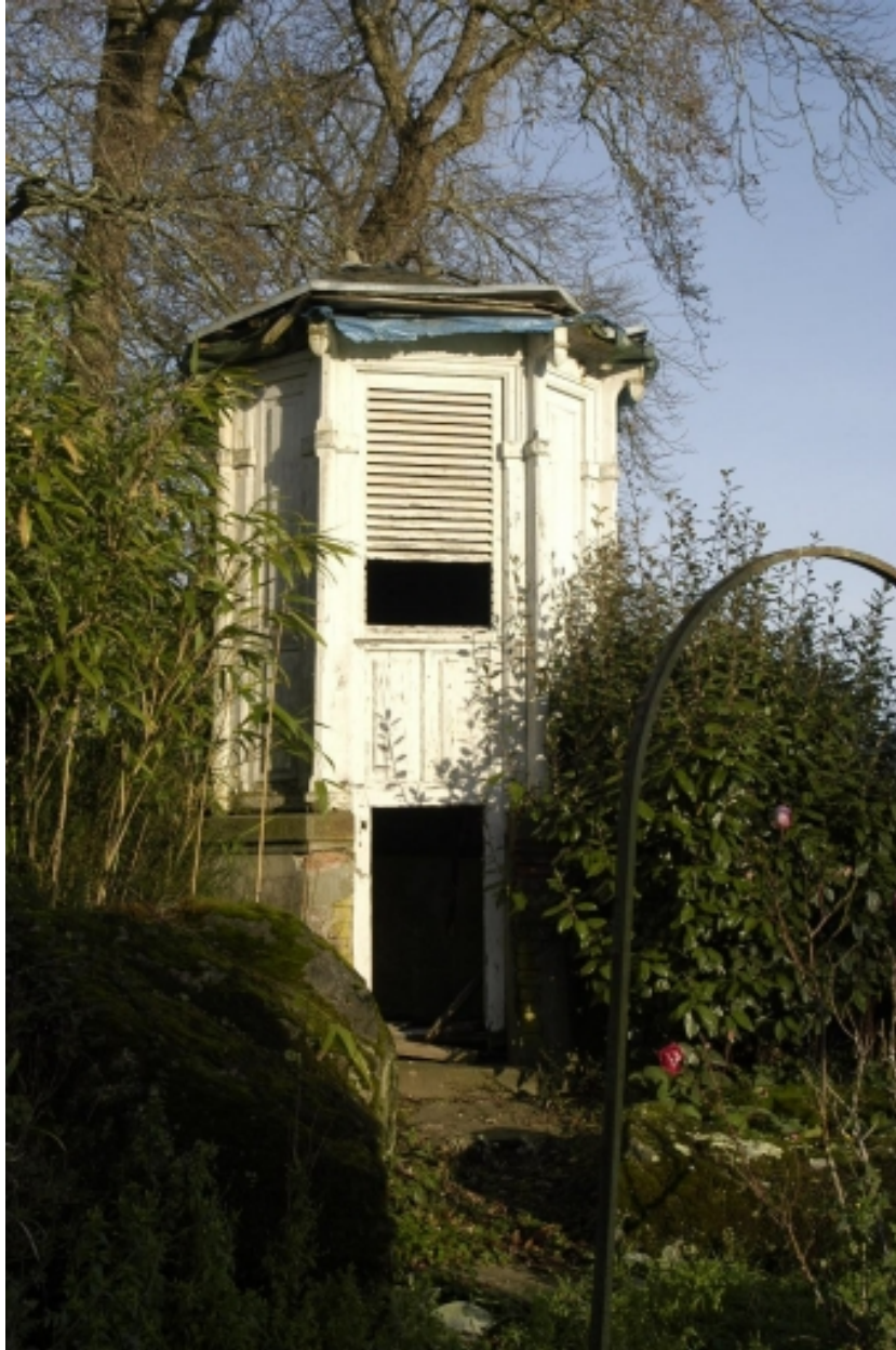
Garde-manger de chasse