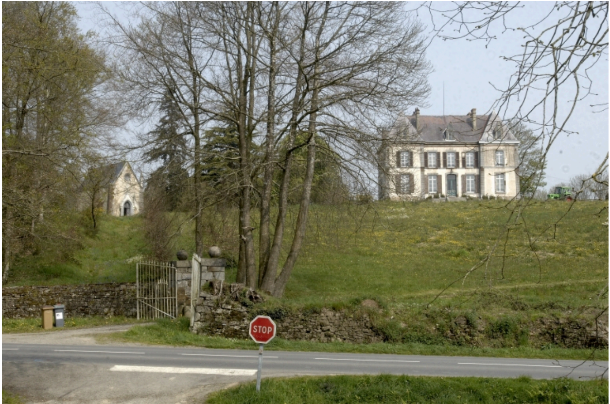
Le château et la chapelle