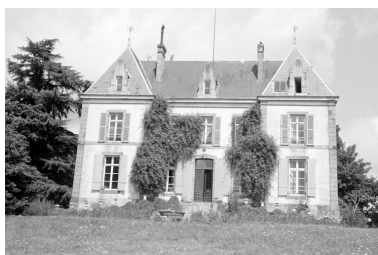
Le château en 1969