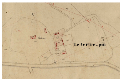
Le château sur le cadastre de 1849