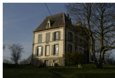
Vue nord-est IVR53_20063514279NUCA