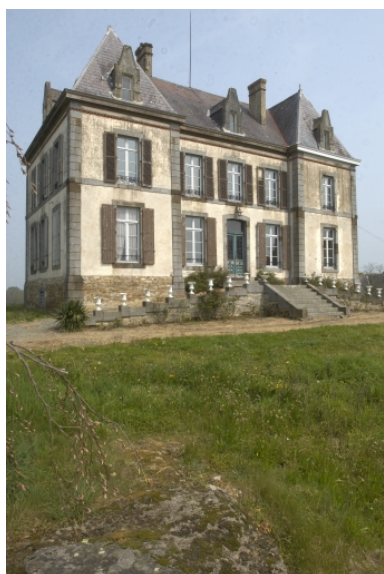
Vue sud-ouest IVR53_20073500598NUCA