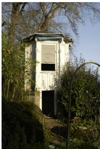
Garde-manger de chasse IVR53_20063514280NUCA