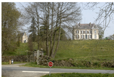
Le château et la chapelle IVR53_20073500589NUCA