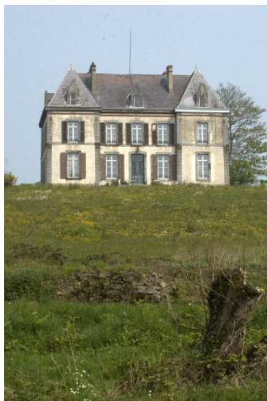
Vue sud IVR53_20073500588NUCA