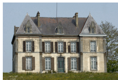
Vue générale sud IVR53_20073500587NUCA