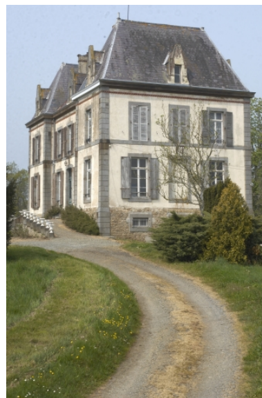
Vue sud-est IVR53_20073500592NUCA