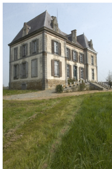
Vue sud-ouest