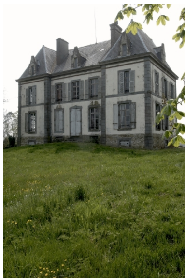
Vue nord-ouest IVR53_20073500593NUCA