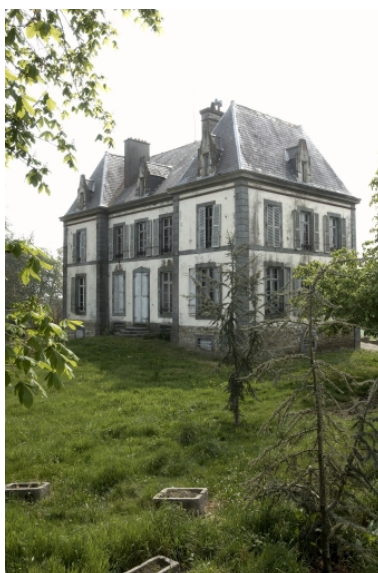
Vue nord-ouest IVR53_20073500594NUCA