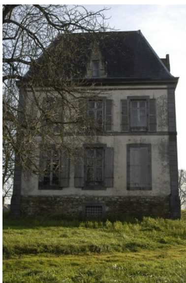
Pignon ouest IVR53_20063514278NUCA