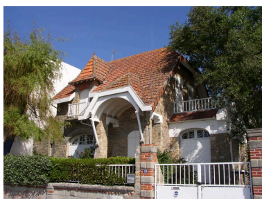
Maison de villégiature Ker Odette IVR53_20075605619NUCA