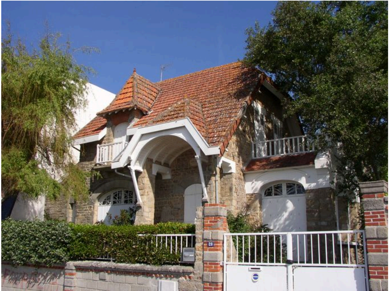
Maison de villégiature Ker Odette