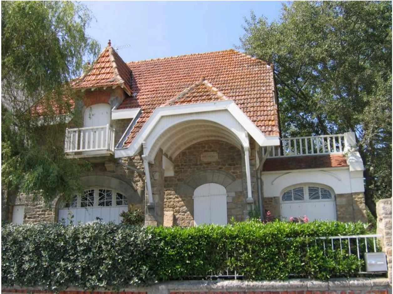
Vue générale de la maison de villégiature Ker Odette