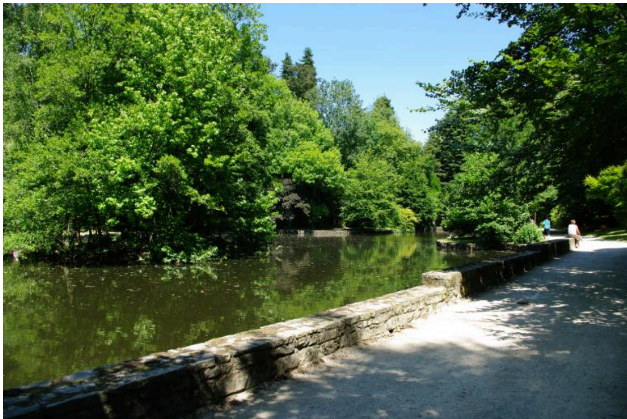
Parc de Kerbihan, Hennebont