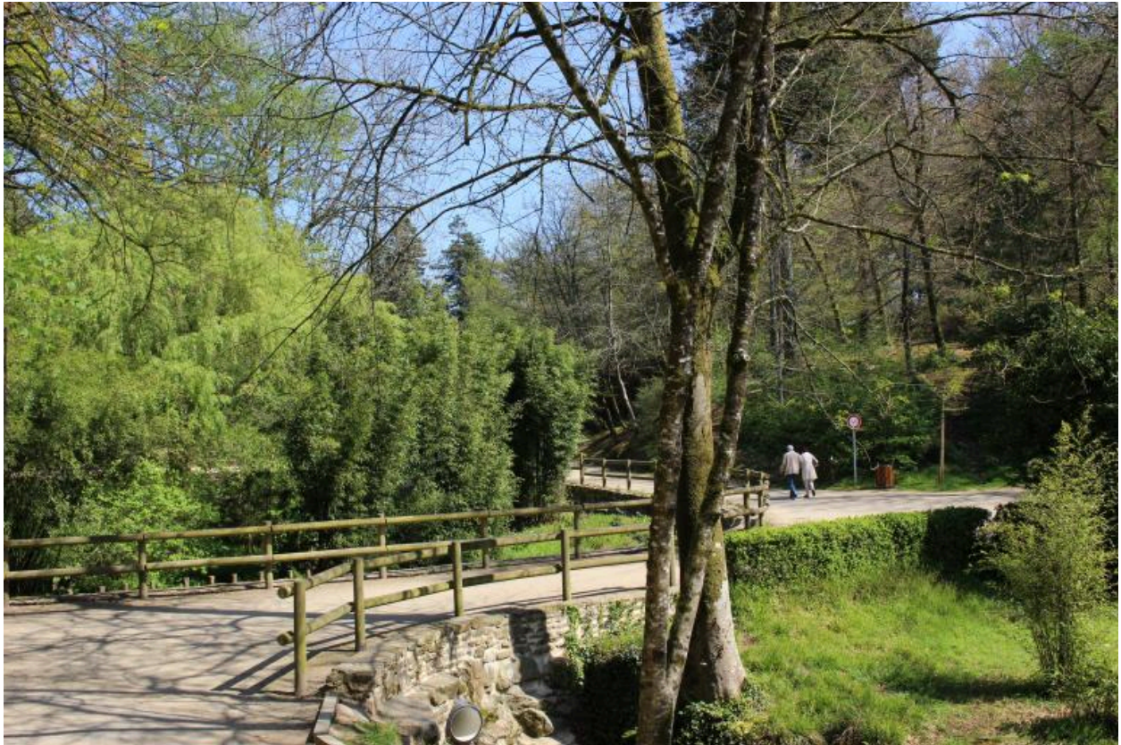
Parc de Kerbihan