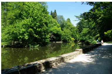
Parc de Kerbihan, Hennebont IVR53_20225605129NUCA