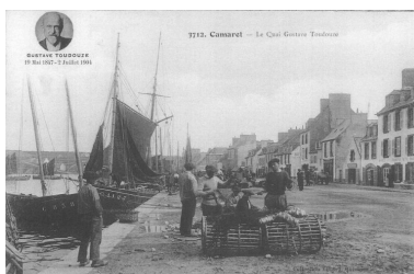
Carte postale : Le quai Gustave Toudouze