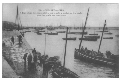
Carte postale : Retour de pêche à Camaret-sur-Mer IVR53_20082908279NUC