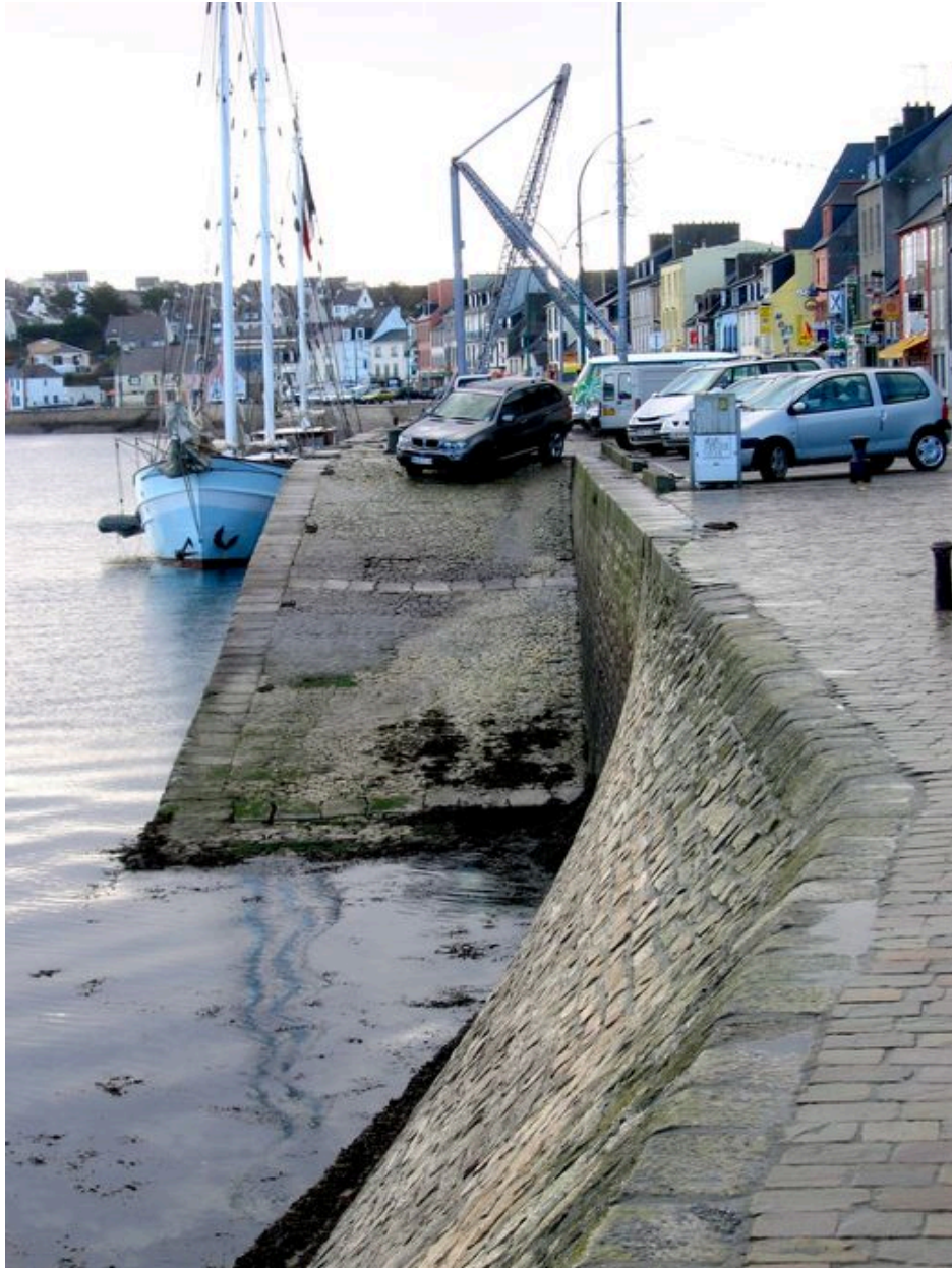
Cale nord du quai Toudouze