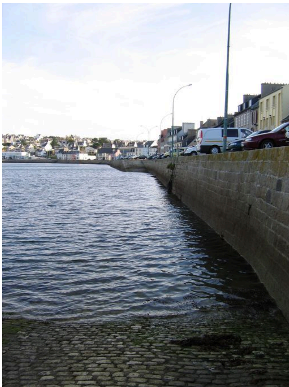
Vue générale du quai Toudouze