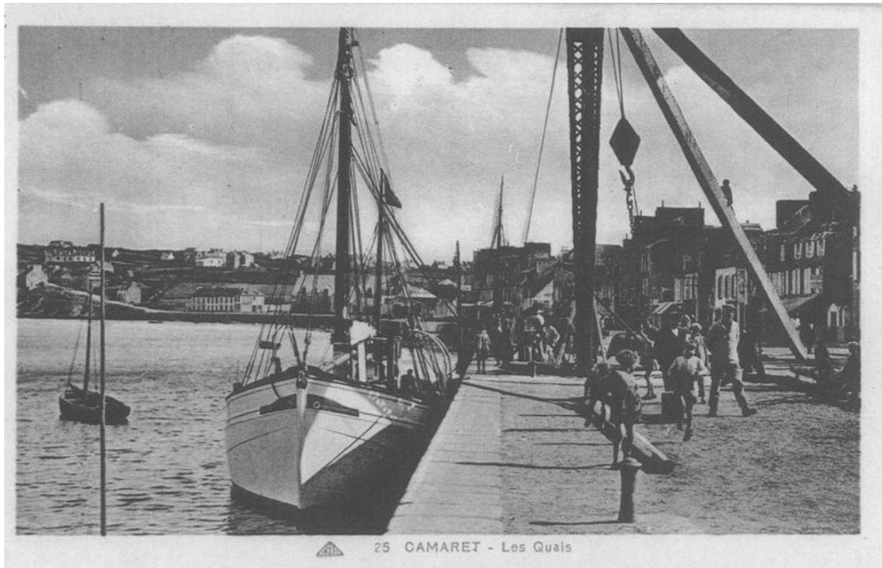
Carte postale : Les quais