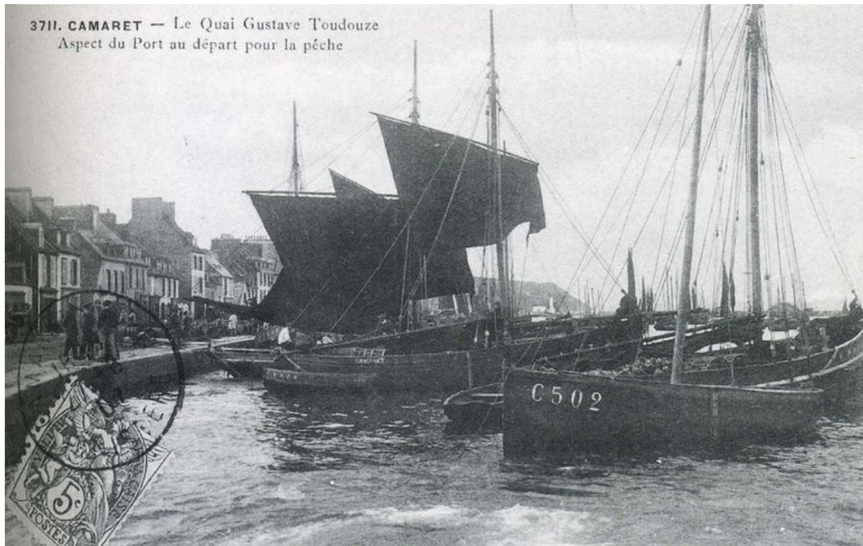
Carte postale 1907 : Le quai Toudouze, aspect du port au départ pour la pêche