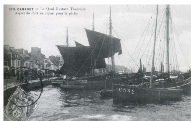
Carte postale 1907 : Le quai Toudouze, aspect du port au départ pour la pêche, IVR53_20072908577NUCB