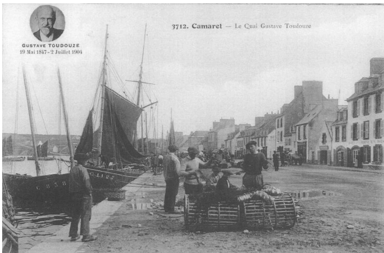
Carte postale : Le quai Gustave Toudouze