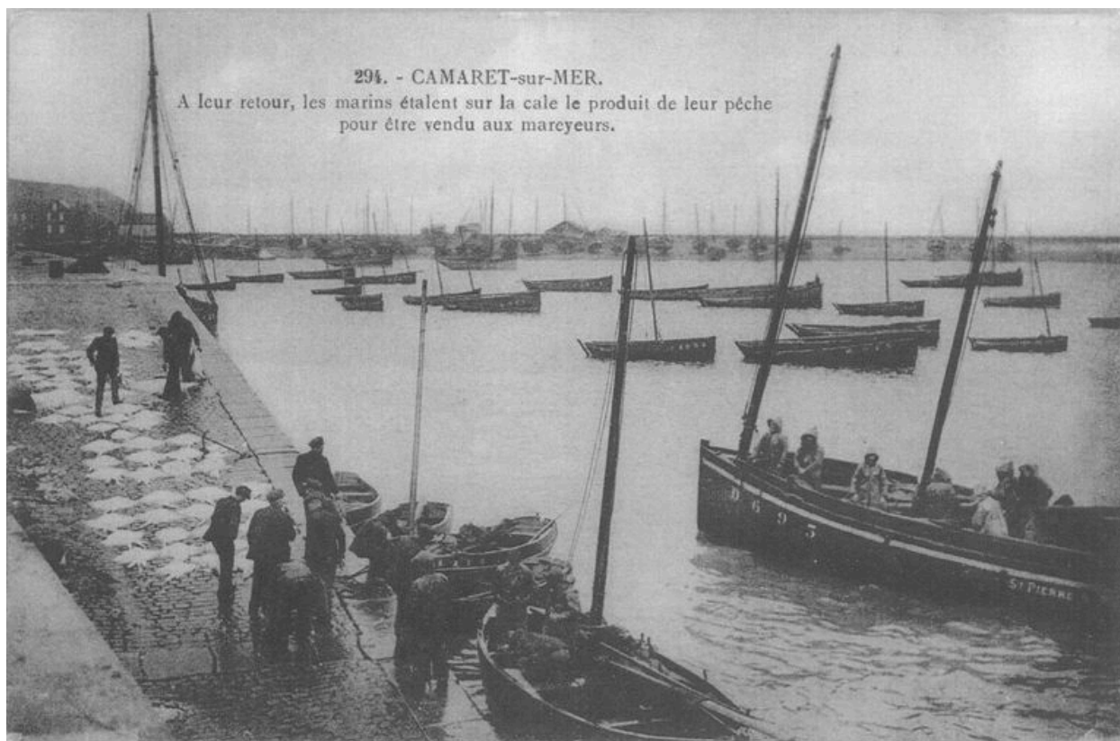
Carte postale : Retour de pêche à Camaret-sur-Mer