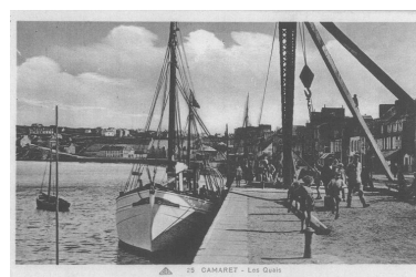
Carte postale : Les quais IVR53_20082908269NUC