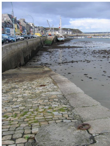
Cale sud du quai Toudouze