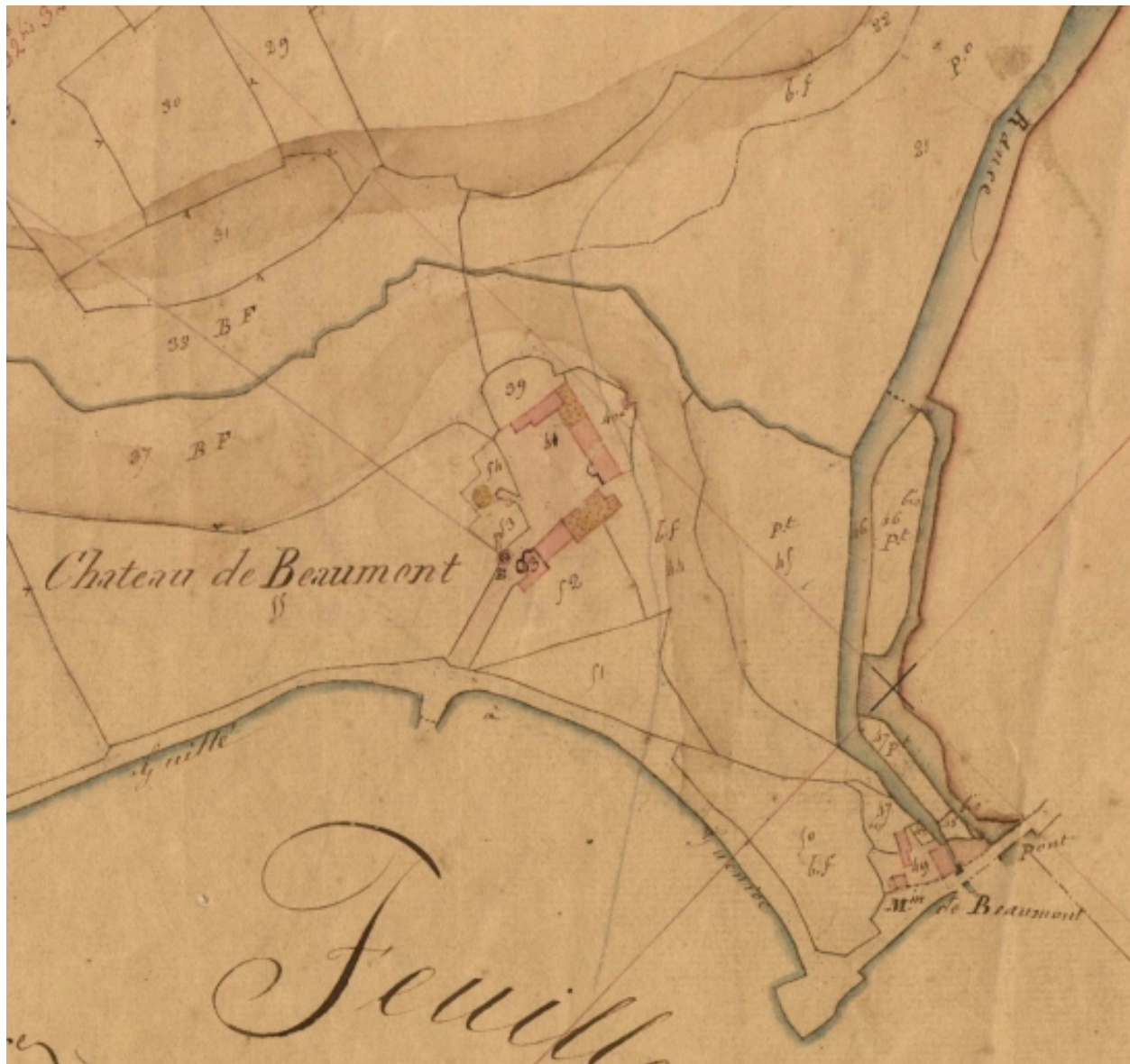
Extrait du cadastre de 1836