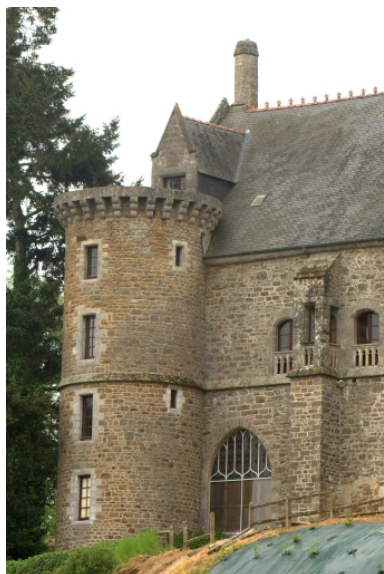
Château, façade donnant sur la Rance, détail