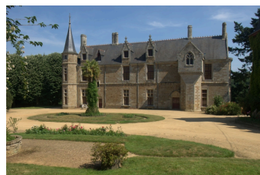
Château IVR53_20102203026NUCA