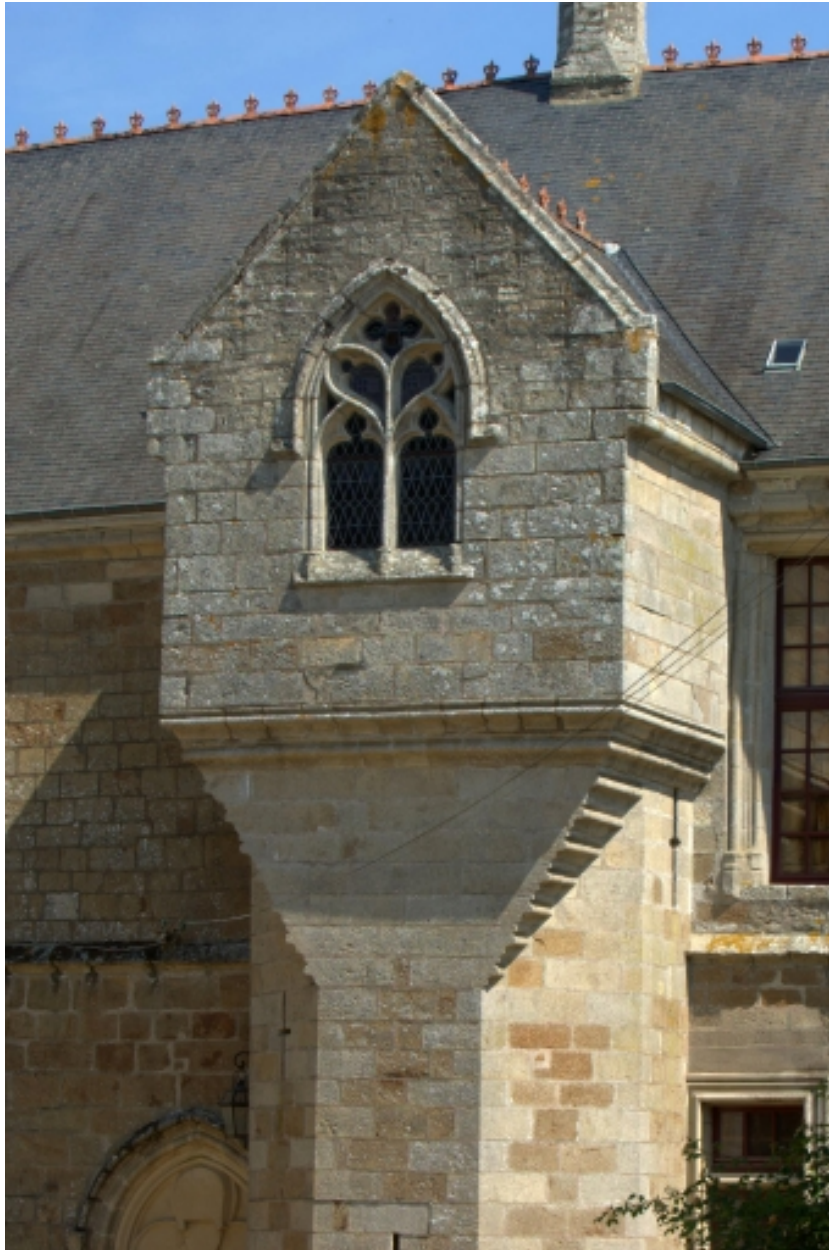
Château, détail, chapelle haute sur tour d'escalier