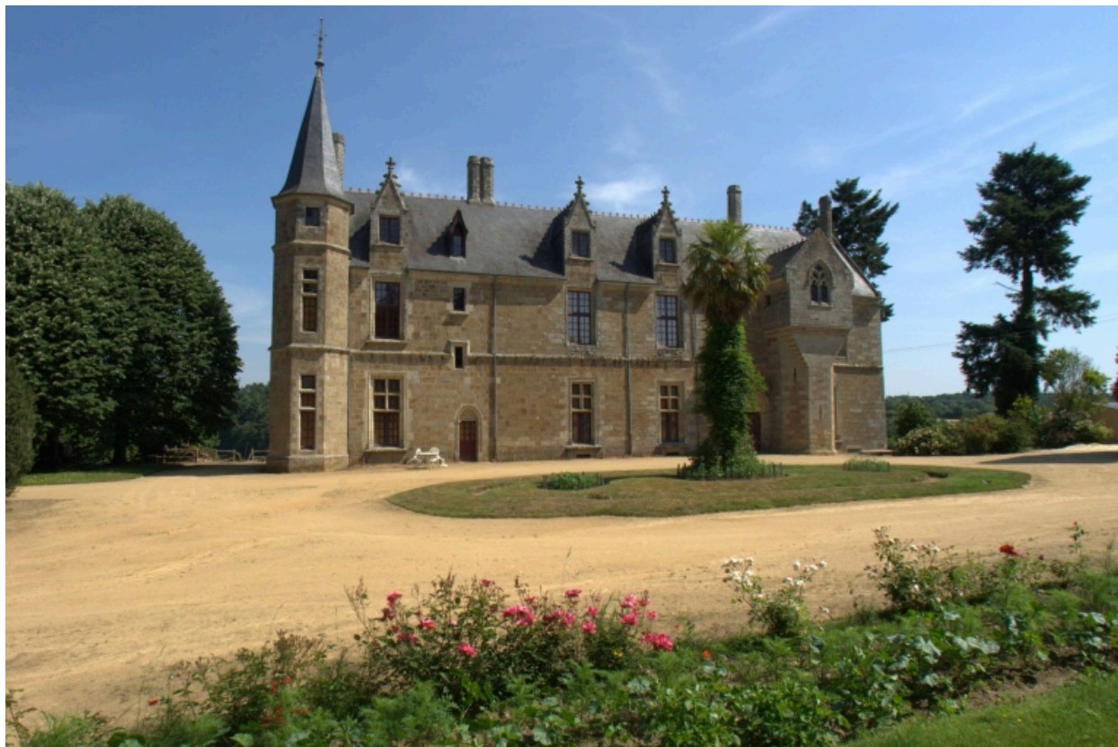
Château, vue générale