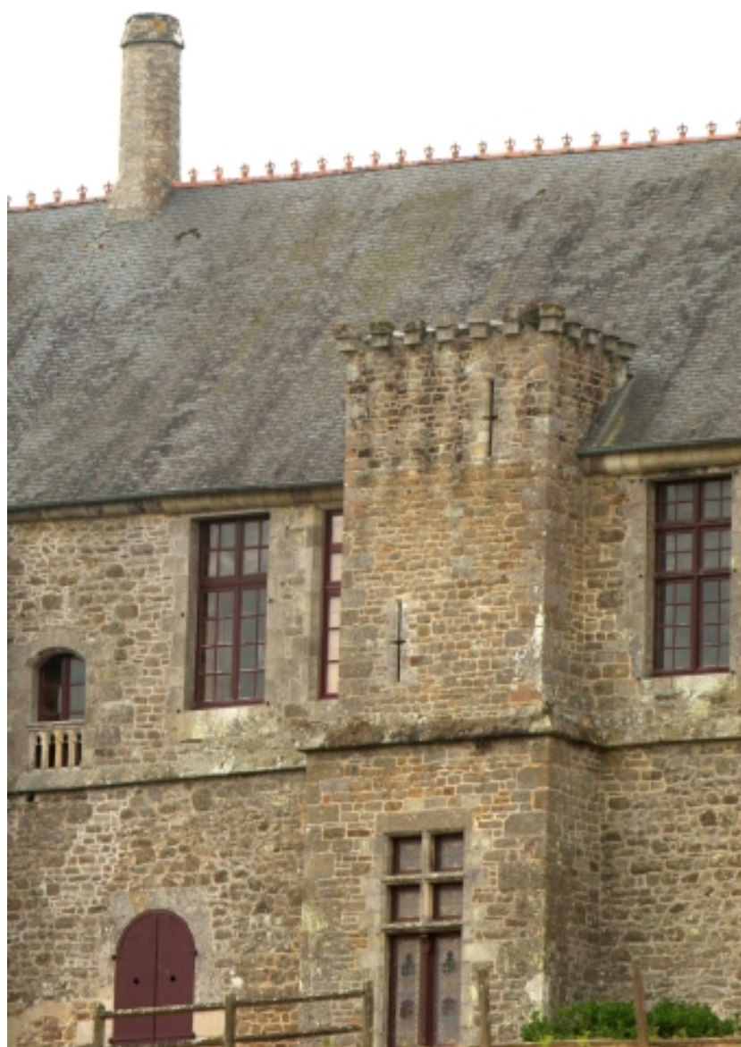
Château, façade donnant sur la Rance, détail