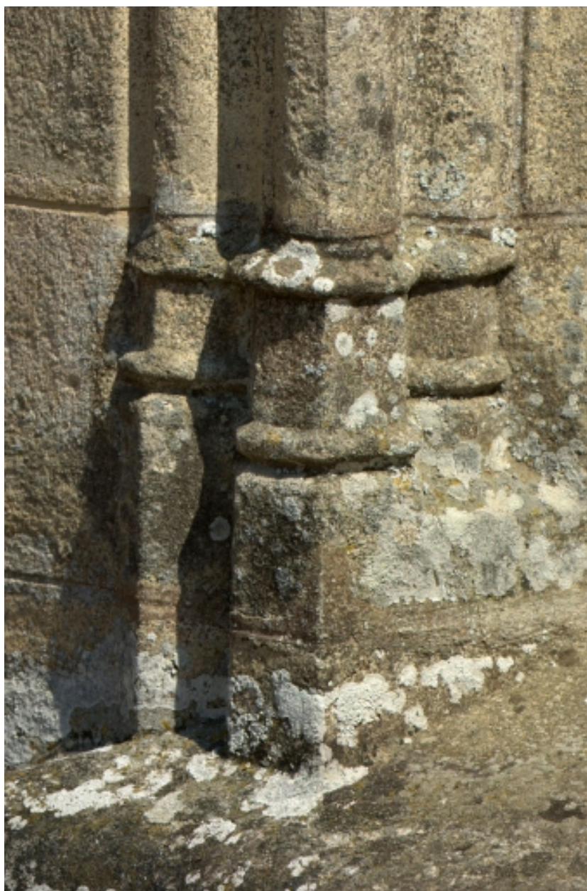
Château, détail, mouluration de la porte