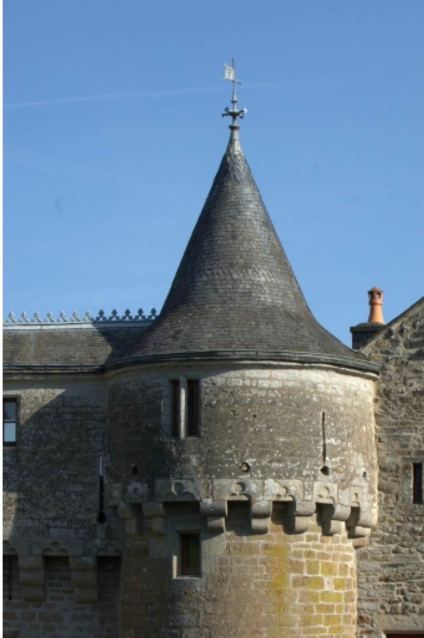
Châtelet d'entrée, détail