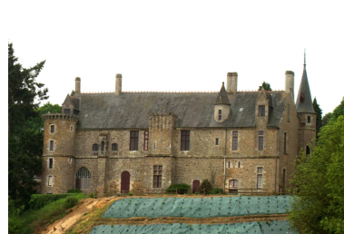
Château, vue générale sur la Rance IVR53_20102202784NUCA