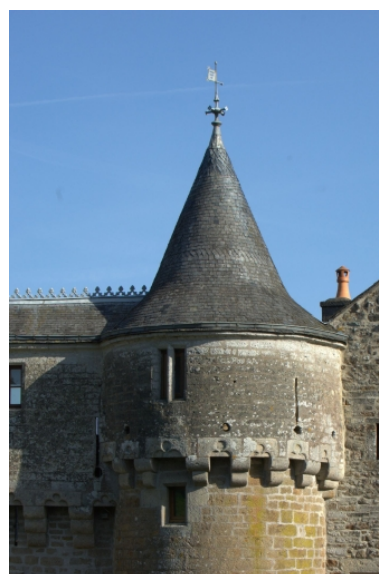
Châtelet d'entrée, détail IVR53_20102202732NUCA