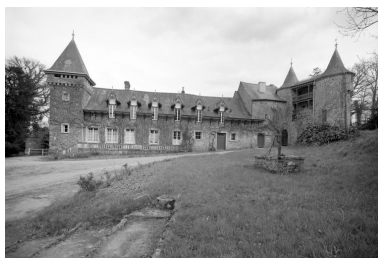
Communs, façade ouest, enquête de 1969 IVR53_19692200161V