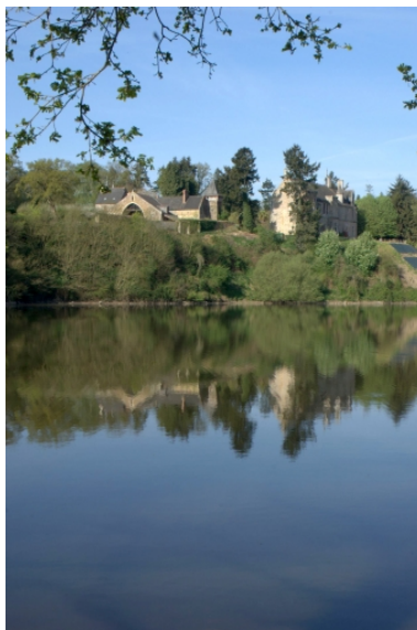
Vue du site, château et commons