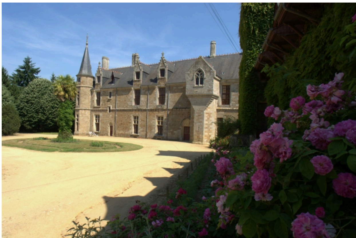
Château, vue générale