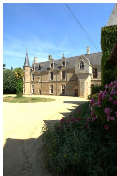
Château, vue générale IVR53_20102203038NUCA