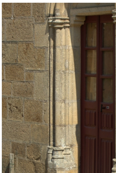
Château, détail, mouluration de la porte IVR53_20102203034NUCA