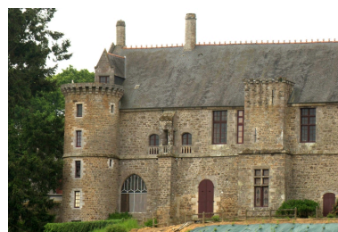
Château, façade donnant sur la Rance, détail