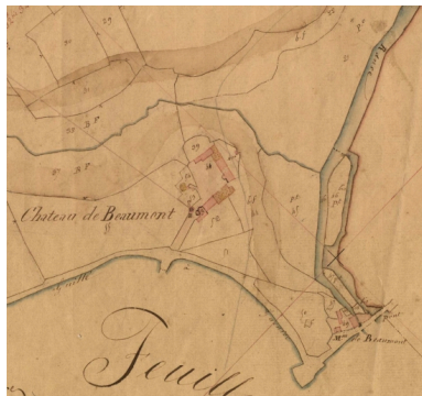
Extrait du cadastre de 1836 IVR53_20092210800NUCA