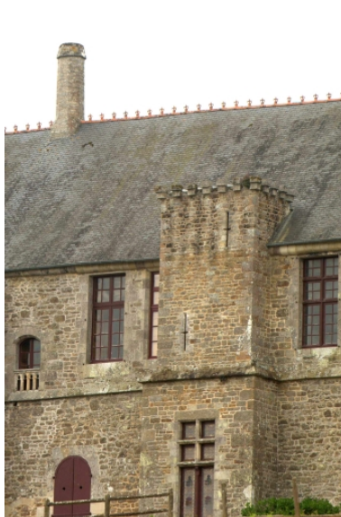
Château, façade donnant sur la Rance, détail IVR53_20102202789NUCA