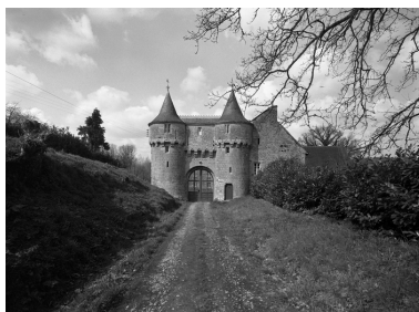
Châtelet d'entrée, vue générale sud, enquête de 1969 IVR53_19692200158V