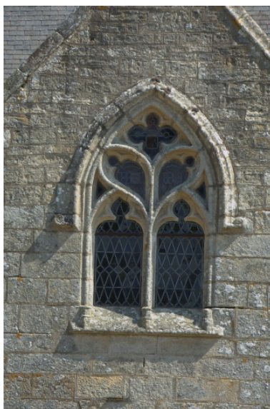
Château, détail, baie de la chapelle IVR53_20102203029NUCA