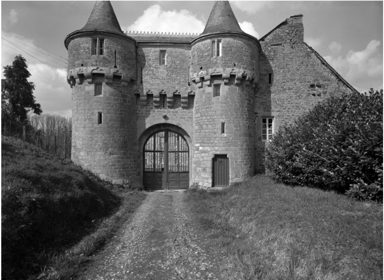
Châtelet d'entrée, vue générale sud, enquête de 1969