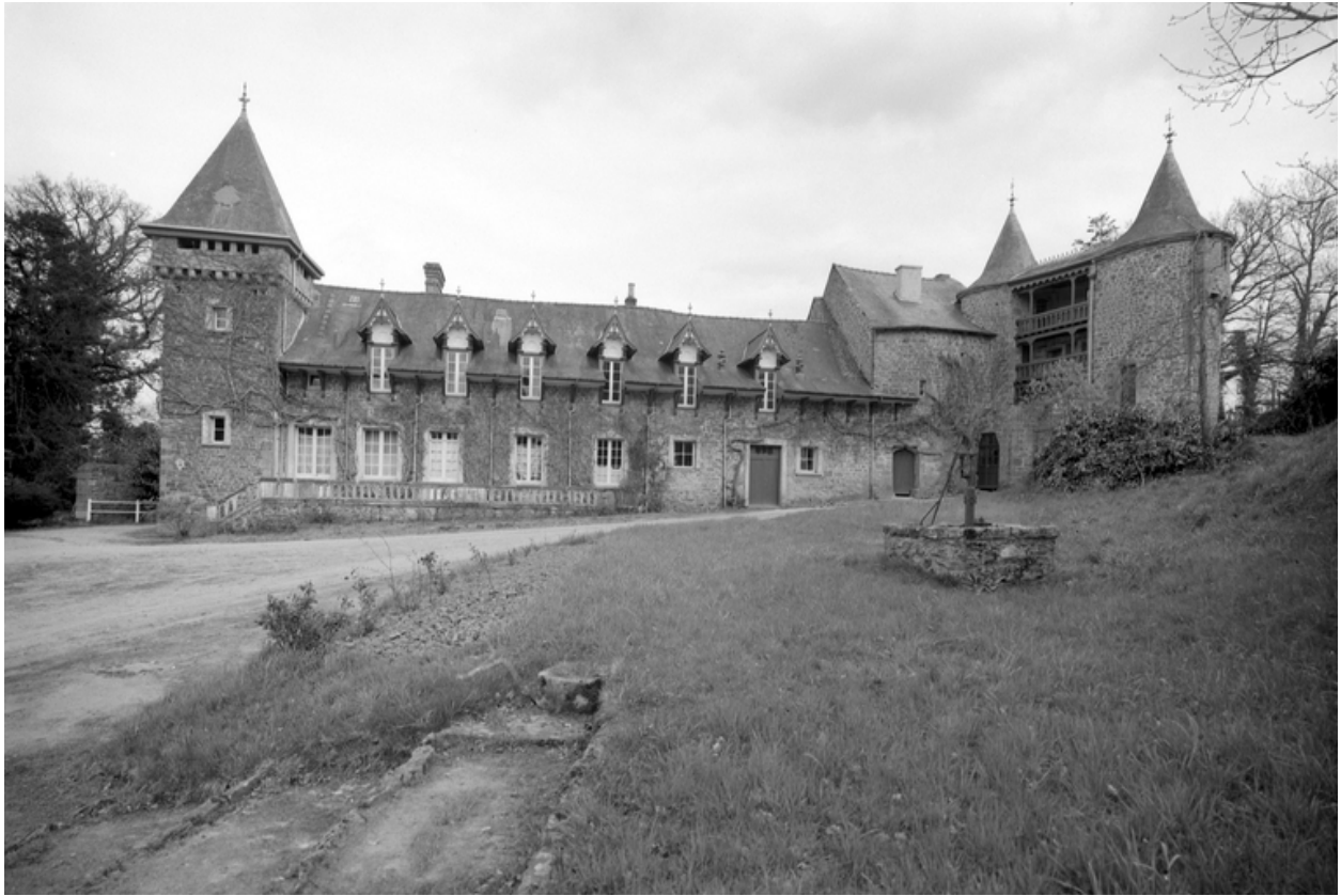
Communs, façade ouest, enquête de 1969