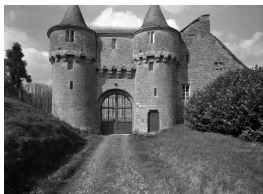
Châtelet d'entrée, vue générale sud, enquête de 1969 IVR53_19692200157V