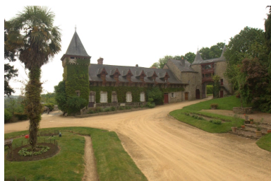
Communs et châtelet d'entrée IVR53_20102202792NUCA