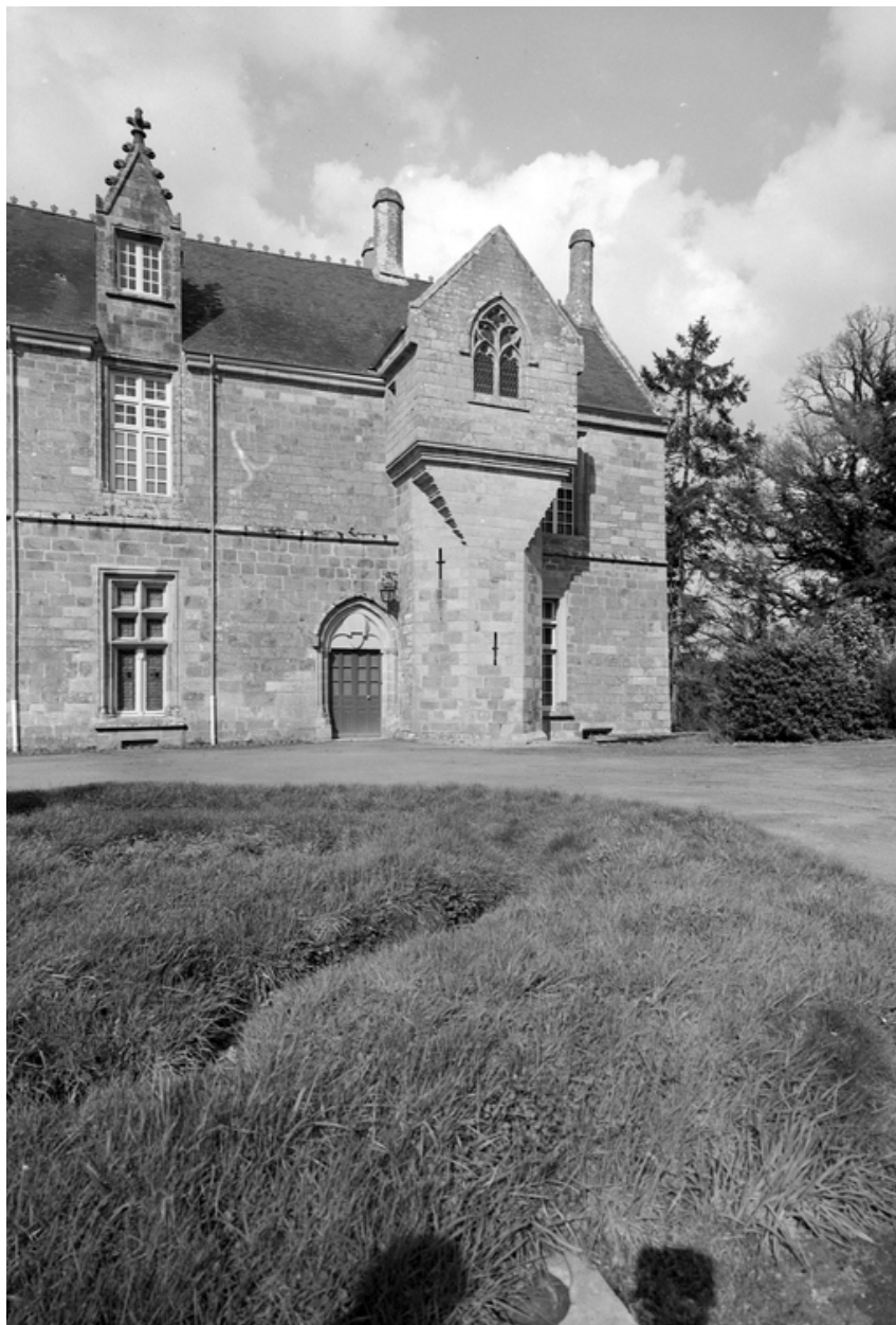
Façade sud, détail, enquête de 1969