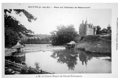
Vue de situation IVR53_20042209058NUCB