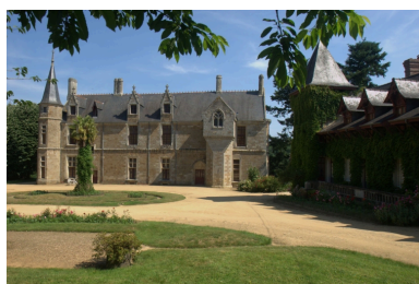
Château IVR53_20102203027NUCA