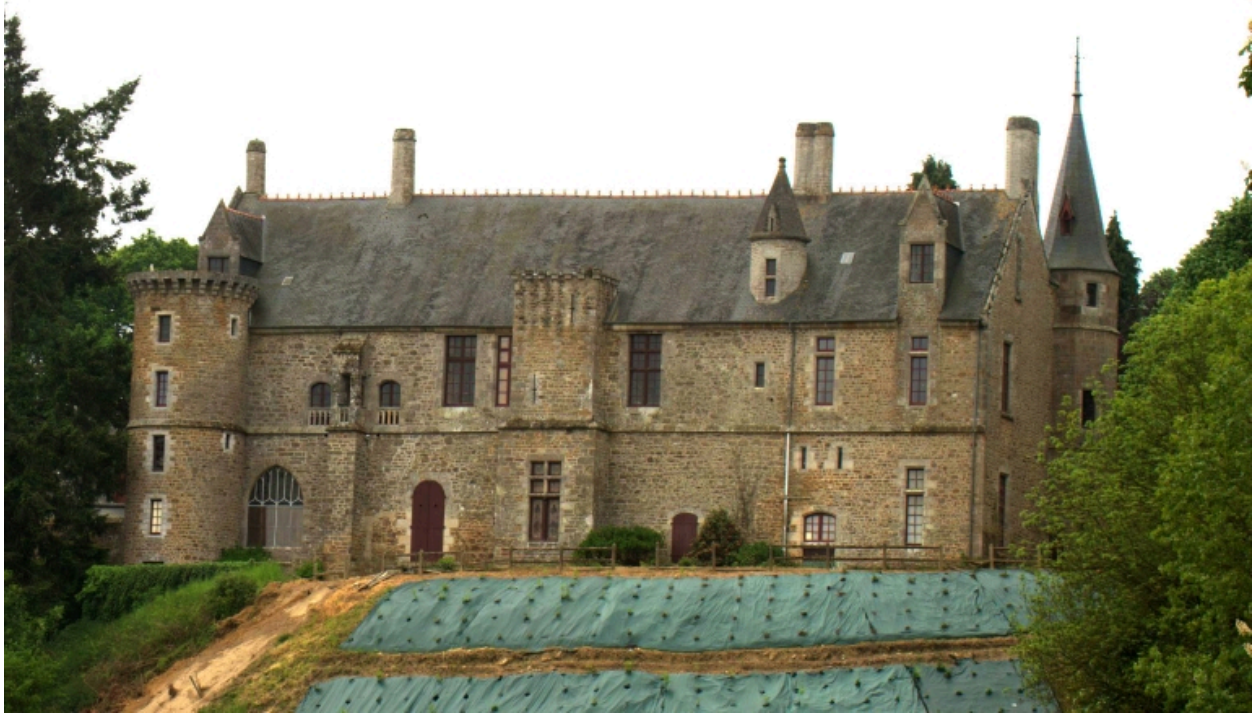
Château, vue générale sur la Rance