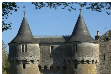
Châtelet d'entrée, détail IVR53_20102202733NUCA