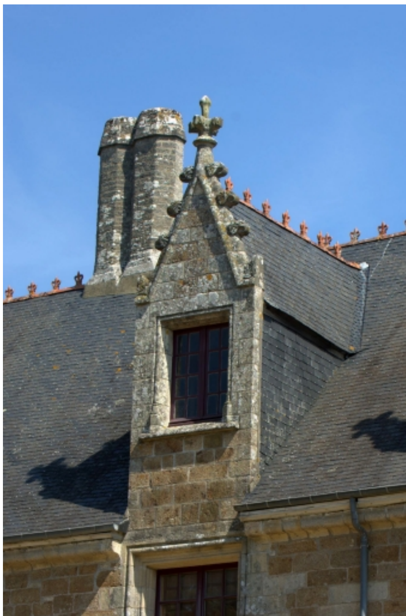
Château, détail, lucarne