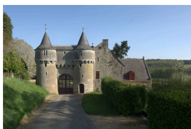
Châtelet d'entrée IVR53_20102202730NUCA