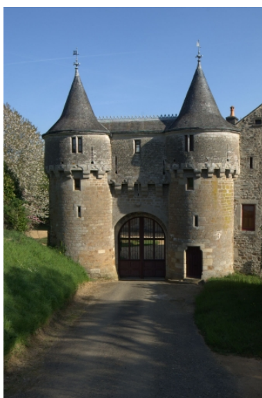
Châtelet d'entrée IVR53_20102202731NUCA