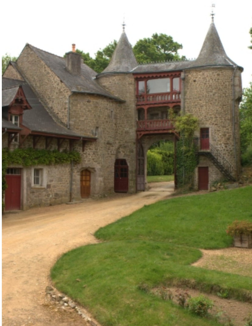
Châtelet d'entrée, vue arrière