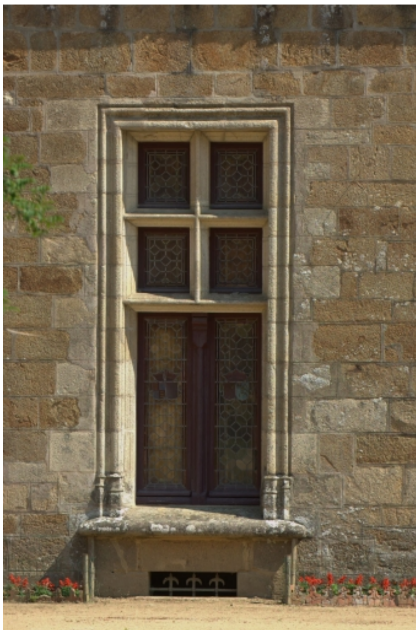
Château, détail, baie