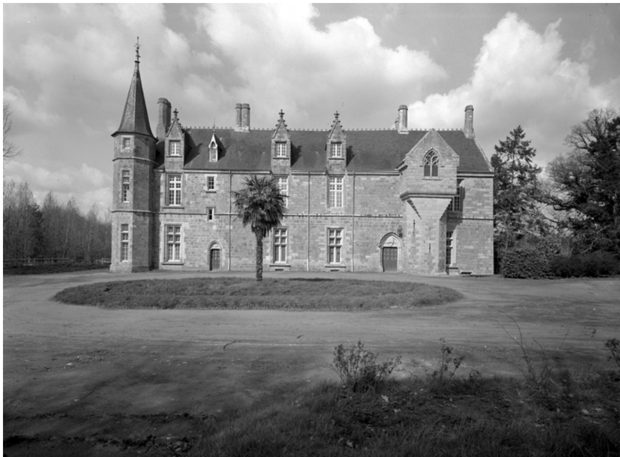
Vue générale du château, enquête de 1969