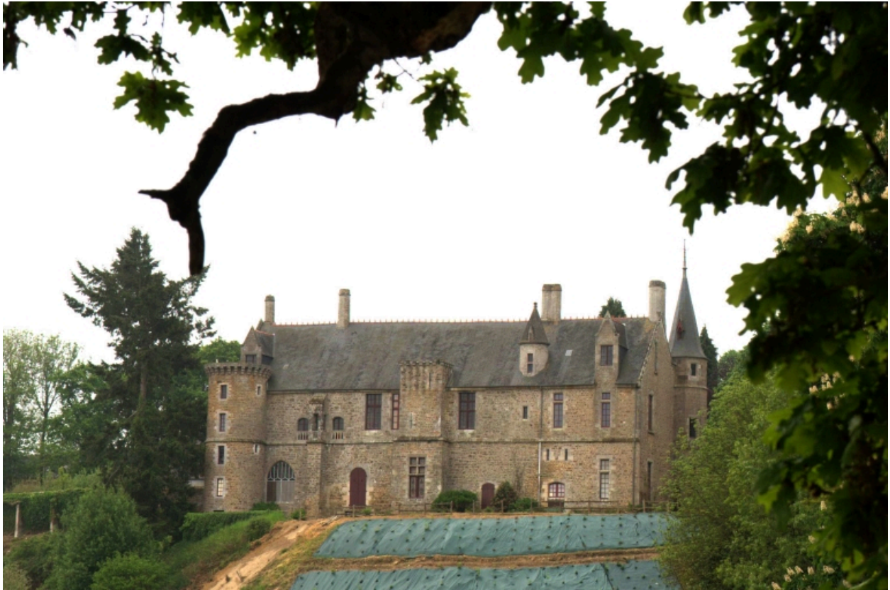
Château, vue générale de la façade donnant sur la Rance