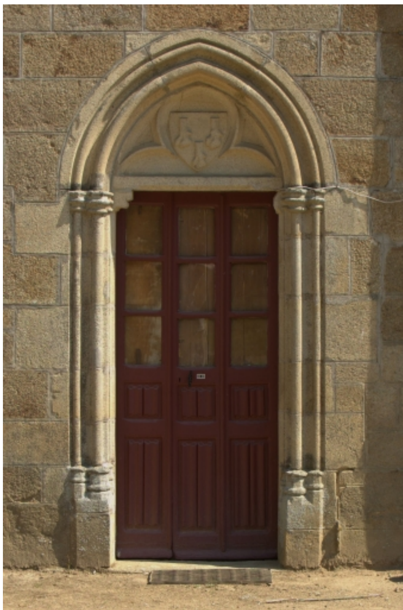
Château, détail, porte