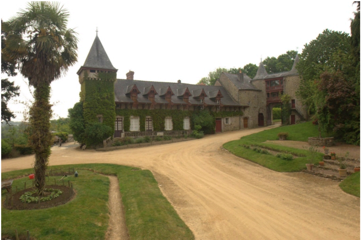
Communs et châtelet d'entrée