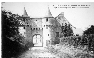
Vue du châtelet d'entrée