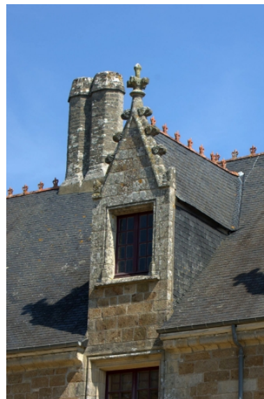
Château, détail, lucarne IVR53_20102203036NUCA