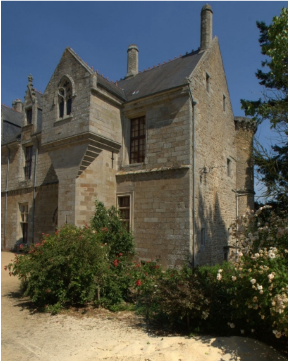
Château, vue partielle, pignon