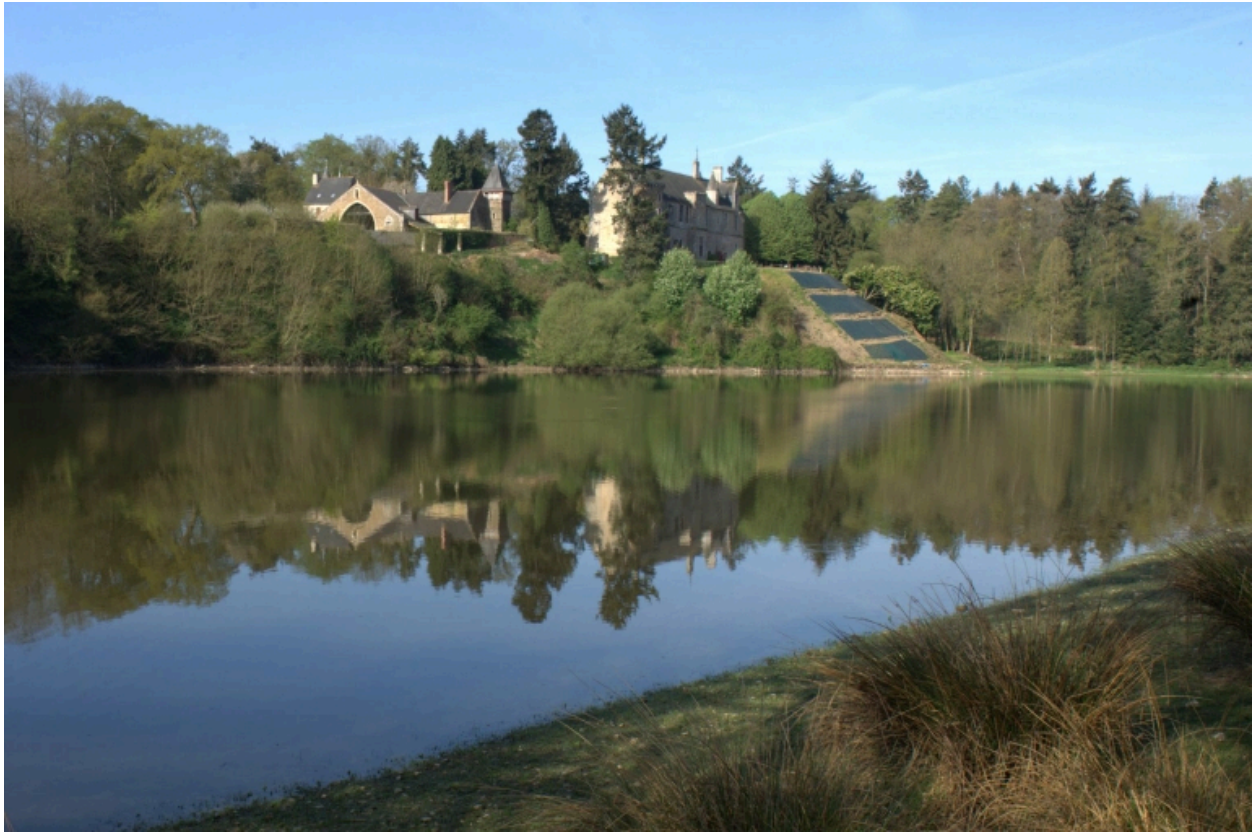
Vue du site, château et communs