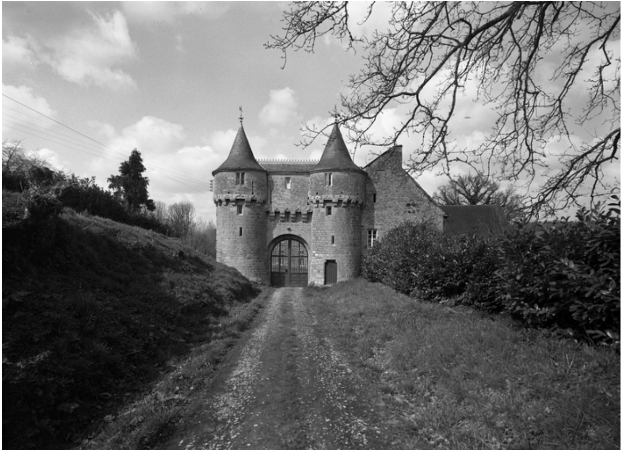
Châtelet d'entrée, vue générale sud, enquête de 1969