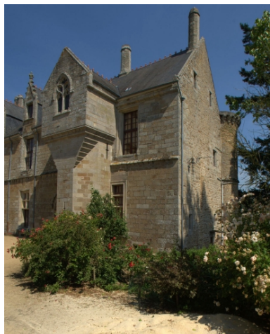
Château, vue partielle, pignon IVR53_20102203040NUCA