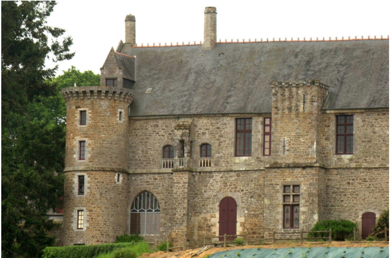
Château, façade donnant sur la Rance, détail