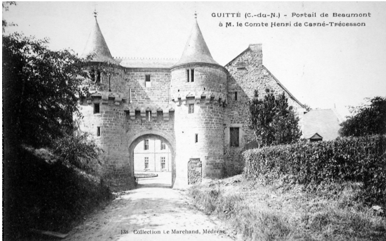
Vue du châteleet d'entrée