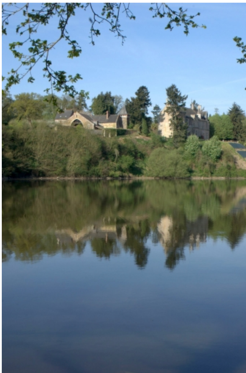
Vue du site, château et communs