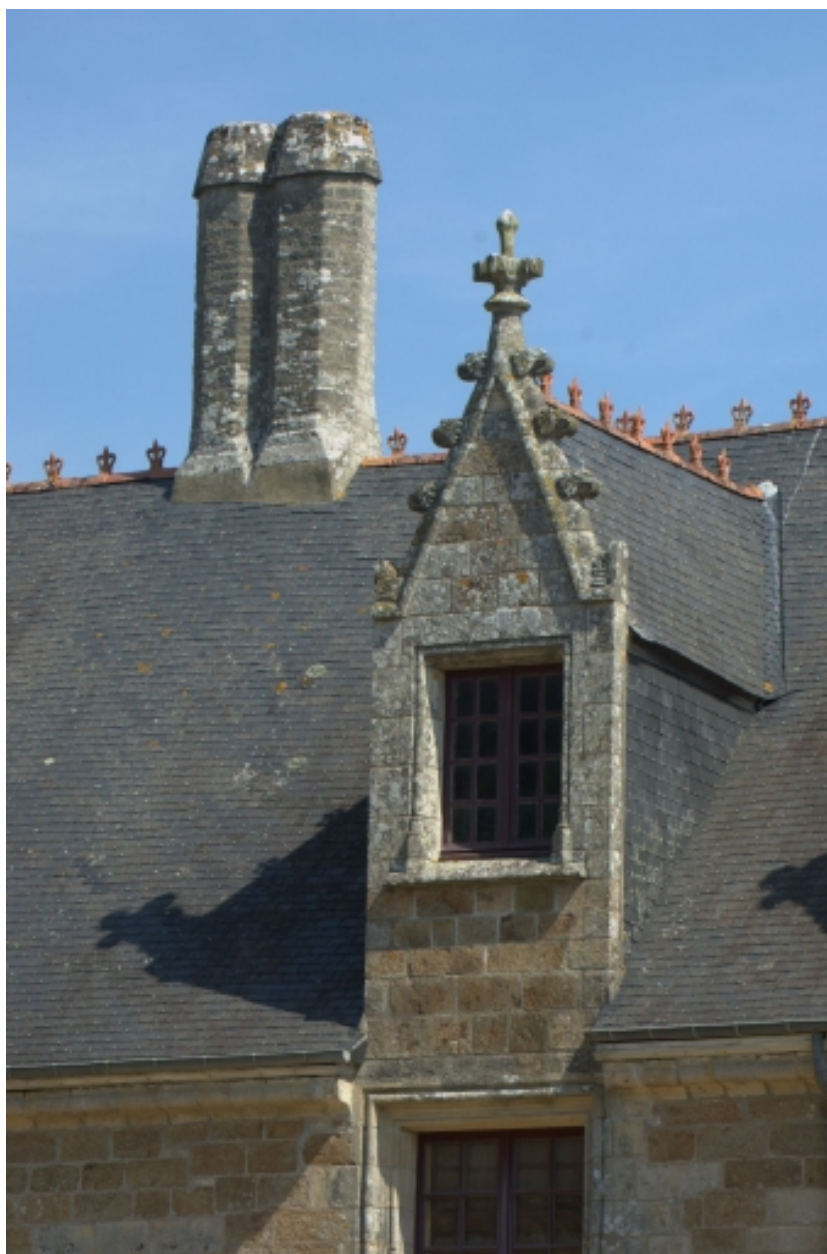
Château, détail, lucarne