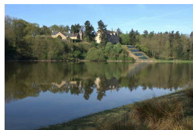
Vue du site, château et commons IVR53_20102202738NUCA