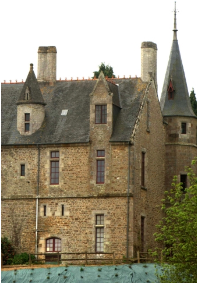
Château, façade donnant sur la Rance, détail