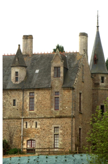
Château, façade donnant sur la Rance, détail IVR53_20102202786NUCA