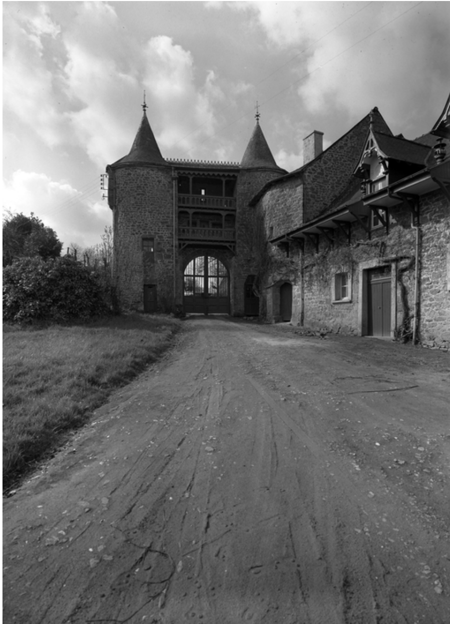
Châtelet d'entrée, façade nord, enquête de 1969