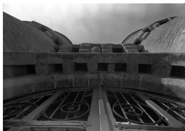
Châtelet, façade sud, détail, enquête de 1969