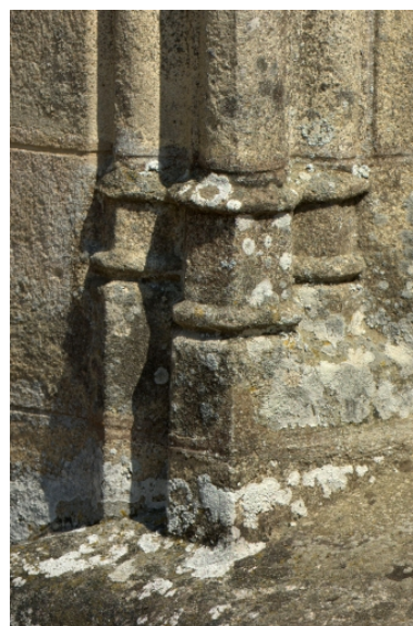
Château, détail, mouluration de la porte IVR53_20102203035NUCA