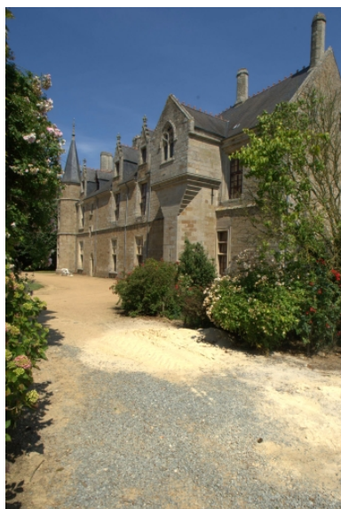
Château, vue générale