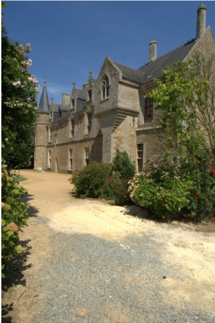
Château, vue générale