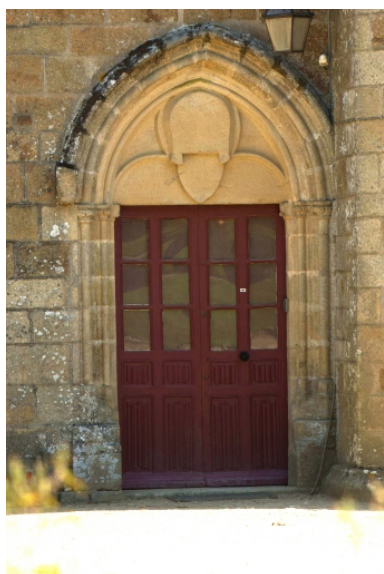
Château, détail, porte IVR53_20102203030NUCA