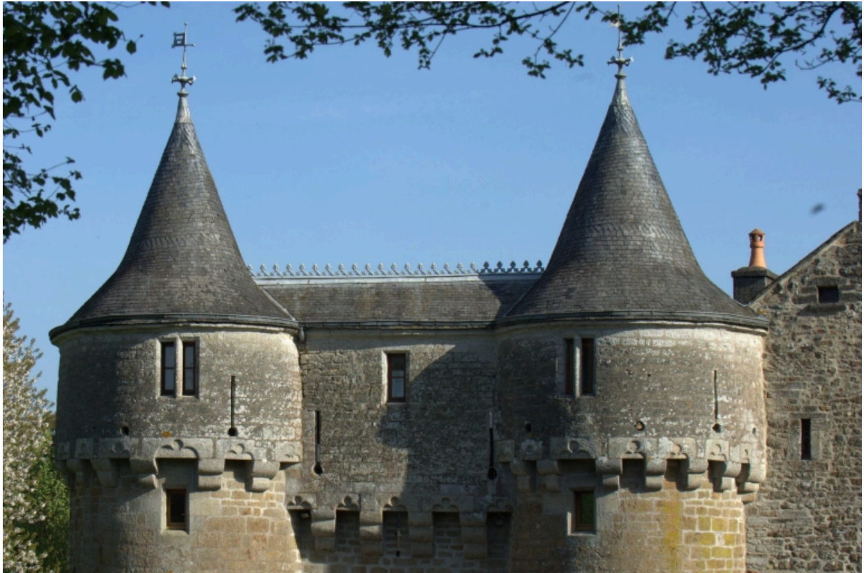
Châtelet d'entrée, détail