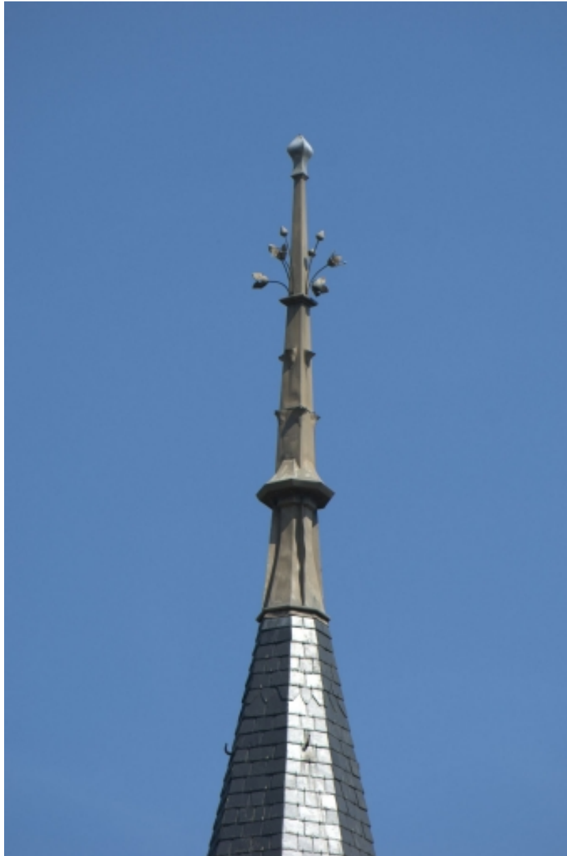
Château, détail, épi de faitage