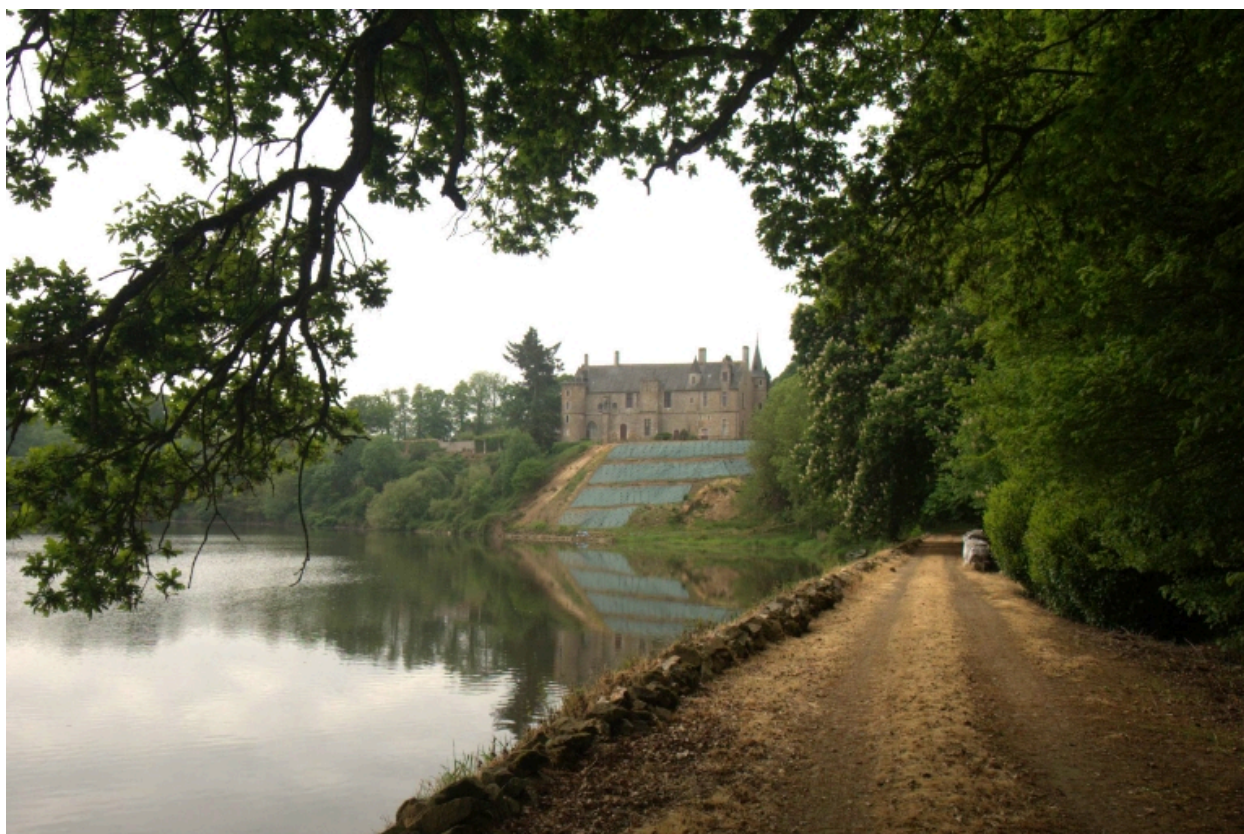
Château, vue sur la Rance