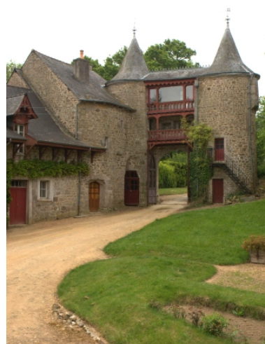
Châtelet d'entrée, vue arrière IVR53_20102202790NUCA