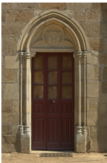
Château, détail, porte IVR53_20102203033NUCA