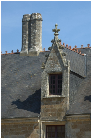
Château, détail, lucarne IVR53_20102203028NUCA