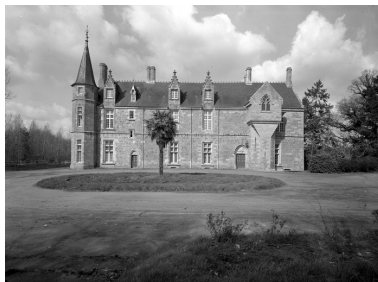
Vue générale du château, enquête de 1969