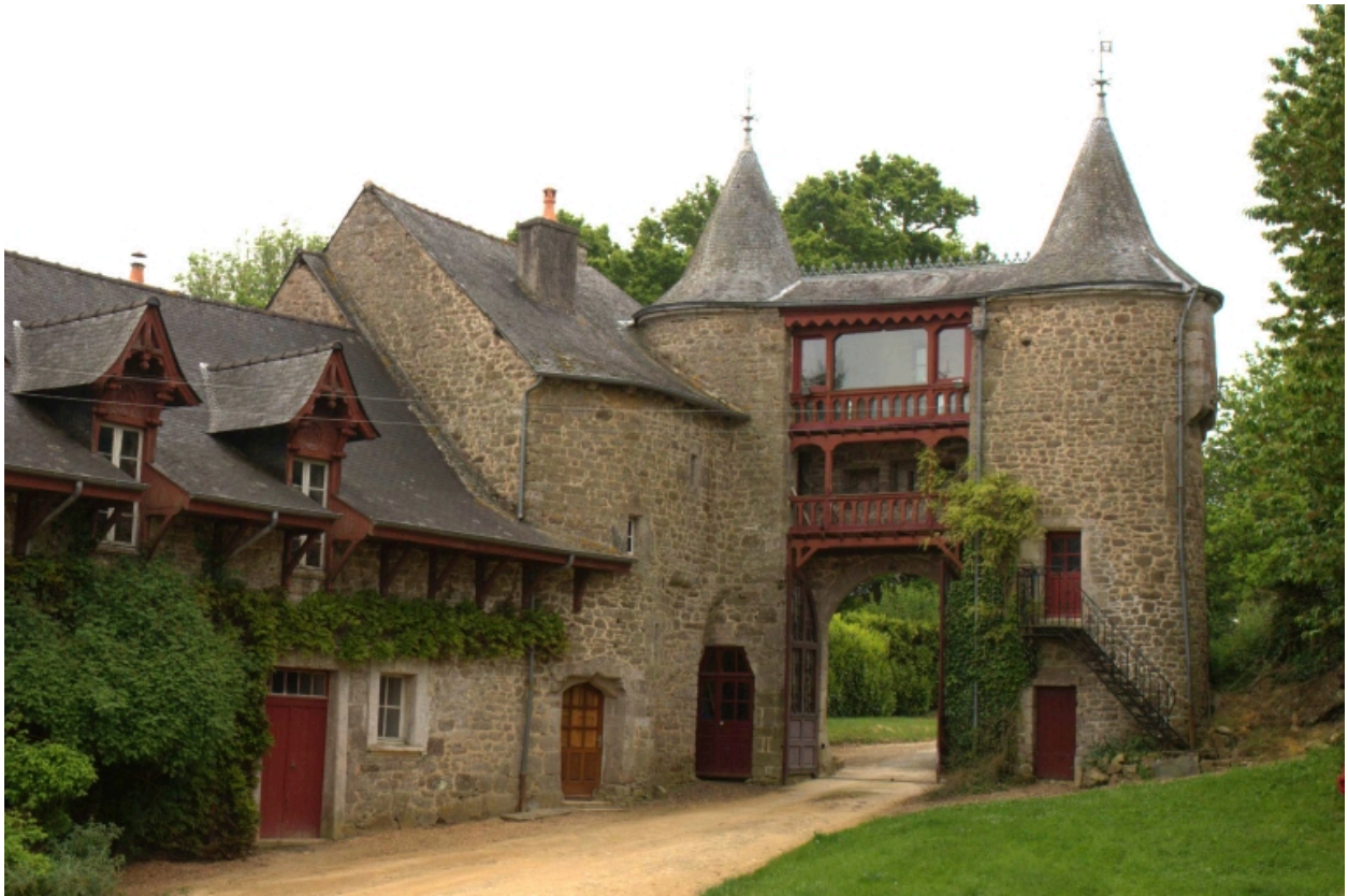
Châtelet d'entrée, vue arrière