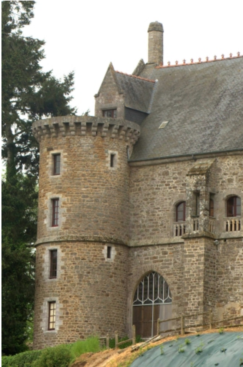
Château, façade donnant sur la Rance, détail