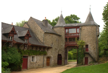
Châtelet d'entrée, vue arrière