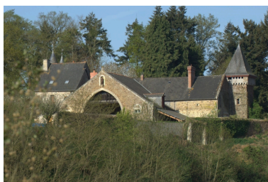
Communs IVR53_20102202736NUCA