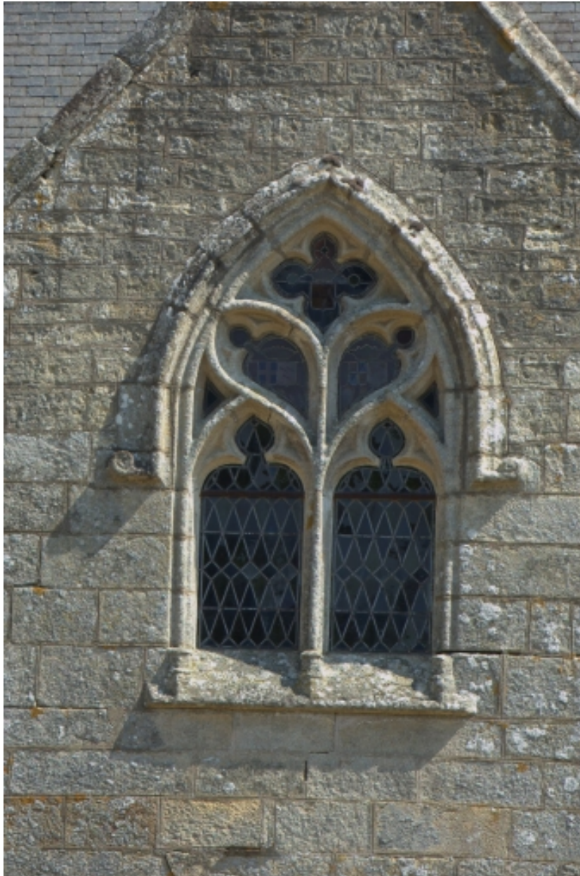
Château, détail, baie de la chapelle