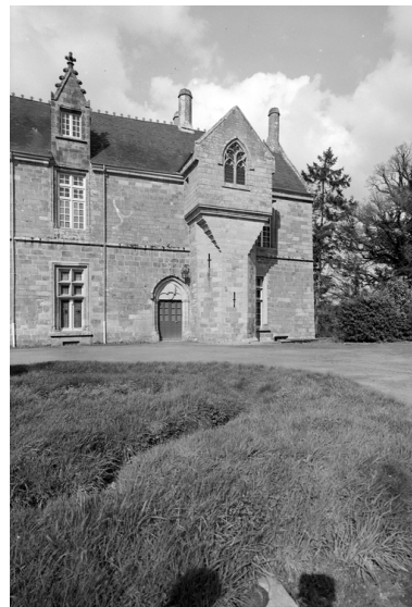
Façade sud, détail, enquête de 1969 IVR53_19692200162V