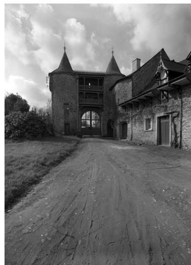
Châtelet d'entrée, façade nord, enquête de 1969 IVR53_19692200160V