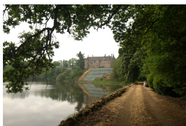
Château, vue sur la Rance IVR53_20102202783NUCA