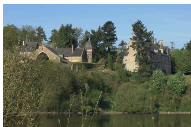
Logis et commons IVR53_20102202735NUCA