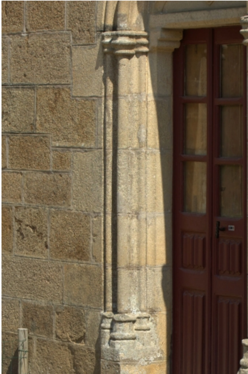
Château, détail, mouluration de la porte