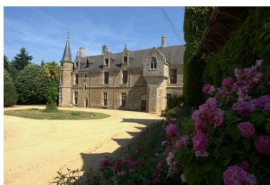
Château, vue générale IVR53_20102203039NUCA