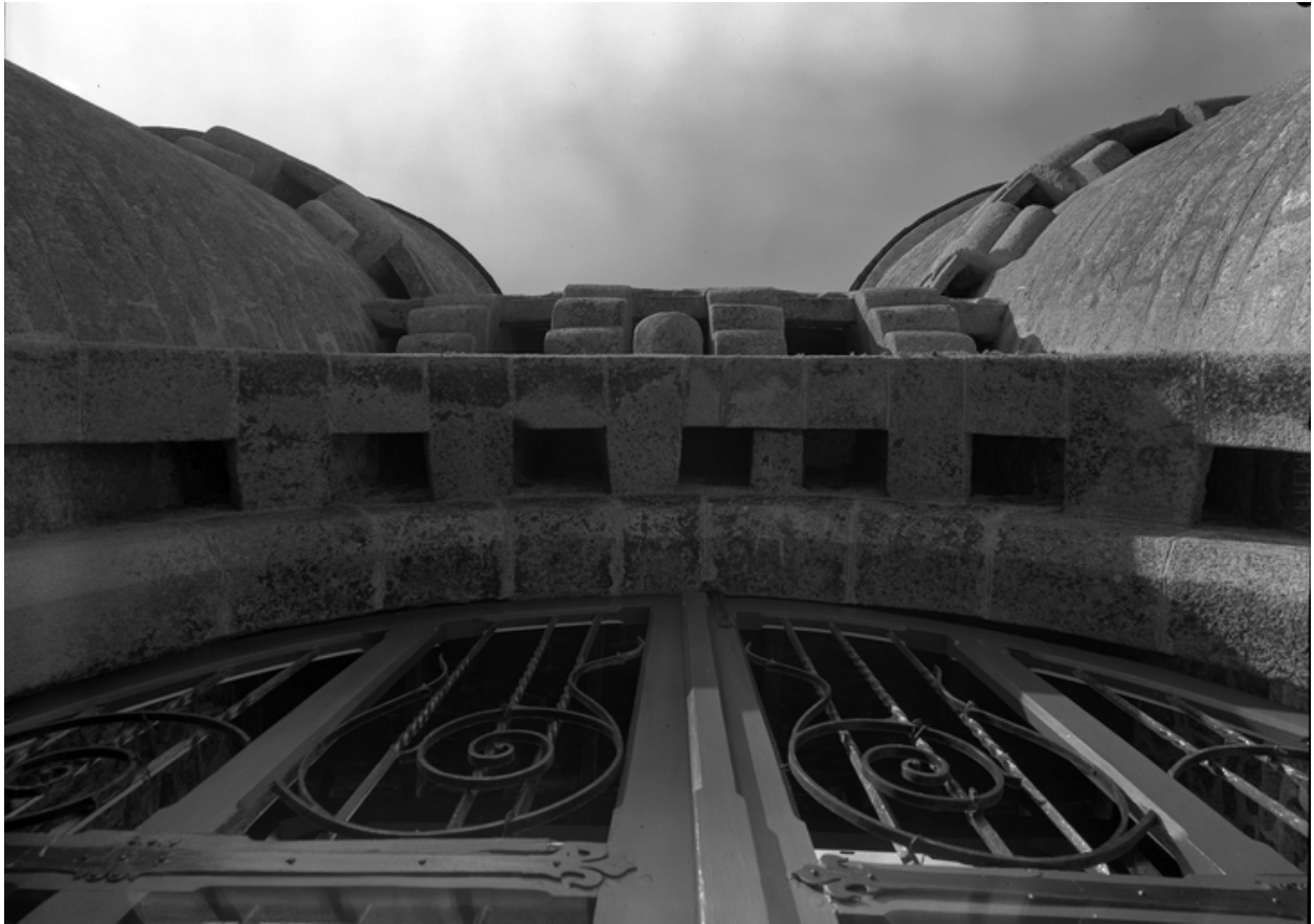
Châtelet, façade sud, détail, enquête de 1969