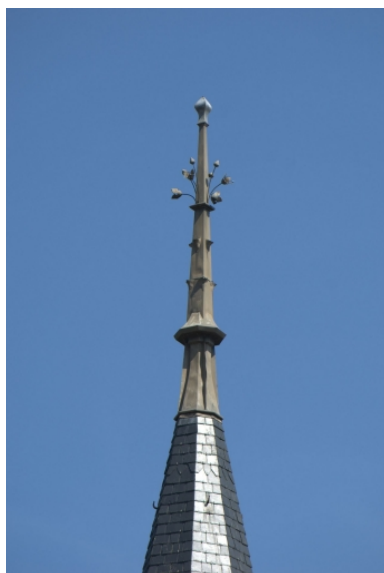
Château, détail, épi de faitage IVR53_20102203031NUCA