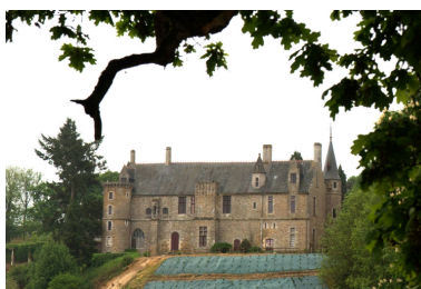
Château, vue générale de la façade donnant sur la Rance IVR53_20102202787NUCA