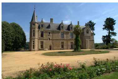
Château, vue générale