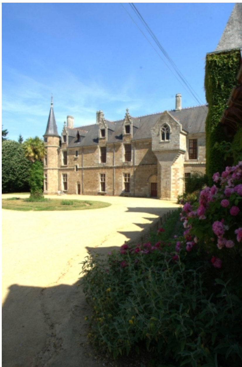
Château, vue générale