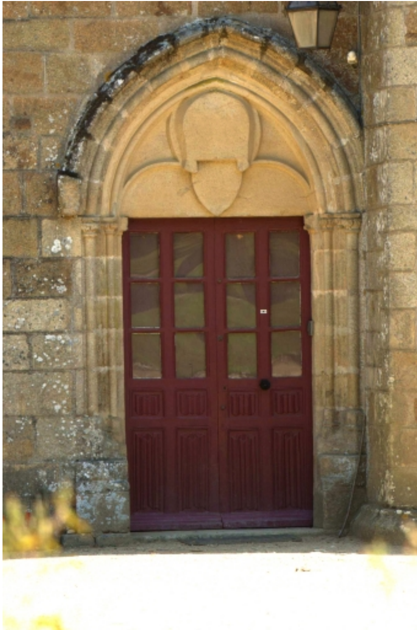
Château, détail, porte