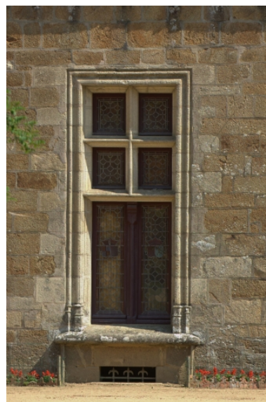
Château, détail, baie IVR53_20102203032NUCA