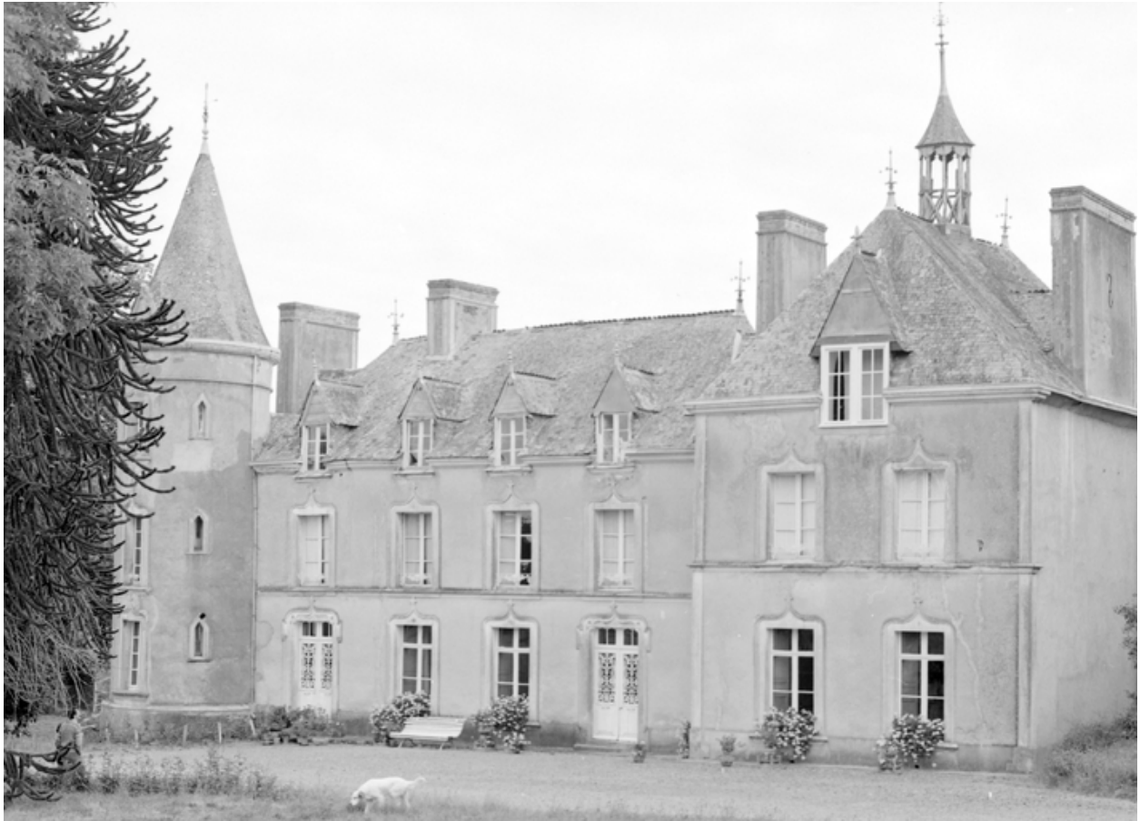
Manoir : élévation ouest (état en 1984)