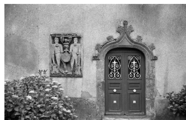
Manoir : blason muet (état en 1984) IVR53_19745606875Z