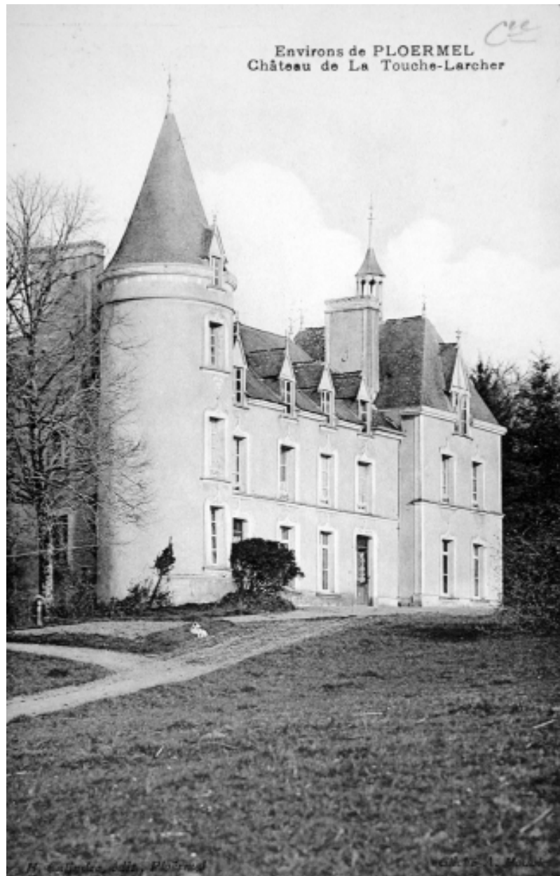
Carte postale, 1er quart 20e siècle (A. D. Ille-et-Vilaine, 6 Fi)