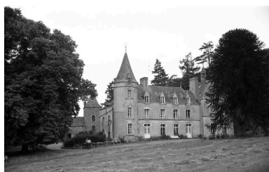
Manoir, dit château de la Touche Larcher