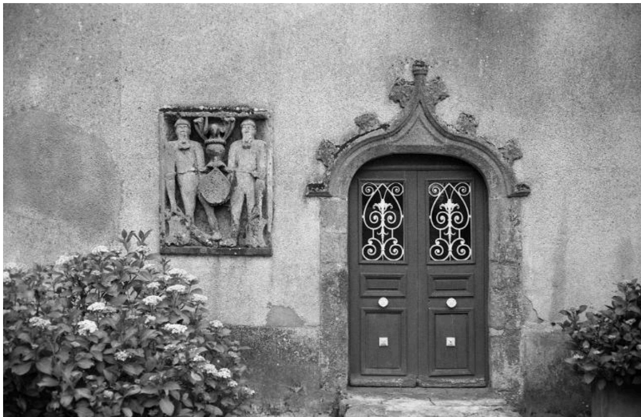
Manoir : blason muet (état en 1984)