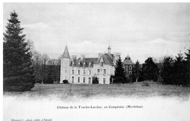
Carte postale, 1er quart 20e siècle