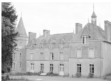
Manoir : élévation ouest (état en 1984)