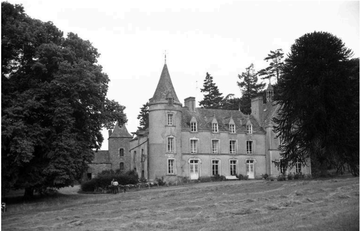
Manoir, dit château de la Touche Larcher