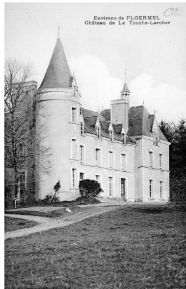
Carte postale, 1er quart 20e siècle IVR53_20035604264NUCB