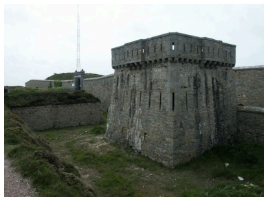
Tourelle et enceinte de la pointe du Toulinguet IVR53_20062908314NUCA