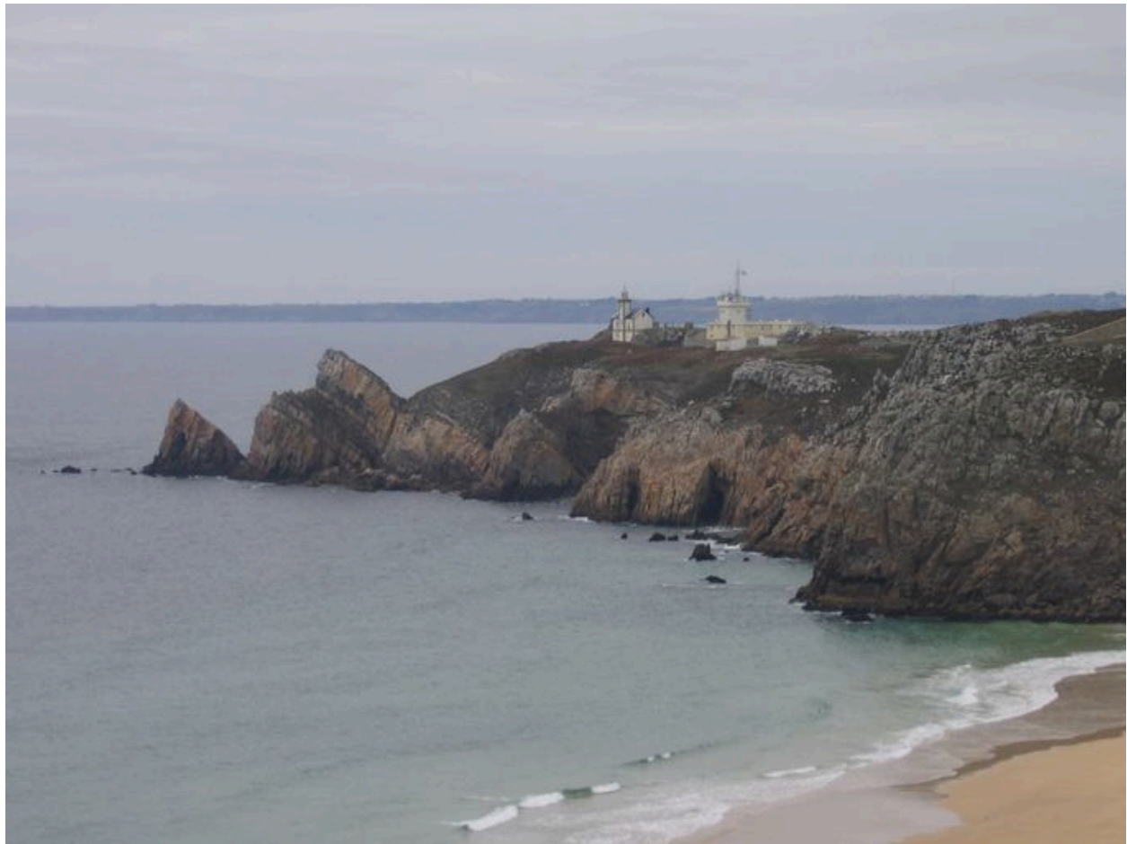
Vue générale : pointe du Toulinguet