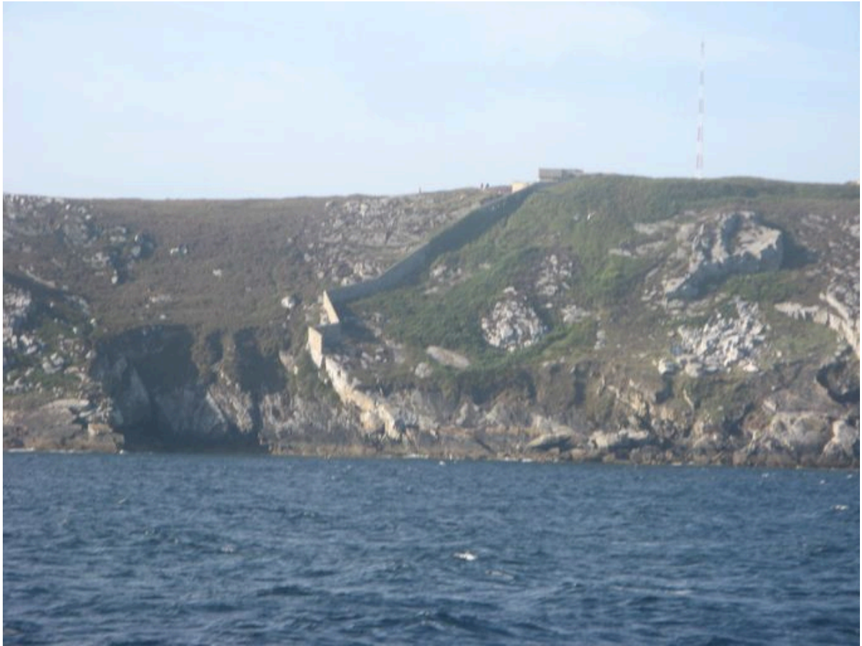
Enceinte de la pointe du Toulinguet