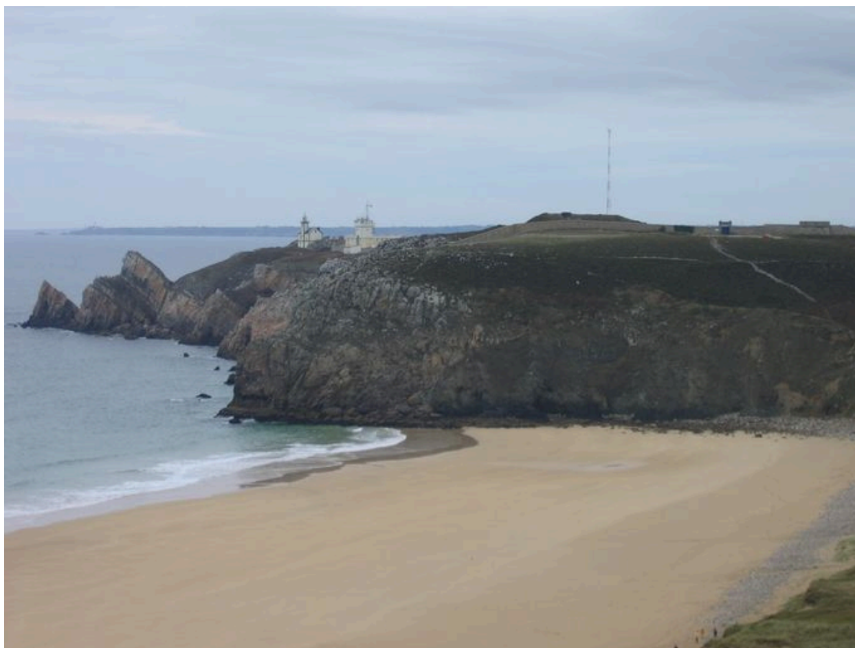
Vue générale : phare, sémaphore et enceinte fortifiée