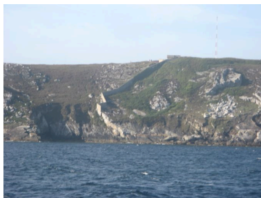
Enceinte de la pointe du Toulinguet