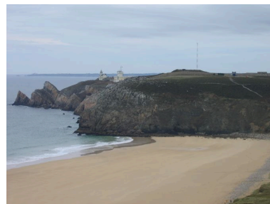
Vue générale : phare, sémaphore et enceinte fortifiée