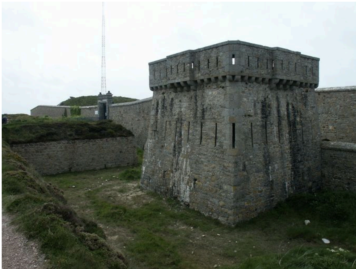
Tourelle et enceinte de la pointe du Toulinguet