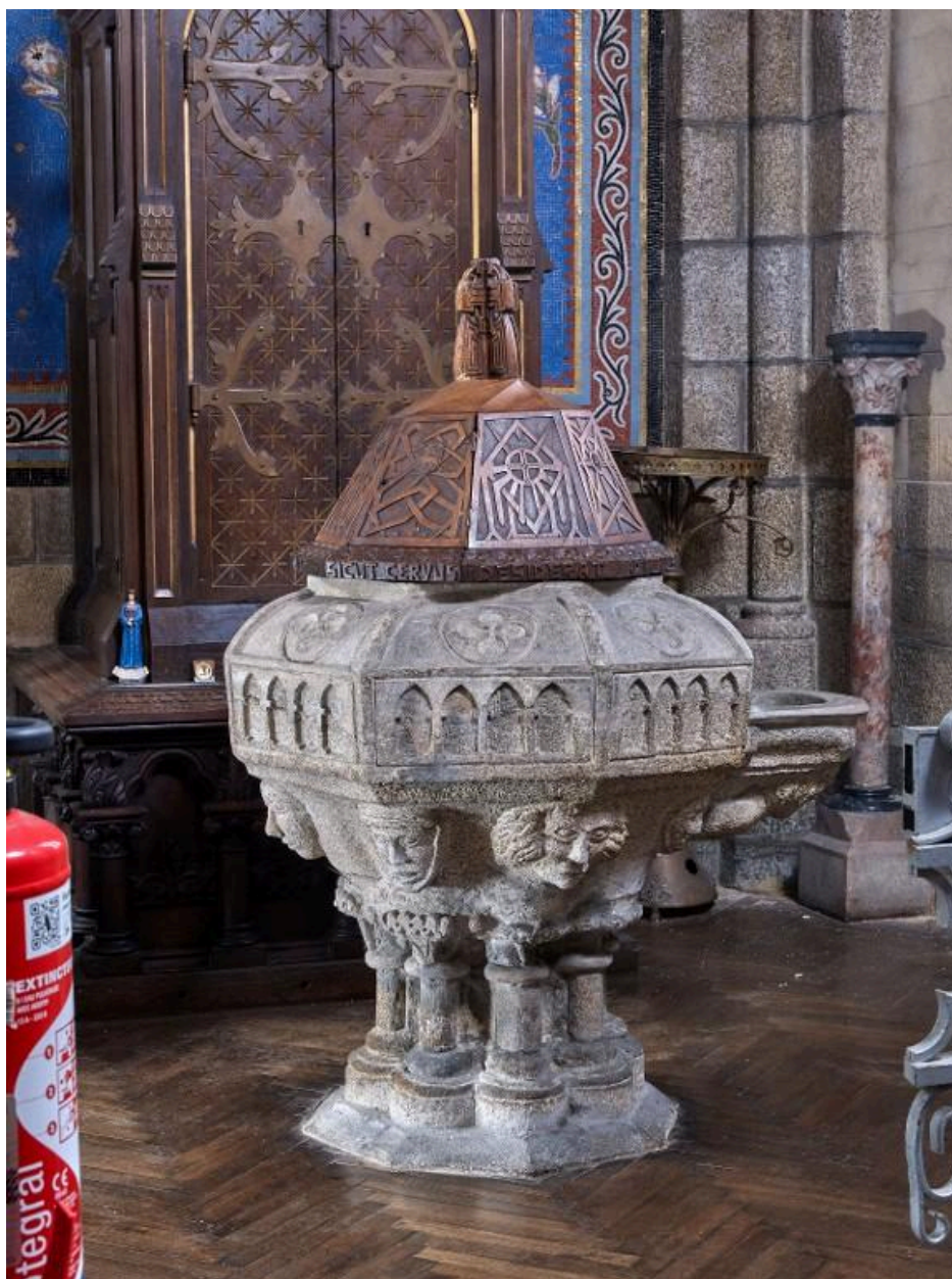
Vue du couvercle posé sur les fonts baptismaux du 14e siècle