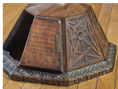
Inscription dédicatoire IVR53_20242200026NUCA