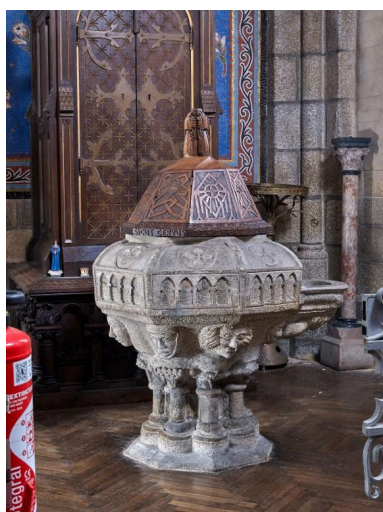
Vue du couvercle posé sur les fonts baptismaux du 14e siècle IVR53_20242200024NUCA