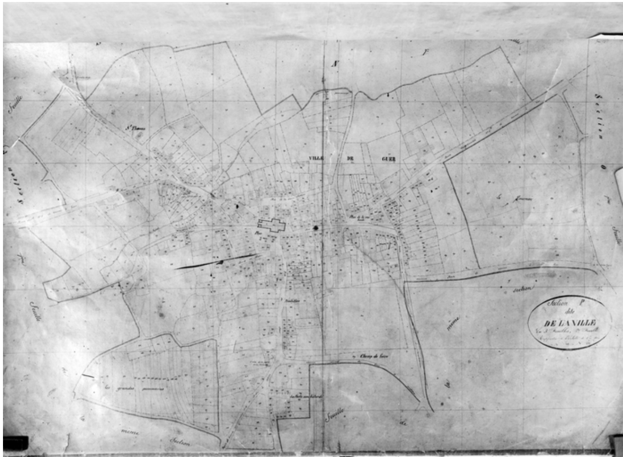
Cadastre de 1847, section P2