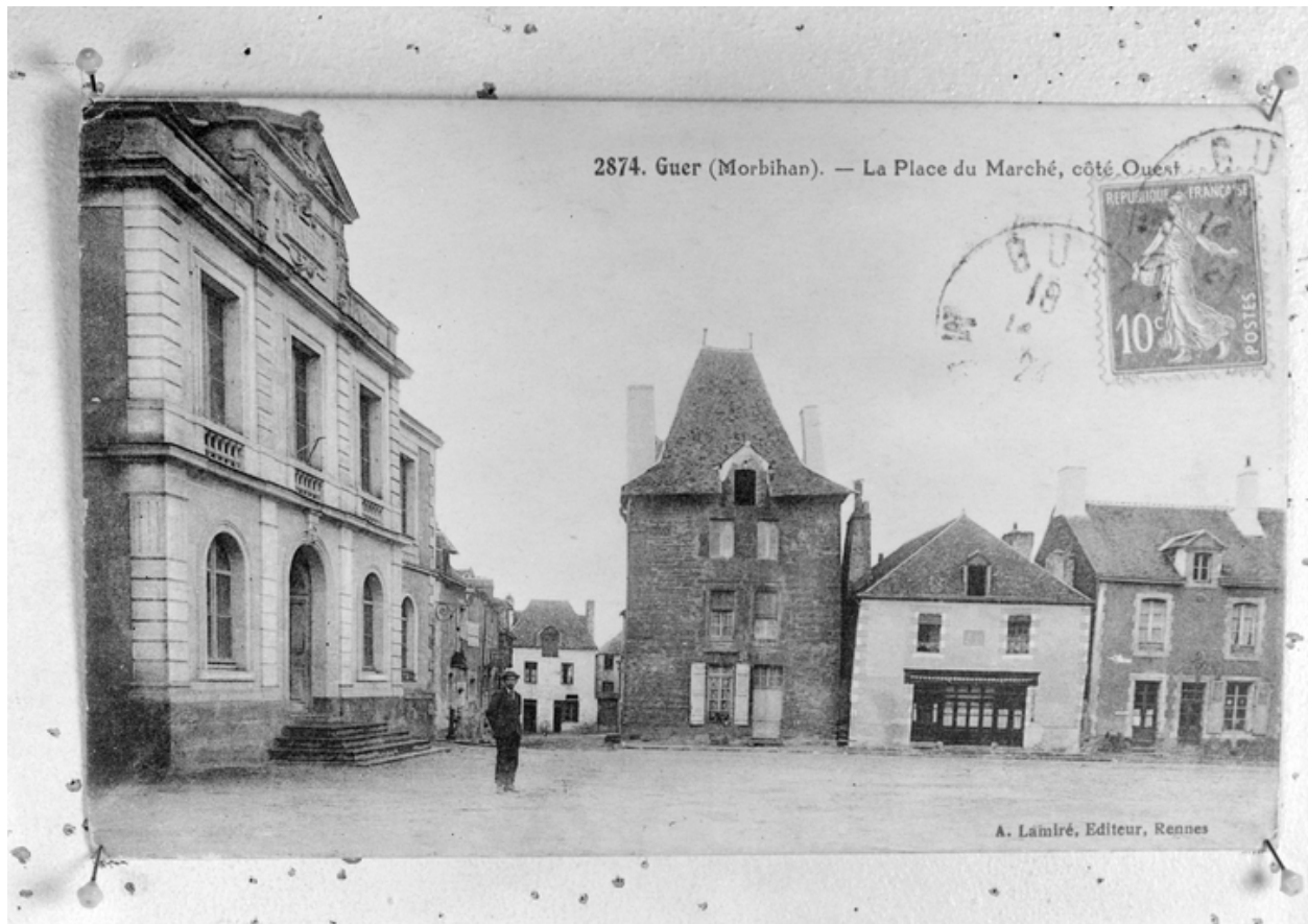
La place du marché, côté ouest