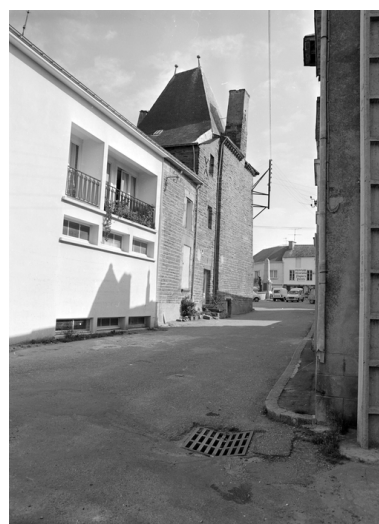
Maison 3 place de la Mairie, vue générale sud-ouest.