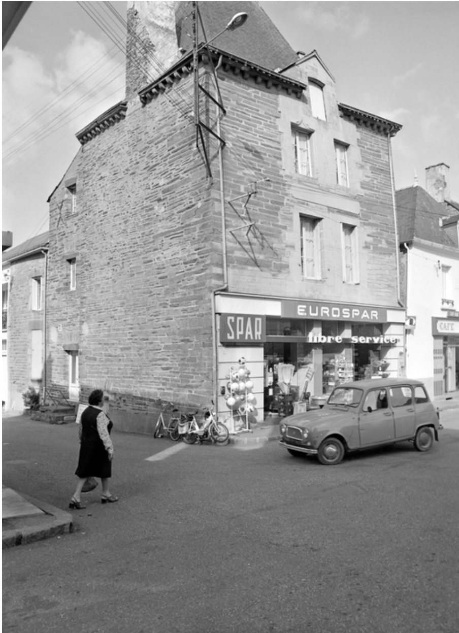
Maison 3 place de la Mairie, vue générale sud-est.