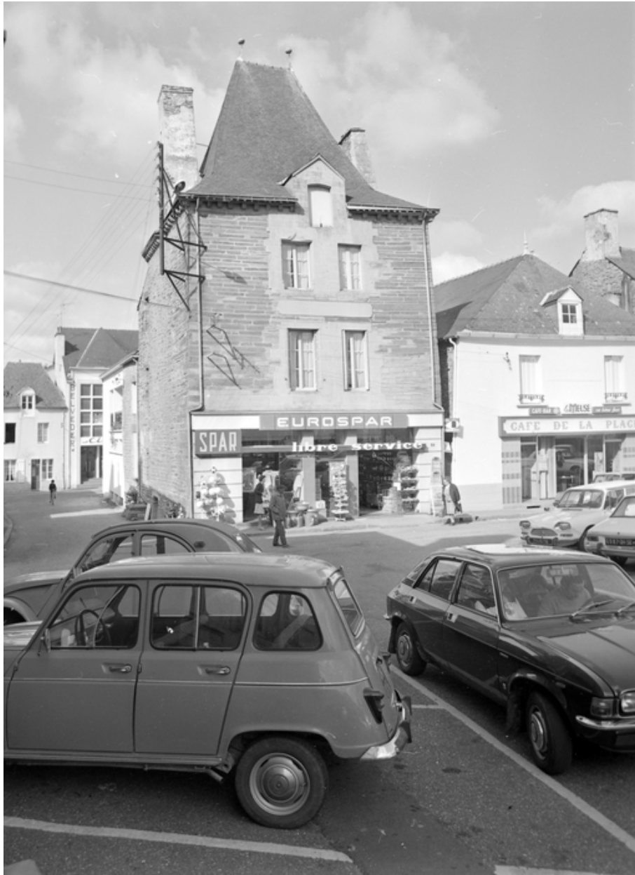
Maison 3 place de la Mairie, élévation antérieure est.