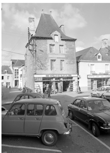
Maison 3 place de la Mairie, élévation antérieure est. IVR53_19775601003X