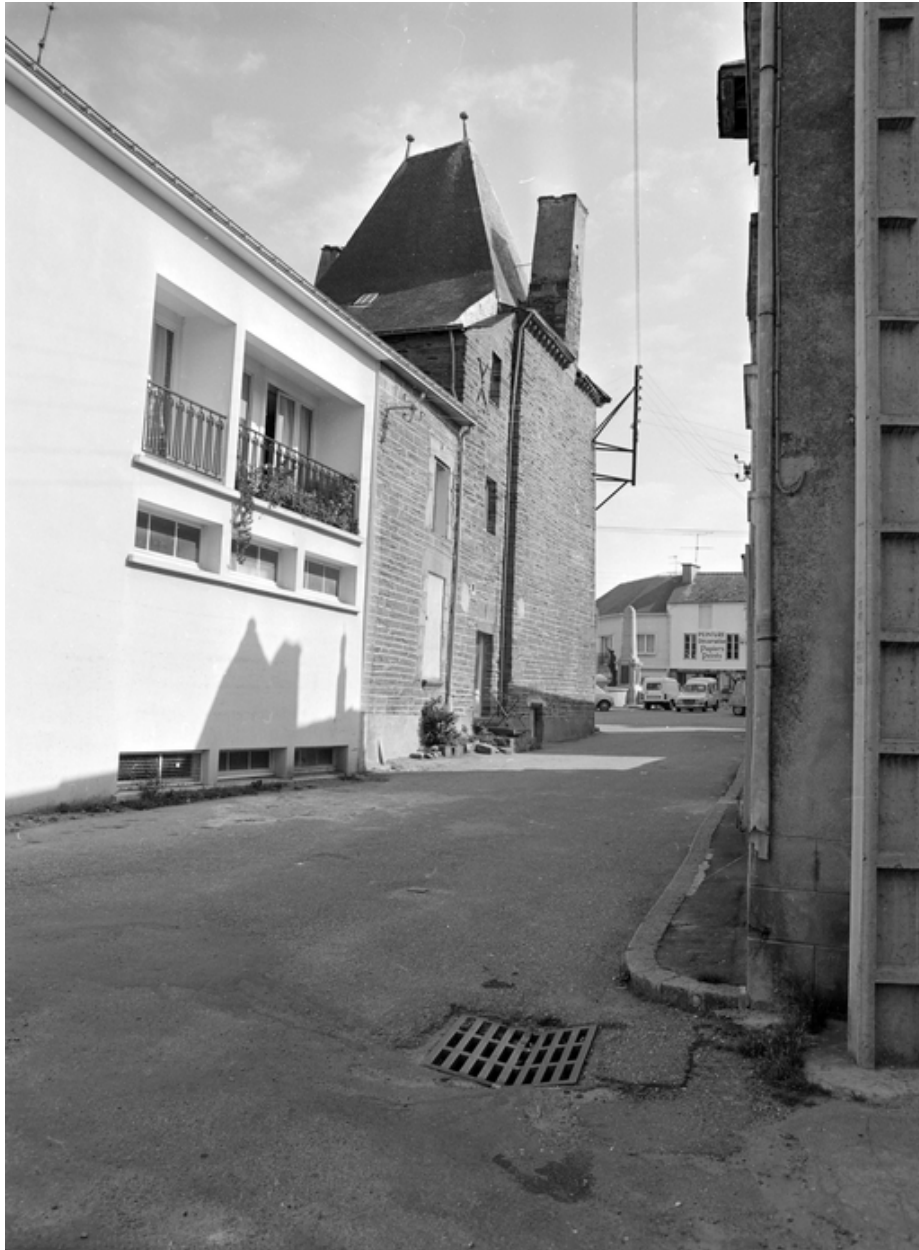
Maison 3 place de la Mairie, vue générale sud-ouest.