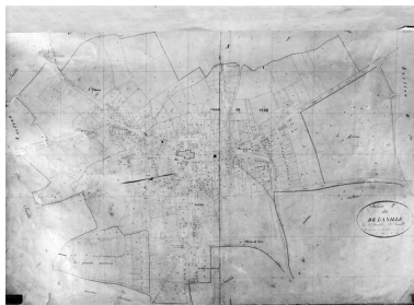
Cadastré de 1847, section P2