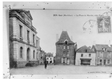
La place du marché, côté ouest IVR53_19775601098VB