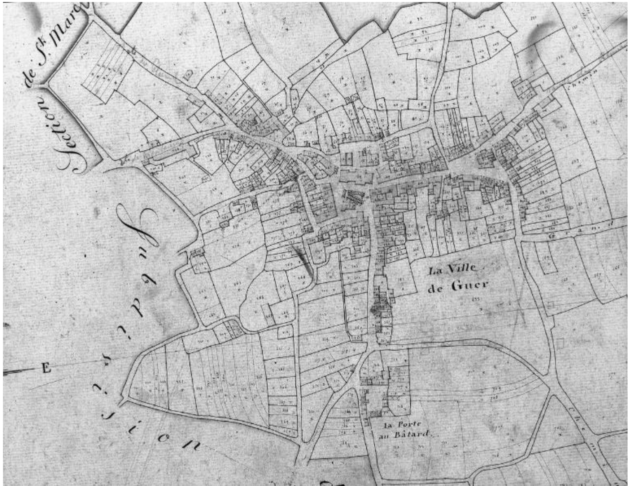
Cadastré de 1813, section Q1