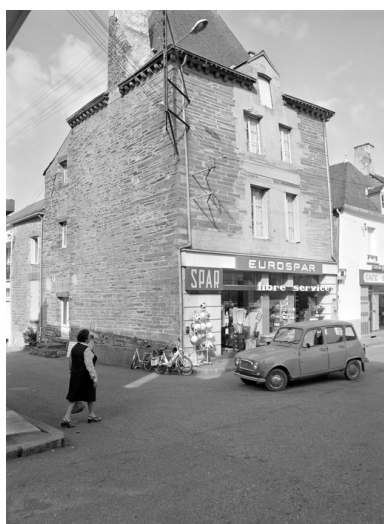
Maison 3 place de la Mairie, vue générale sud-est.