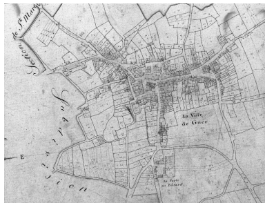
Cadastré de 1813, section Q1 IVR53_19775600427P