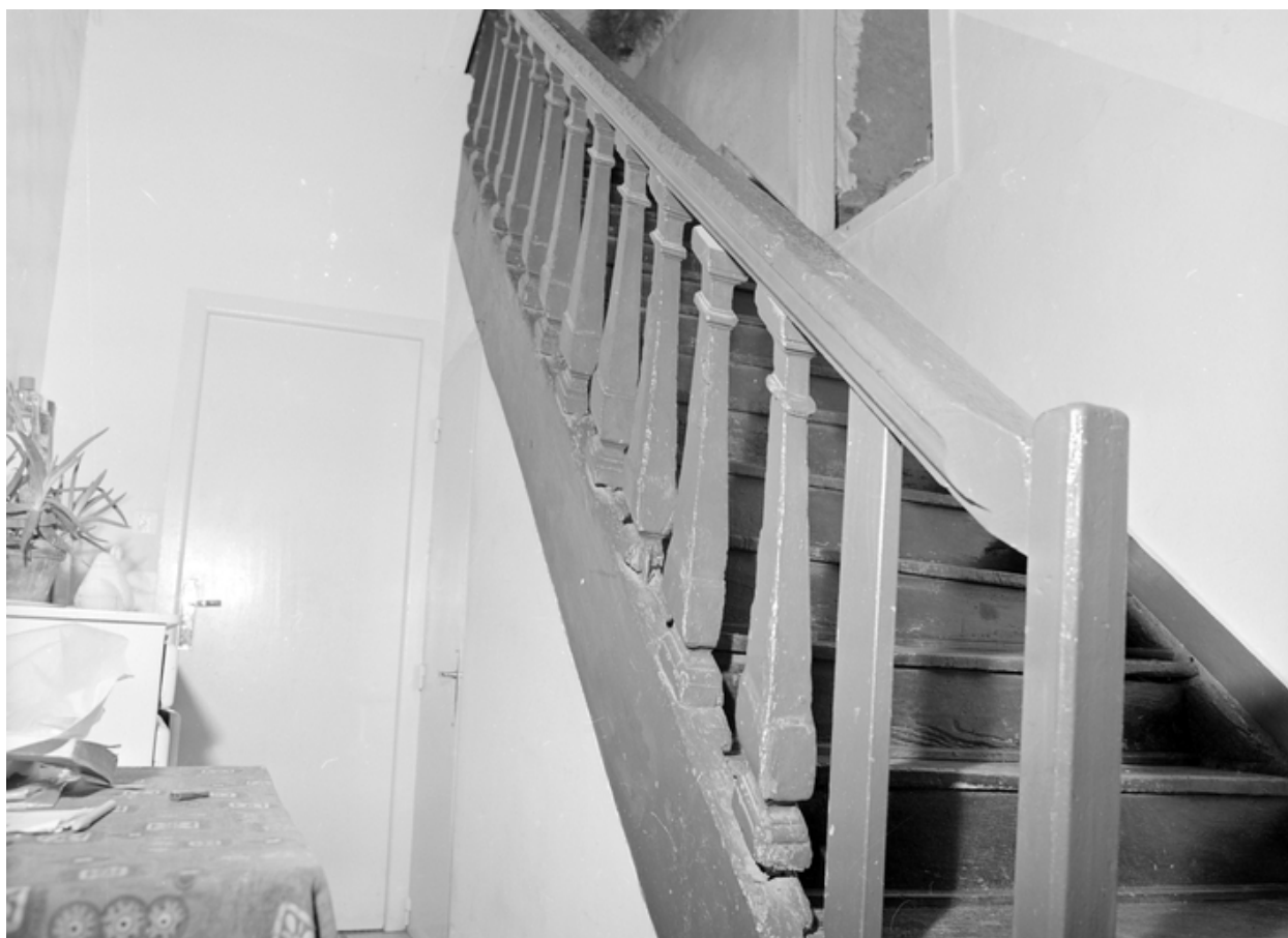
Maison 3 place de la Mairie, escalier entre 1er et 2e étage.