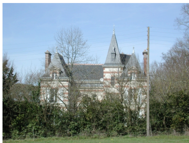
Vue générale Sud IVR53_20043506630NUCA