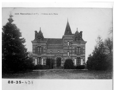
Carte postale ancienne, 1er quart 20e siècle IVR53_19883500431XB