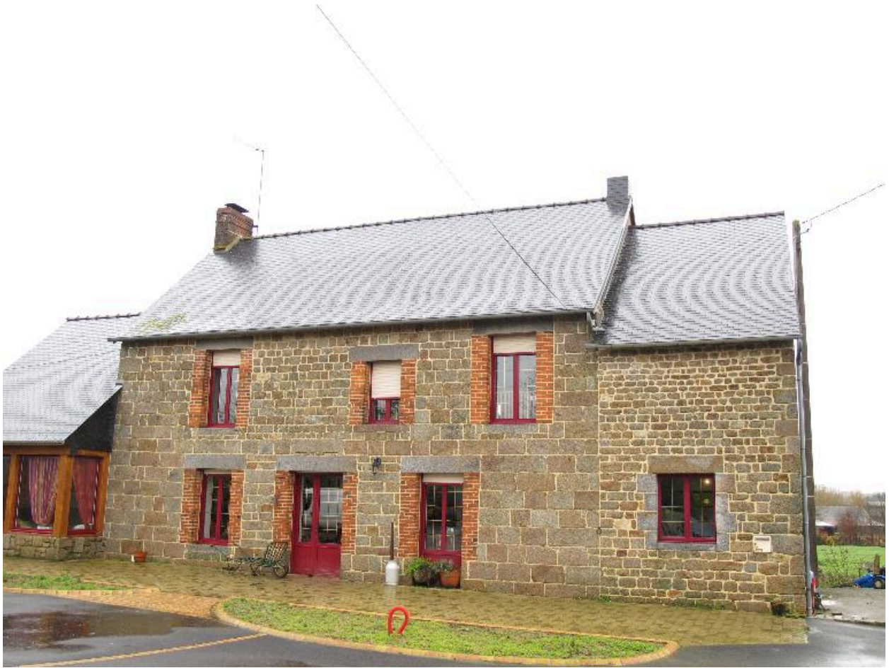
Maison construite avec des pierres de l'ancien château de la Chesnaye