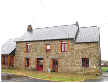
Maison construite avec des pierres de l'ancien château de la Chesnaye