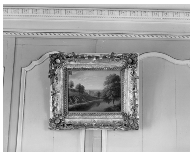
Tableau représentant une vue de situation nord- est avant reconstruction.