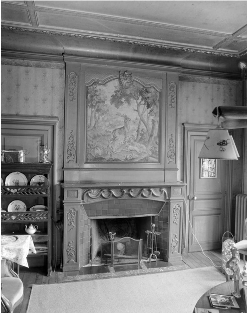
Vue générale de la cheminée de la salle à manger.