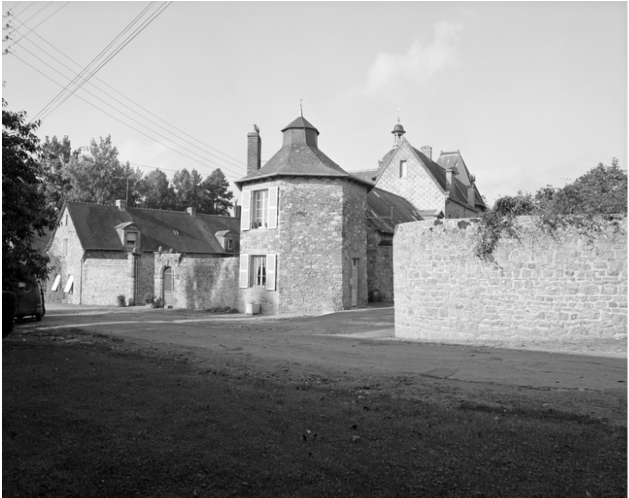
Vue générale sud-est.