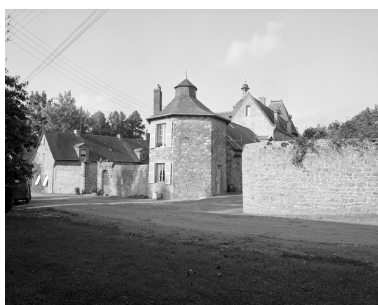
Vue générale sud-est. IVR53_19843501353X