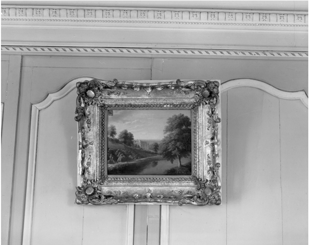
Tableau représentant une vue de situation nord-est avant reconstruction.