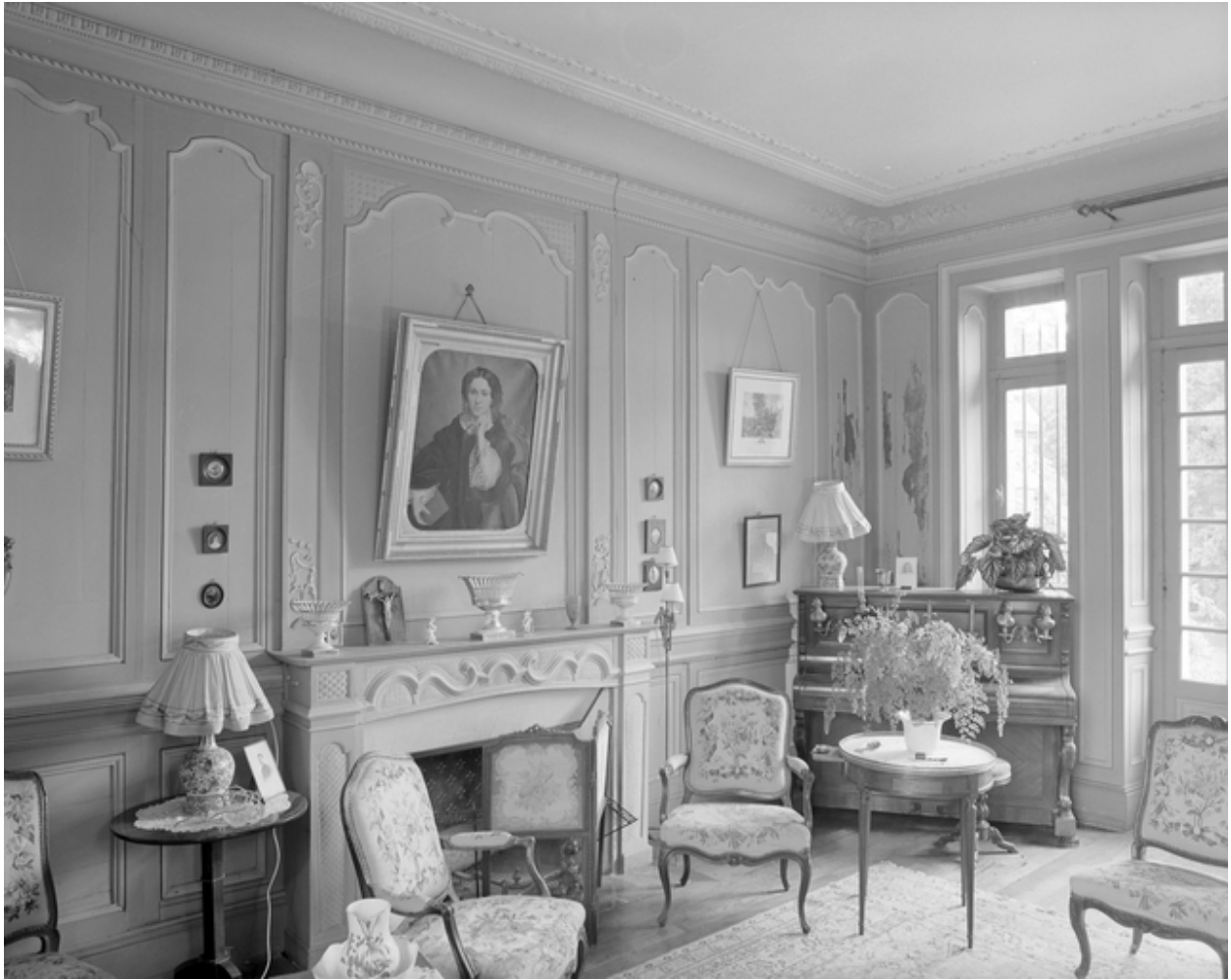
Vue générale du salon.