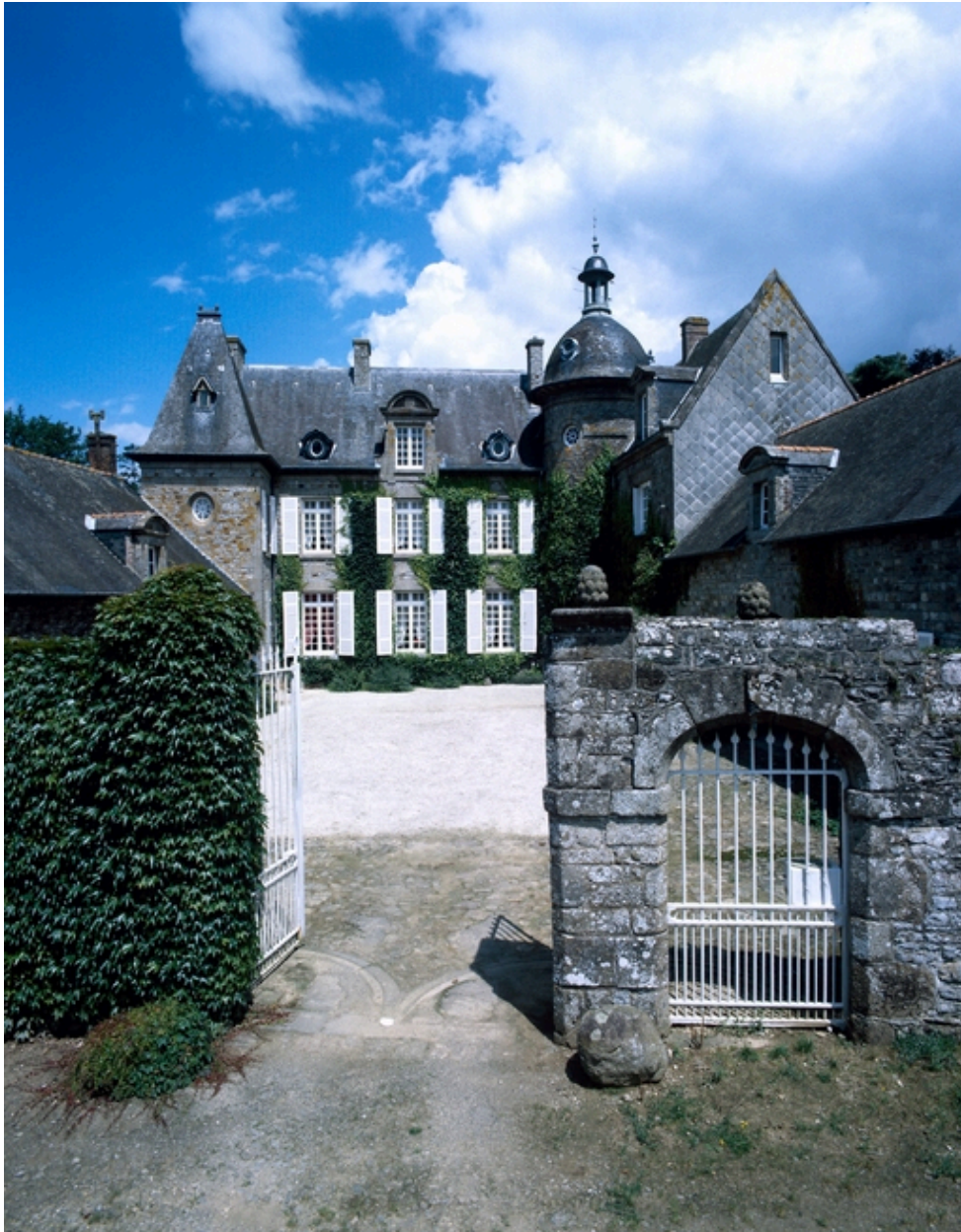
Elévation sud, vue générale sud.