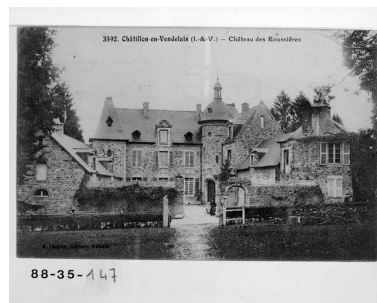
3592 - Châtillon-en-Vendelais (I.-et-V.) - Château des Rouzières. Elévation principale. Carte postale ancienne. IVR53_19883500147X