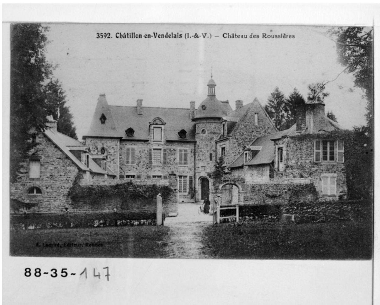
3592 - Châtillon-en-Vendelais (I.-et-V.) - Château des Rouzières. Elévation principale. Carte postale ancienne.