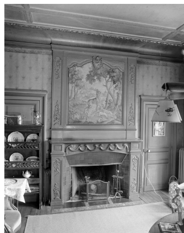
Vue générale de la cheminée de la salle à manger. IVR53_19843501303X