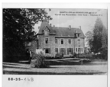
Châtillon-en-Vendelais - Manoir des Rouzières, côté nord - Elévation postérieure. Carte postale ancienne. Fonds Lagrée. IVR53_19883500148X