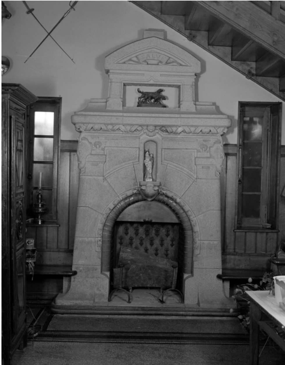
Hall d'entrée, détail de la cheminée.