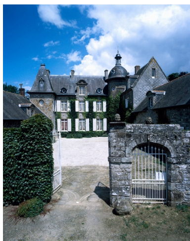
Elévation sud, vue générale sud. IVR53_19973500797XA