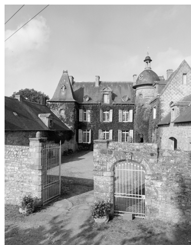
Elévation sud, vue générale sud. IVR53_19843501352X