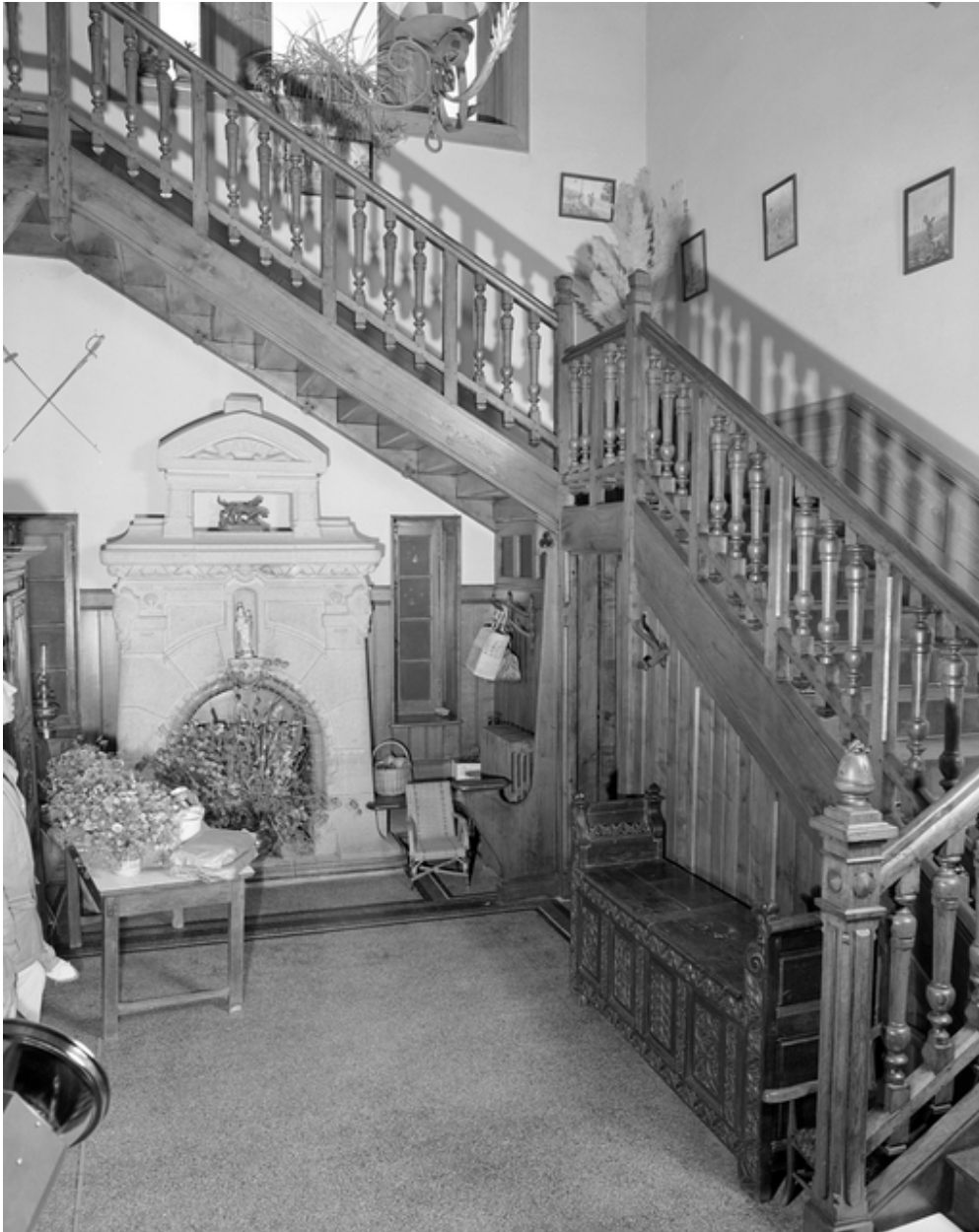
Hall d'entrée, vue générale.