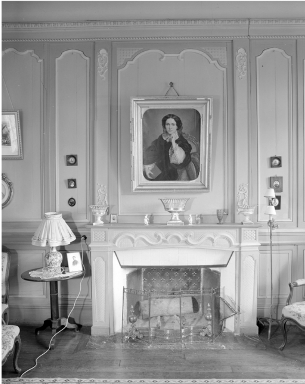
Vue de détail de la cheminée du salon.