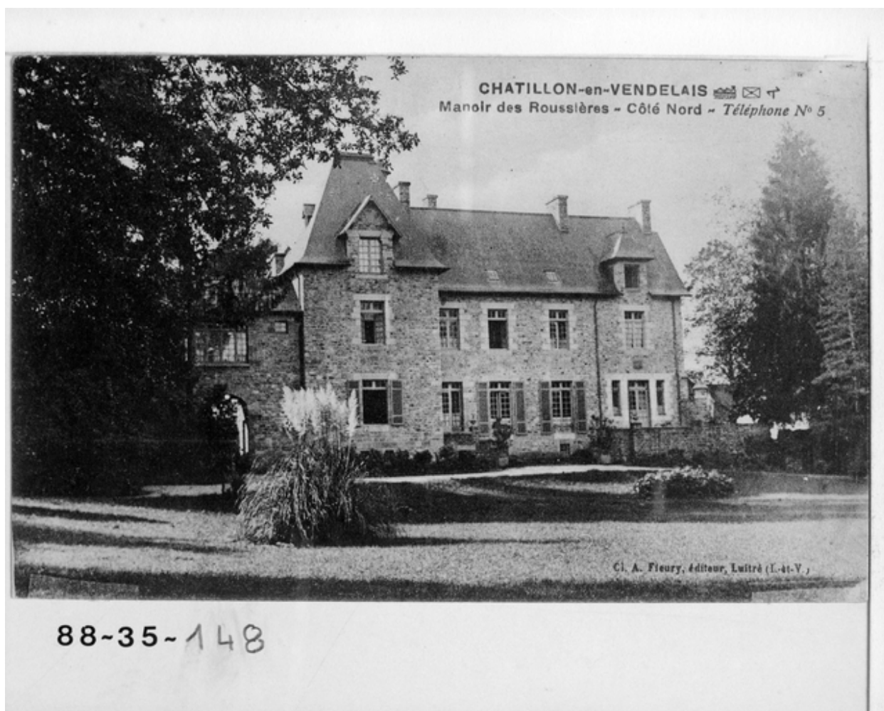
Châtillon-en-Vendelais - Manoir des Rouzières, côté nord - Elévation postérieure. Carte postale ancienne.