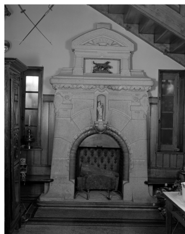
Hall d'entrée, détail de la cheminée. IVR53_19843501331X