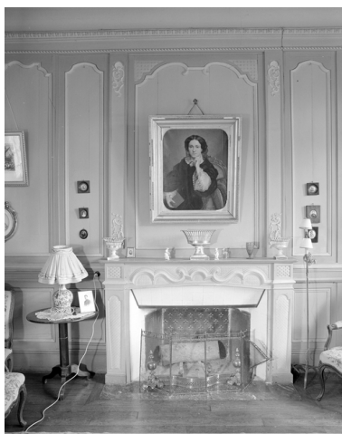
Vue de détail de la cheminée du salon. IVR53_19843501306X