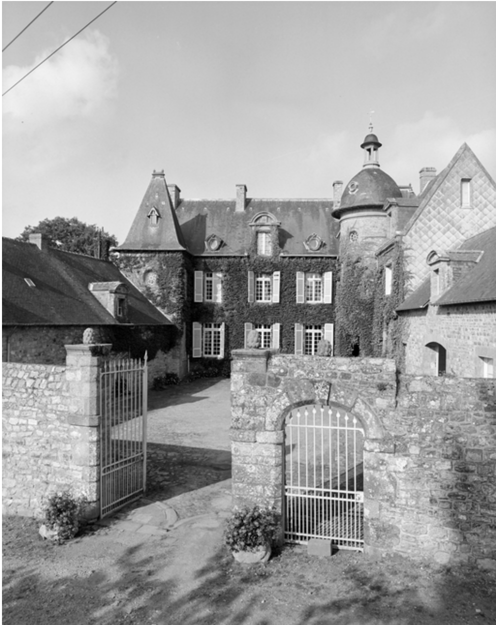
Elévation sud, vue générale sud.