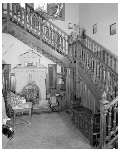
Hall d'entrée, vue générale. IVR53_19843501335X