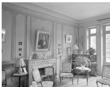
Vue générale du salon. IVR53_19843501305X