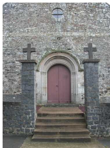
Porte ouest IVR53_20063509915NUCA