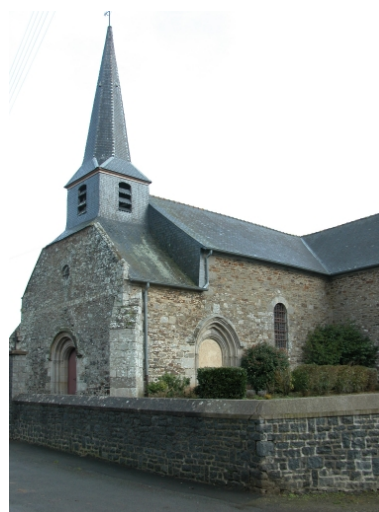
Vue partielle sud ouest IVR53_20063509916NUCA