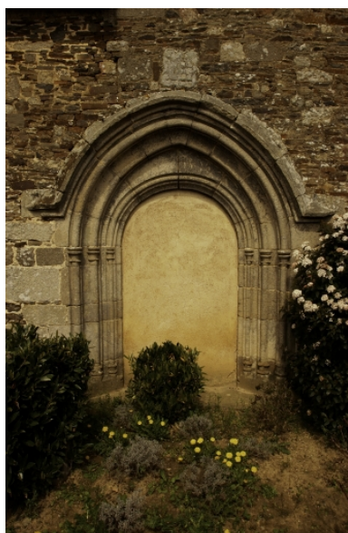
Porte sud IVR53_20063500667NUCA