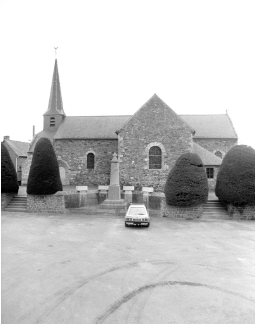
Elévation Sud : vue générale