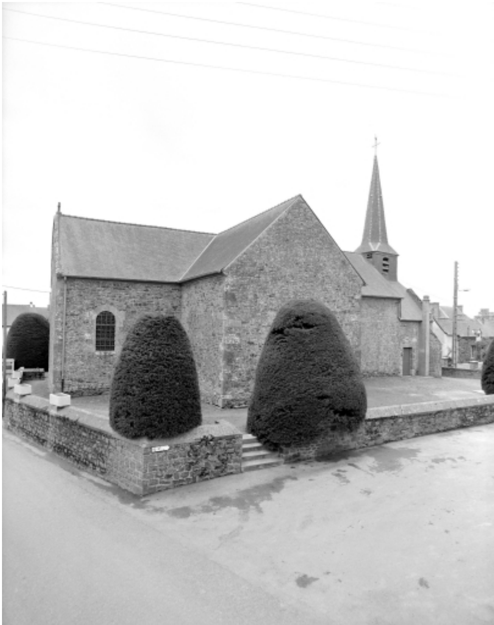
Elévation Nord : vue générale