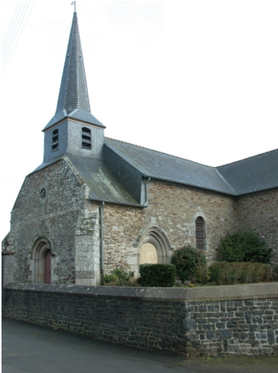
Vue partielle sud ouest