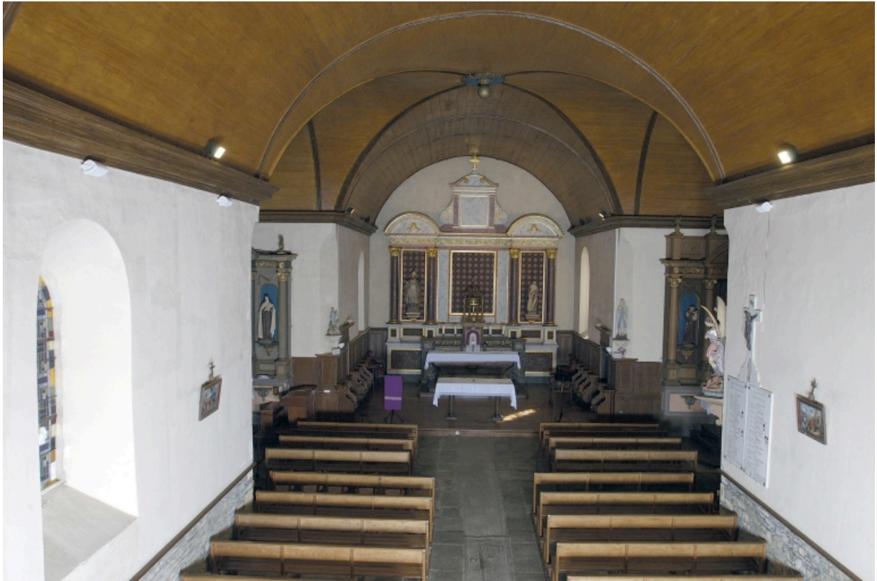
Vue intérieure prise de la nef vers le chœur