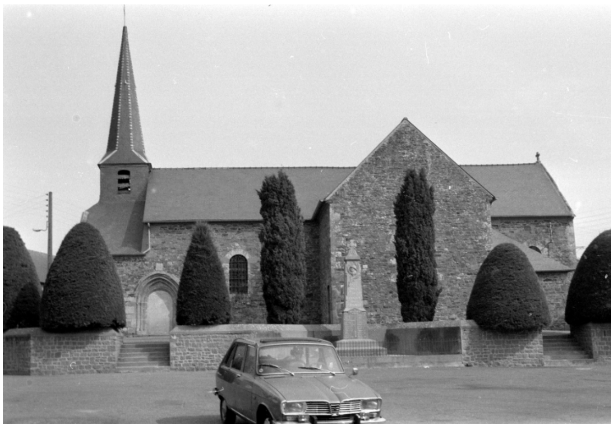
Vue générale en 1976