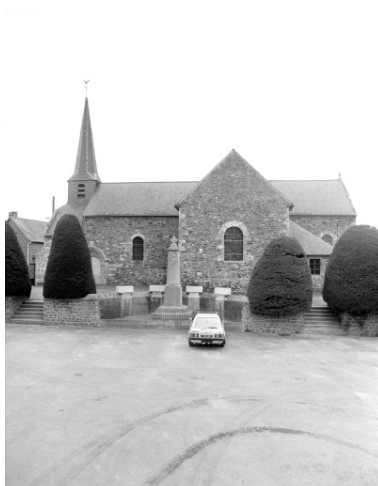
Elévation Sud : vue générale IVR53_19943500732X