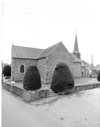
Elévation Nord : vue générale IVR53_19943500731X