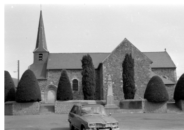
Vue générale en 1976