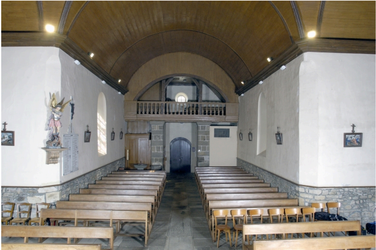
Vue intérieure prise du chœur vers la nef