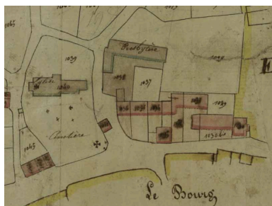
Cadastré de 1834