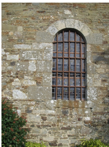
Fenêtre datée à gauche IVR53_20063509971NUCA