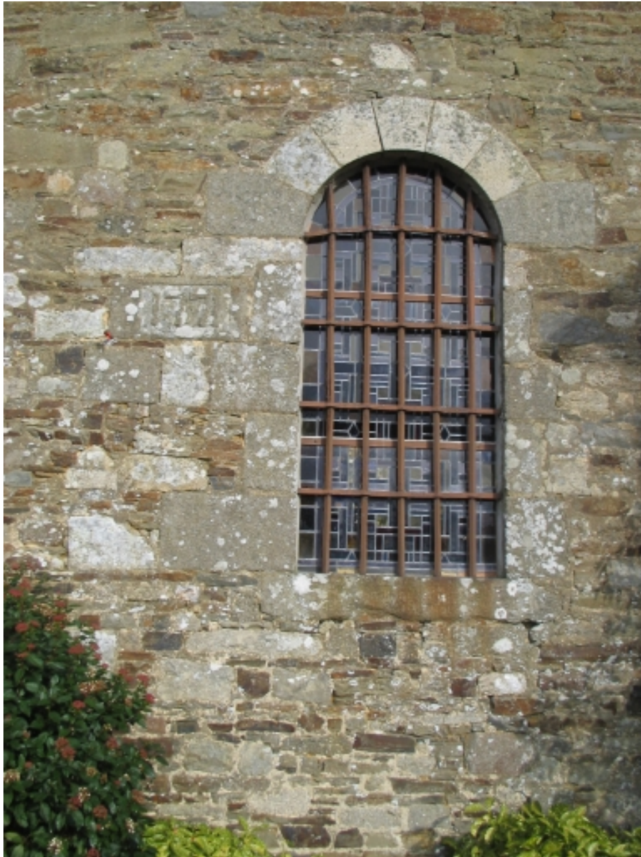
Fenêtre datée à gauche