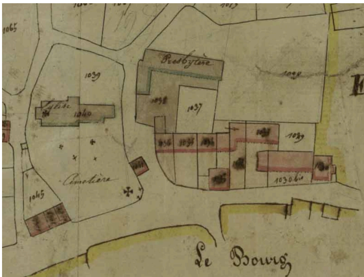
Cadastre de 1834