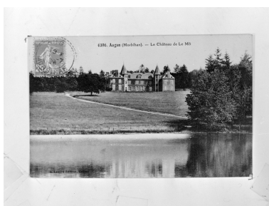
Reproduction carte postale : la Château de le Mô IVR53_19785601302XB