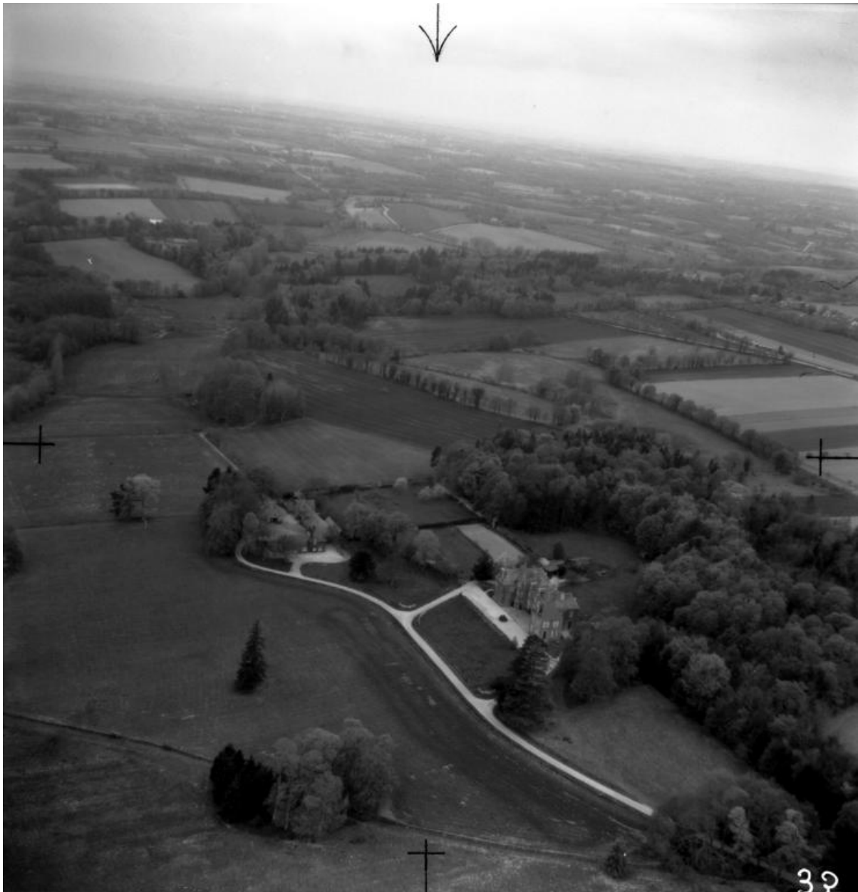
Vue aérienne prise du sud-ouest