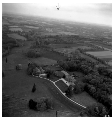
Vue aérienne prise du sud-ouest IVR53_19795600057P