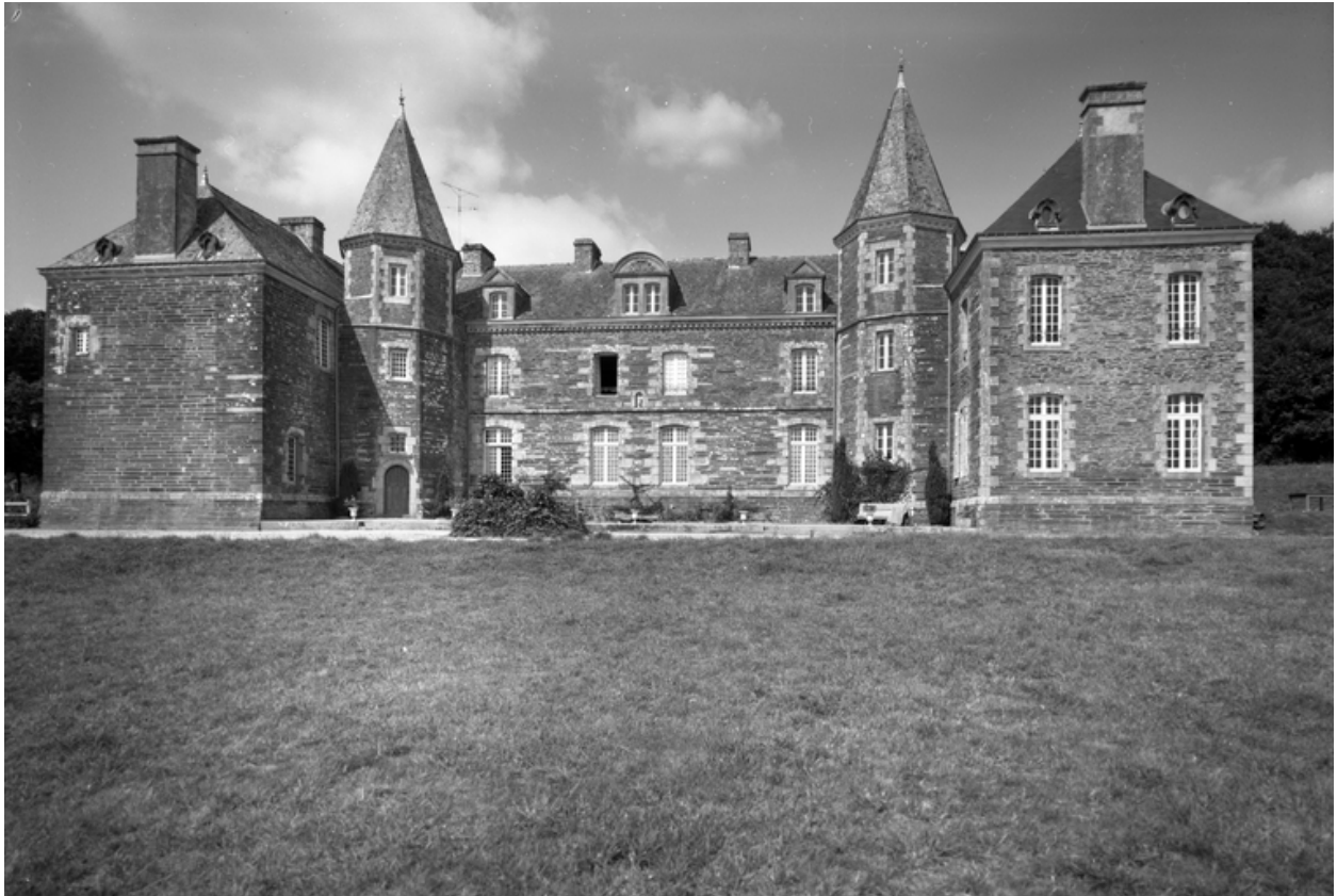
Vue générale sud.