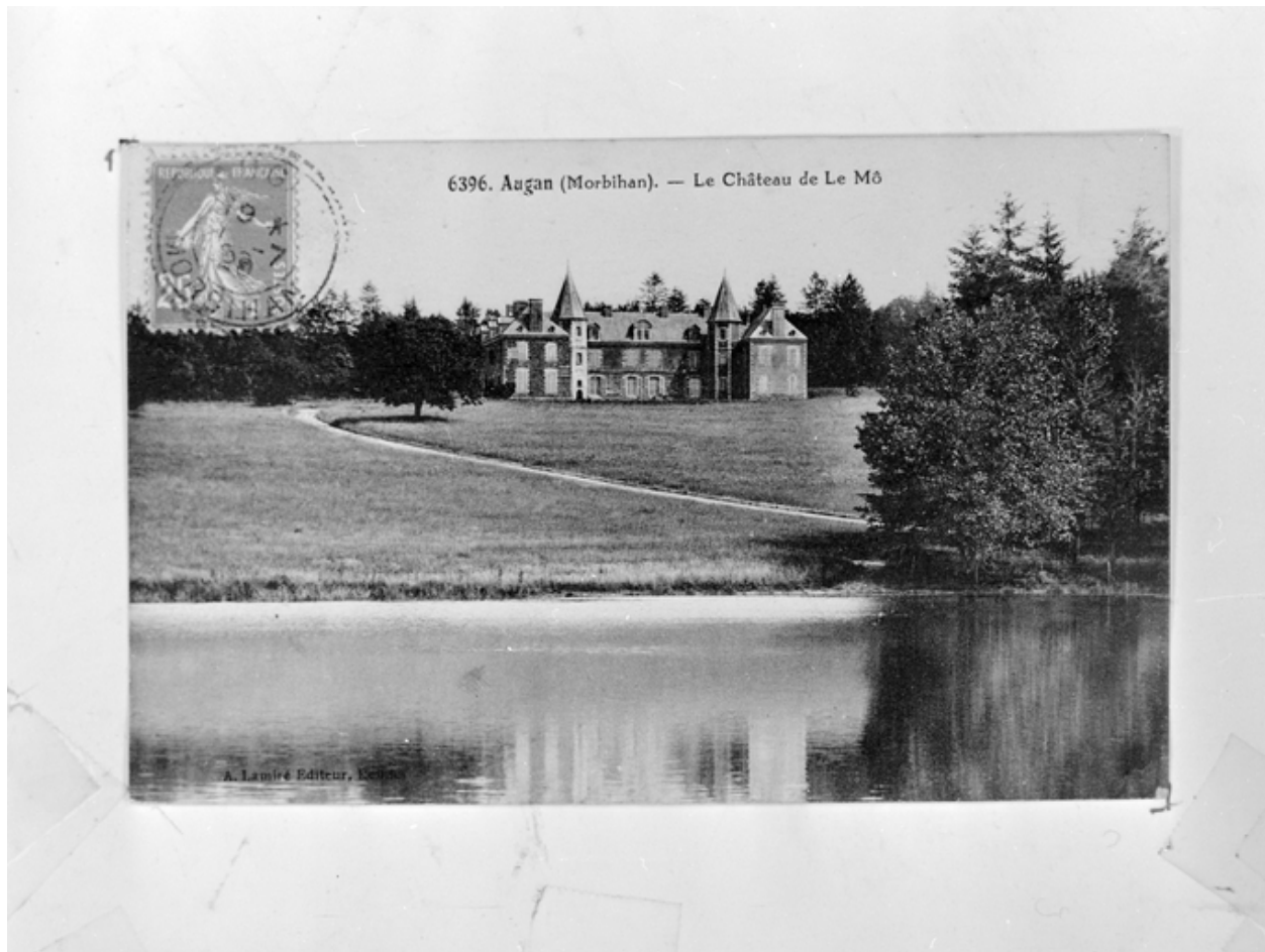
Reproduction carte postale : la Château de le Mô