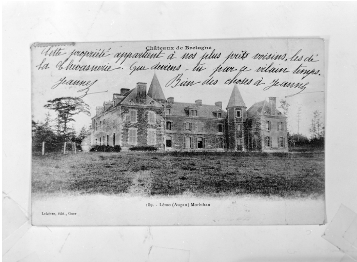
Reproduction carte postale : Château de Léo