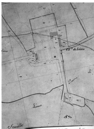
Cadastré de 1848, section A, feuille 5, IVR53_19775600383V