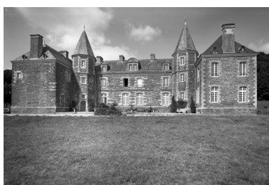
Vue générale sud. IVR53_19775600721V