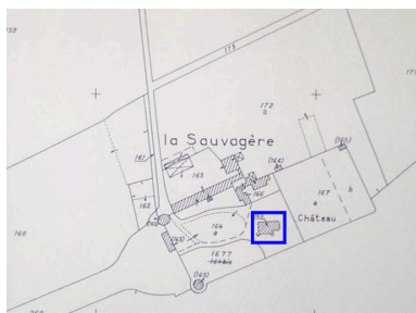
Le château et ses dépendances sur le cadastre rénové IVR53_19993505445NUC