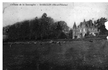
Le château sur une carte postale du début du 20e siècle : vue de situation sud IVR53_19883500679X