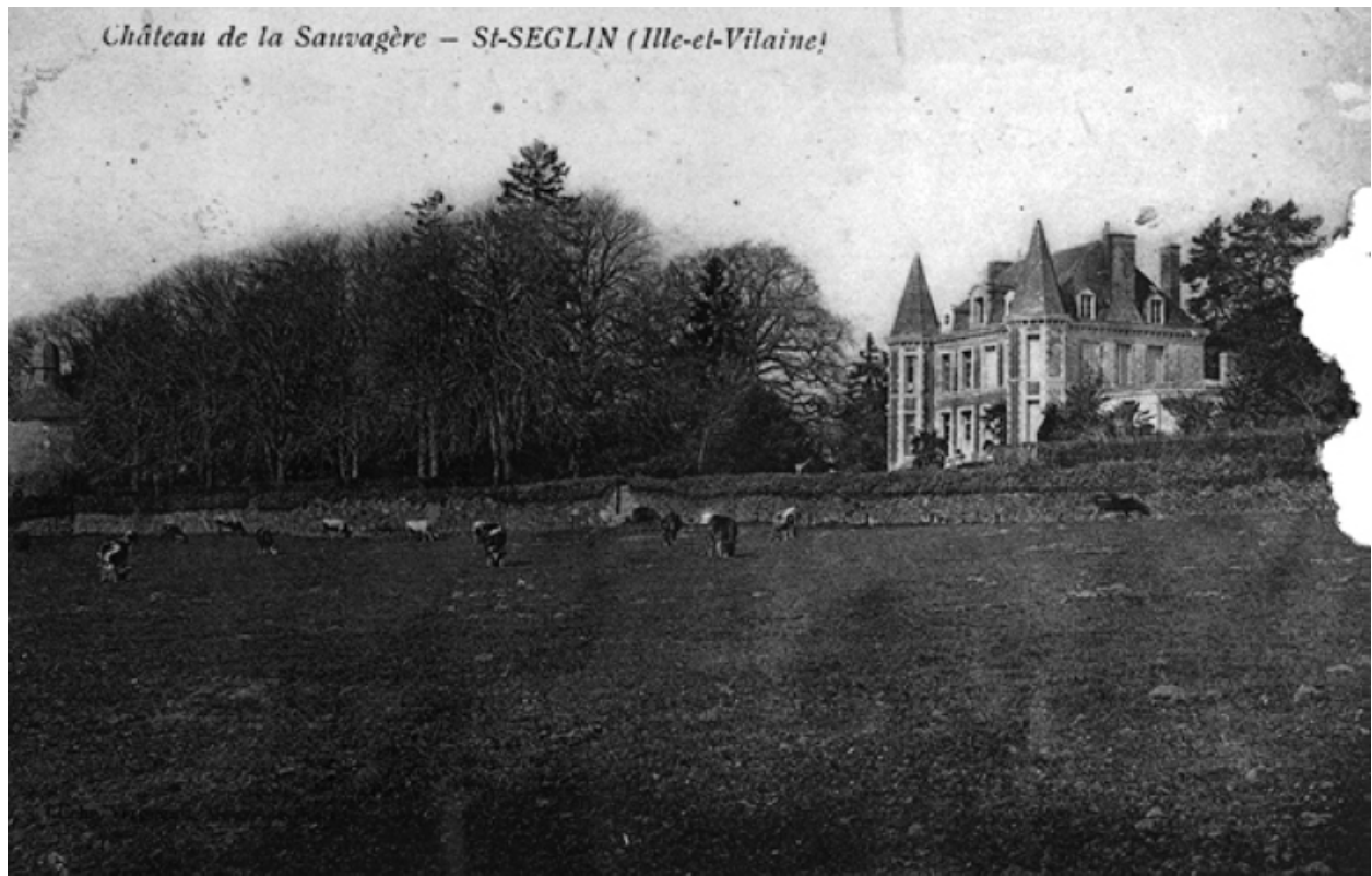
Le château sur une carte postale du début du 20e siècle : vue de situation sud