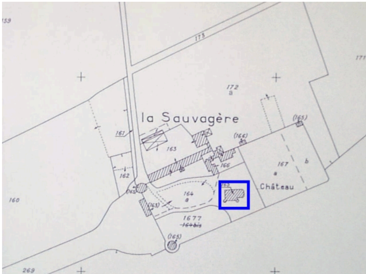
Le château et ses dépendances sur le cadastre rénové