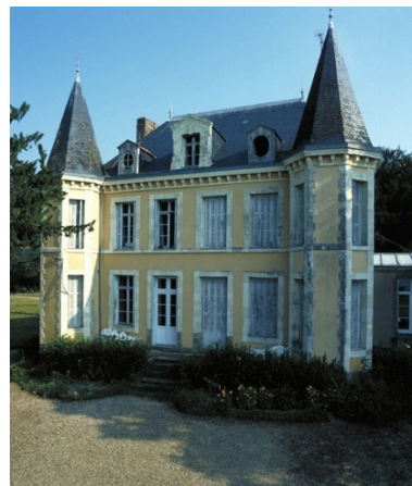
Façade sur terrasse : vue générale sud IVR53_19993501952XA