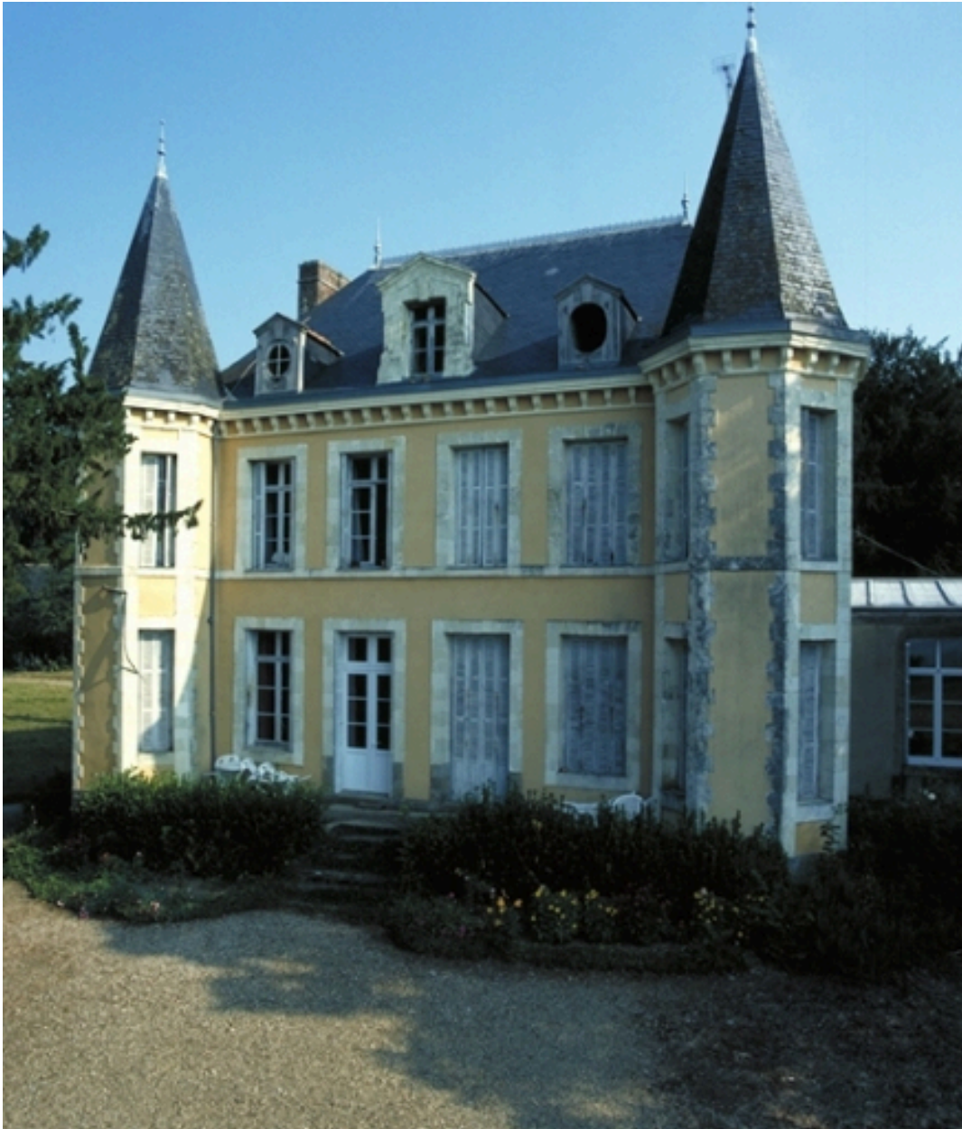
Façade sur terrasse : vue générale sud