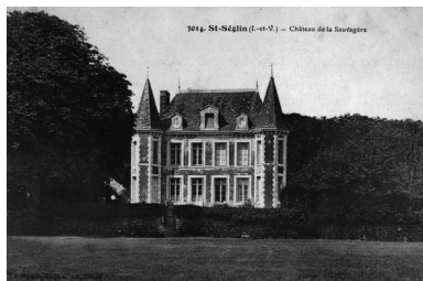
Le château sur une carte postale du début du 20e siècle : vue générale sud IVR53_19883500678X