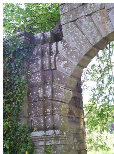
Le Portail : détail du montant nord IVR53_19993505478NUCA