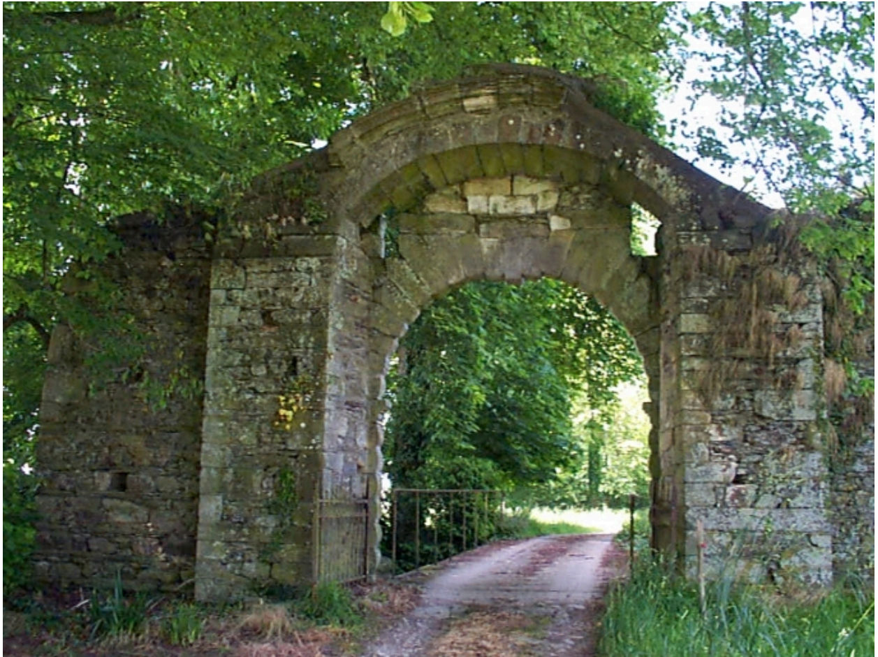
Le portail, revers : vue générale est