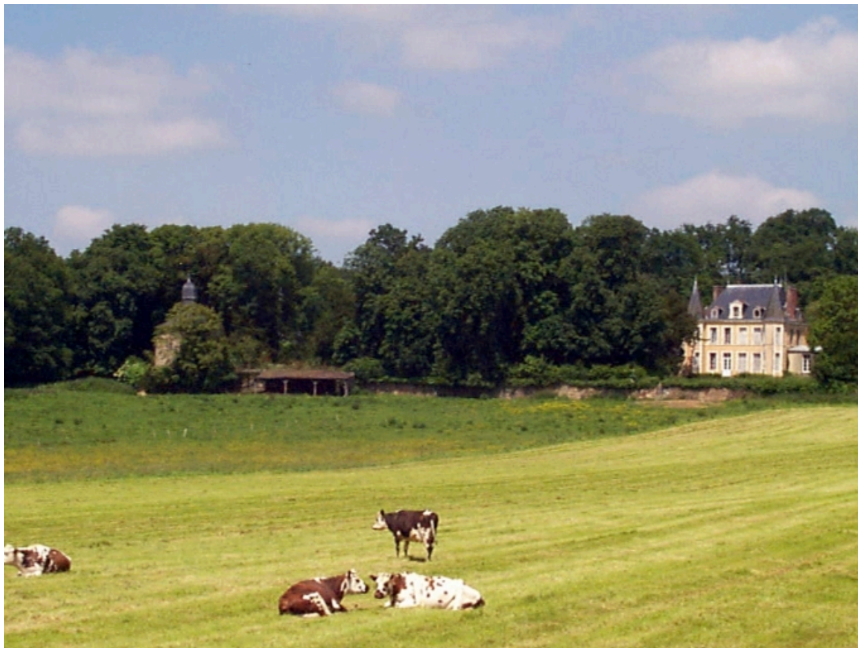
Le château et l'ancien colombier : vue de situation sud