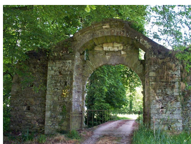
Le portail, revers : vue générale est IVR53_19993505479NUCA