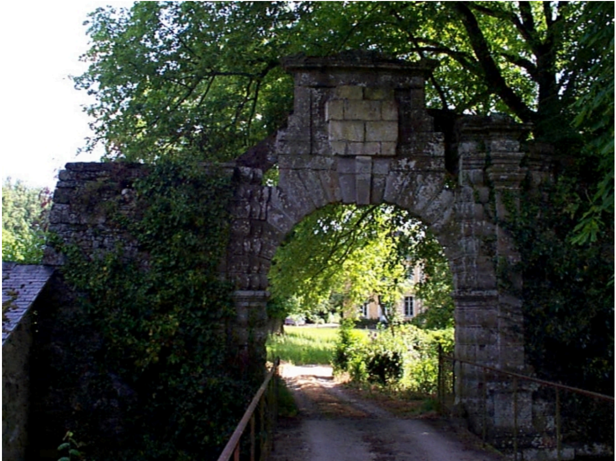
Le Portail, avers : vue générale ouest