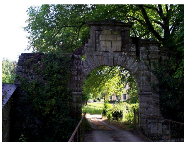
Le Portail, avers : vue générale ouest IVR53_19993505477NUCA