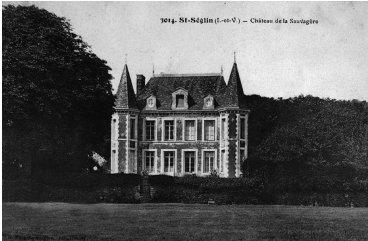
Le château sur une carte postale du début du 20e siècle : vue générale sud