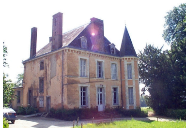
Façade sur cour : vue de trois quart nord-ouest IVR53_19993505476NUCA