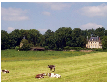
Le château et l'ancien colombier : vue de situation sud IVR53_19993505475NUCA