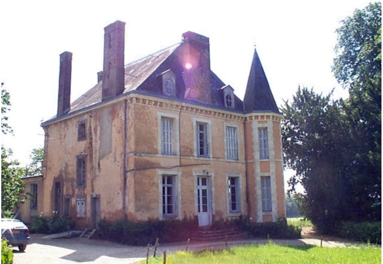
Façade sur cour : vue de trois quart nord-ouest