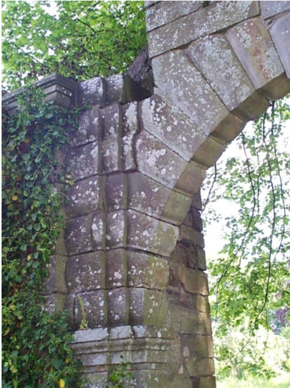
Le Portail : détail du montant nord