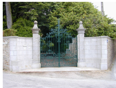
Le portail d'entrée : vue générale nord-est IVR53_20003509586NUCA