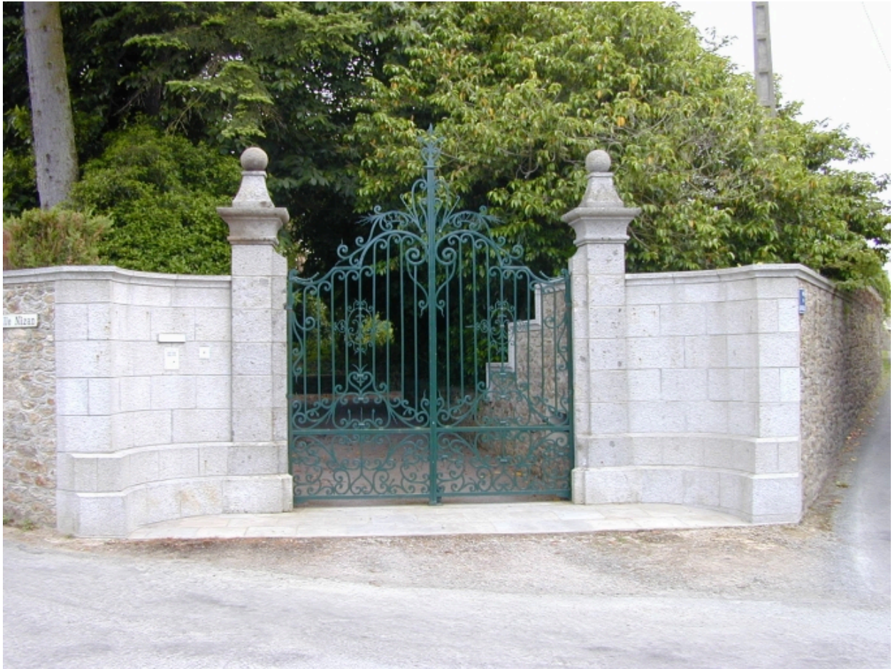
Le portail d'entrée : vue générale nord-est