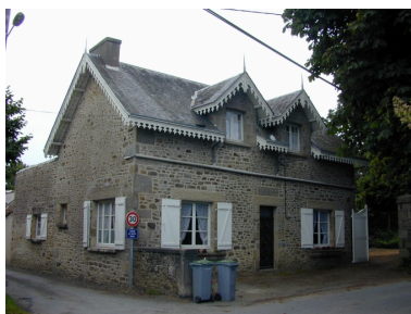
Les anciennes écuries transformées en maison vers 1960 : vue générale sud IVR53_20003509613NUCA