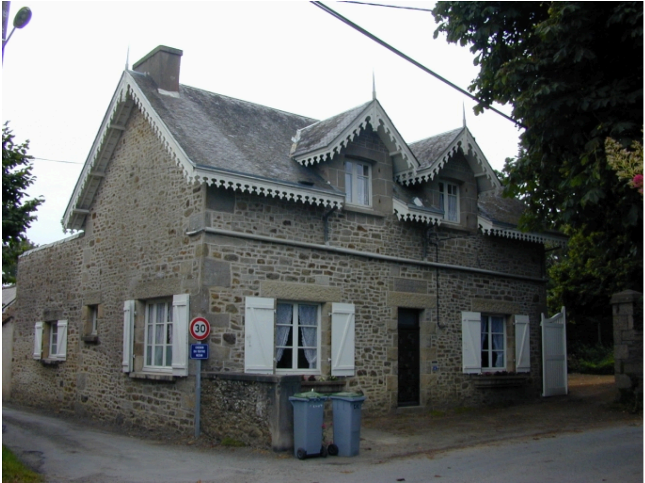
Les anciennes écuries transformées en maison vers 1960 : vue générale sud