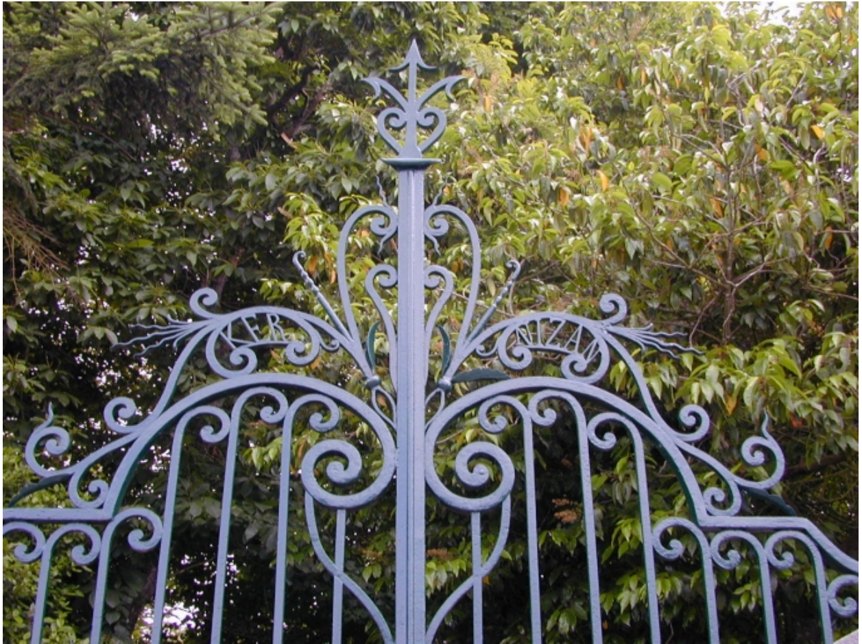
Grille du portail : détail