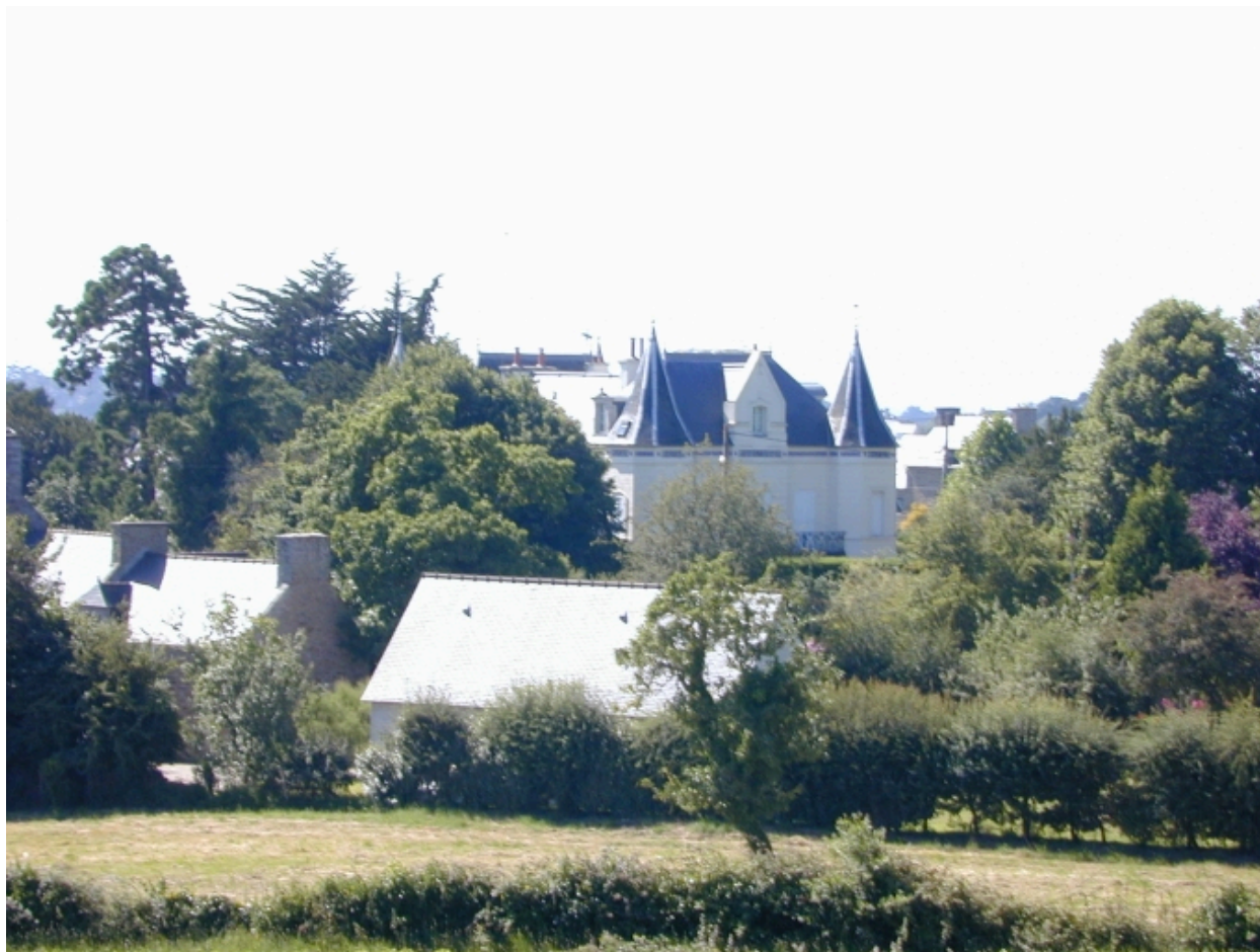
Vue de situation est