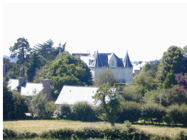
Vue de situation est