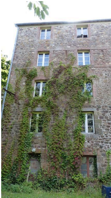
Vue générale ouest IVR53_20243531419NUCA