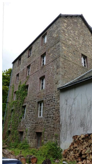
Vue générale ouest IVR53_20243531418NUCA