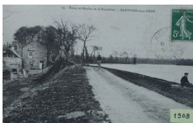
Le moulin sur une carte postale ancienne IVR53_20053519254NUCA