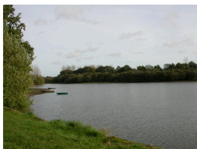
L'étang de la Bézardière