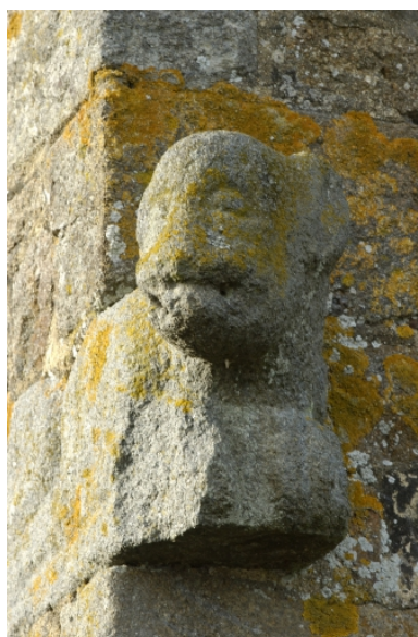
Pierre sculptée en remploi IVR53_20053502983NUCA