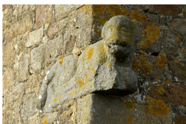
Pierre sculptée en chaînage d'angle IVR53_20053502982NUCA