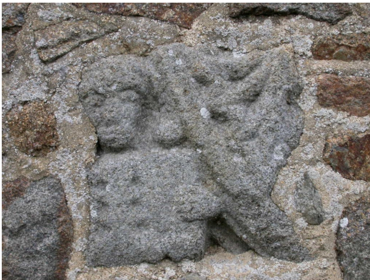
Pierre sculptée de remploi