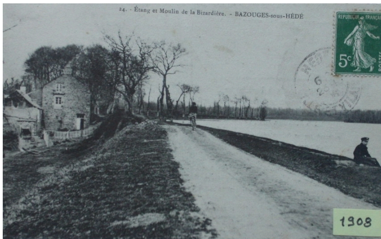
Le moulin sur une carte postale ancienne