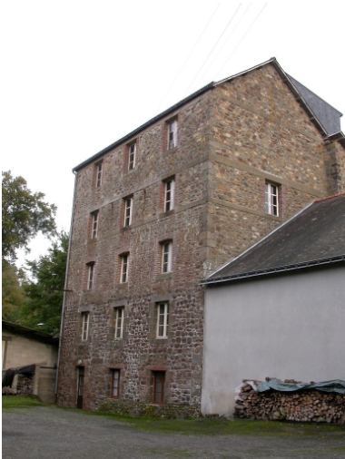
Vue générale IVR53_20053519137NUCA