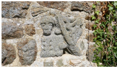
Détails sur la façade est