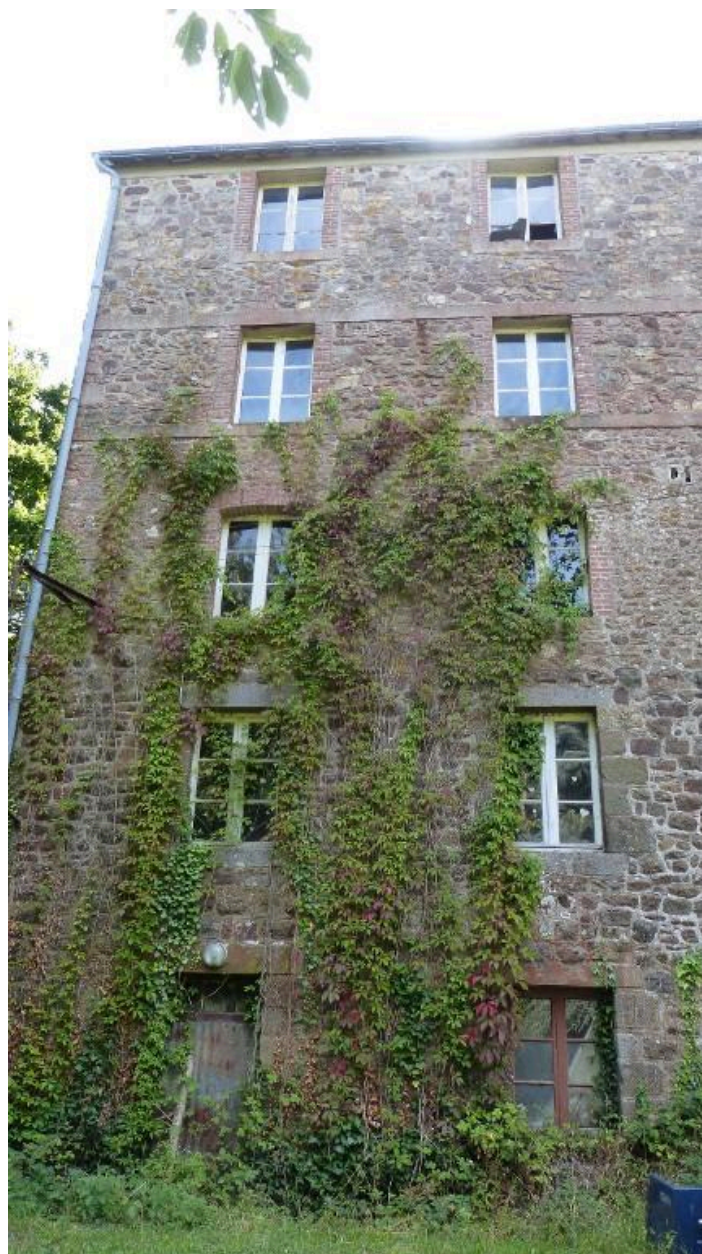
Vue générale ouest