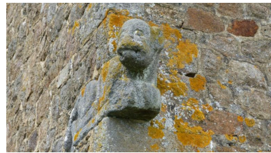
Détails sur le chaînage d'angle sud est