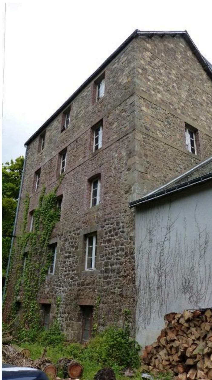
Vue générale ouest