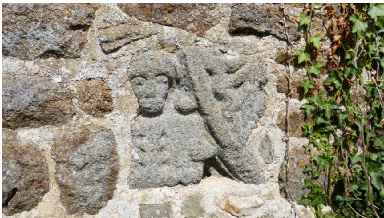
Détails sur la façade est