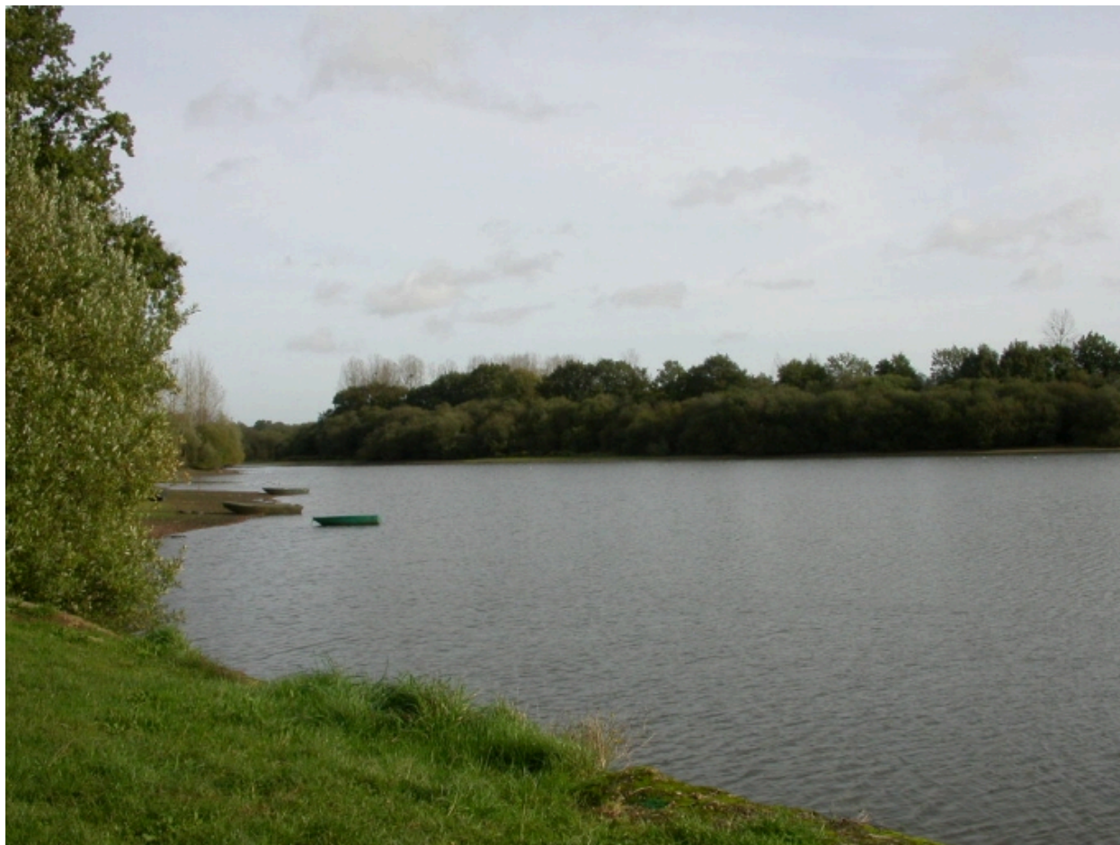
L'étang de la Bézardière