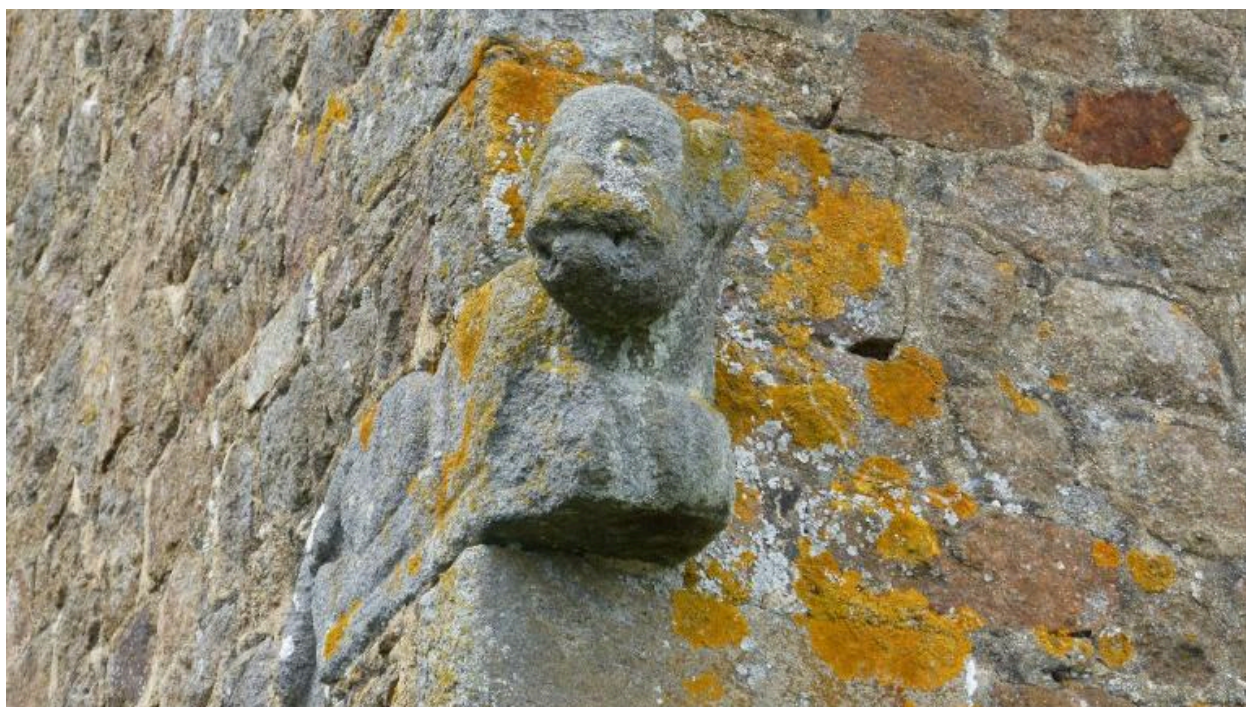
Détails sur le chaînage d'angle sud est