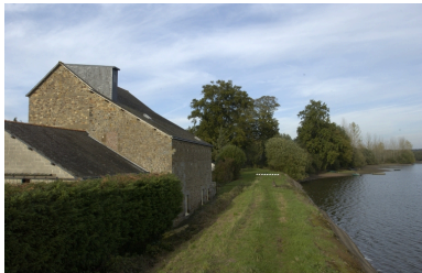
Vue générale IVR53_20053502981NUCA