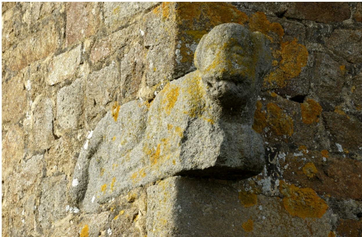
Pierre sculptée en chaînage d'angle