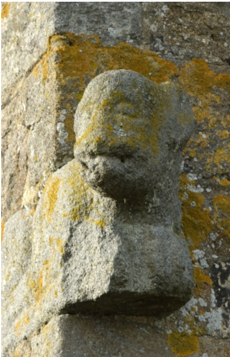
Pierre sculptée en remploi