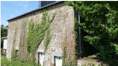
Vue générale est IVR53_20243531465NUCA