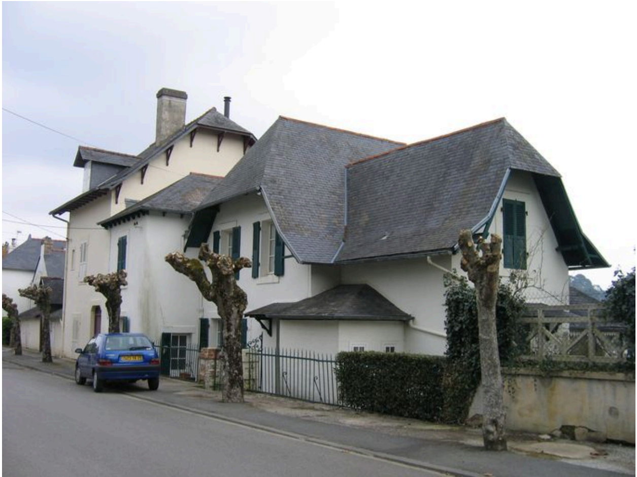
Vue arrière de la villa Kador, côté terre