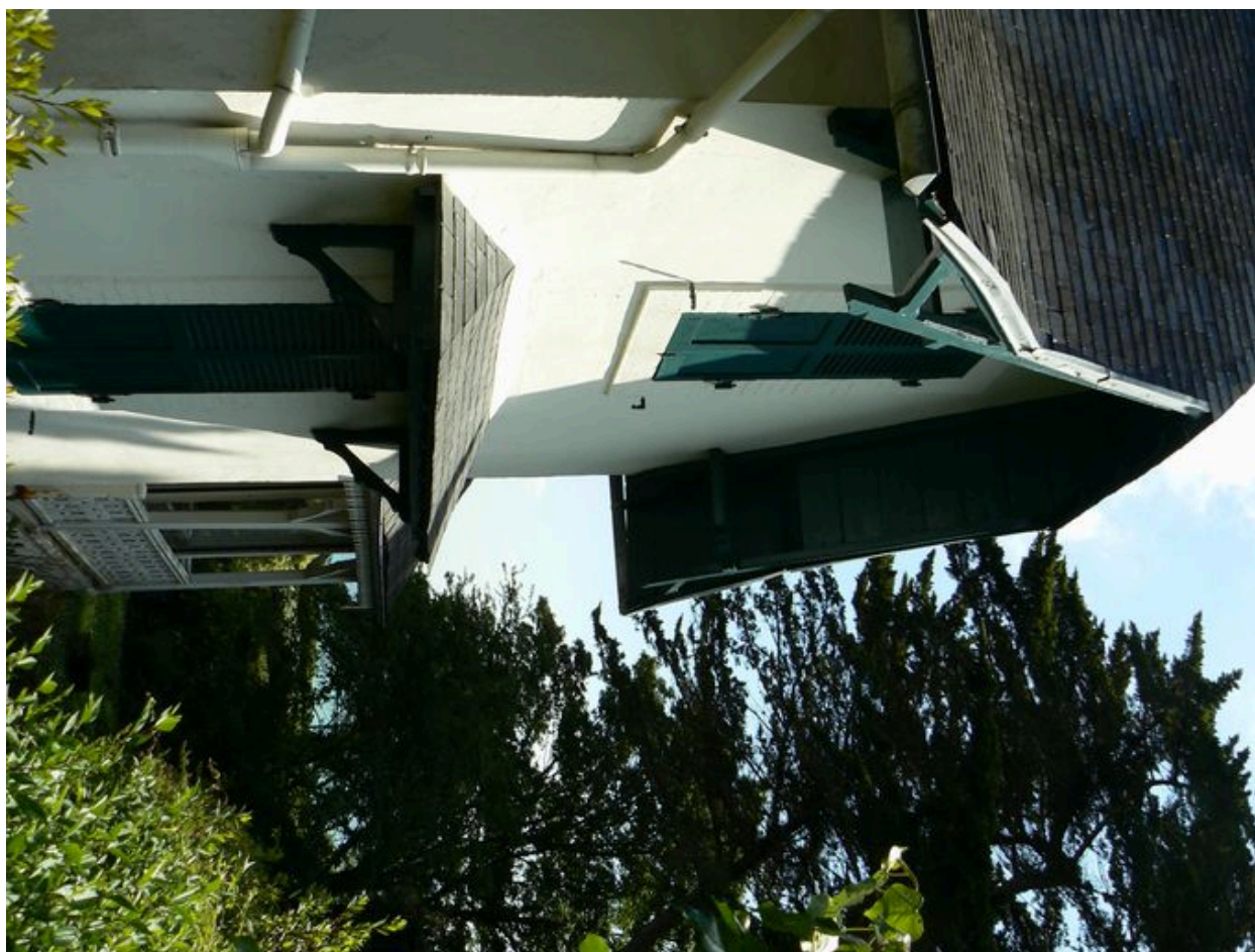
Vue latérale de la villa Kador