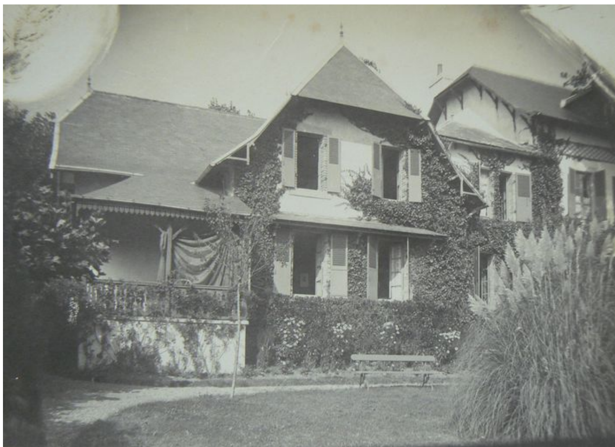
Vue ancienne de la villa Kador