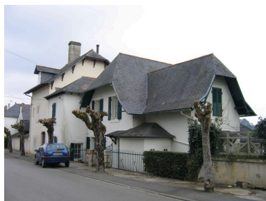
Vue arrière de la villa Kador, côté terre