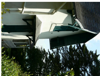
Vue latérale de la villa Kador IVR53_20072908717NUCA