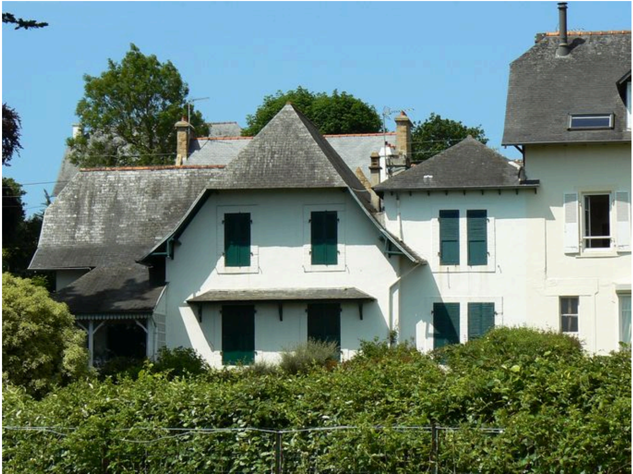
Vue générale villa Kador, côté mer