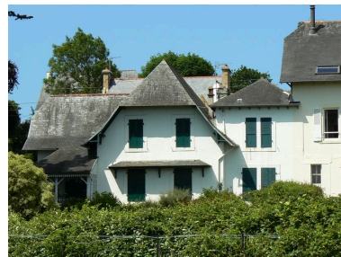
Vue générale villa Kador, côté mer IVR53_20072908718NUCA