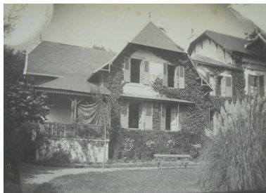
Vue ancienne de la villa Kador IVR53_20072908719NUC