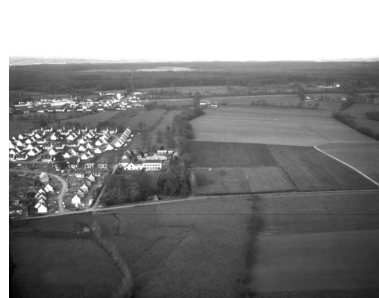
Vue aérienne en 1984 ; vue de situation sud