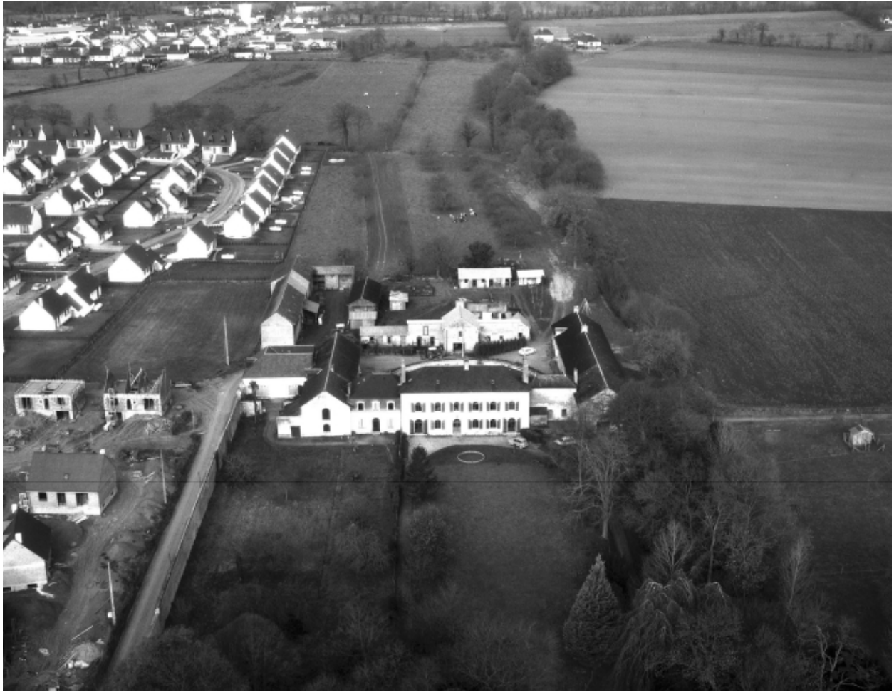
Vue aérienne en 1984 ; vue de situation sud