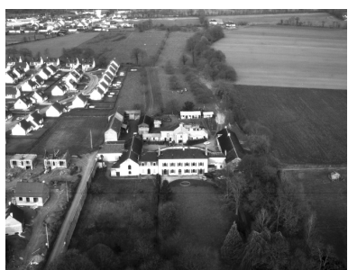
Vue aérienne en 1984 ; vue de situation sud IVR53_19843500838V