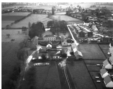
Vue aérienne en 1984 ; vue de situation nord