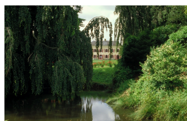
Vue de situation sud