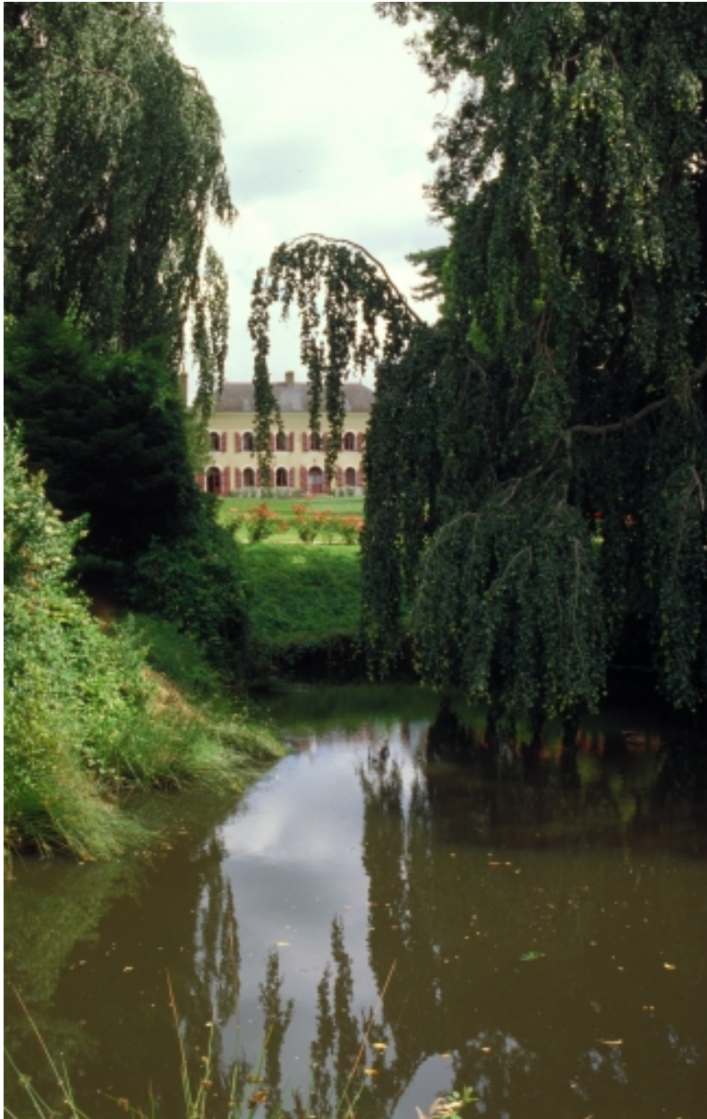
Vue de situation sud