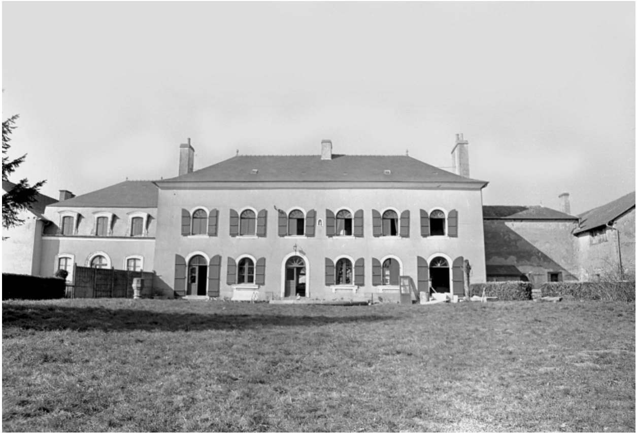
Elévation sud ; état en 1973