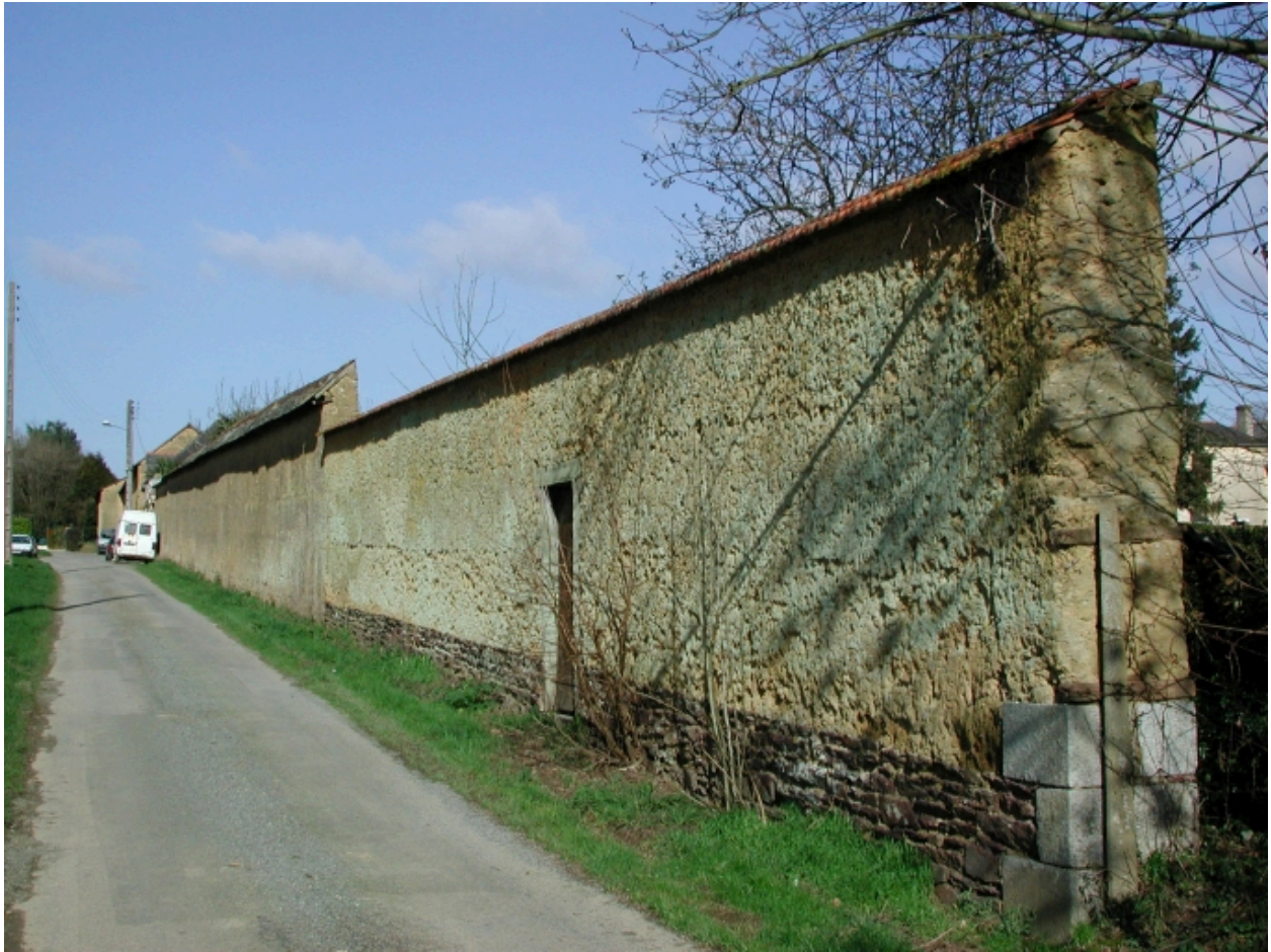
Mur de clôture en terre