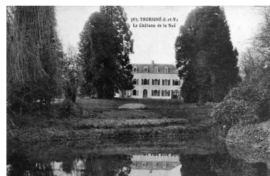
Carte postale IVR53_19883500715X