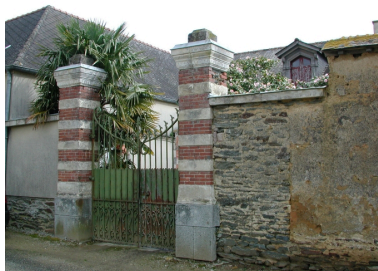
Portail latéral ouest IVR53_20013508902NUCA