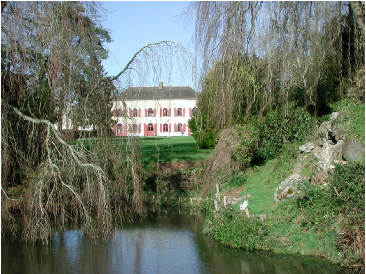
Vue de situation sud