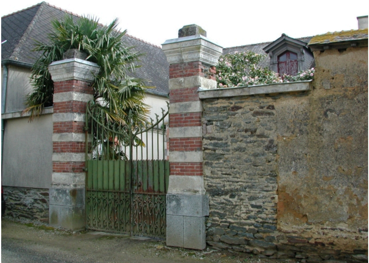
Portail latéral ouest