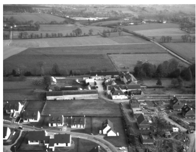
Vue aérienne en 1984 ; vue de situation ouest IVR53_19843500860V