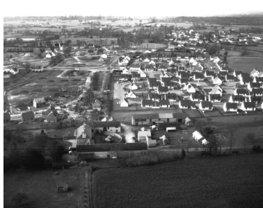
Vue aérienne en 1984 ; vue de situation est IVR53_19843500841V