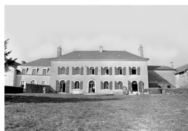
Elévation sud ; état en 1973 IVR53_19743500258Z