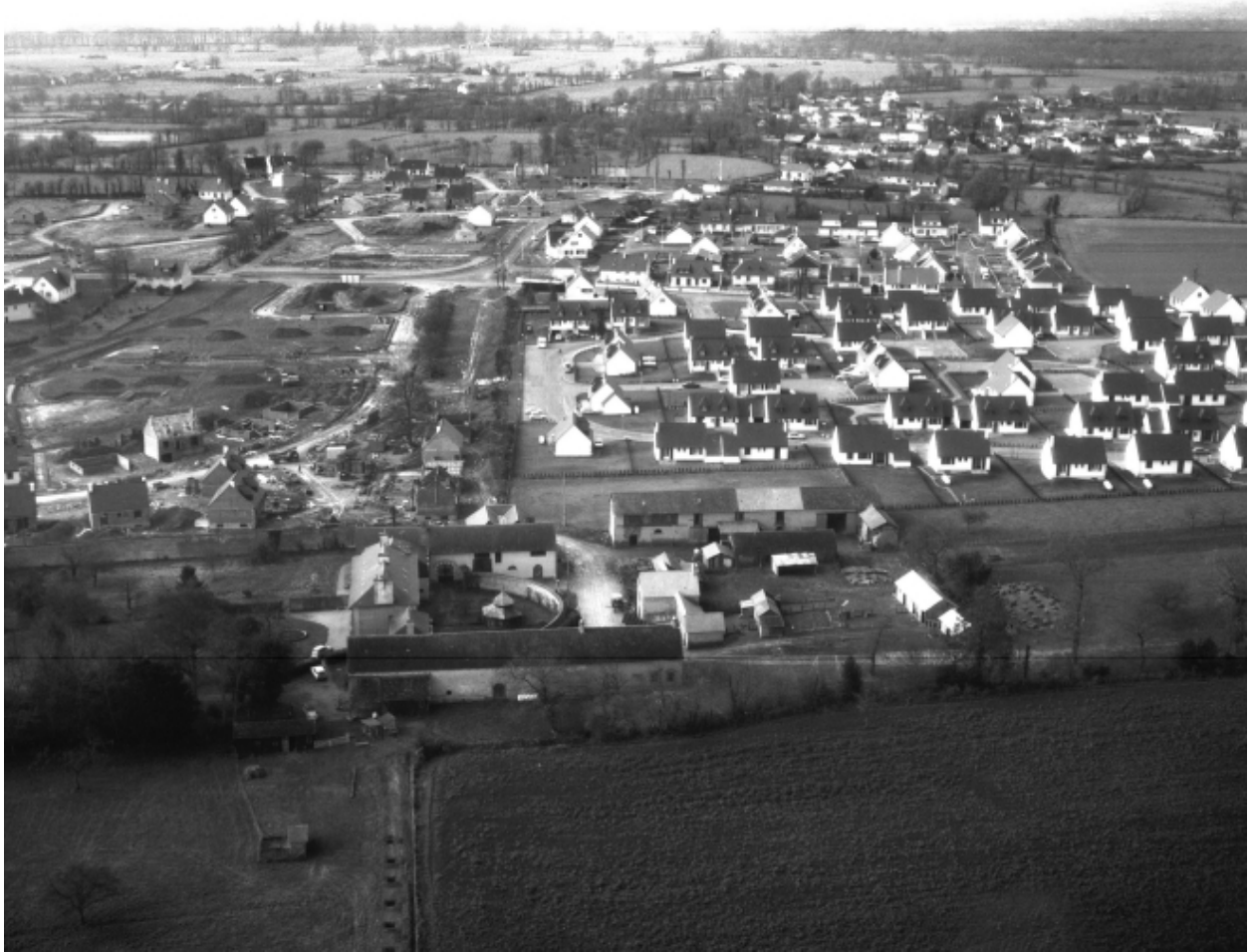
Vue aérienne en 1984 ; vue de situation est