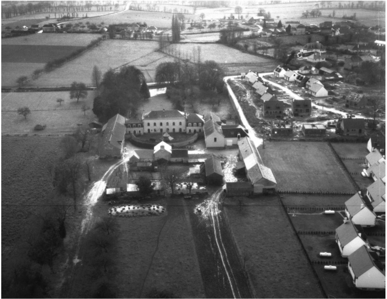
Vue aérienne en 1984 ; vue de situation nord