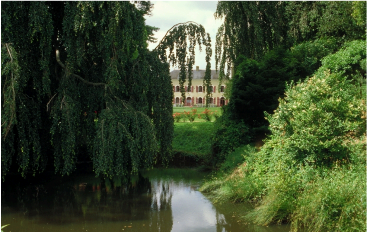
Vue de situation sud