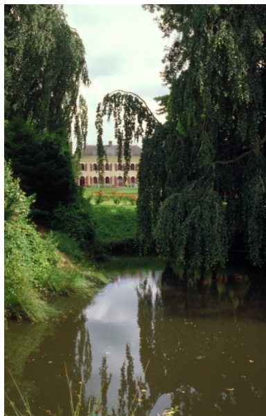
Vue de situation sud