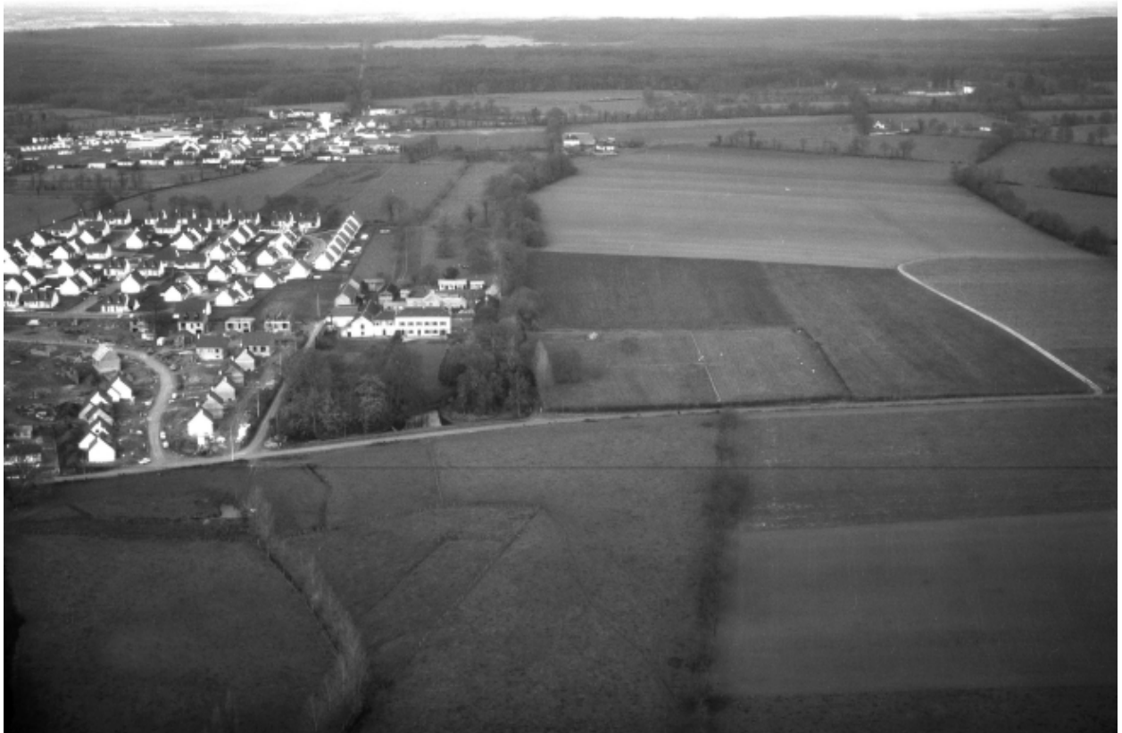
Vue aérienne en 1984 ; vue de situation sud