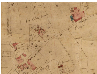
Les ouvrages dessinés sur le 'cadastre napoléonien' sont détruits