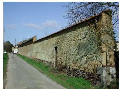
Mur de clôture en terre