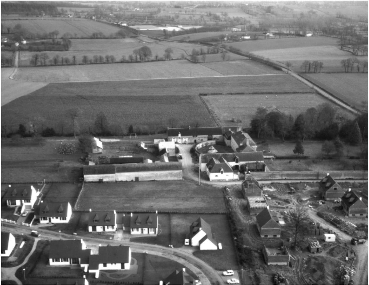
Vue aérienne en 1984 ; vue de situation ouest