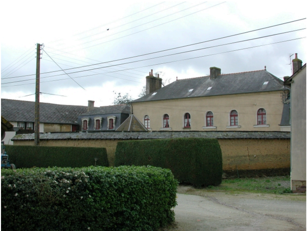
Mur de clôture hémisphérique séparant la demeure de la ferme au nord