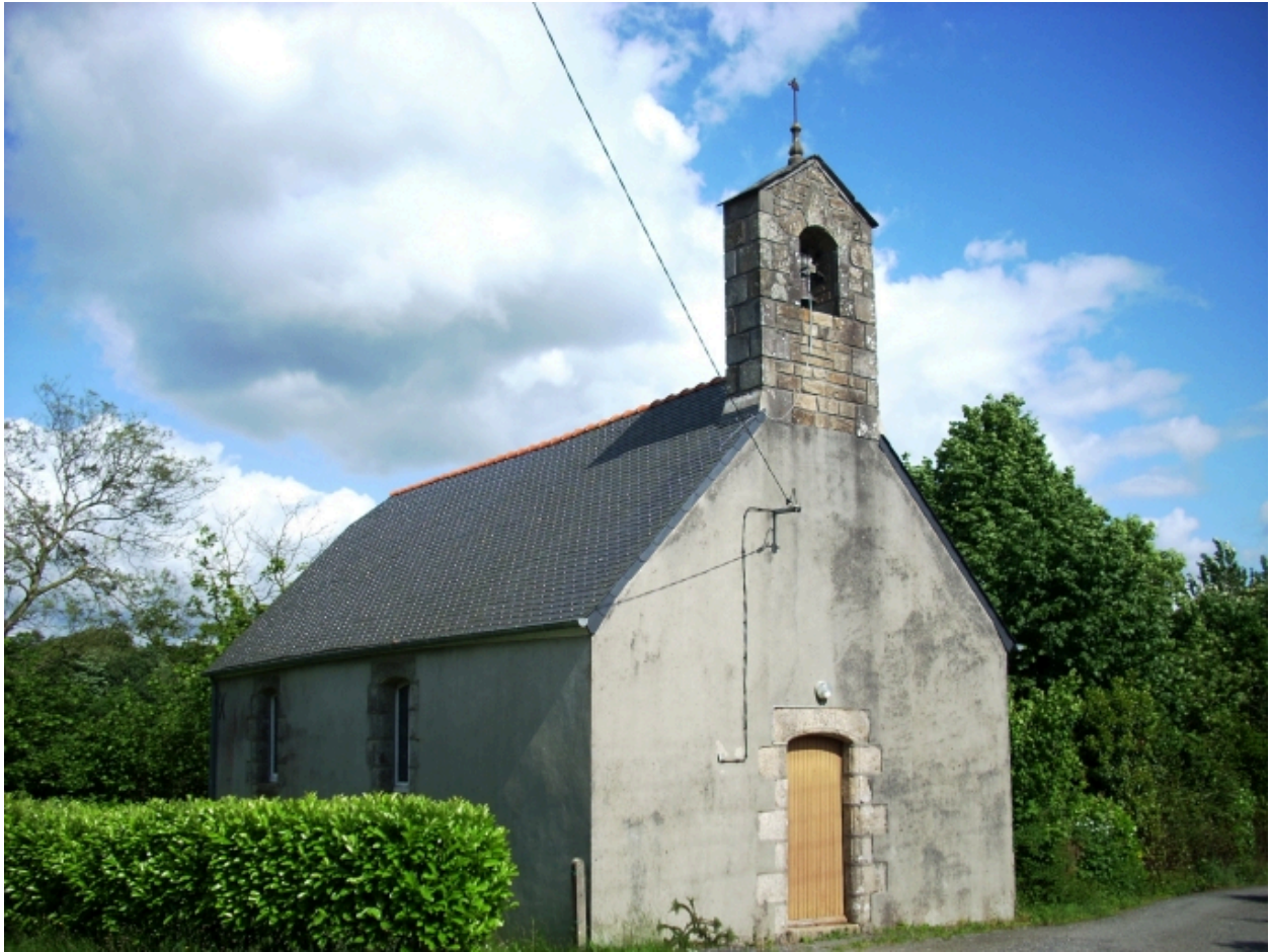
Chapelle Sainte-Anne : vue générale nord-ouest