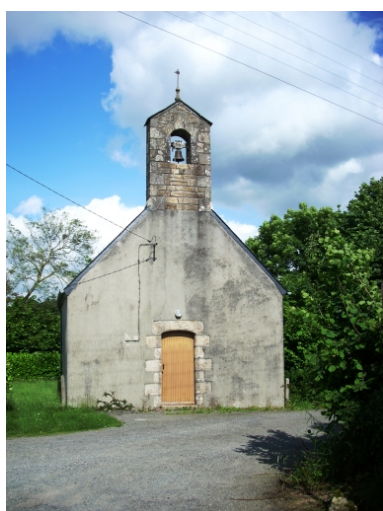
Chapelle Sainte-Anne : élévation ouest IVR53_20082906050NUCA