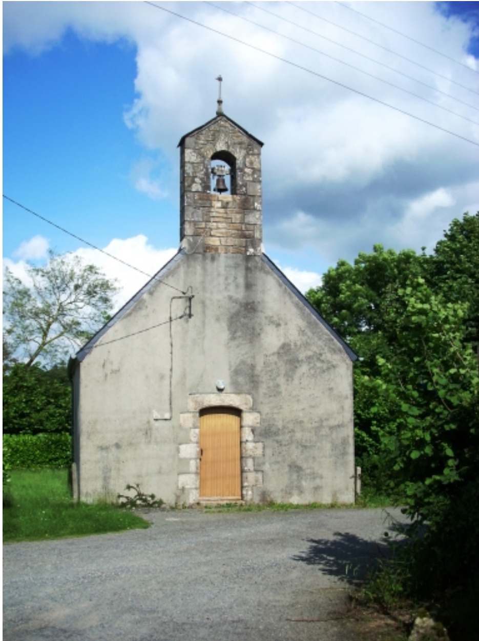
Chapelle Sainte-Anne : élévation ouest