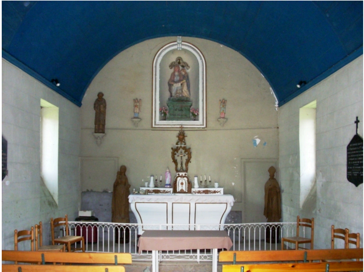
Chapelle Sainte-Anne : vue axiale est