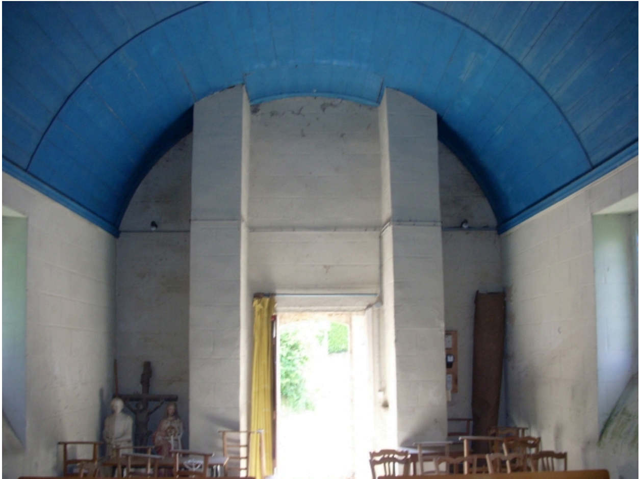
Chapelle Sainte-Anne : vue axiale ouest