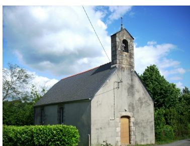
Chapelle Sainte-Anne : vue générale nord-ouest IVR53_20082906051NUCA