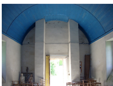
Chapelle Sainte-Anne : vue axiale ouest