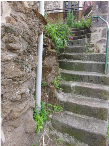
Détail de l'escalier à l'arrière de la fontaine vers la rue Beau Manoir IVR53_20243531742NUCA