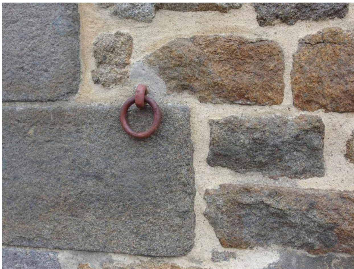
Détail d'attache pour animaux dans la maçonnerie