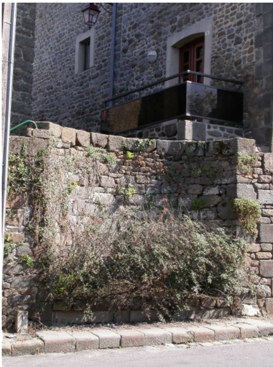
Vue générale ouest