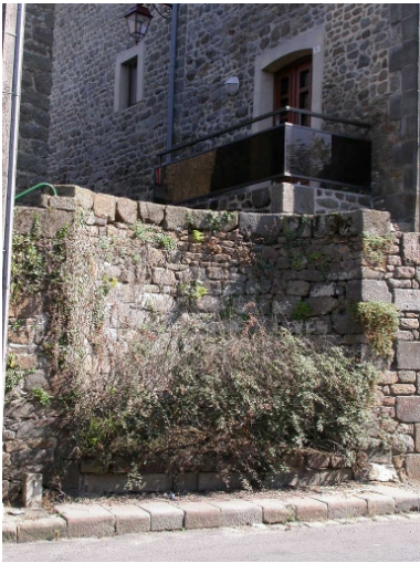
Vue générale ouest IVR53_20053518478NUCA