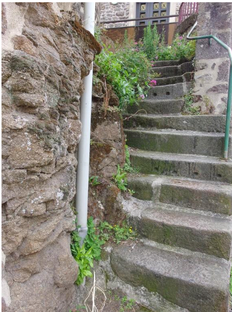
Détail de l'escalier à l'arrière de la fontaine vers la rue Beau Manoir