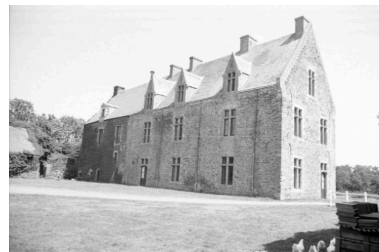
Vue générale IVR53_19745605446Z