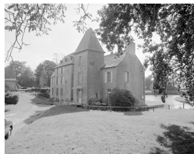
Château, vue générale nord-ouest. IVR53_19873500249X