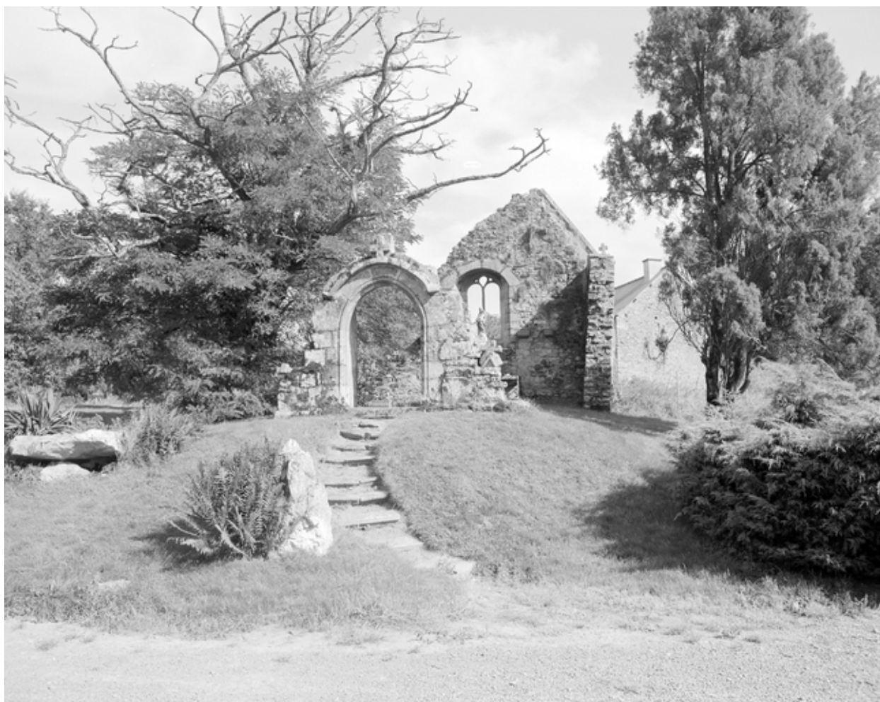
Chapelle, vue générale sud.