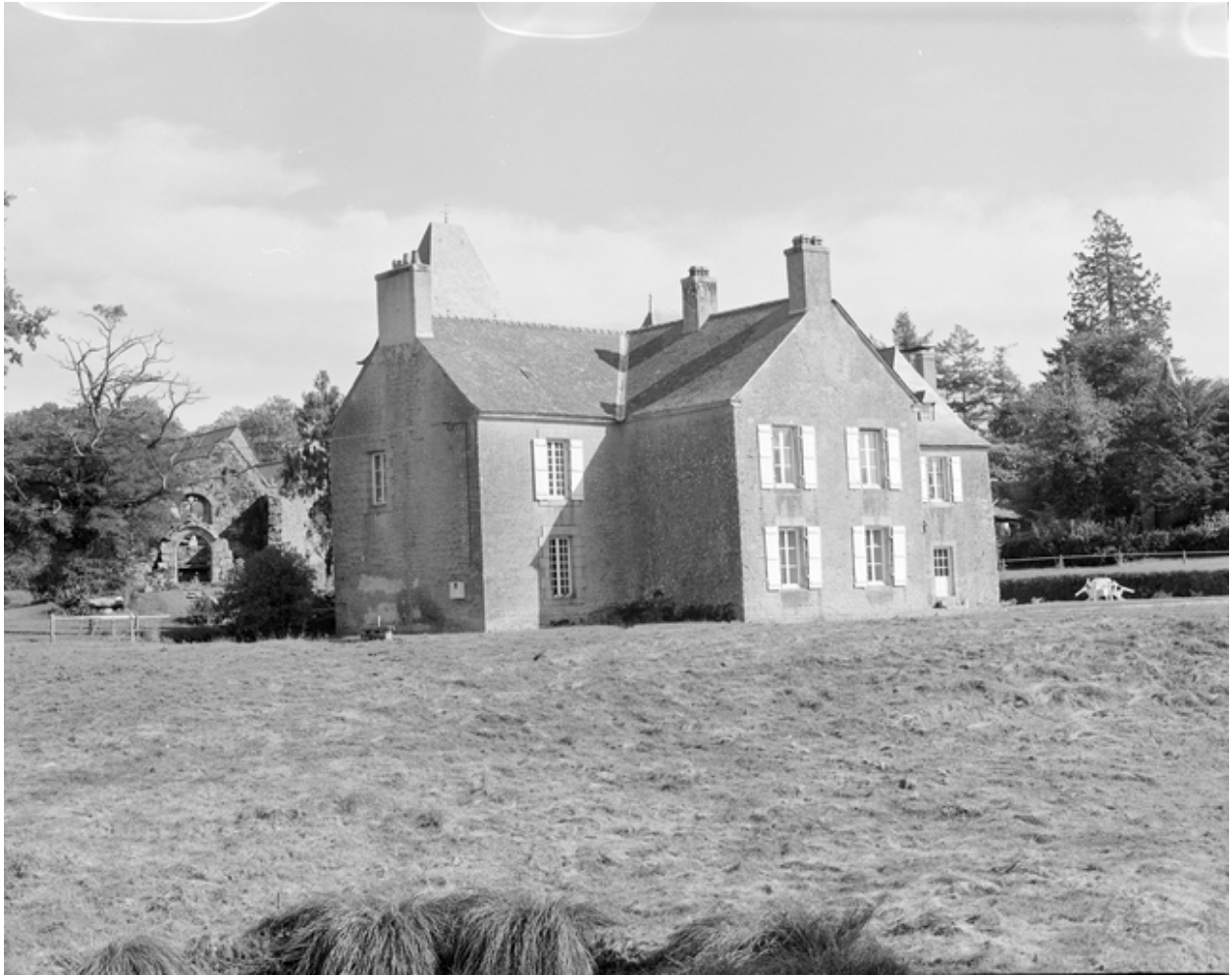
Château, vue générale ouest.