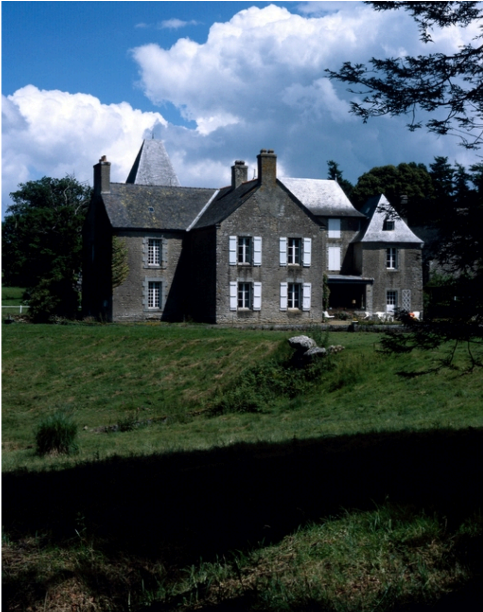
Château, vue générale sud-ouest.