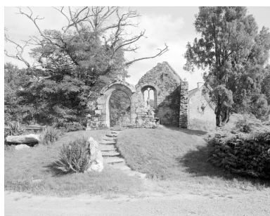
Chapelle, vue générale sud. IVR53_19873500250X