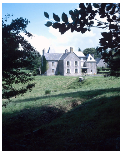
Château, vue générale sud-ouest. IVR53_19973500799XA