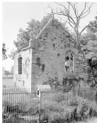
Chapelle, vue générale sud-est. IVR53_19873500253X