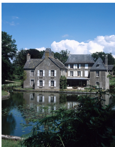
Château, vue générale sud-ouest.