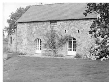
Vue générale de l'ancienne étable. IVR53_19843501454X