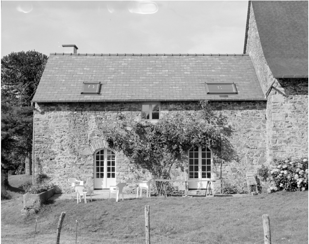
Logis, élévation est.