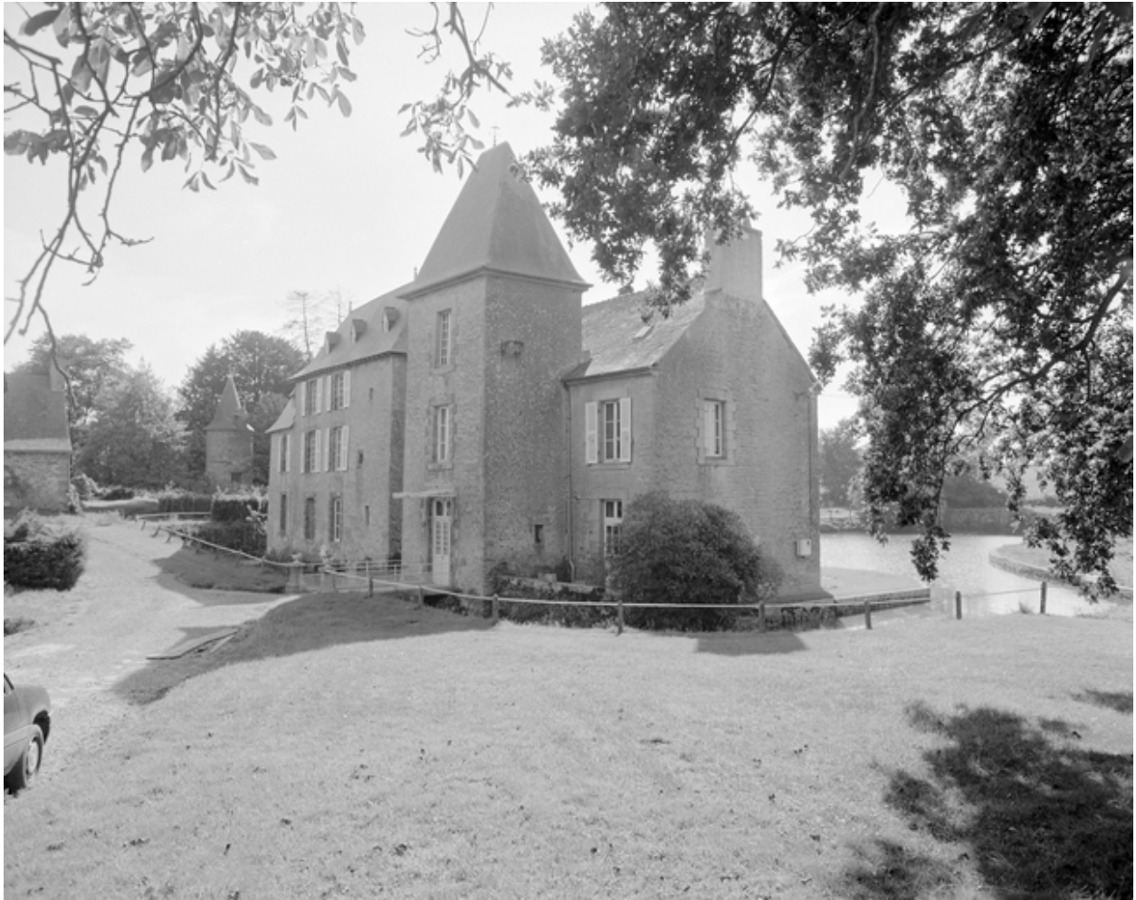
Château, vue générale nord-ouest.