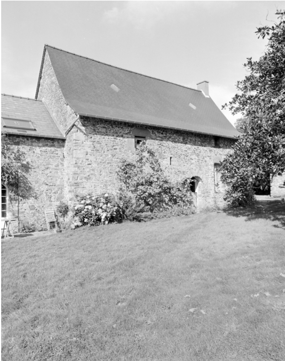
Ancienne étable, élévation est.