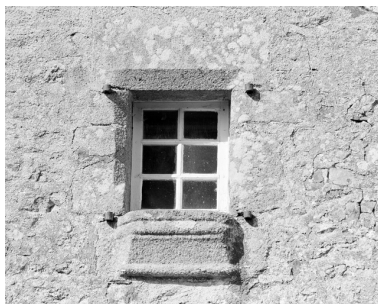
Château, mur sud, détail de la fenêtre.