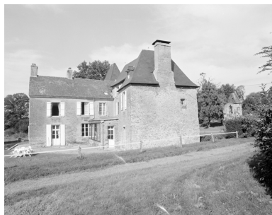
Château, vue générale sud.