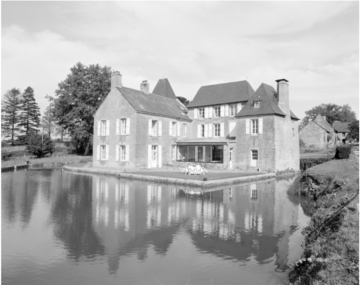
Château, vue générale sud-ouest.