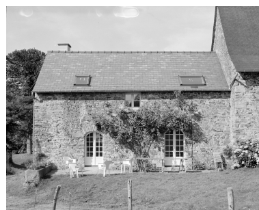
Logis, élévation est. IVR53_19873500258X