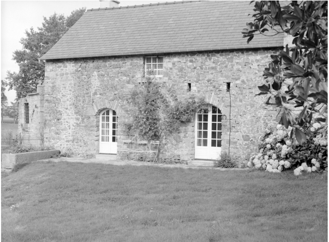
Vue générale de l'ancienne étable.