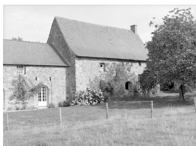
Ferme, vue générale du sud-est. IVR53_19843501452X