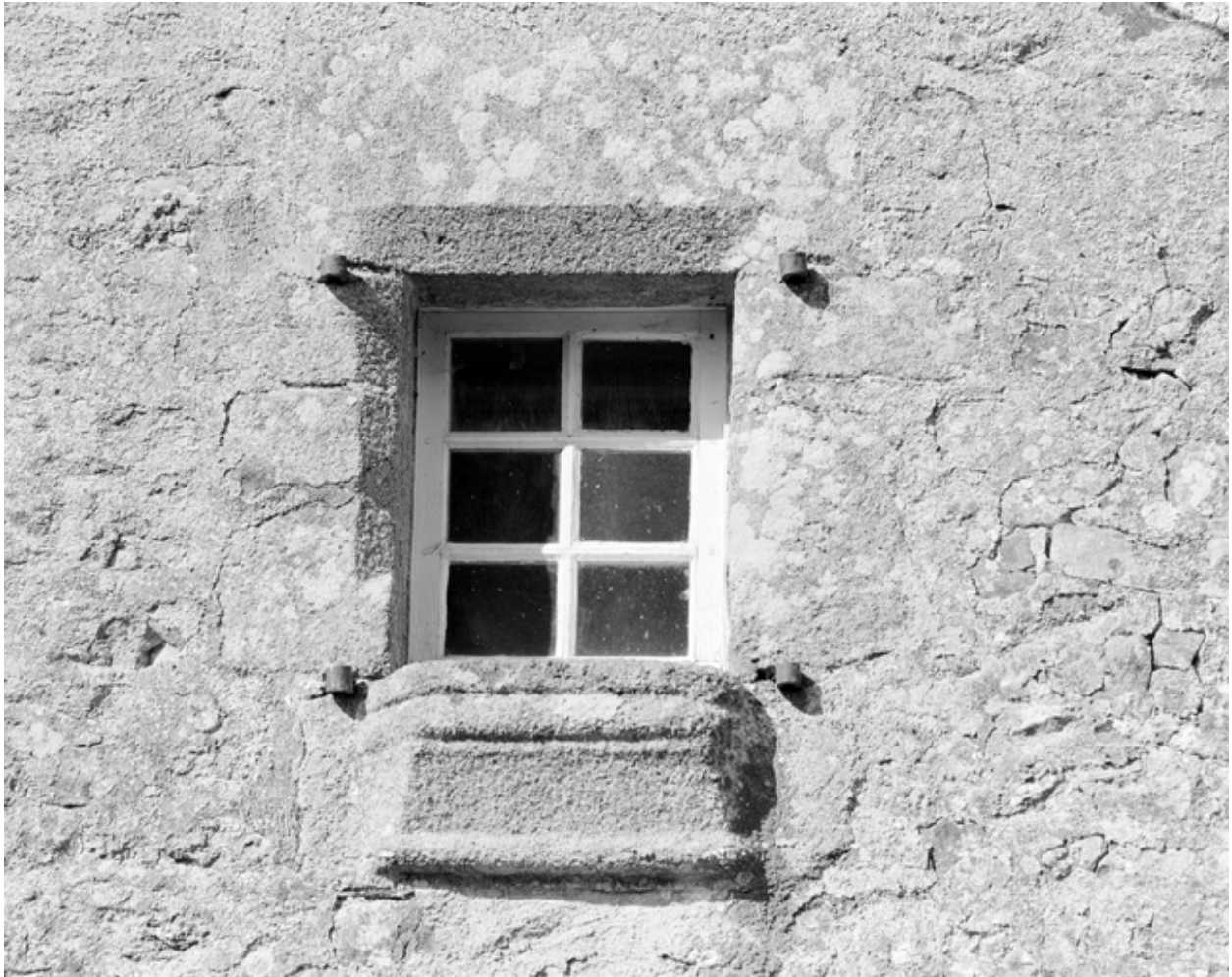
Château, mur sud, détail de la fenêtre.