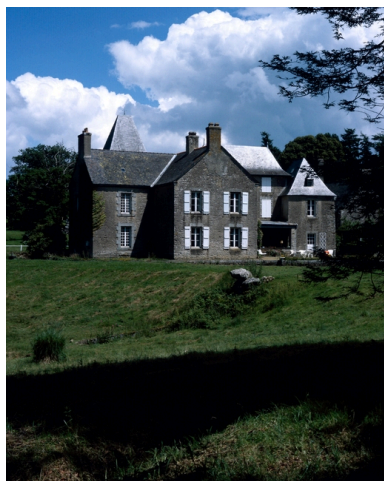
Château, vue générale sud-ouest. IVR53_19973500802XA