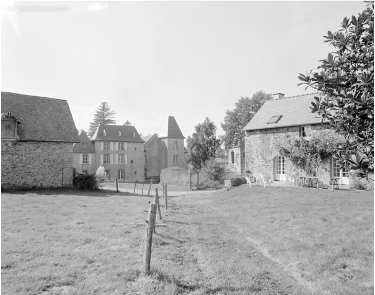
Vue de situation nord.