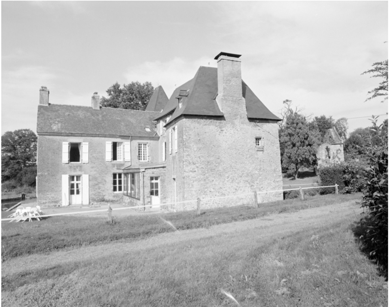
Château, vue générale sud.