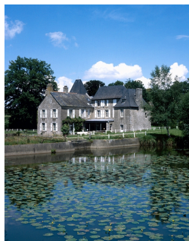
Château, vue générale sud-ouest.