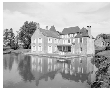
Château, vue générale sud-ouest. IVR53_19873500251X