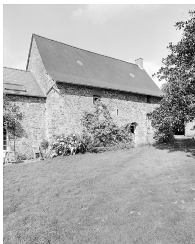
Ancienne étable, élévation est. IVR53_19873500256X