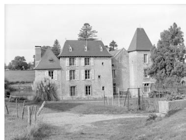
Château, vue générale nord-est.