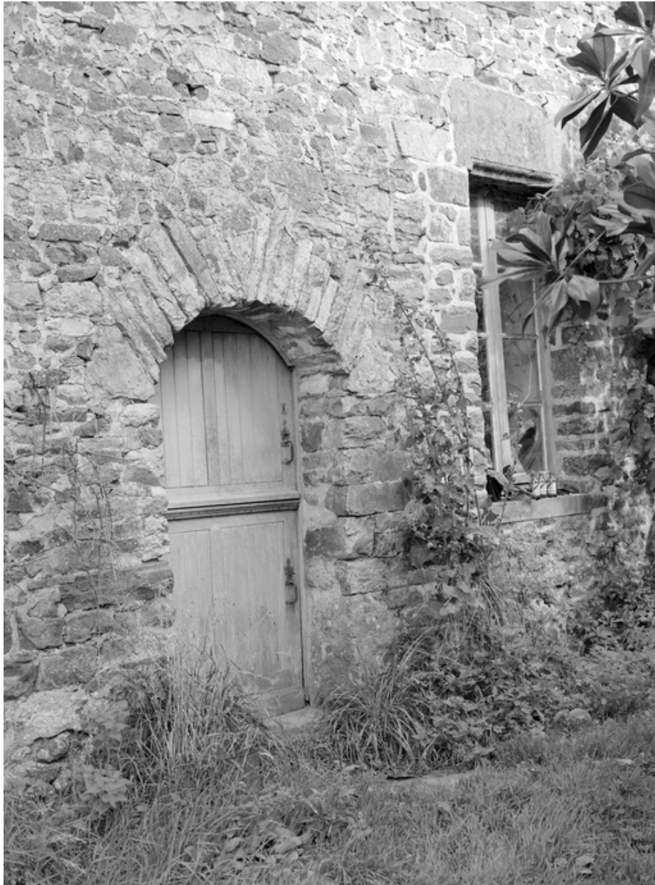
Vue de détail de la porte de la ferme.