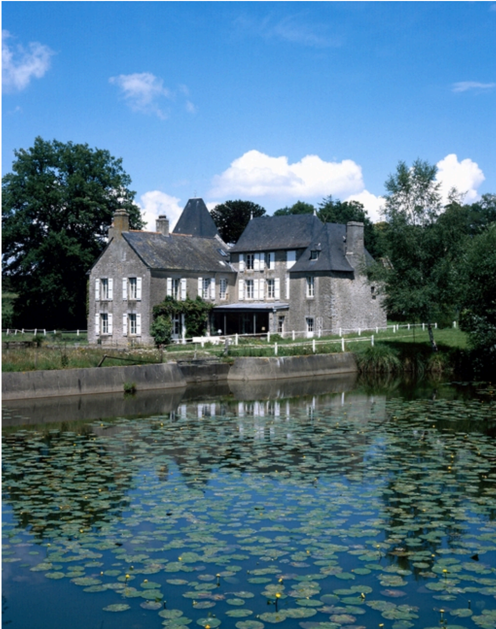
Château, vue générale sud-ouest.