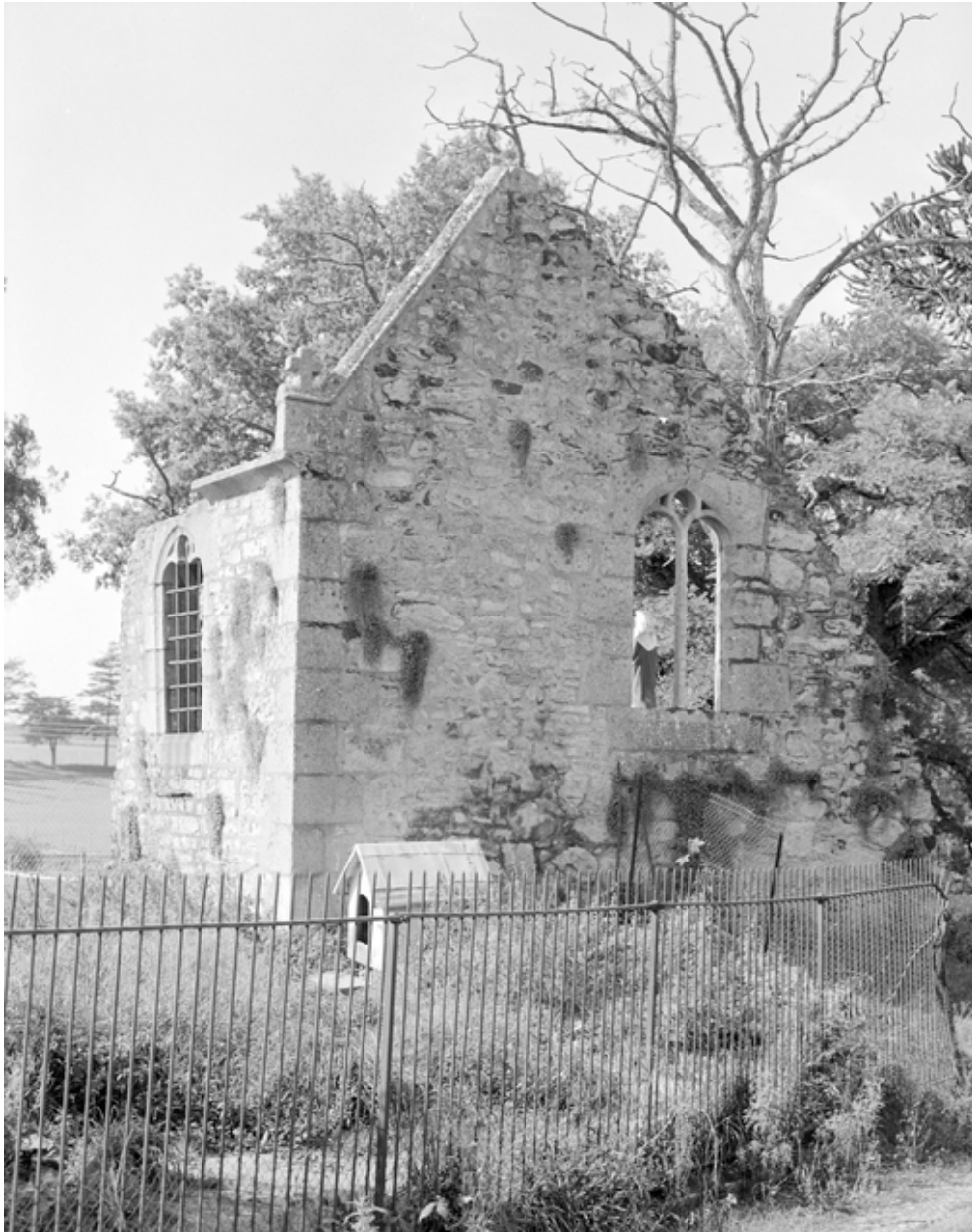
Chapelle, vue générale sud-est.