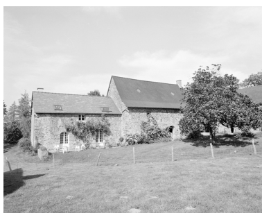
Vue générale est de la ferme et des étables. IVR53_19873500254X