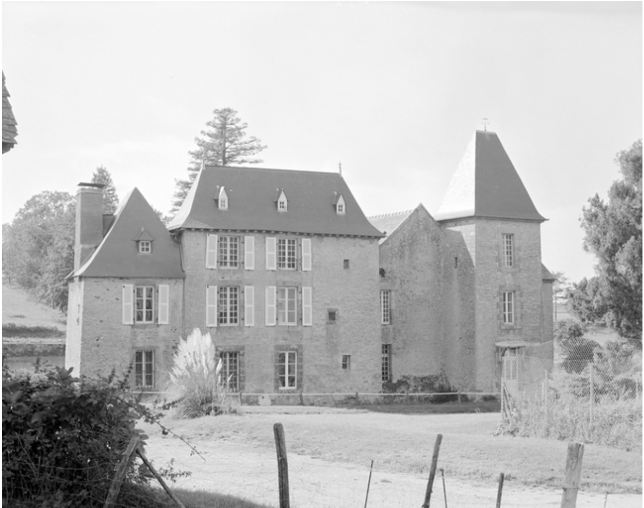
Château, vue générale nord.