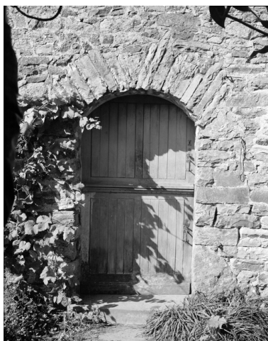
Logis, détail de la porte. IVR53_19873500259X