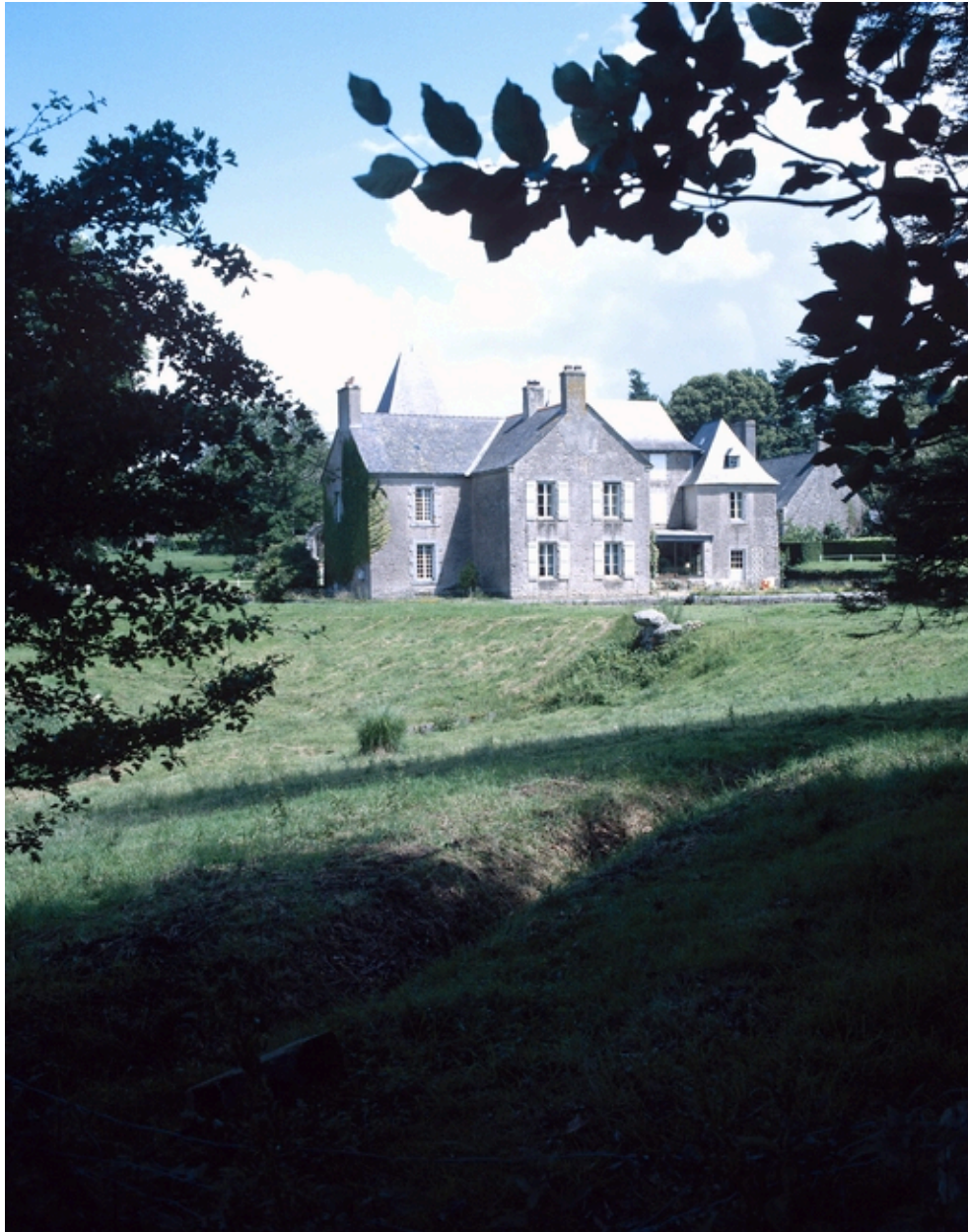
Château, vue générale sud-ouest.