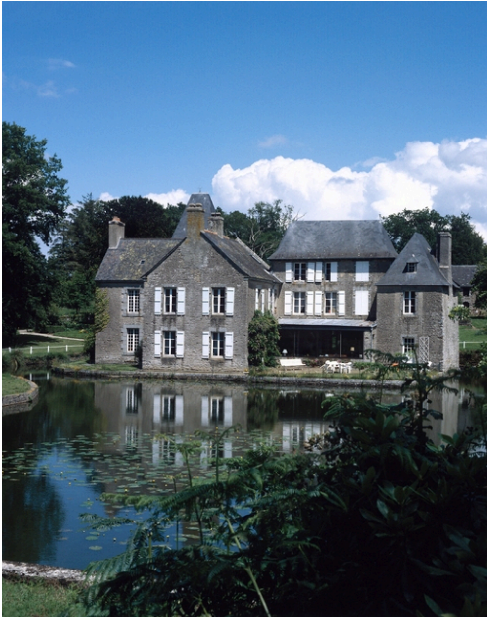
Château, vue générale sud-ouest.