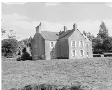
Château, vue générale ouest. IVR53_19873500261X