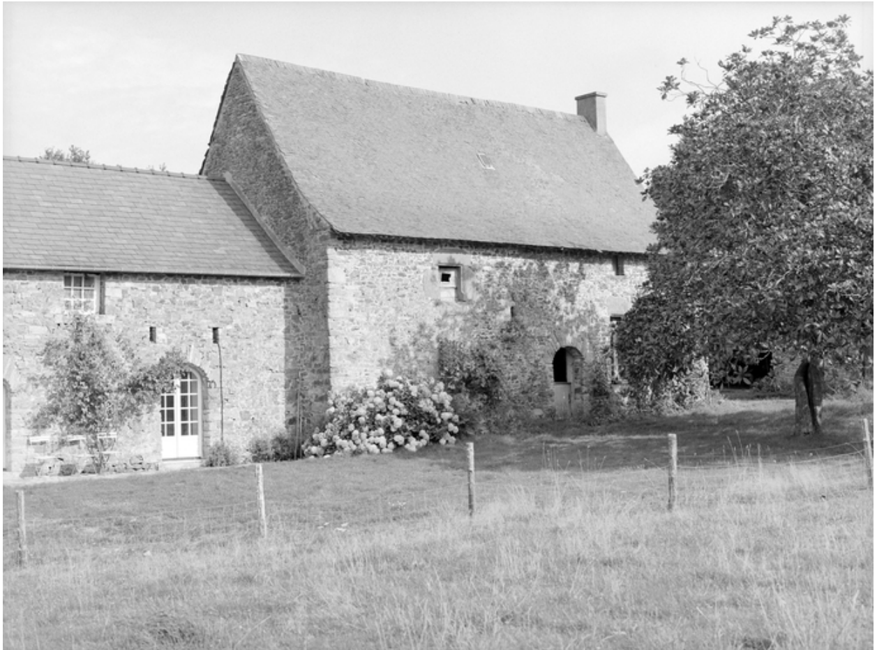
Ferme, vue générale du sud-est.