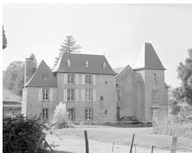
Château, vue générale nord. IVR53_19873500257X