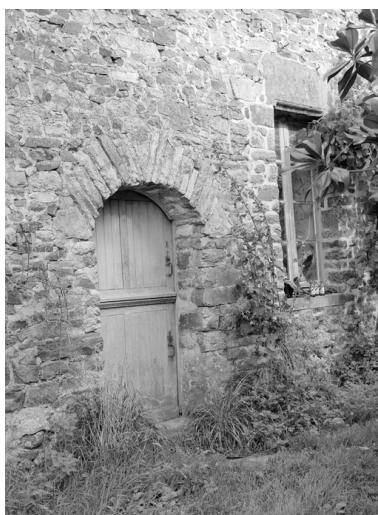
Vue de détail de la porte de la ferme. IVR53_19843501453X