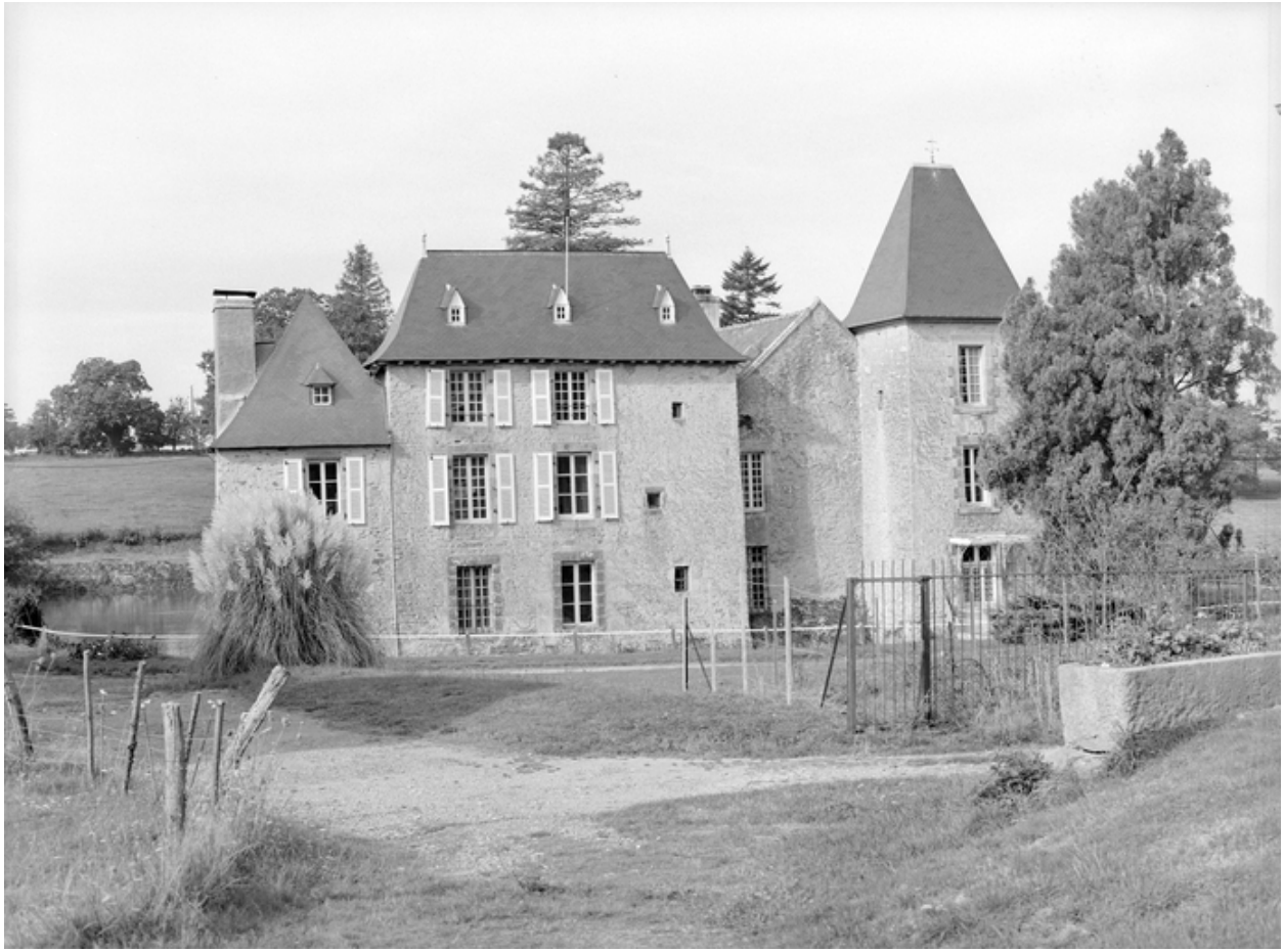
Château, vue générale nord-est.