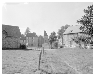
Vue de situation nord.