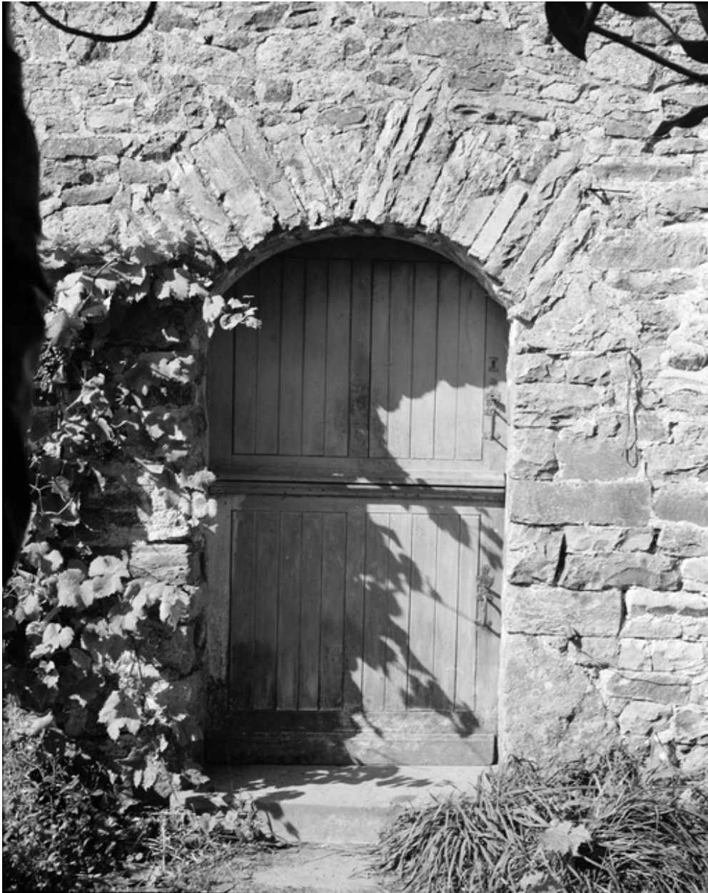
Logis, détail de la porte.