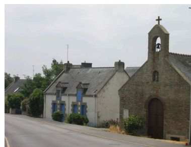
Chapelle Sainte-Anne IVR53_20075605750NUCA