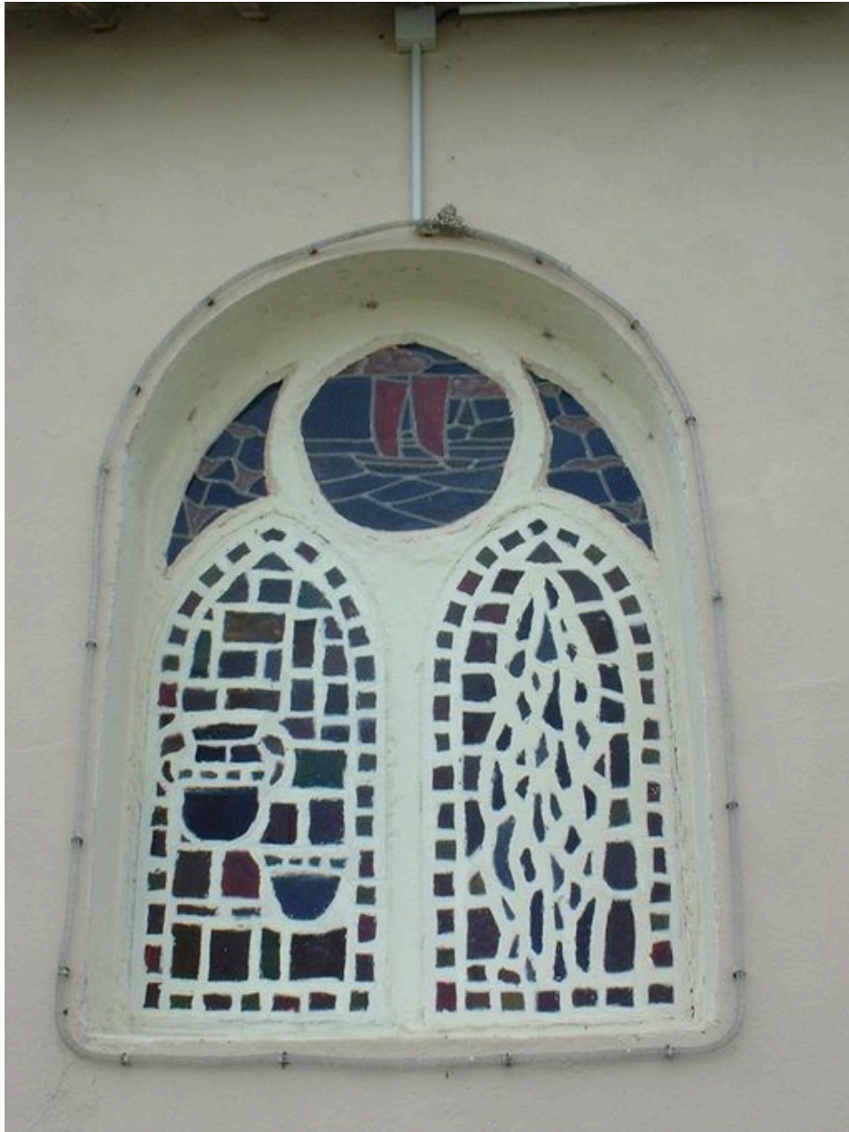
Vitrail de la chapelle Sainte-Anne