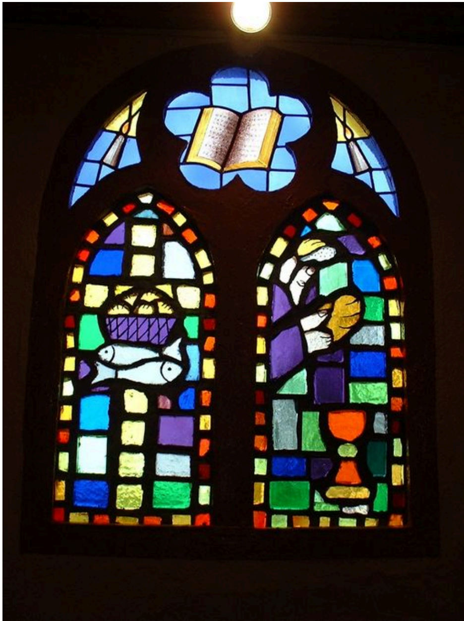
Vitrail de la chapelle Sainte-Anne