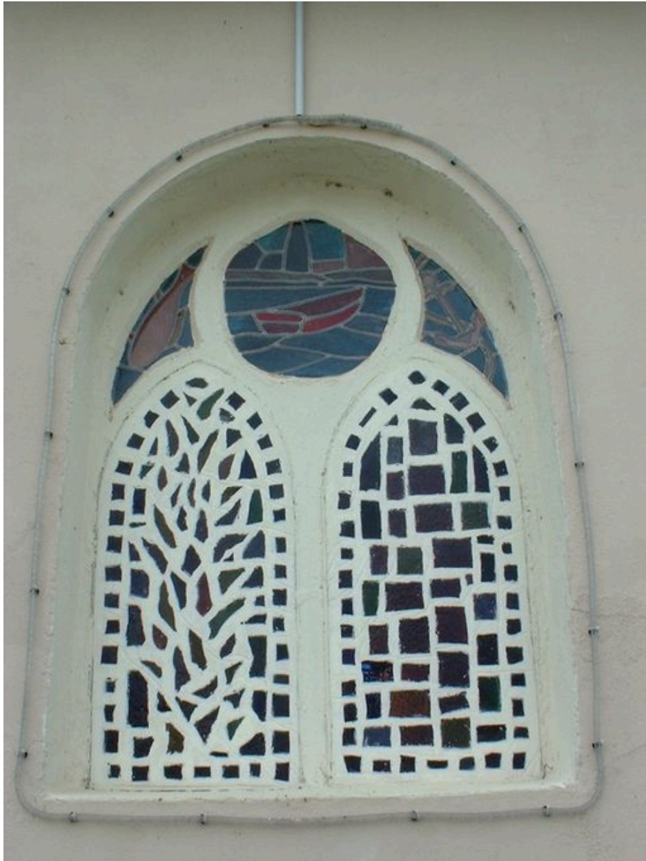
Vitrail de la chapelle Sainte-Anne