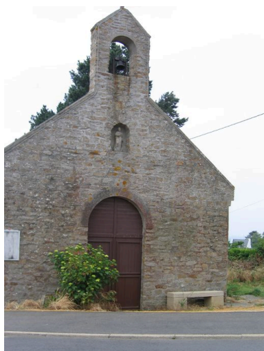
Chapelle Sainte-Anne