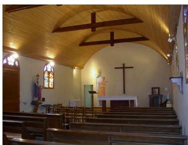
Vue de l'intérieur de la chapelle Sainte-Anne