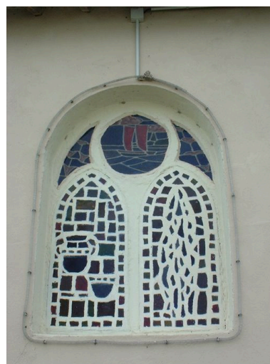
Vitrail de la chapelle Sainte-Anne