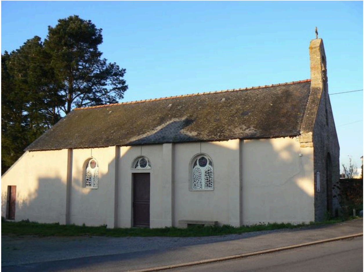
Vue générale de la chapelle Sainte-Anne