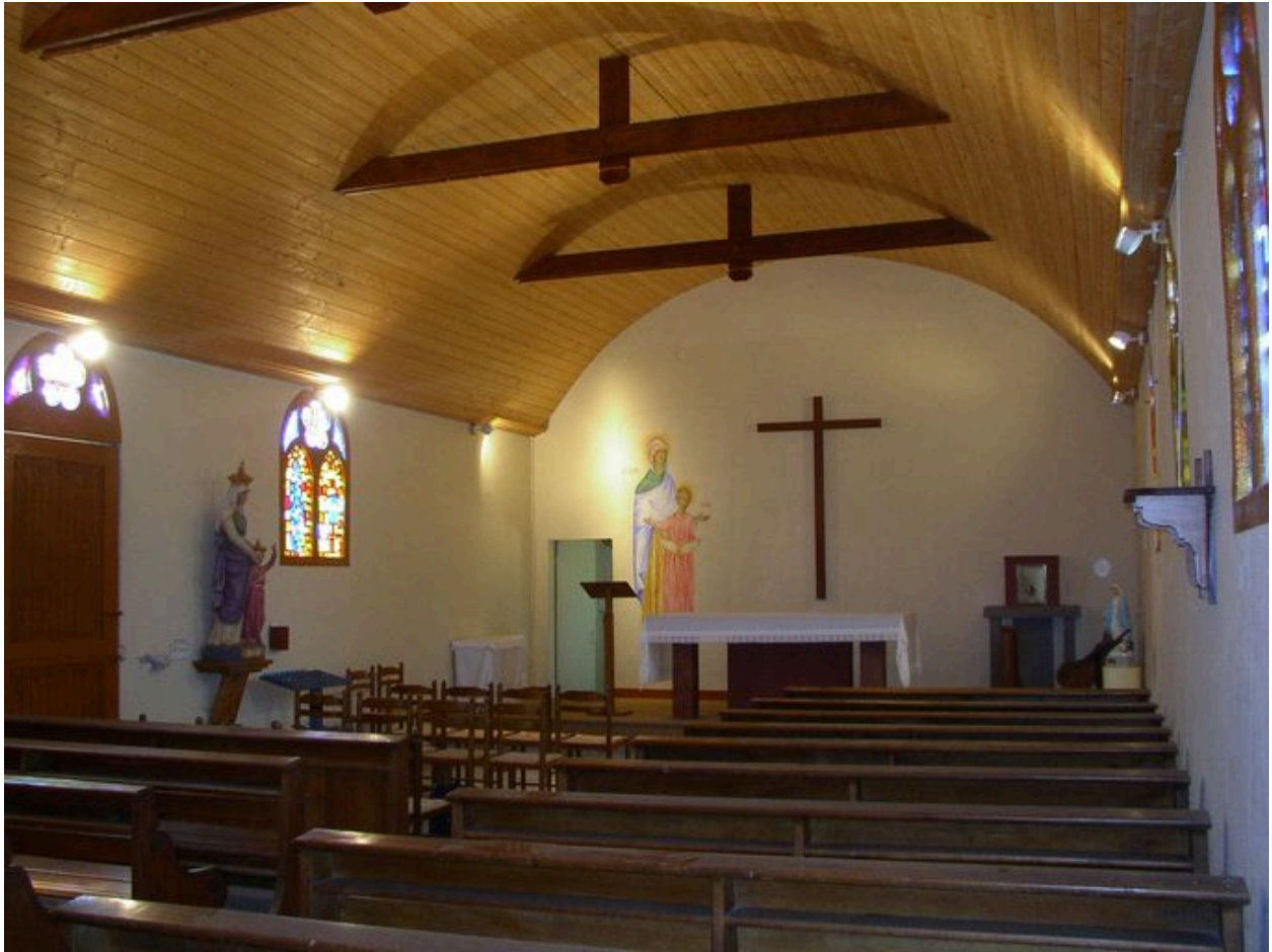
Vue de l'intérieur de la chapelle Sainte-Anne