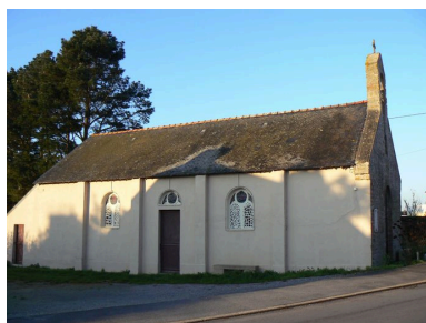
Vue générale de la chapelle Sainte-Anne