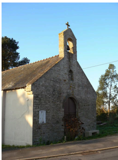
Chapelle Sainte-Anne IVR53_20075605749NUCA