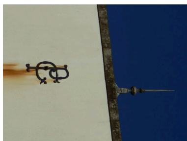
Détail décoratif de la façade principale de l'Hôtel du Pouldu rappelant le nom des deux familles successivement propriétaires : Portier-Goulven IVR53_20072909104NUCA