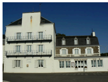
Façade principale de l'Hôtel du Pouldu IVR53_20072909100NUCA