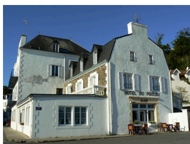
Façade nord-est de l'Hôtel du Pouldu IVR53_20072909101NUCA