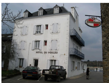
Façade sud-ouest de l'Hôtel du Pouldu