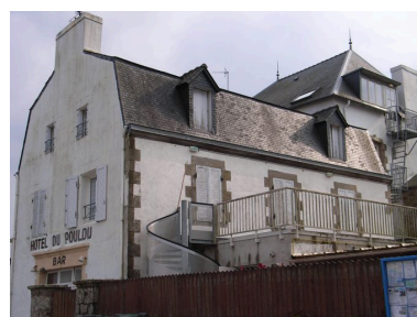
Façade nord de l'Hôtel du Pouldu IVR53_20072909102NUCA