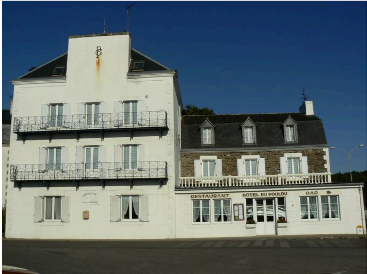
Façade principale de l'Hôtel du Pouldu