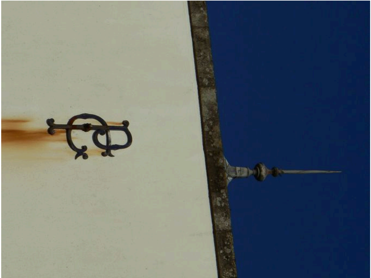
Détail décoratif de la façade principale de l'Hôtel du Pouldu rappelant le nom des deux familles successivement propriétaires : Portier-Goulven