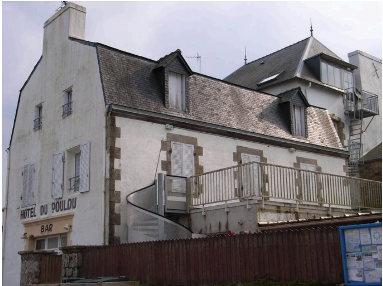
Façade nord de l'Hôtel du Pouldu