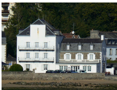
Vue générale de l'Hôtel de Pouldu IVR53_20072909099NUCA

Publicité pour l'Hôtel du Pouldu parue dans le bulletin municipal de Clohars-Carnoët en 1988 IVR53_20072909105NUCA