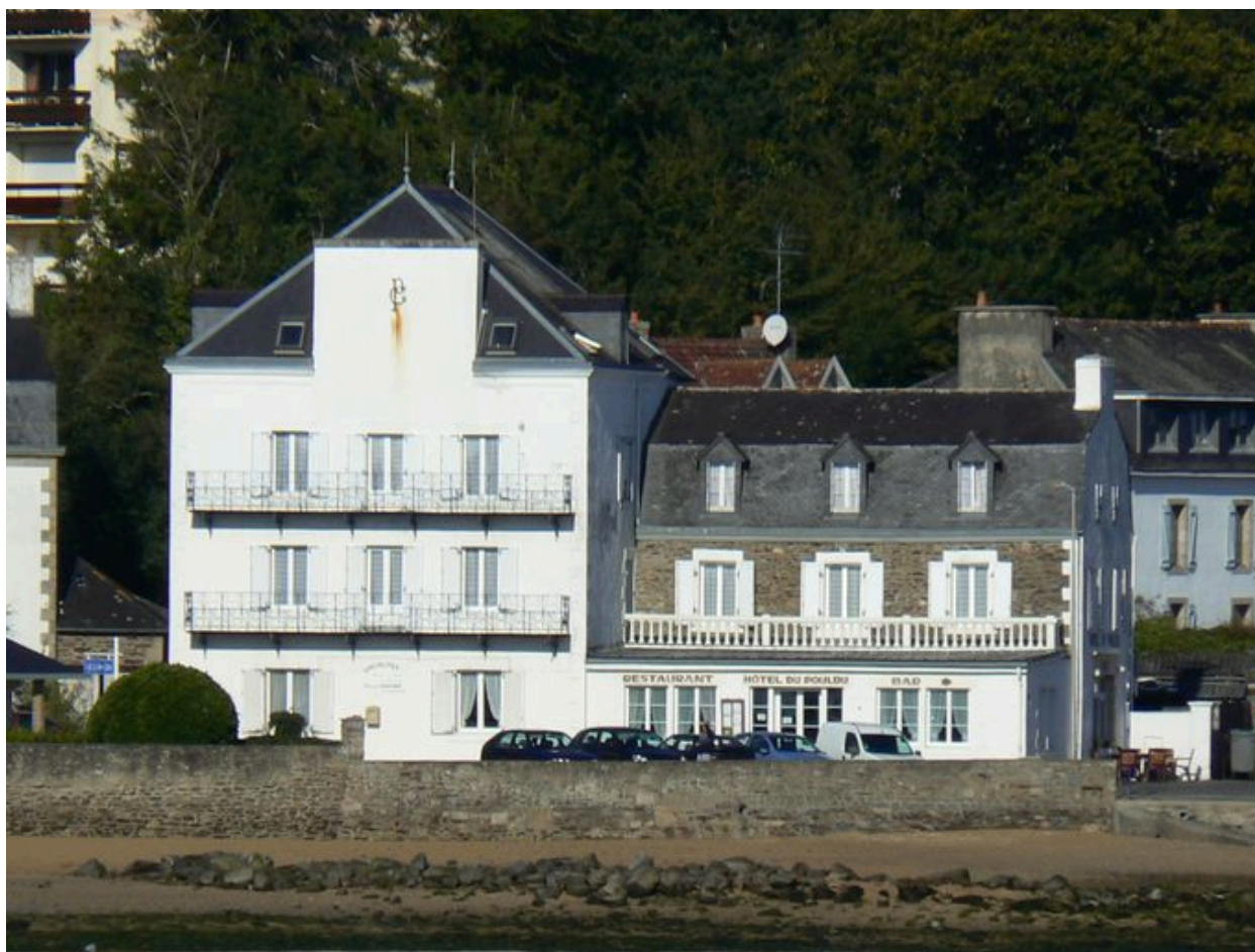
Vue générale de l'Hôtel de Pouldu