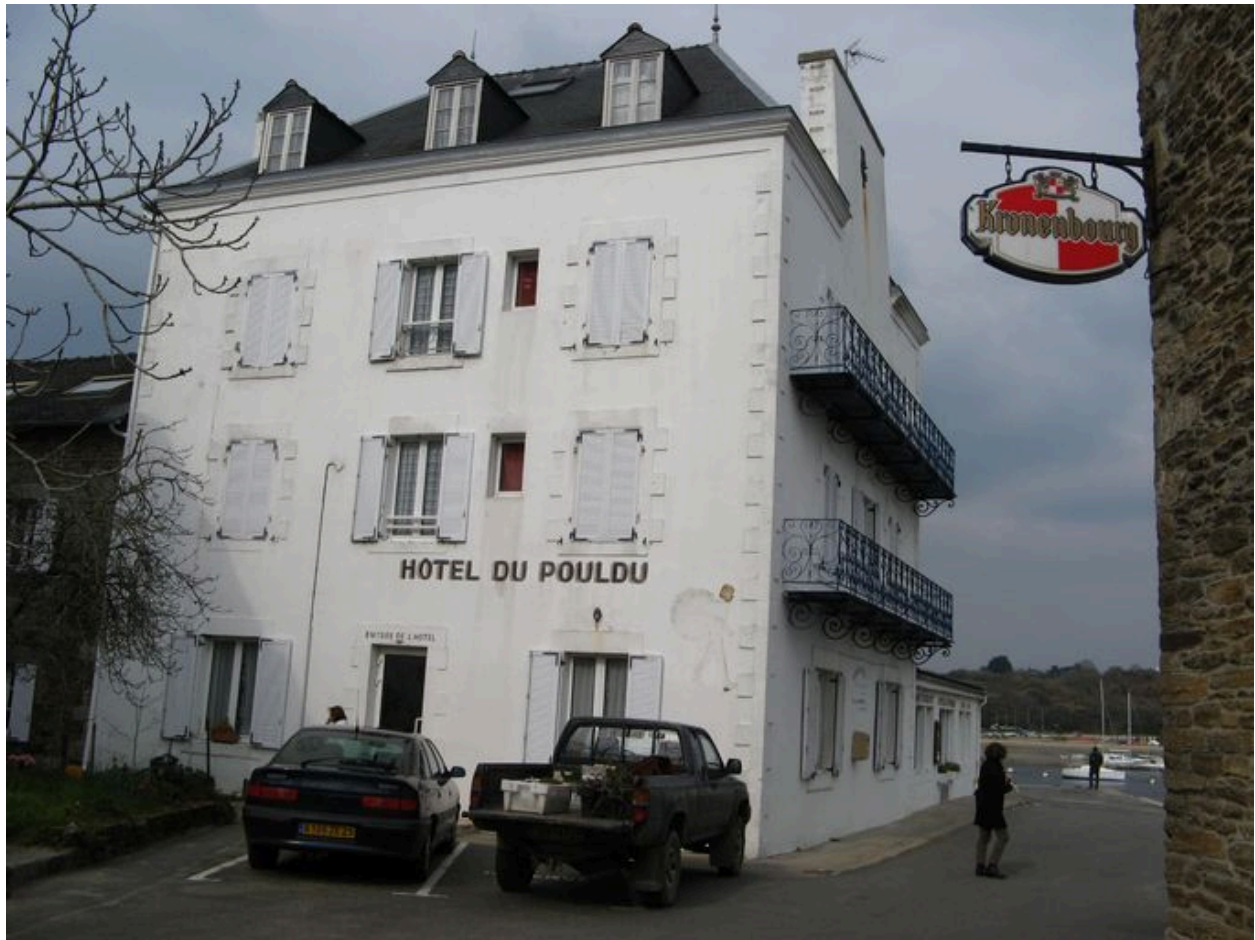
Façade sud-ouest de l'Hôtel du Pouldu