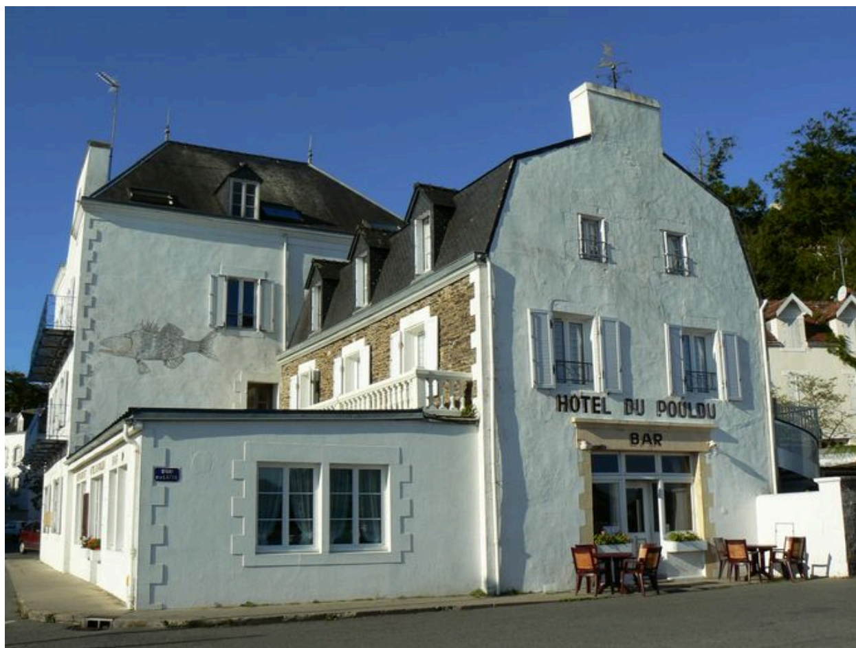
Façade nord-est de l'Hôtel du Pouldu