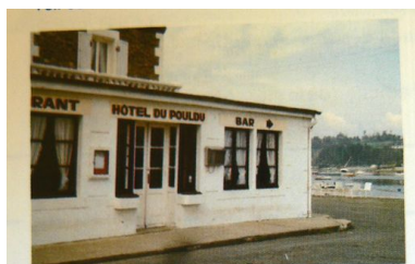
Hôtel du POULDU 17 chambres W.-C. - 15 douches - 2 bains. 150 à 250 F. - Pet. déj. 20 F. Repas 62 à 130 F. + carte. Vue sur port et estuaire de La Laita. Fruits de mer - spécialités de poissons. POULDU PORT - Tél. 98.39.90.66.

Publicité pour l'Hôtel du Pouldu parue dans le bulletin municipal de Clohars-Carnoët en 1988 IVR53_20072909105NUCA