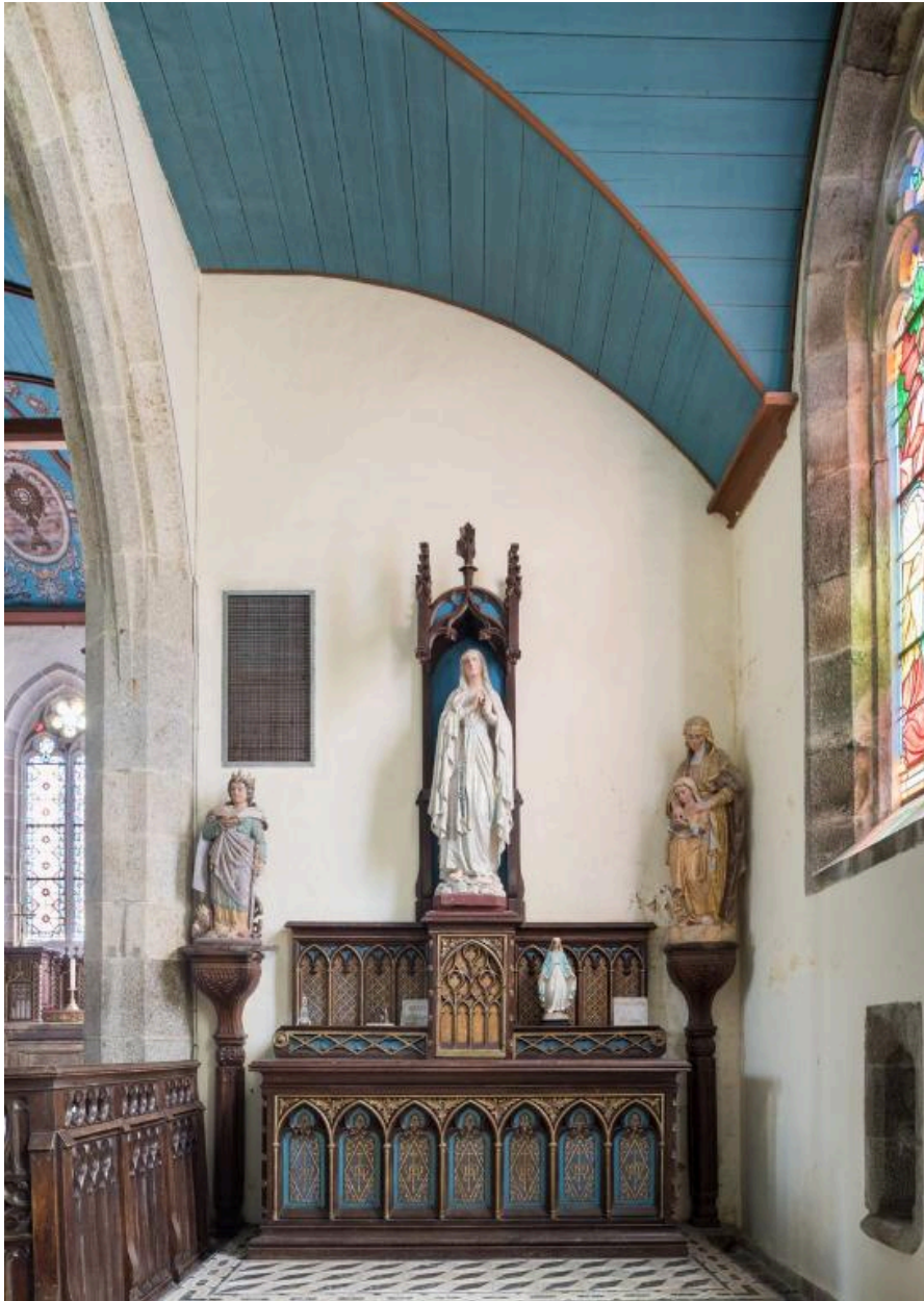
Vue du mur est du bras du transept sud