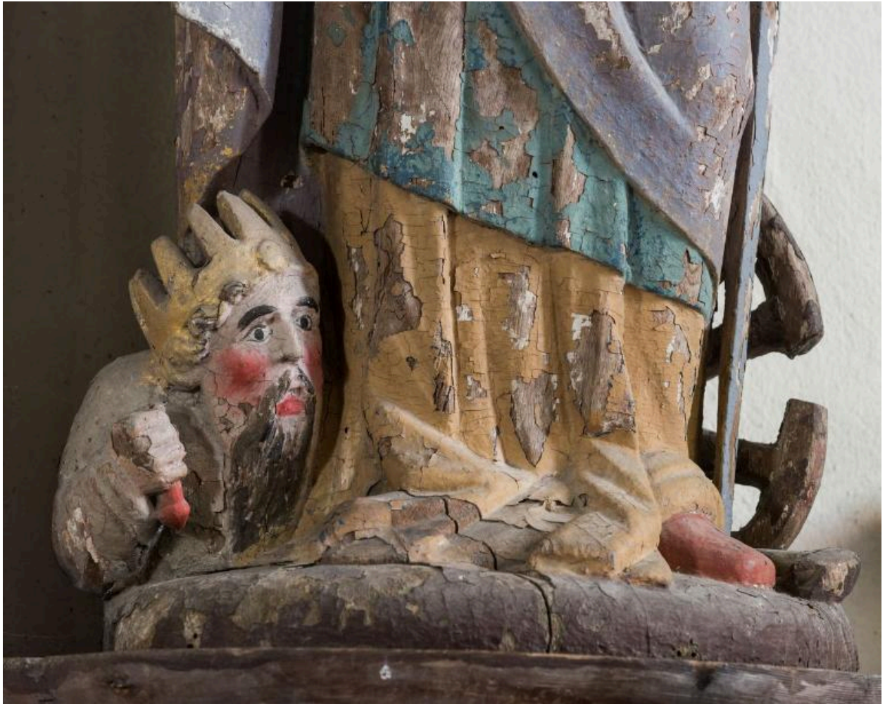
Vue de détail : statue de sainte Catherine d'Alexandrie foulant aux pieds Maximilien