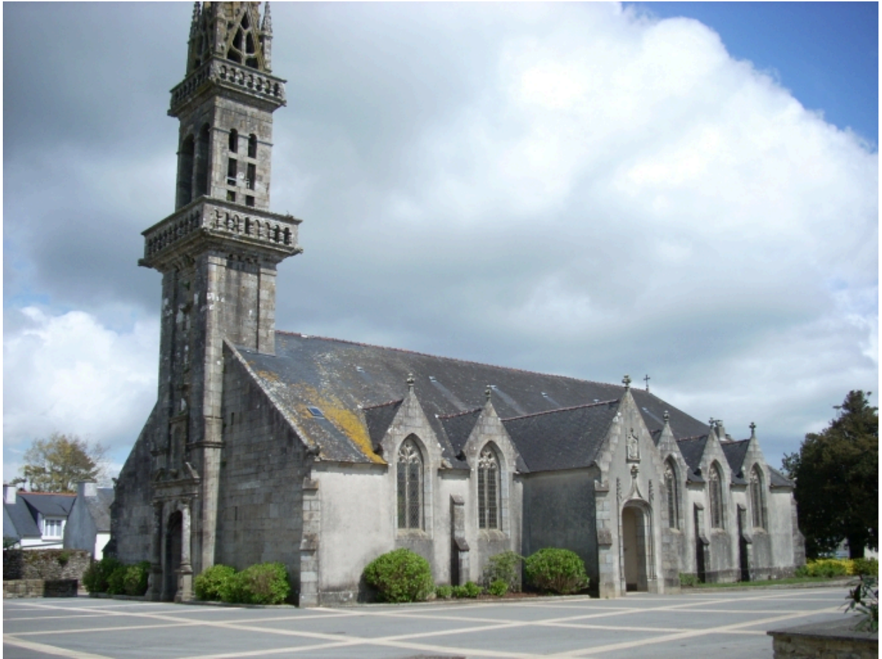
Plouyé, église paroissiale Saint-Joseph : vue générale sud-ouest