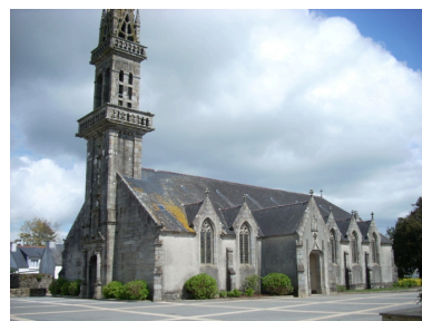
Plouyé, église paroissiale Saint-Joseph : vue générale sud-ouest IVR53_20082905847NUCA