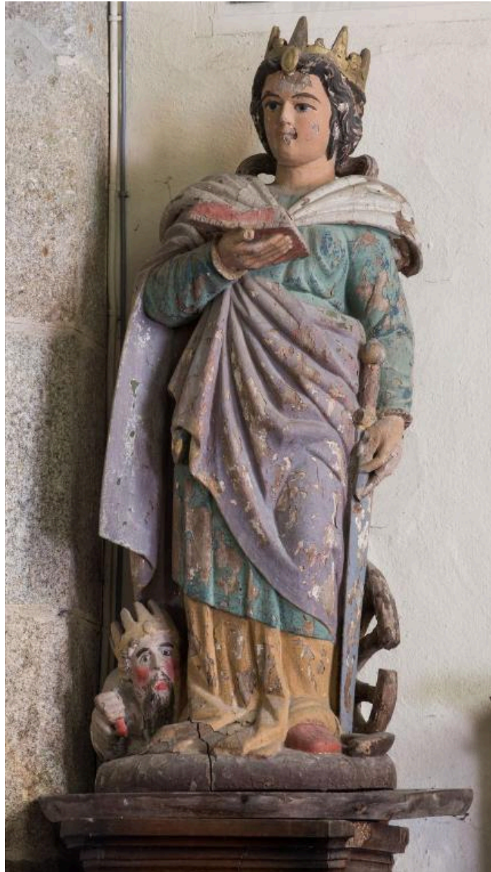
Statue de sainte Catherine d'Alexandrie