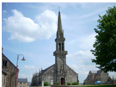
Plouyé, église paroissiale Saint-Joseph : vue générale nord-ouest