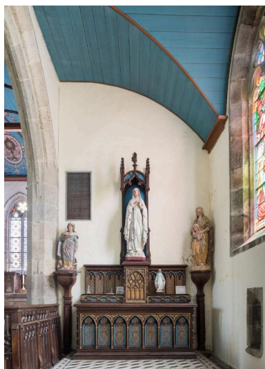
Vue du mur est du bras du transept sud IVR53_20212900131NUCA

Plouyé, église paroissiale Saint-Joseph : porche sud IVR53_20082905848NUCA