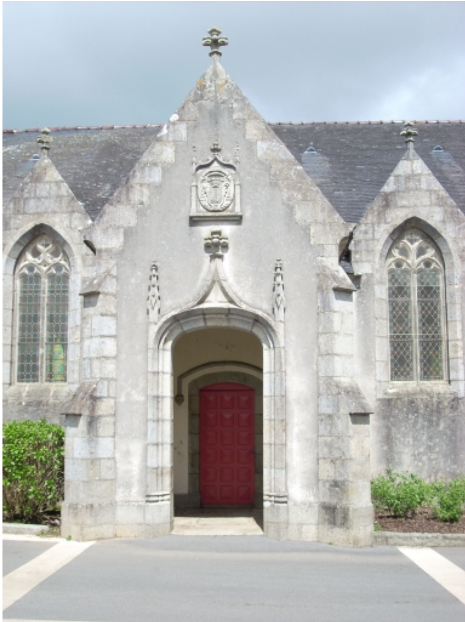
Plouyé, église paroissiale Saint-Joseph : porche sud