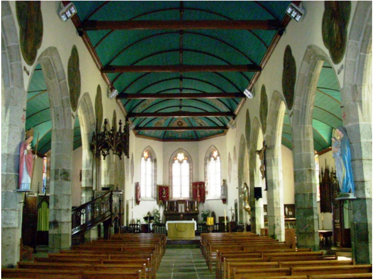
Plouyé, église paroissiale Saint-Joseph : vue axiale est