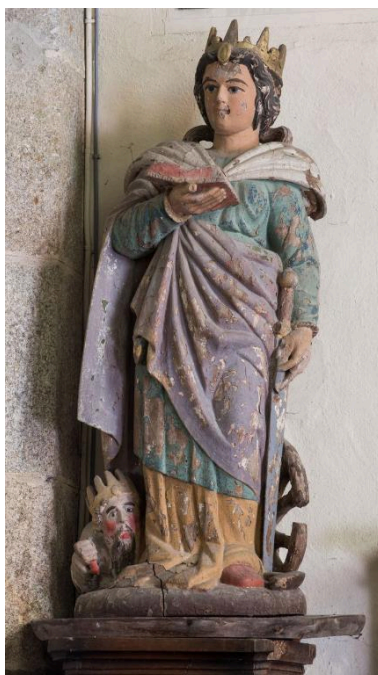
Statue de sainte Catherine d'Alexandrie IVR53_20212900132NUCA