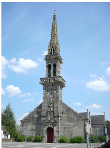
Plouyé, église paroissiale Saint-Joseph : vue générale sud-ouest IVR53_20082905846NUCA