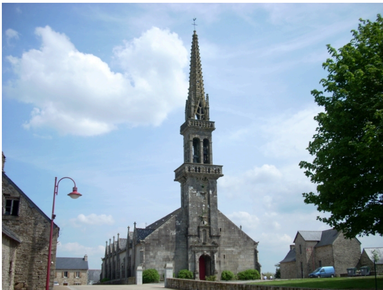
Plouyé, église paroissiale Saint-Joseph : vue générale nord-ouest