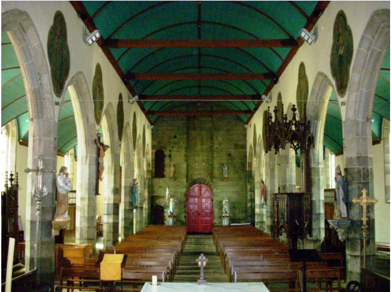
Plouyé, église paroissiale Saint-Joseph : vue axiale ouest