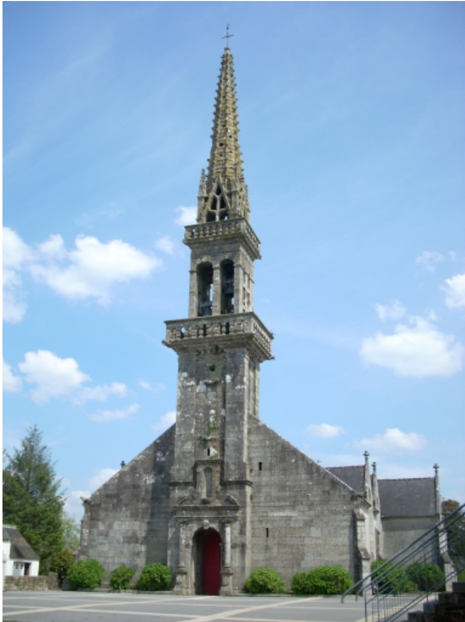
Plouyé, église paroissiale Saint-Joseph : vue générale sud-ouest