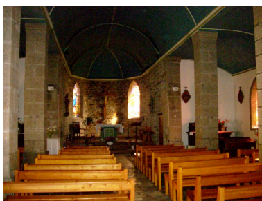
Lanvéoc, église paroissiale : vue transversale nord-est IVR53_20082905819NUCA