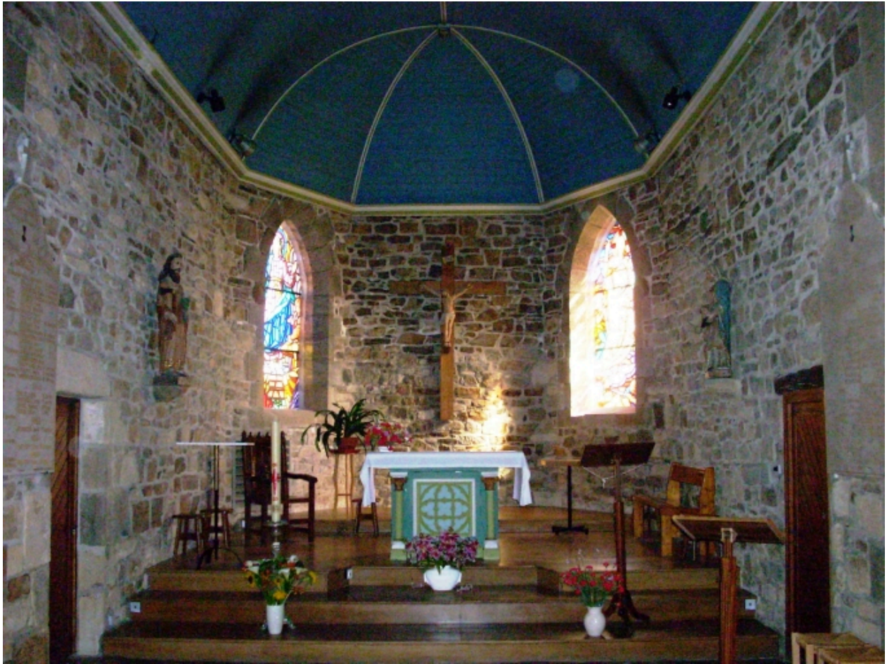
Lanvéoc, église paroissiale : vue du choeur