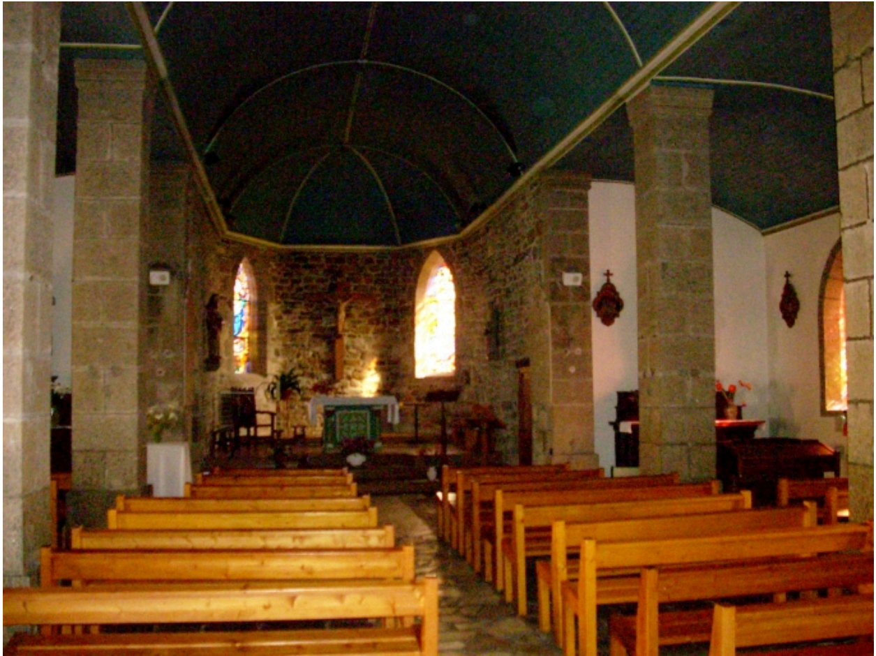
Lanvéoc, église paroissiale : vue transversale nord-est