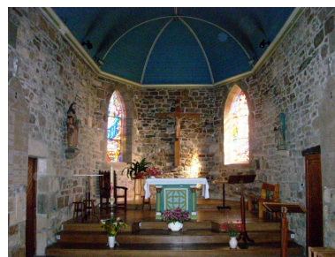
Lanvéoc, église paroissiale : vue du chœur IVR53_20082905820NUCA