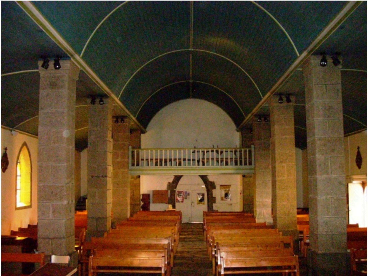
Lanvéoc, église paroissiale : vue axiale ouest