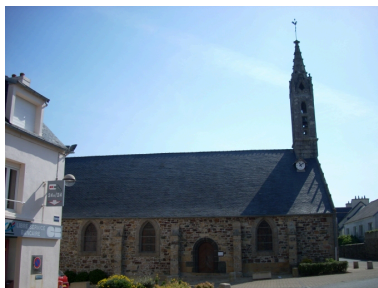
Lanvéoc, église paroissiale : vue générale nord-ouest IVR53_20082905816NUCA