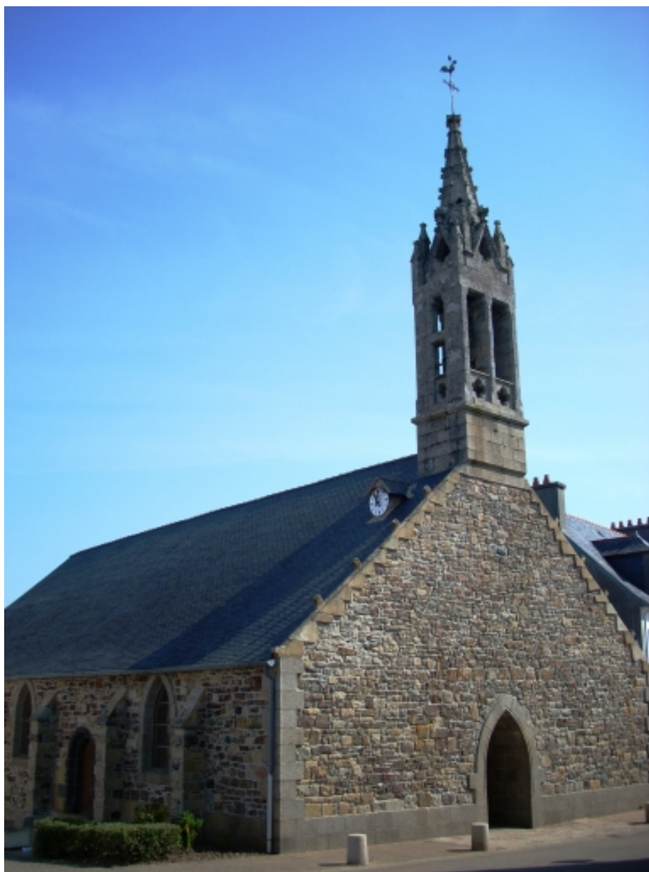
Lanvéoc, église paroissiale : vue générale nord-ouest