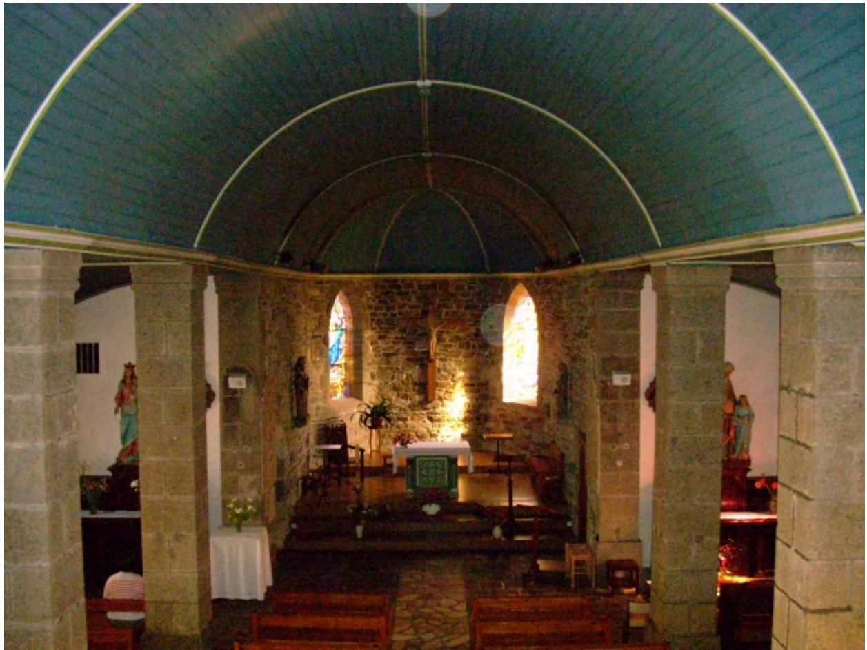
Lanvéoc, église paroissiale : vue axiale est depuis la tribune