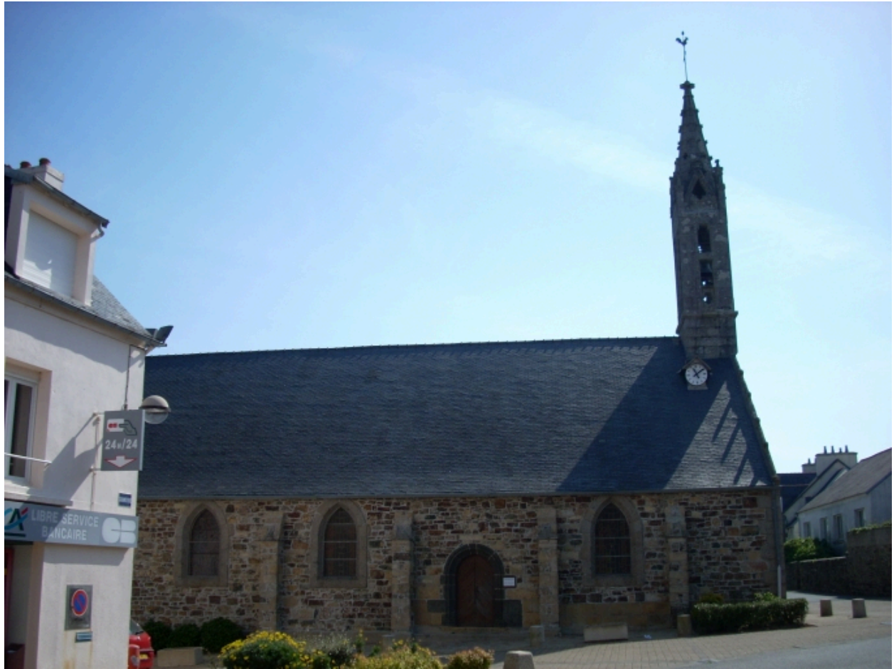
Lanvéoc, église paroissiale : vue générale nord-ouest