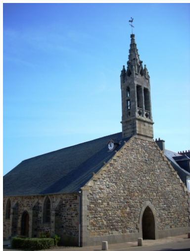
Lanvéoc, église paroissiale : vue générale nord-ouest IVR53_20082905815NUCA