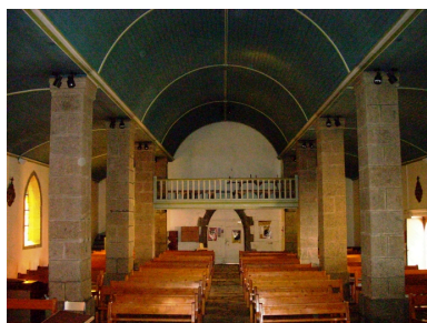
Lanvéoc, église paroissiale : vue axiale ouest IVR53_20082905818NUCA