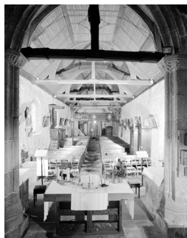
Intérieur, nef : vue générale.