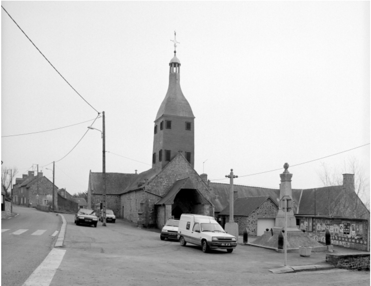
Elévation Sud-Ouest : vue générale