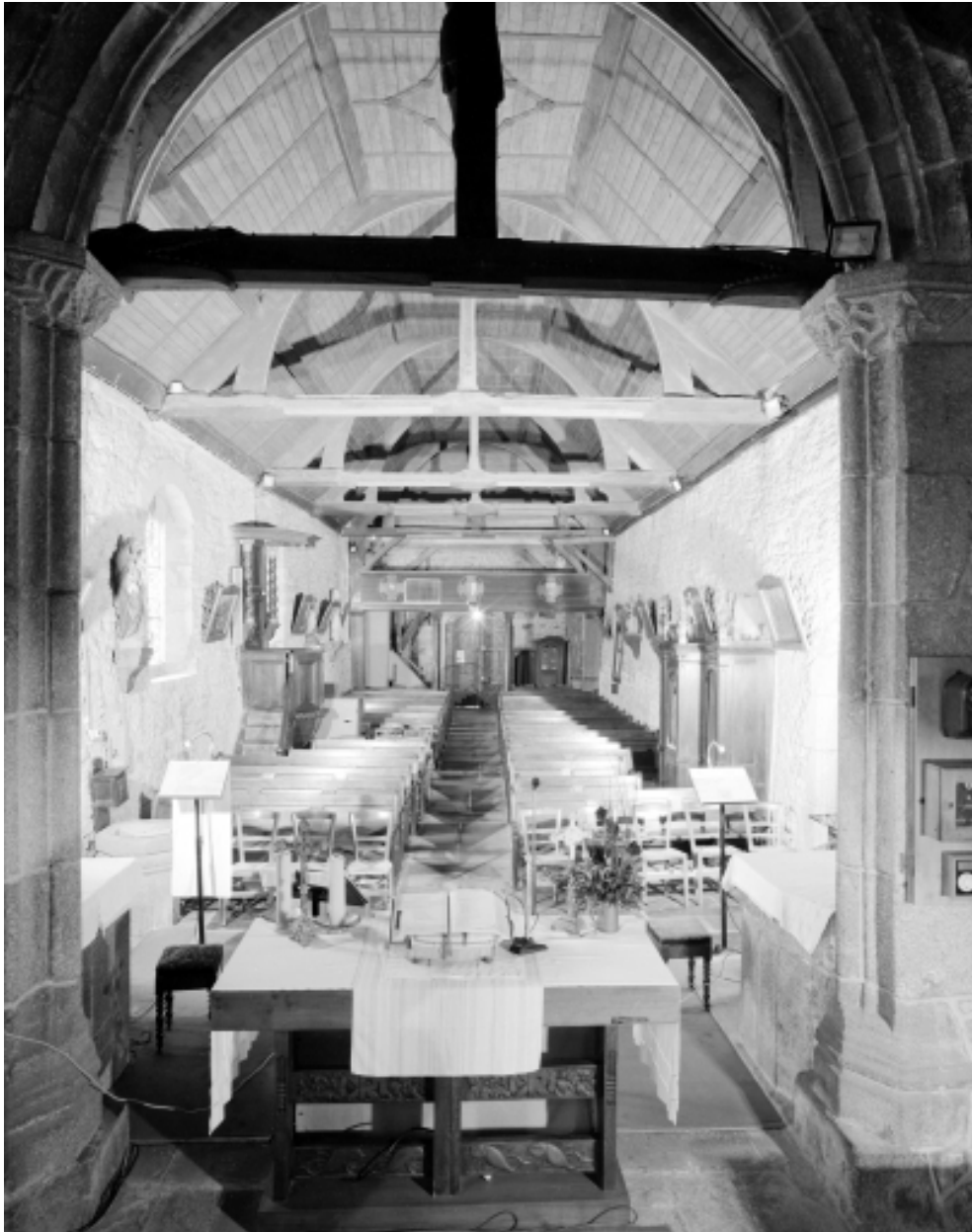
Intérieur, nef : vue générale.