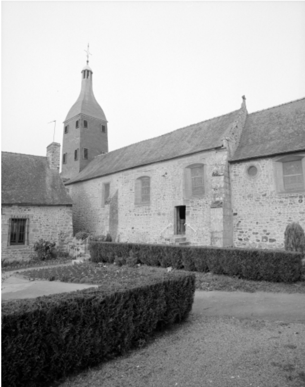
Elévation Sud-Ouest : vue générale