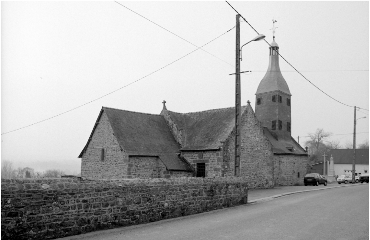
Elévation Nord : vue générale