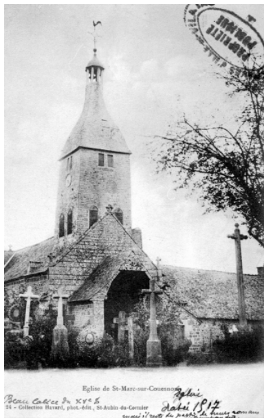
Elévation Ouest : vue générale (Carte postale ancienne, AD35 : 6Fi)