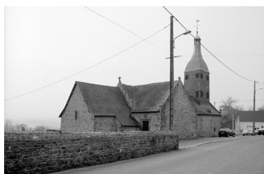
Elévation Nord : vue générale