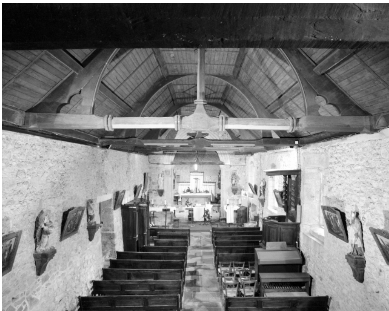
Intérieur : vue générale vers le chœur.