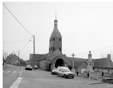
Elévation Sud-Ouest : vue générale