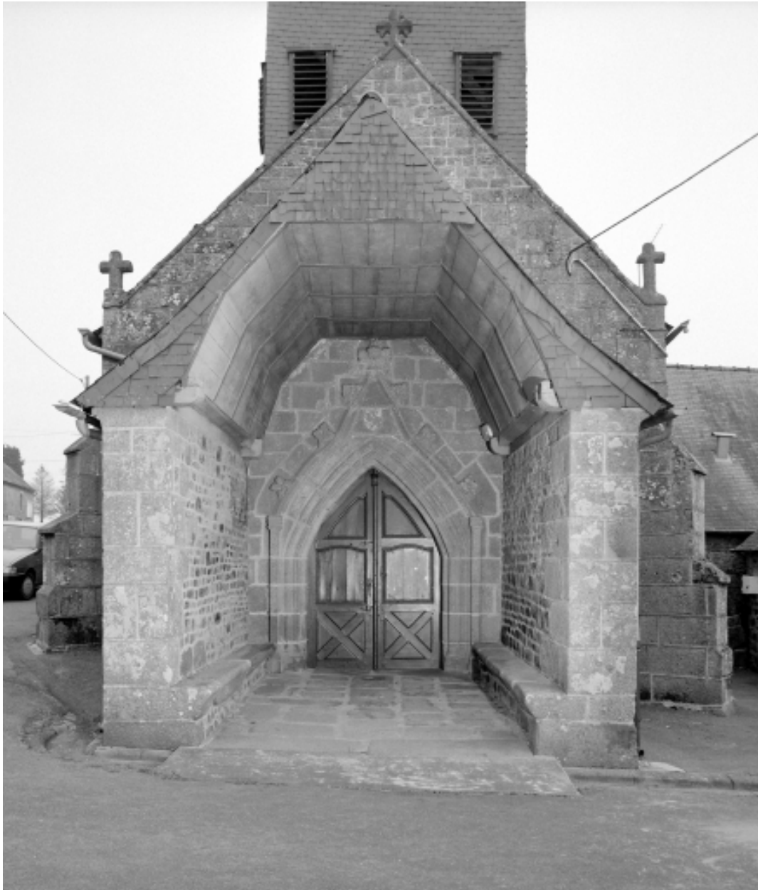
Elévation Ouest, porte principale : vue générale