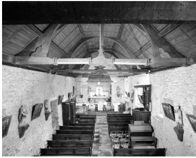
Intérieur : vue générale vers le choeur. IVR53_19933500681X