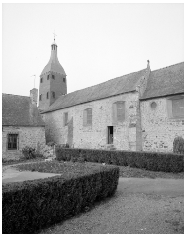
Elévation Sud-Ouest : vue générale