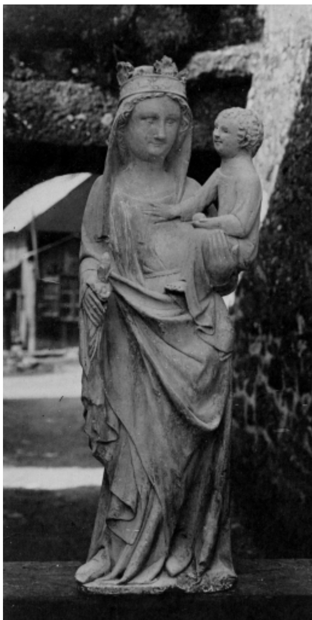
Statue : Vierge à l'Enfant, vue générale de face (repro., Fonds Bourde de la Rogerie, AD 35, 1 F 2108).