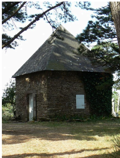
Guérite des douaniers de Barrarac'h