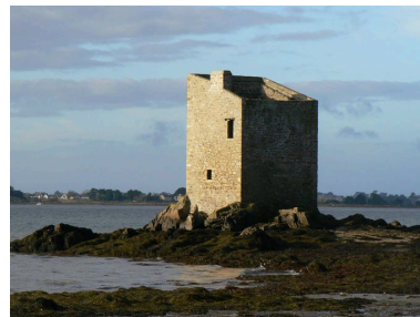
Tour de Ténéro IVR53_20085606125NUCA