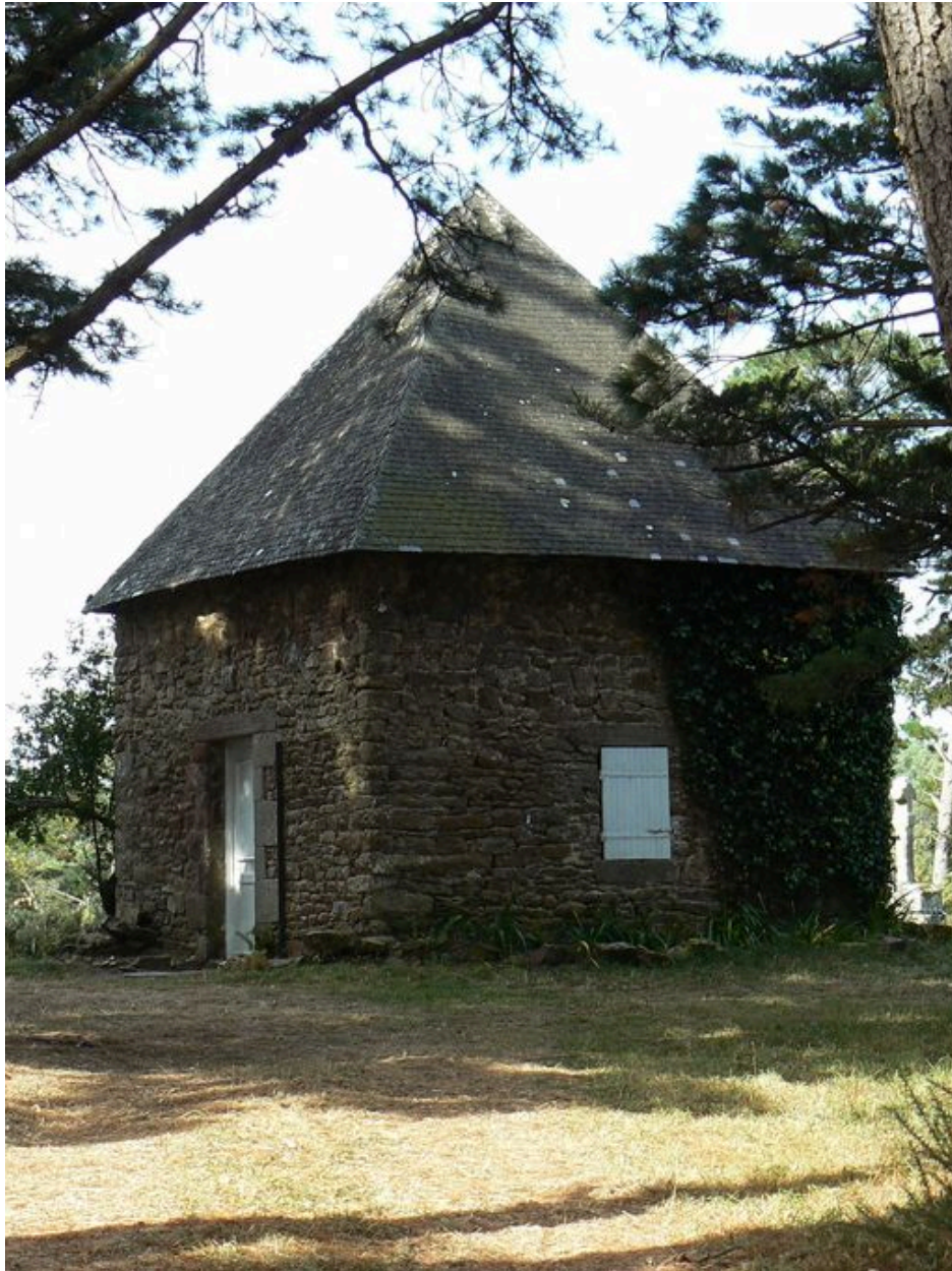
Guérite des douaniers de Barrarac'h