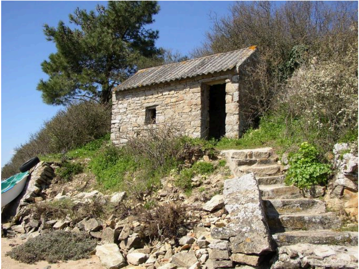
Guérite des douaniers de la Garenne