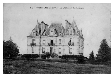
Le château de La Montagne (vue ouest)