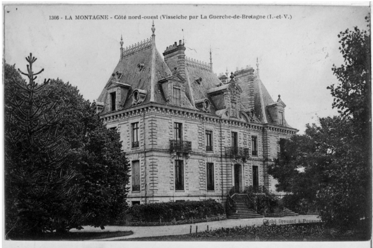
Château de La Montagne : vue nord-ouest (carte postale)