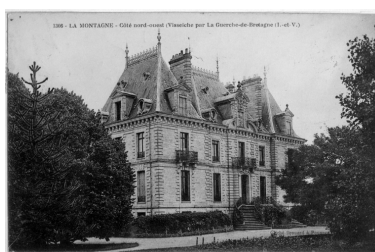
Château de La Montagne : vue nord-ouest (carte postale) IVR53_19883500747X