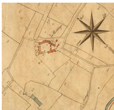
Extrait du cadastre de 1827