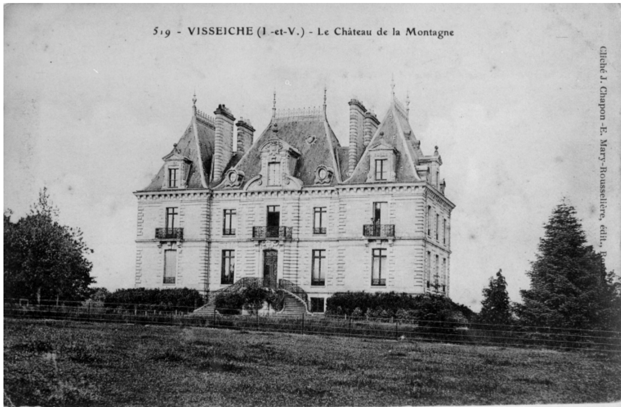
Le château de La Montagne (vue ouest)