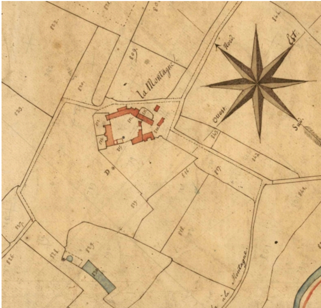
Extrait du cadastre de 1827