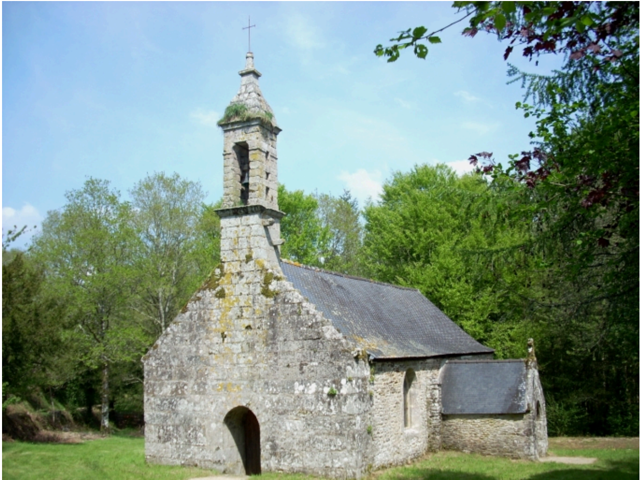
Plouyé, chapelle Saint-Mathurin : vue générale sud-ouest