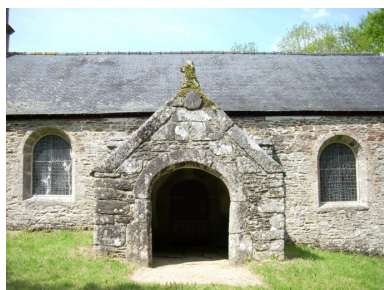
Plouyé, chapelle Saint-Mathurin : porche sud