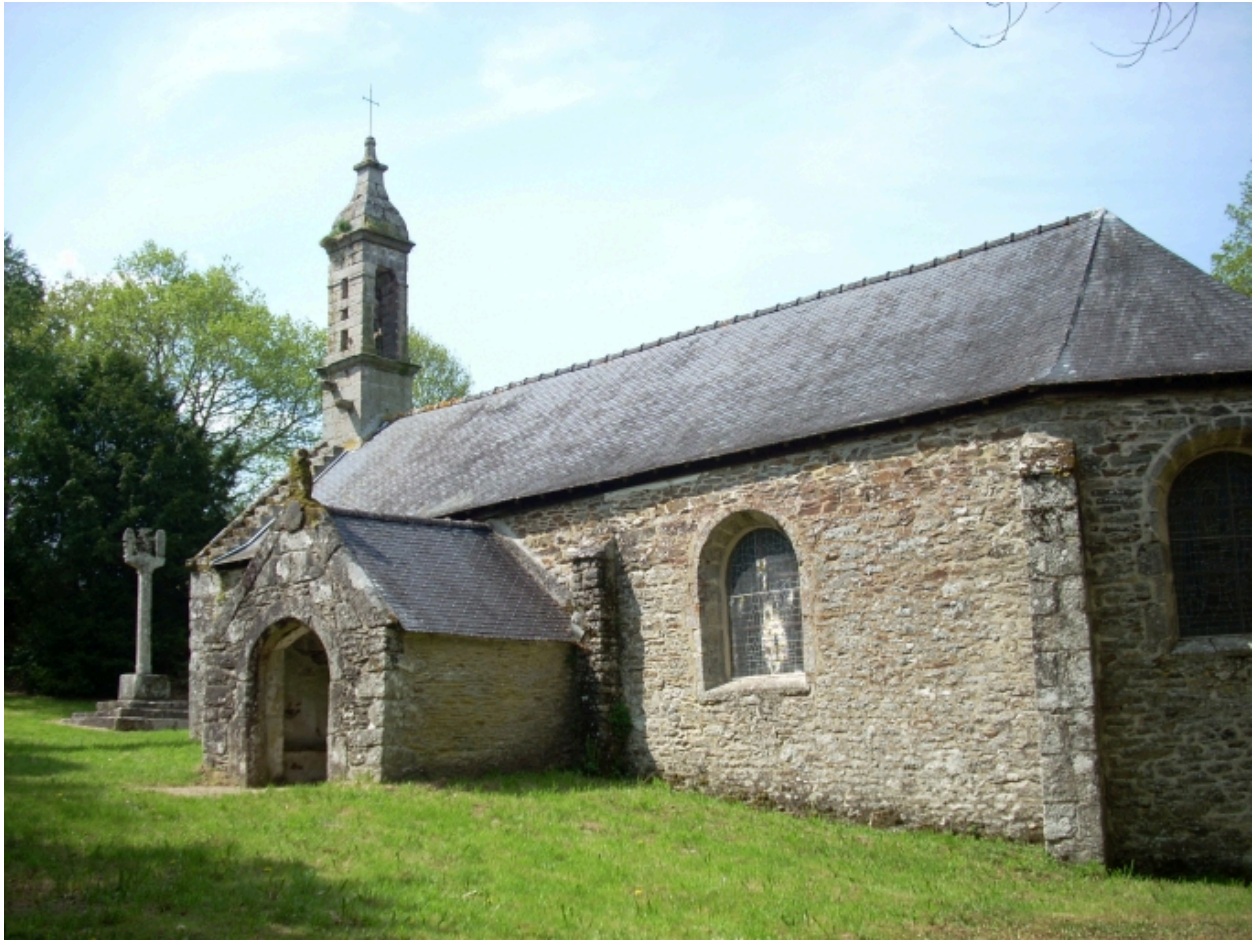
Plouyé, chapelle Saint-Mathurin : vue générale sud-est