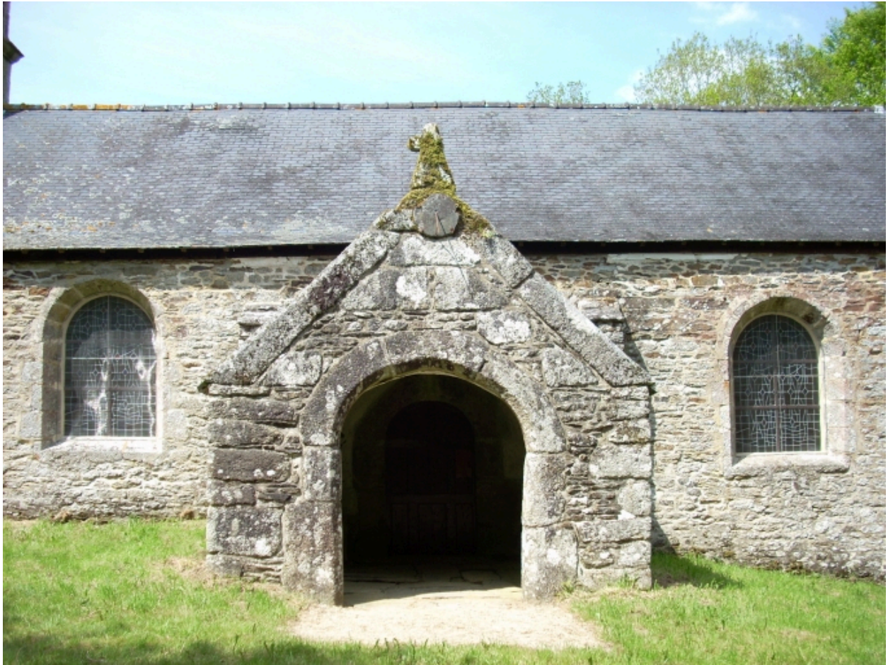
Plouyé, chapelle Saint-Mathurin : porche sud