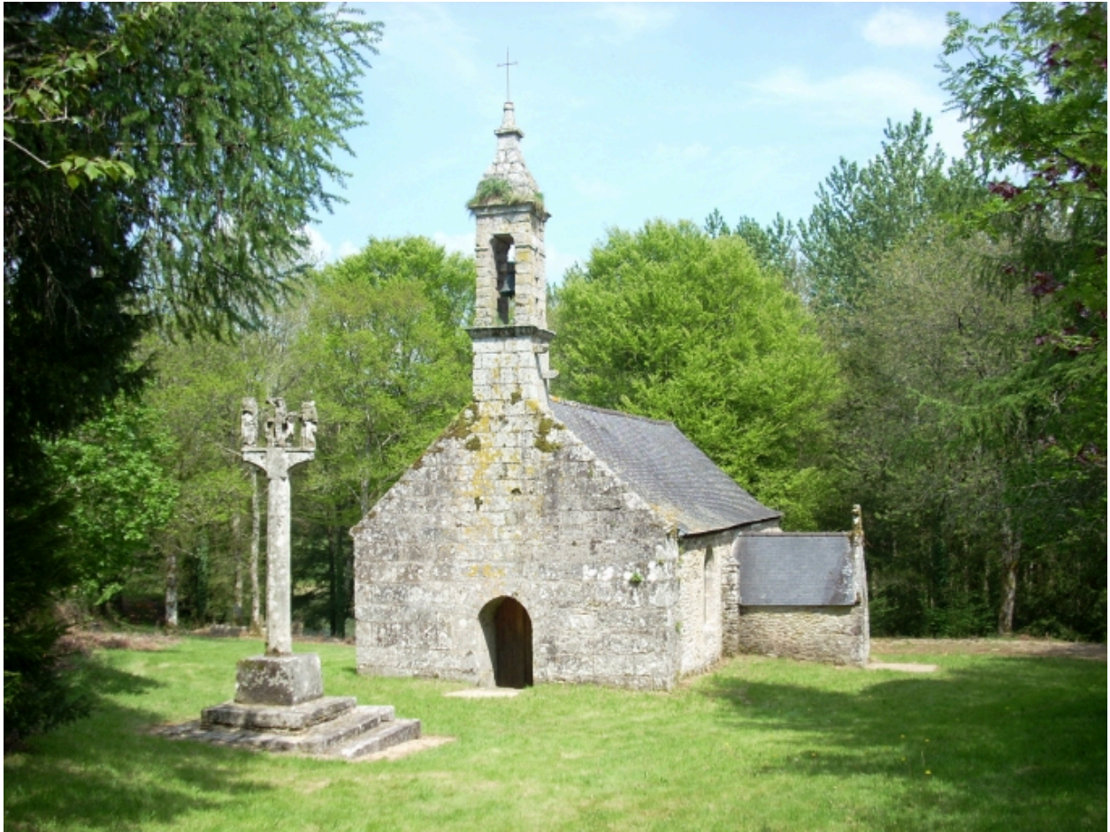
Plouyé, chapelle Saint-Mathurin : vue générale sud-ouest