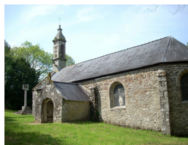
Plouyé, chapelle Saint-Mathurin : vue générale sud-est