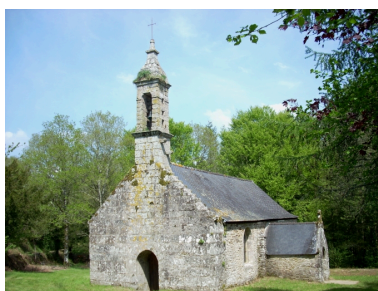
Plouyé, chapelle Saint-Mathurin : vue générale sud-ouest IVR53_20082905842NUCA