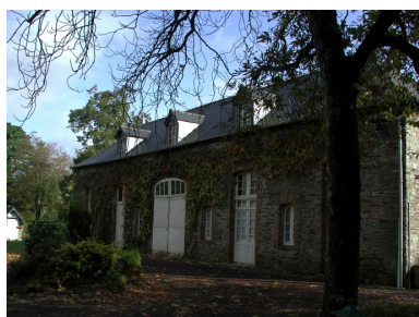
Communs ; vue générale ouest IVR53_20003516761NUCA