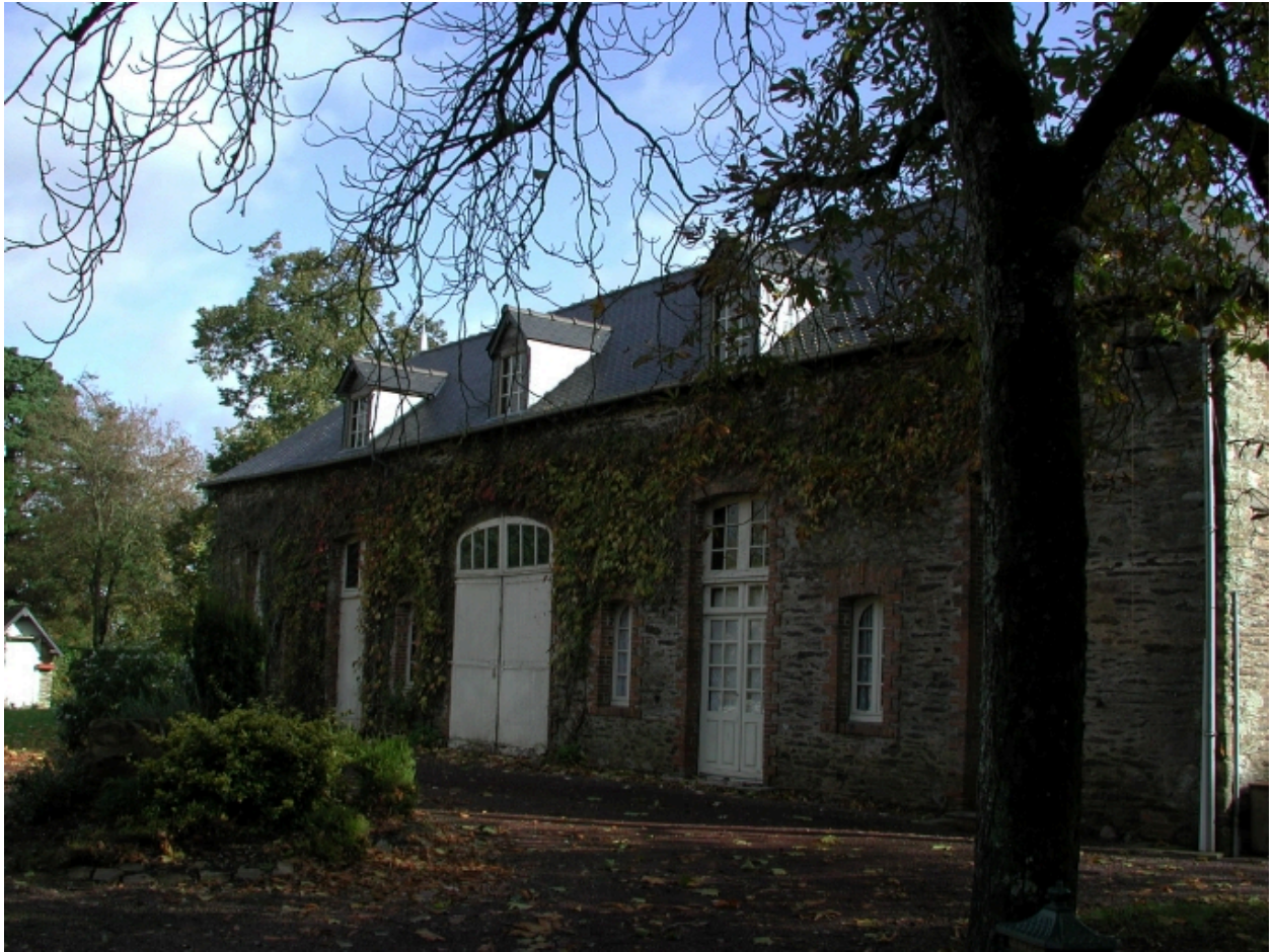
Communs ; vue générale ouest