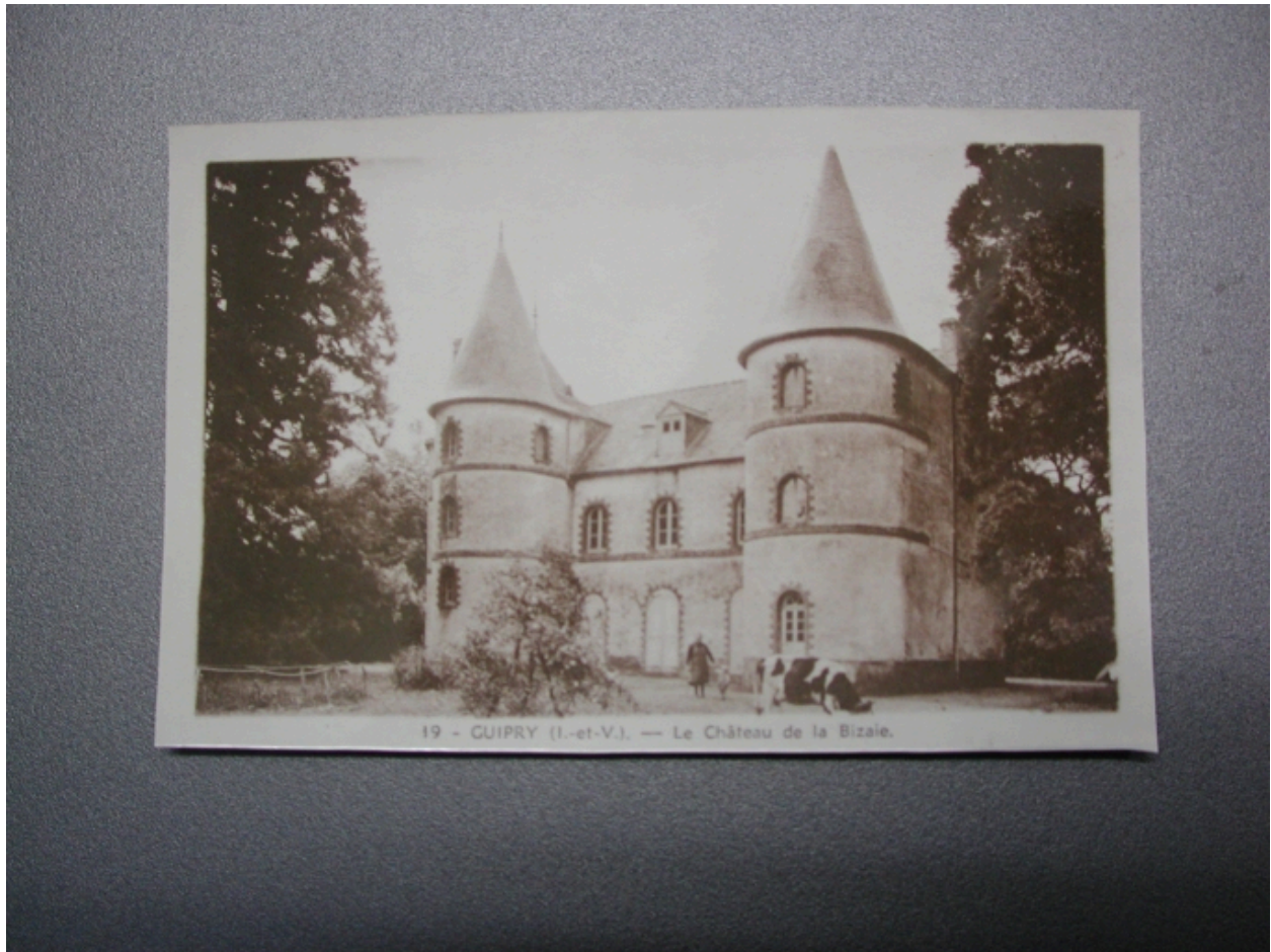
Vue générale sur une carte postale ancienne