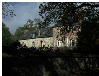
Logis ; vue partielle sud est IVR53_20003516762NUCA