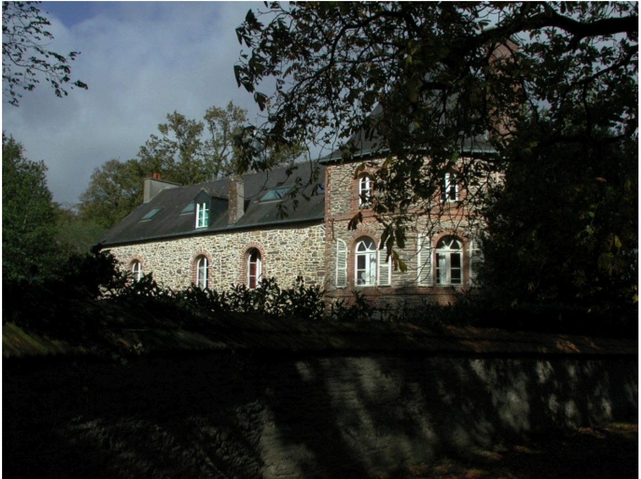
Logis ; vue partielle sud est