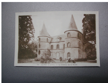
Vue générale sur une carte postale ancienne