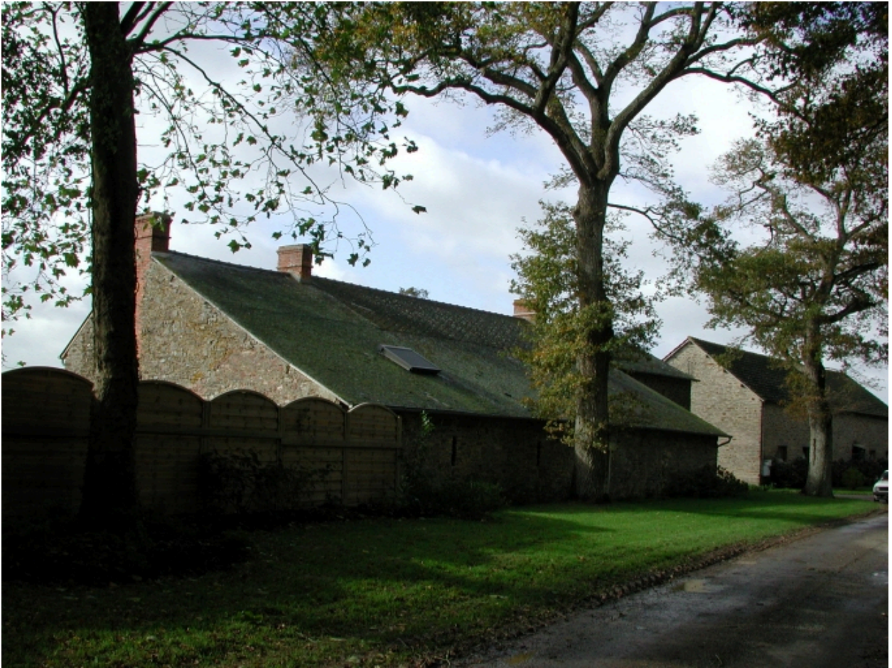
Ferme ; vue de situation nord est