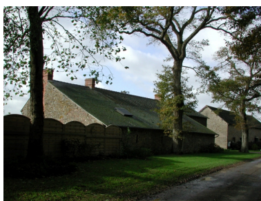
Ferme ; vue de situation nord est IVR53_20003516760NUCA