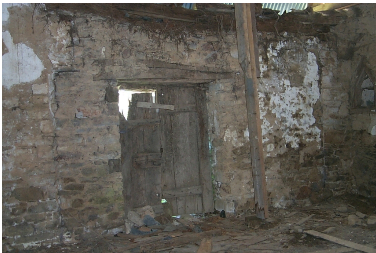
Intérieur, mur nord, porte