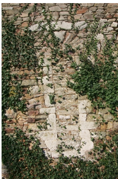
Chevet, baie bouchée