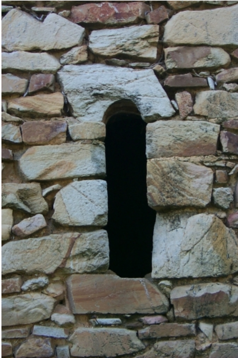
Nef, mur nord, détail baie