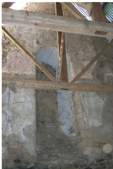
Intérieur, baie du chevet IVR53_20013509874NUCA