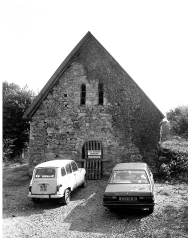
Façade occidentale, état en 1995 IVR53_19953500525X