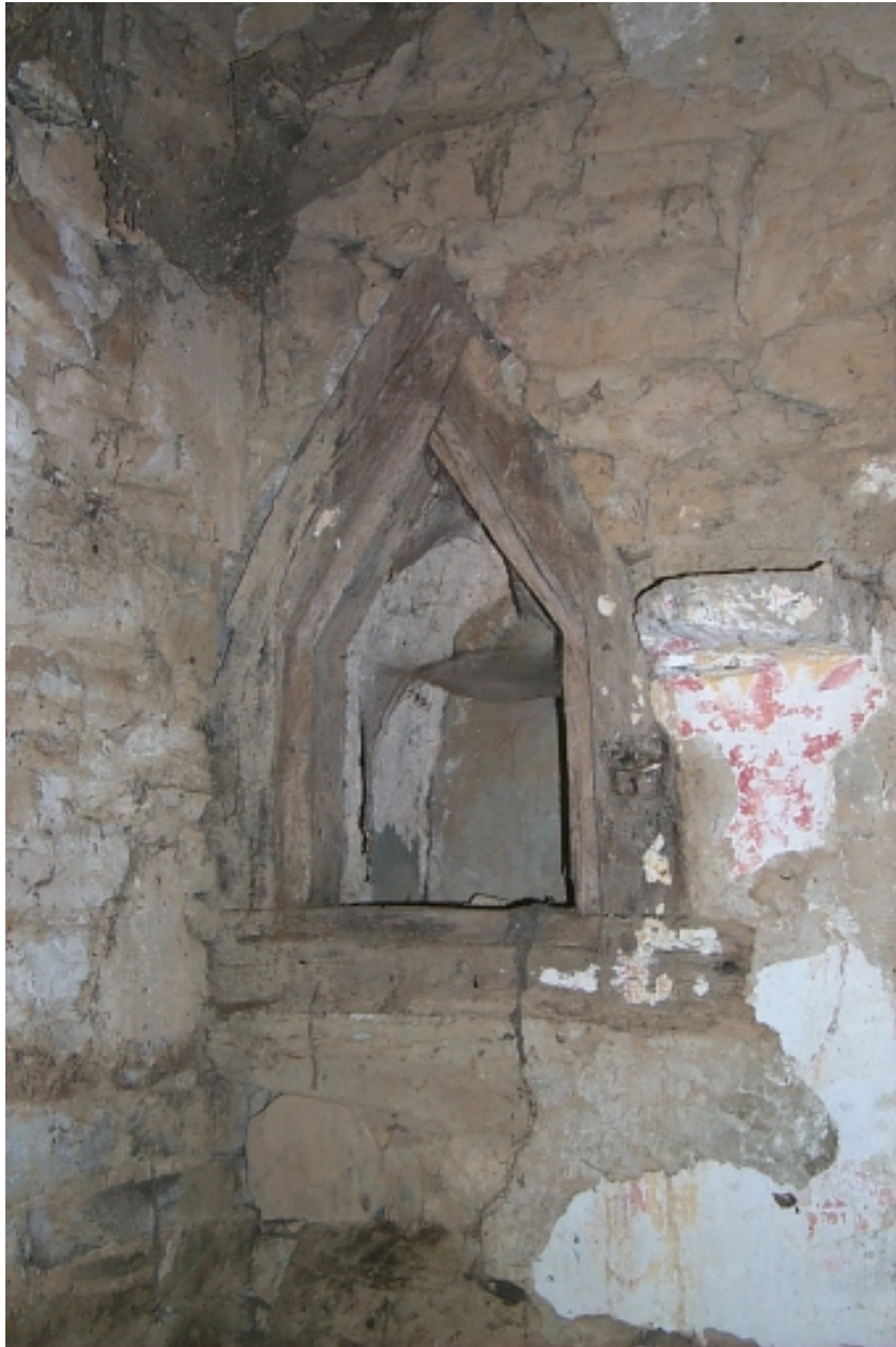
Intérieur, mur nord du chœur, niche-crédence en bois