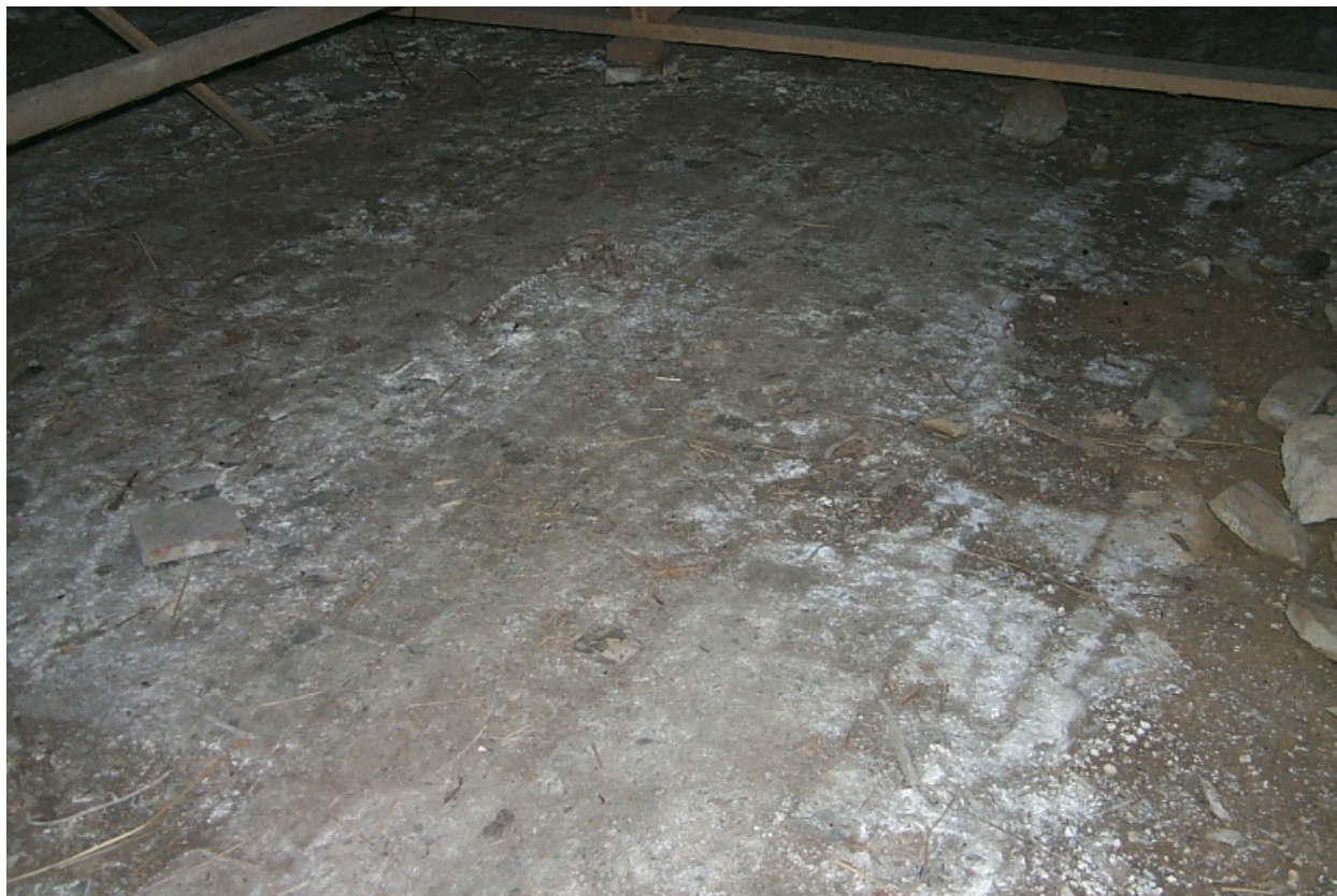
Intérieur, vestiges du pavage à l'entrée de la nef