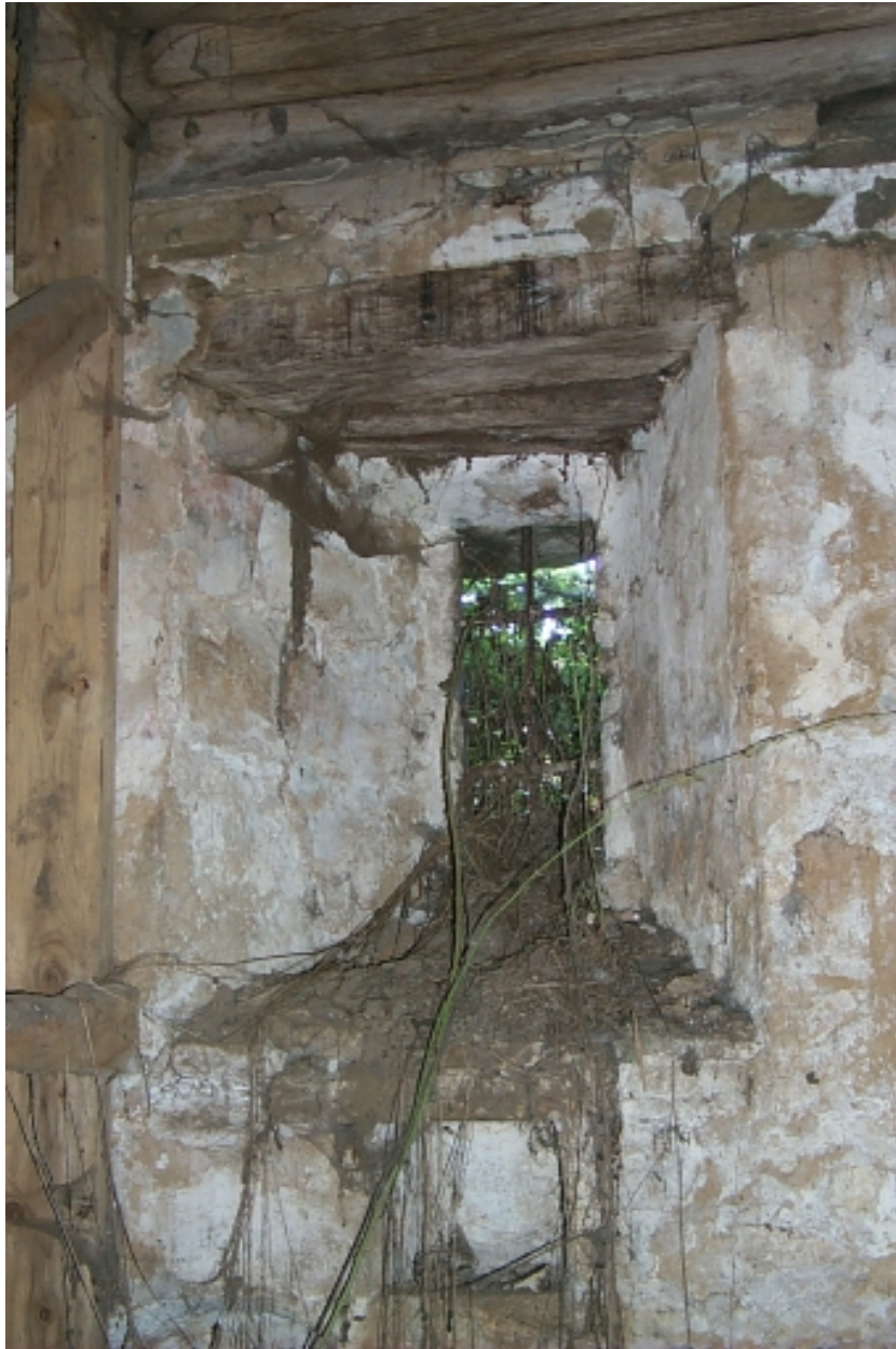
Intérieur, mur sud, baie