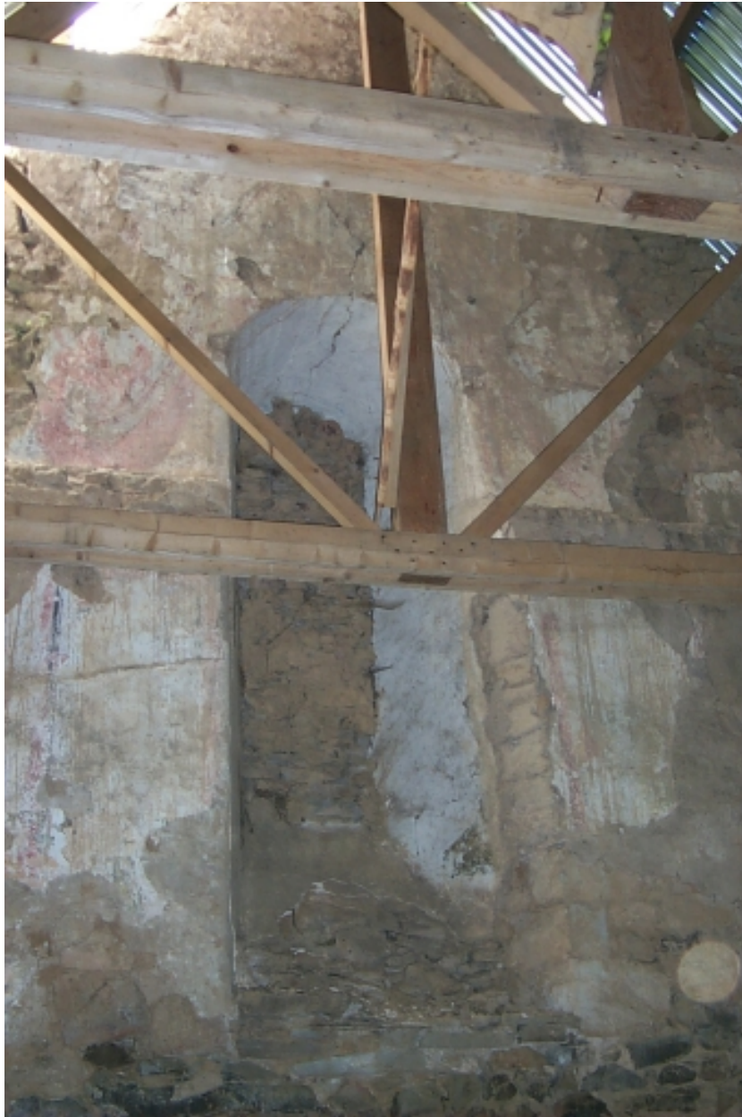
Intérieur, baie du chevet