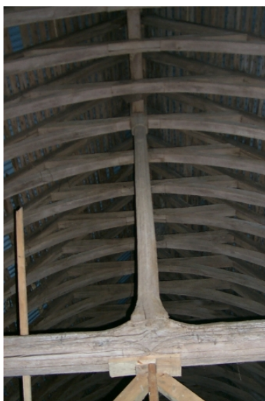
Intérieur, charpente, vue partielle