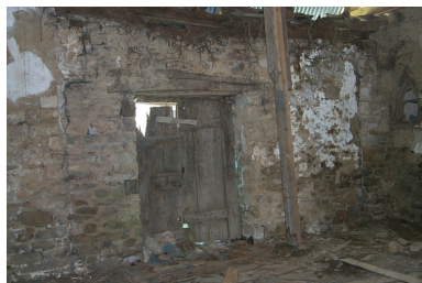
Intérieur, mur nord, porte IVR53_20013509871NUCA