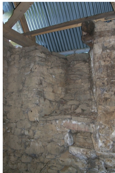
Intérieur, mur sud, baie éclairant le chœur IVR53_20013509873NUCA