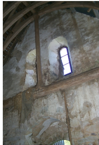
Intérieur, revers de la baie géminée ouest IVR53_20013509864NUCA