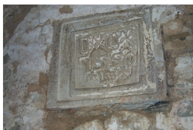
Intérieur, mur, pierre sculptée et datée 1550 IVR53_20013509868NUCA