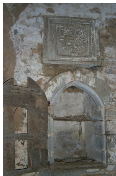
Intérieur, mur nord, niche-crédence et pierre sculptée datée 1550 IVR53_20013509867NUCA