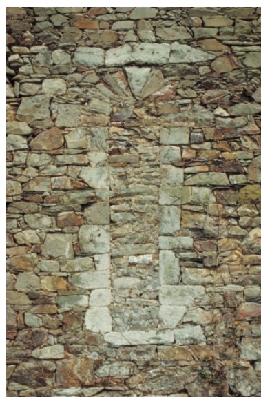
Chevet, baie bouchée