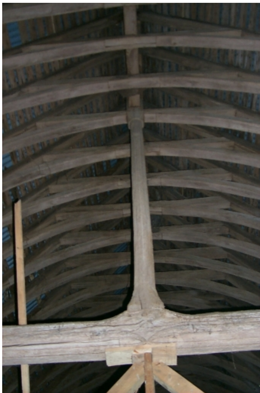
Intérieur, charpente, vue partielle