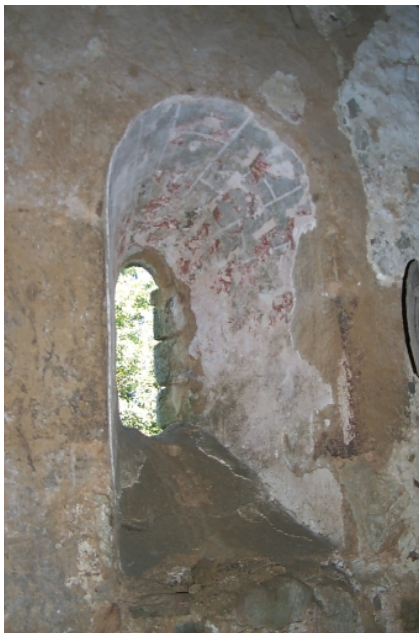
Intérieur, mur nord, baie romane avec des traces d'enduit peint en faux appareillage