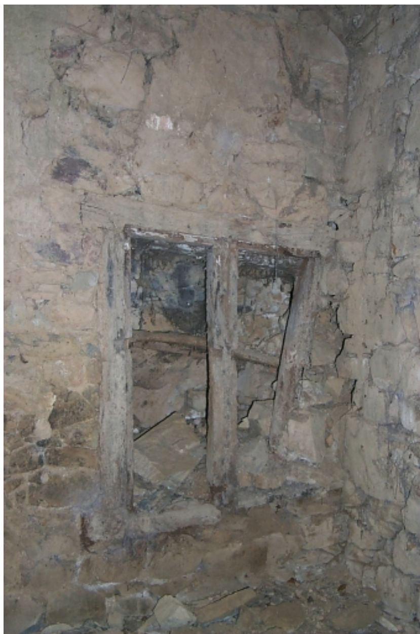
Intérieur, mur sud du chœur, armoire murale