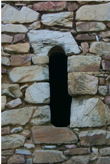
Nef, mur nord, détail baie IVR53_20013509859NUCA