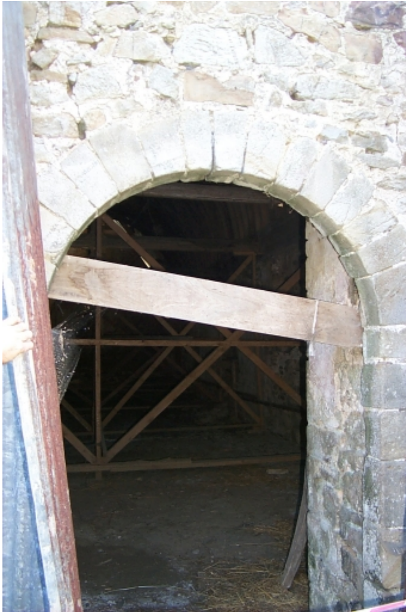
Elévation ouest, porte