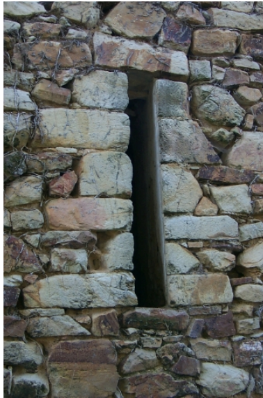
Nef, mur nord, baie IVR53_20013509860NUCA