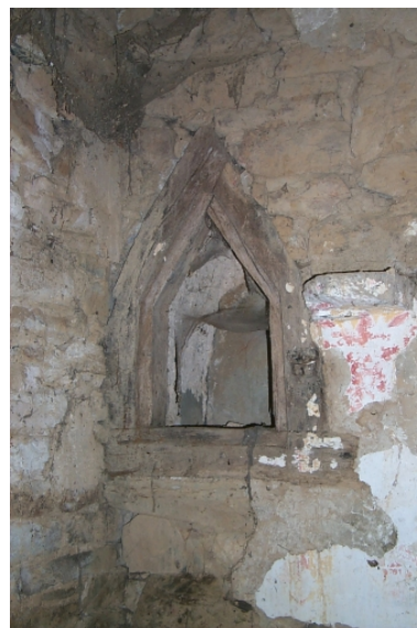
Intérieur, mur nord du chœur, niche-crédence en bois IVR53_20013509876NUCA