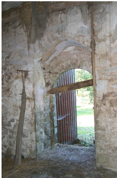
Intérieur, revers de la porte ouest IVR53_20013509863NUCA