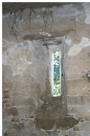
Intérieur, mur nord, baie romane IVR53_20013509870NUCA