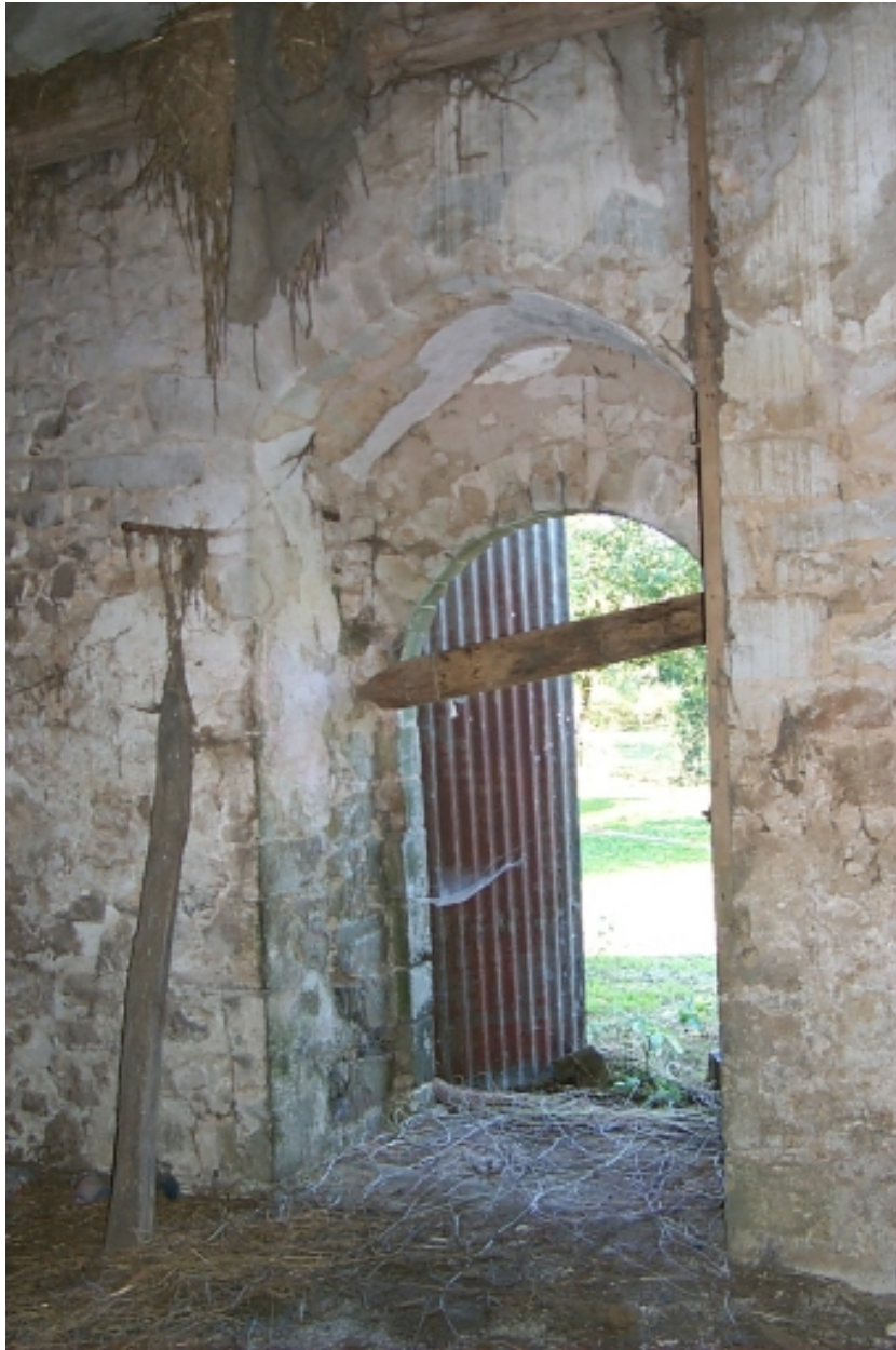
Intérieur, revers de la porte ouest