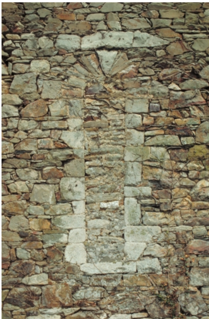
Chevet, baie bouchée