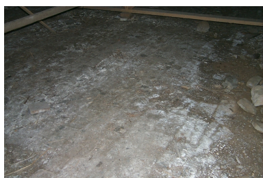
Intérieur, vestiges du pavage à l'entrée de la nef IVR53_20013509865NUCA