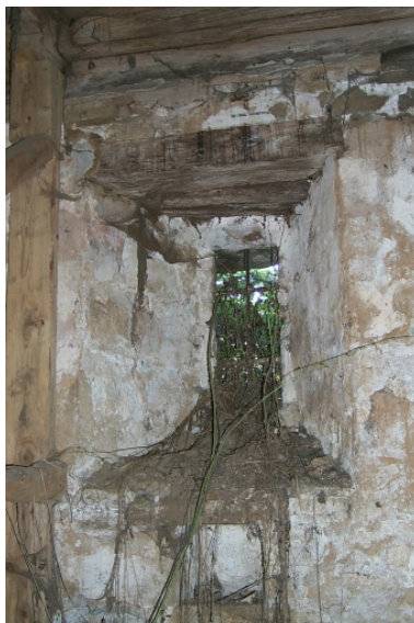
Intérieur, mur sud, baie IVR53_20013509872NUCA