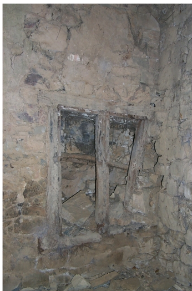
Intérieur, mur sud du chœur, armoire murale IVR53_20013509875NUCA