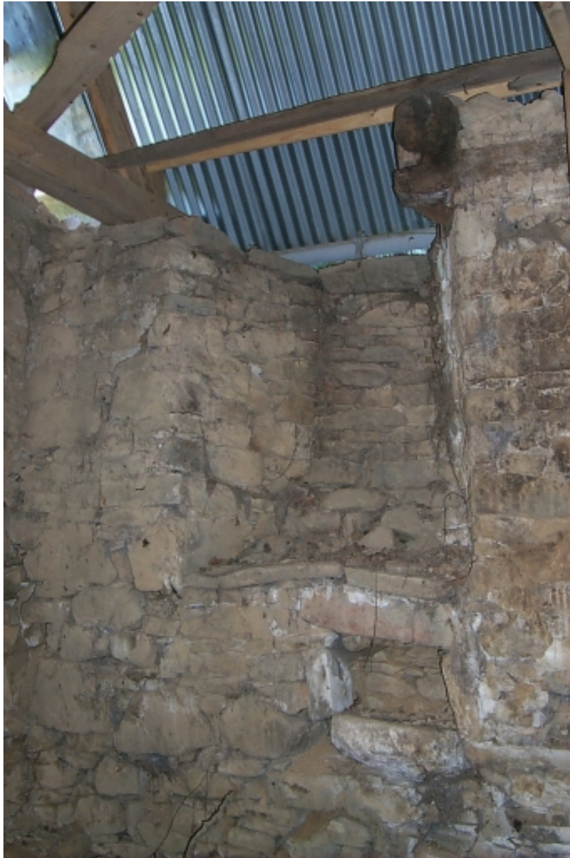
Intérieur, mur sud, baie éclairant le chœur