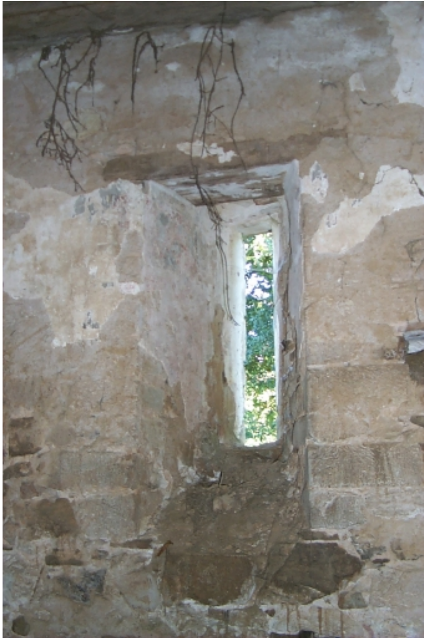
Intérieur, mur nord, baie romane