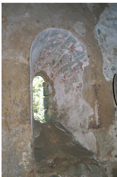
Intérieur, mur nord, baie romane avec des traces d'enduit peint en faux appareillage