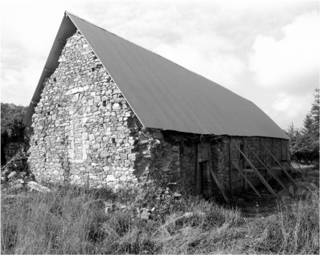
Chevet et mur nord, état en 1995