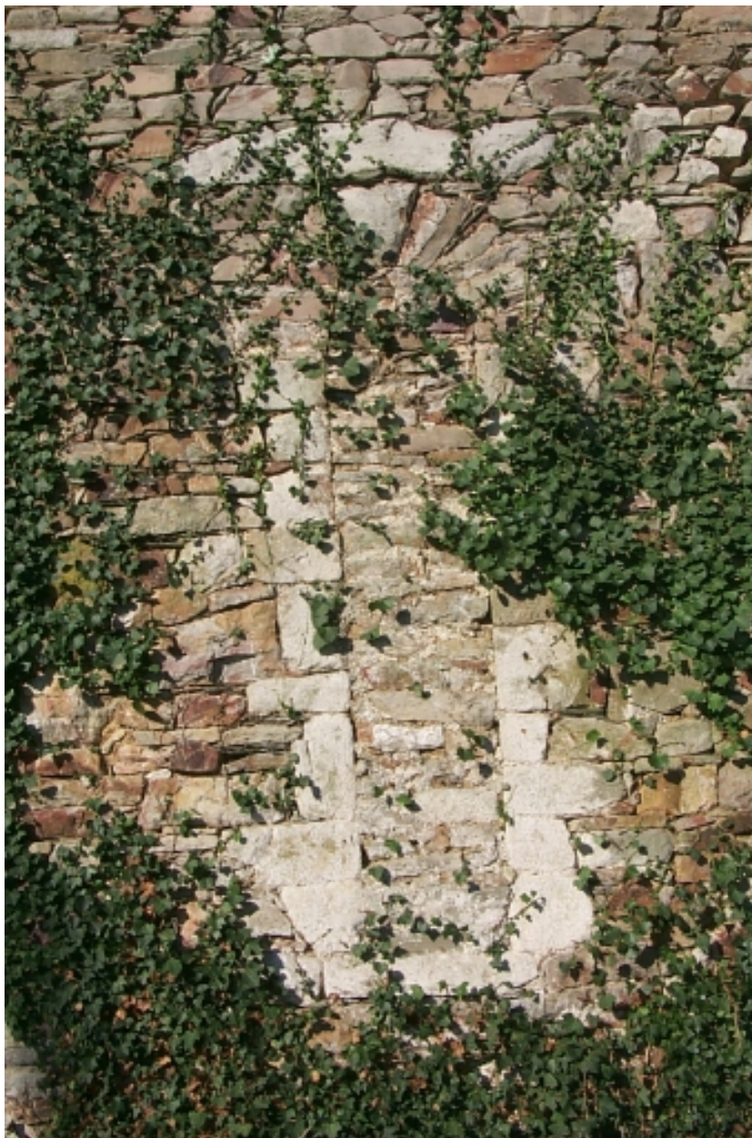
Chevet, baie bouchée