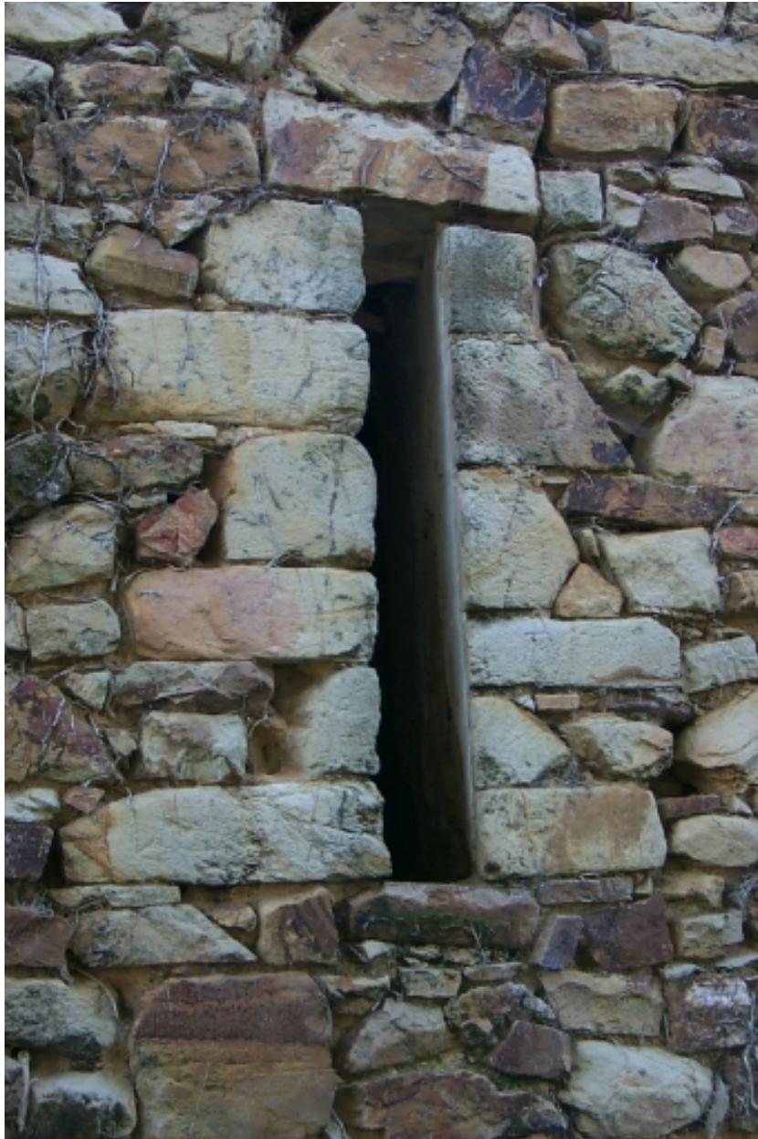
Nef, mur nord, baie