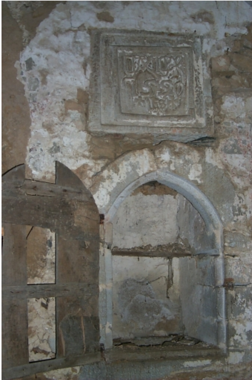
Intérieur, mur nord, niche-crédence et pierre sculptée datée 1550