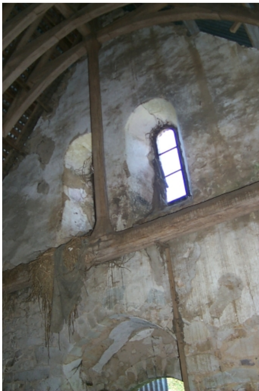
Intérieur, revers de la baie géminée ouest