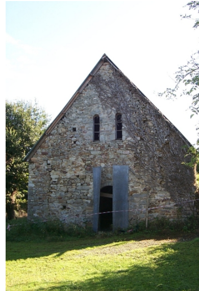
Elévation ouest