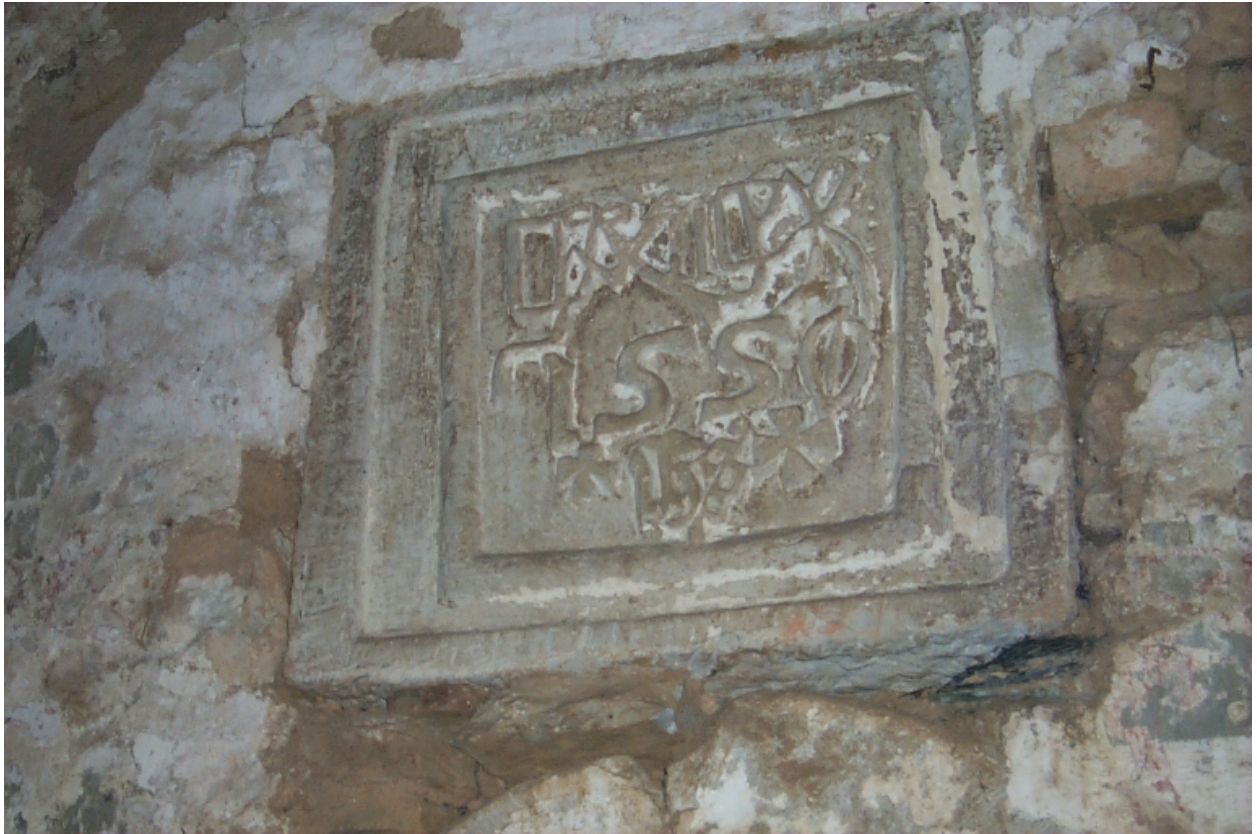
Intérieur, mur, pierre sculptée et datée 1550