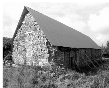
Chevet et mur nord, état en 1995 IVR53_19953500526X