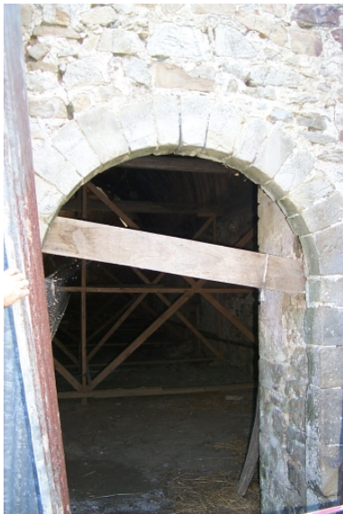
Elévation ouest, porte IVR53_20013509862NUCA