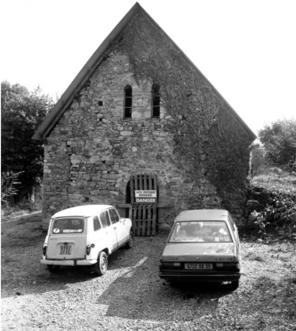
Façade occidentale, état en 1995