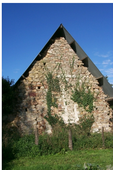
Chevet IVR53_20013509856NUCA