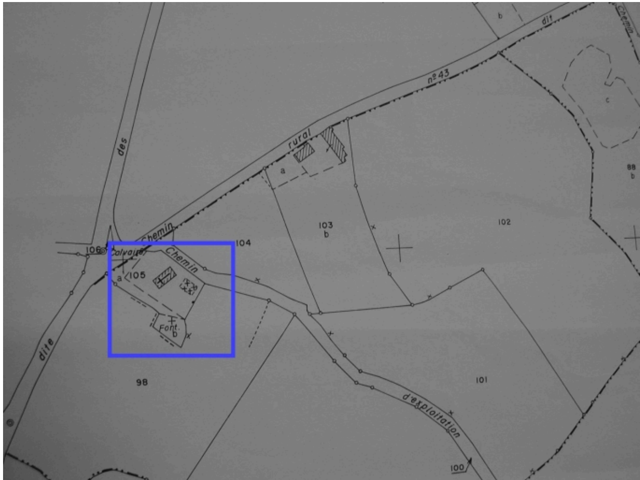
Extrait du cadastre de 1995