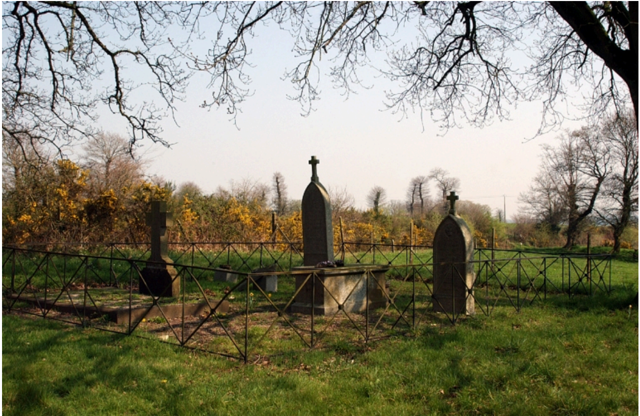
Le cimetière : vue générale nord