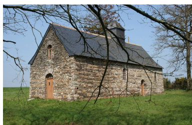
Vue générale sud IVR53_20023502768NUCA