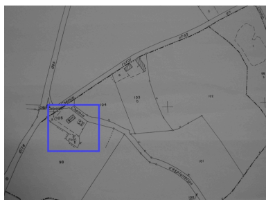
Extrait du cadastre de 1995