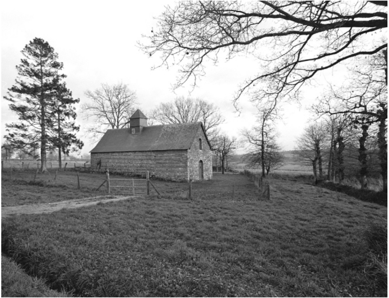
Vue de situation nord-ouest