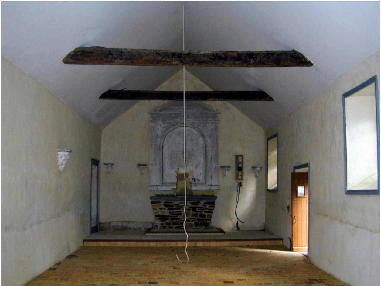
Intérieur : vue générale vers le chœur