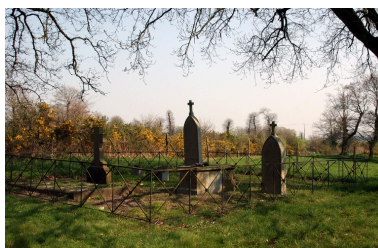
Le cimetière : vue générale nord