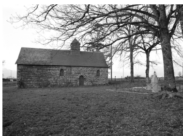
Vue générale sud IVR53_19923501017X