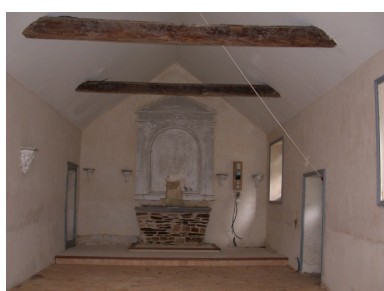
Vue intérieure IVR53_20023514679NUCA