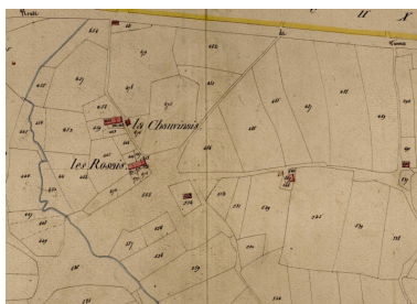
Extrait du cadastre de 1823 IVR53_20023514203NUC