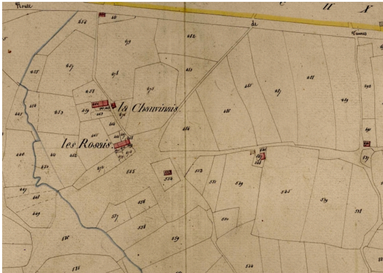
Extrait du cadastre de 1823