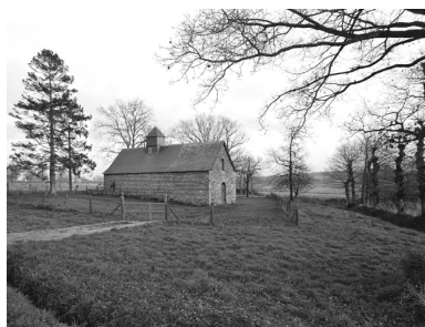
Vue de situation nord-ouest IVR53_19923501016X