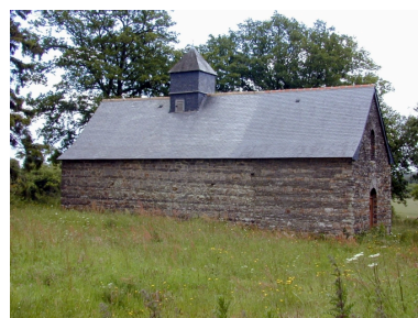
Vue de situation nord-ouest IVR53_20023514207NUCA