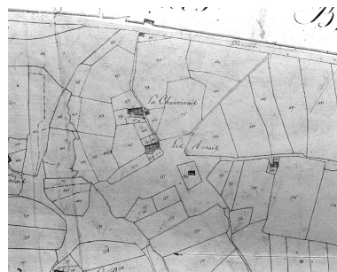
Extrait du cadastre de 1823