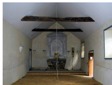
Intérieur : vue générale vers le chœur