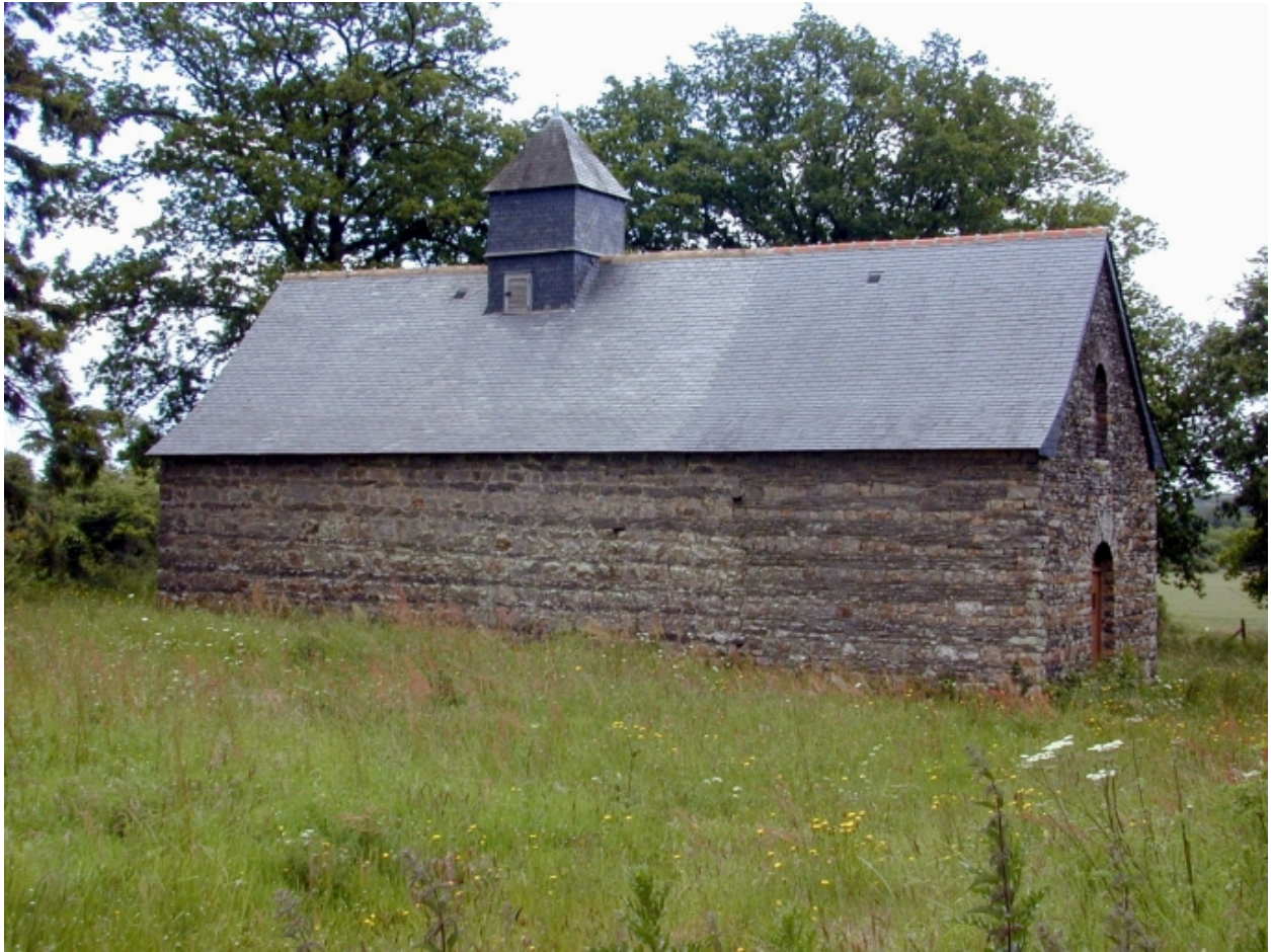
Vue de situation nord-ouest