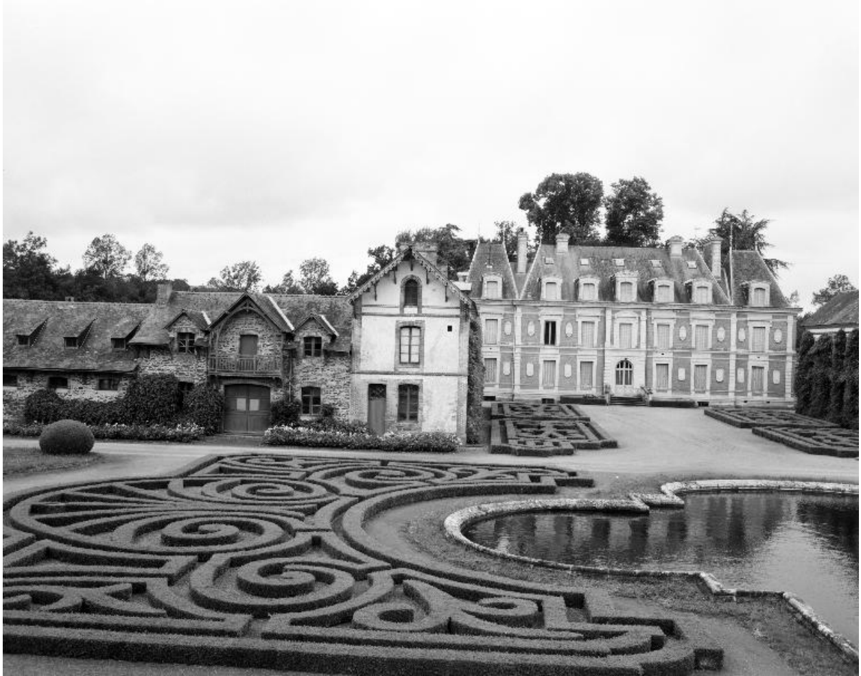
Parc : vue générale depuis l'est