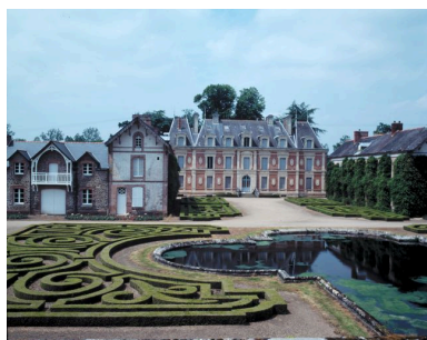
Château et dépendances : vue sud-est