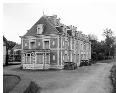
Château : vue générale prise du nord-ouest IVR53_19915600476X