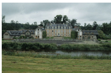
Vue de situation prise de l'est, IVR53_19915600678ZA