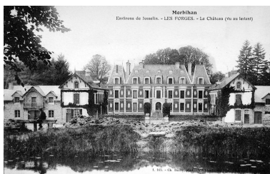
Morbihan. Environs de Josselin.- LES FORGES.- Le Château (vue au levant). Carte postale, 1er quart 20e siècle (A. D. Ille-&-Vilaine, 6 Fi) IVR53_20035604283NUCB