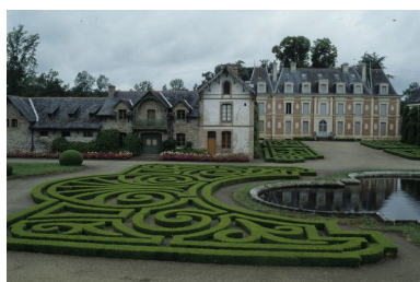
Château et dépendance, vue est IVR53_19915600682ZA