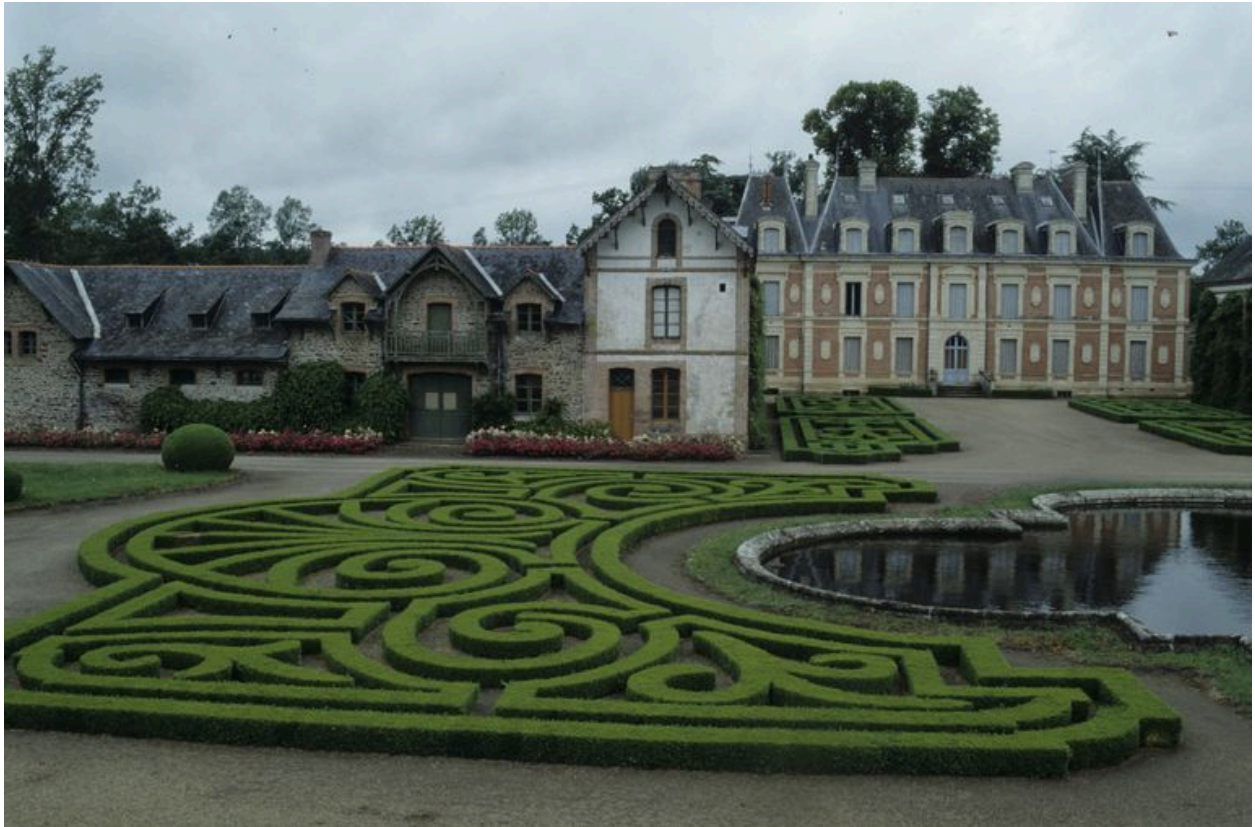
Château et dépendance, vue est