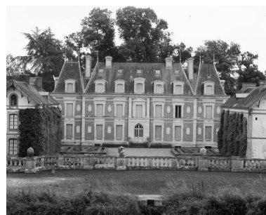
Château, vue est IVR53_19915600470X