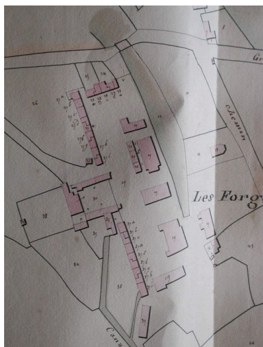
Le château des Forges sur le cadastre de 1845 (A. D. Morbihan 3 P 374) Autr. Quermeleuc IVR53_20045606182NUCA