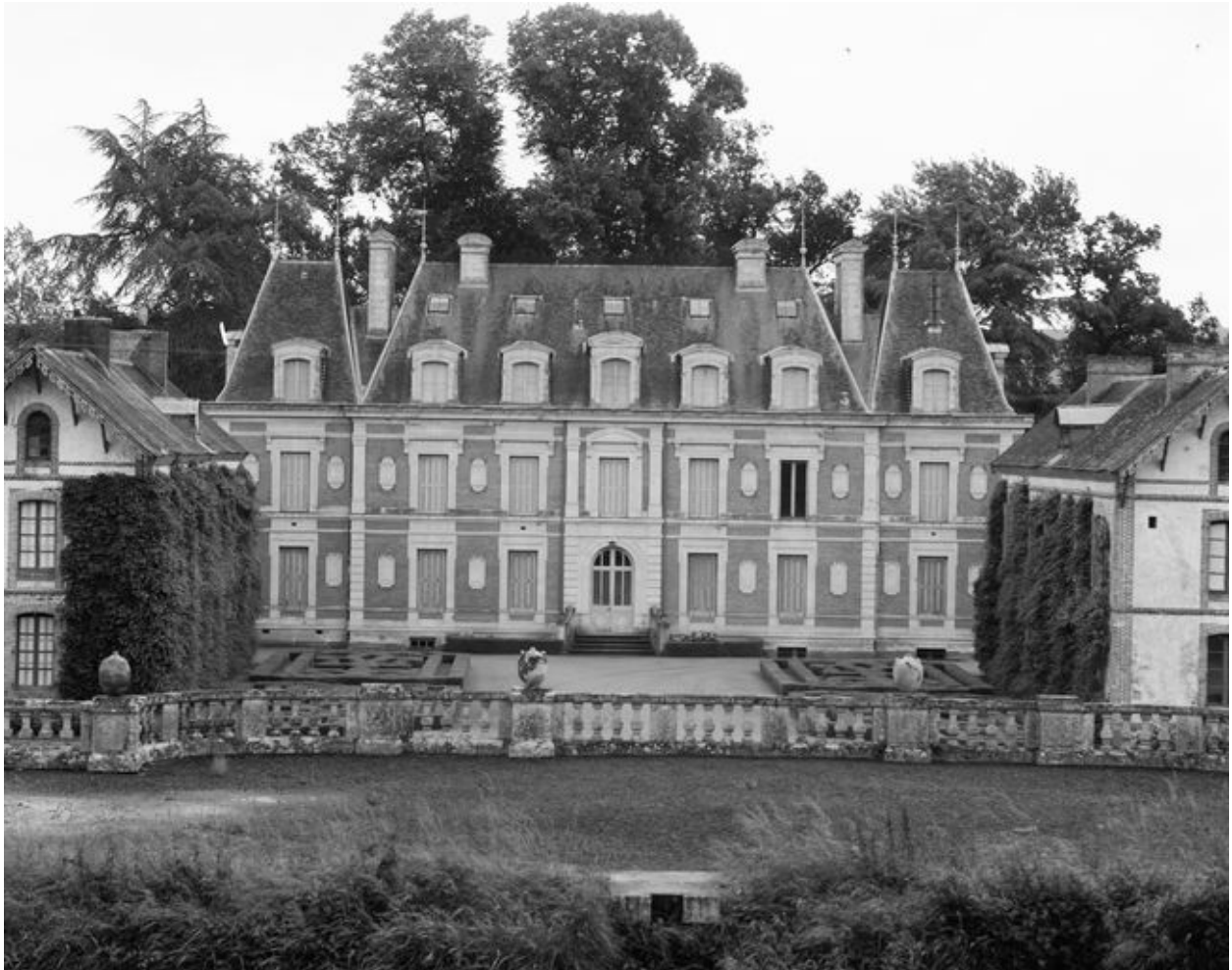
Château, vue est