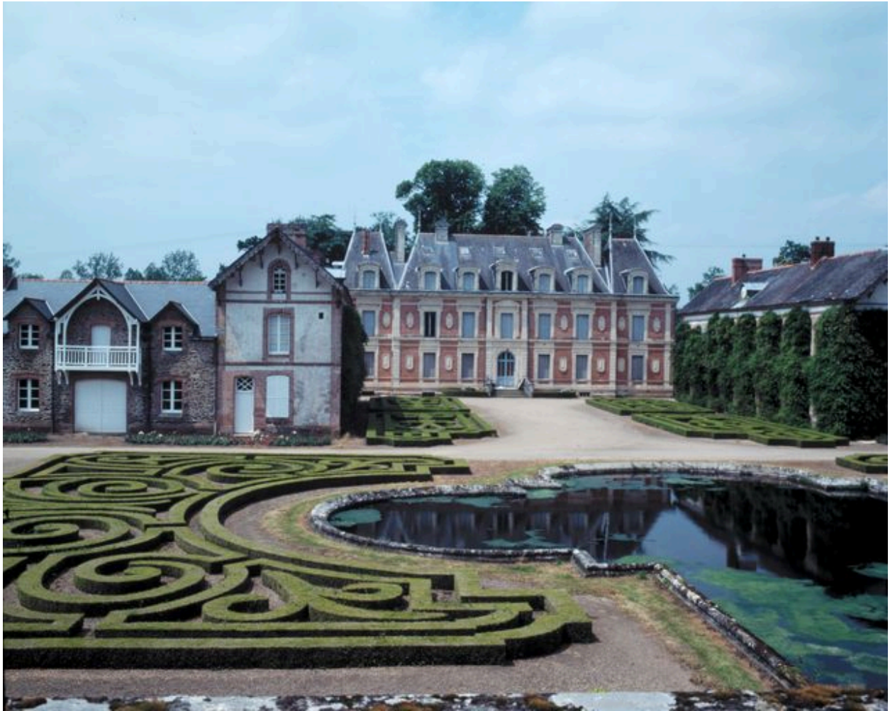
Château et dépendances : vue sud-est