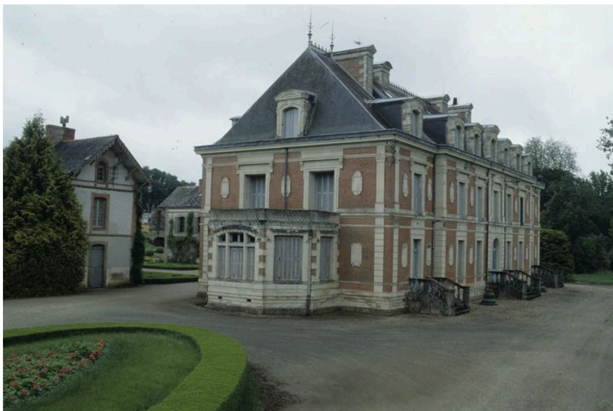
Château : vue générale prise du nord-ouest