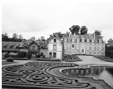
Parc : vue générale depuis l'est, IVR53_19915600479X