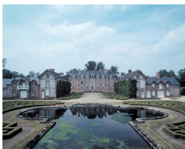
Château et dépendances : vue générale prise du sud-est IVR53_19945600690XA