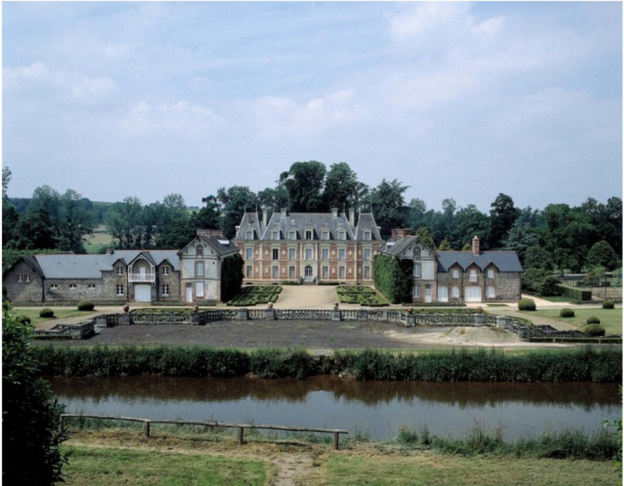
Château et dépendances : vue sud-est