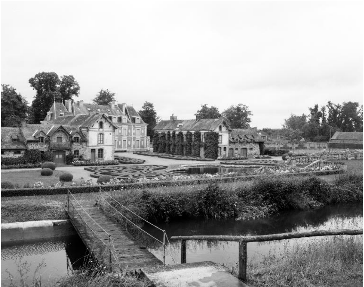
Château : vue d'ensemble sud-est du château et des dépendances