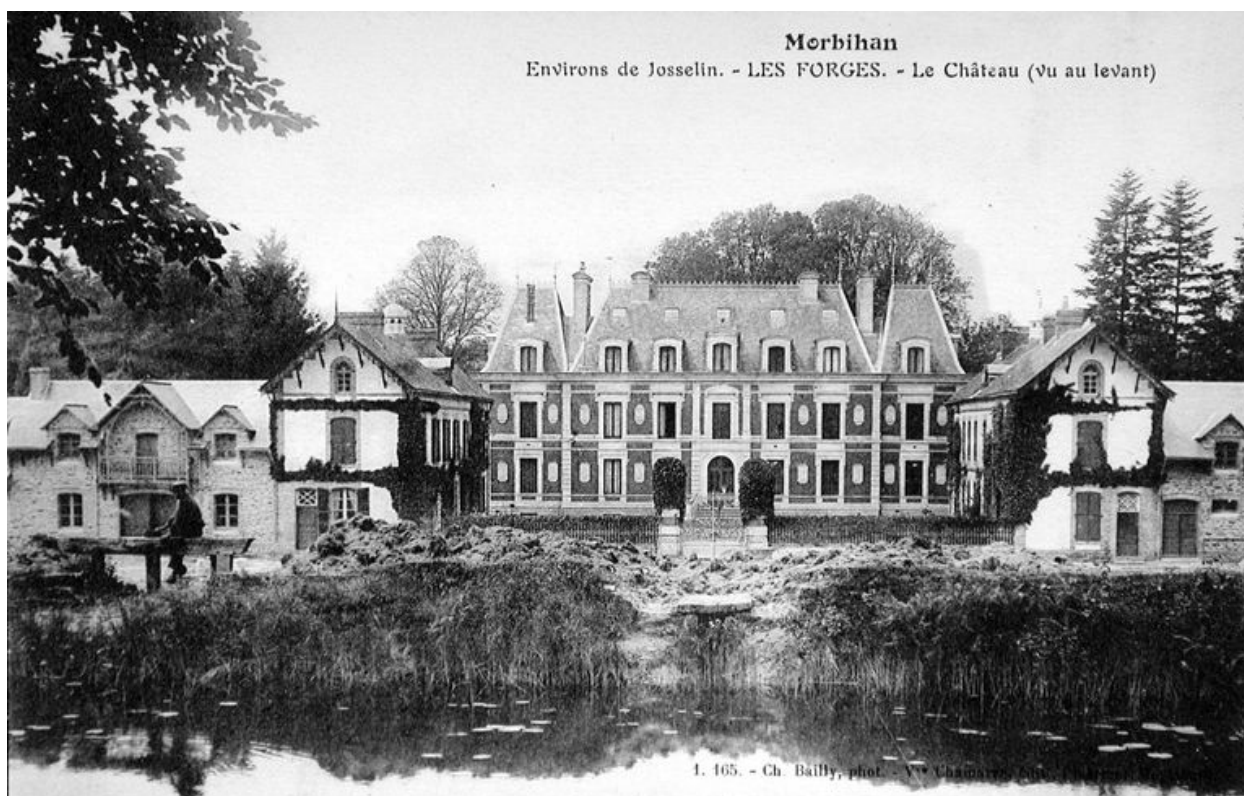
Morbihan. Environs de Josselin.- LES FORGES.- Le Château (vue au levant). Carte postale, 1er quart 20e siècle