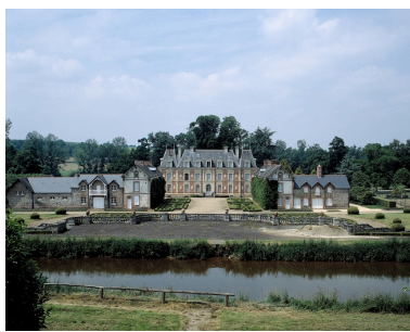
Château et dépendances : vue sud-est IVR53_19945600689XA