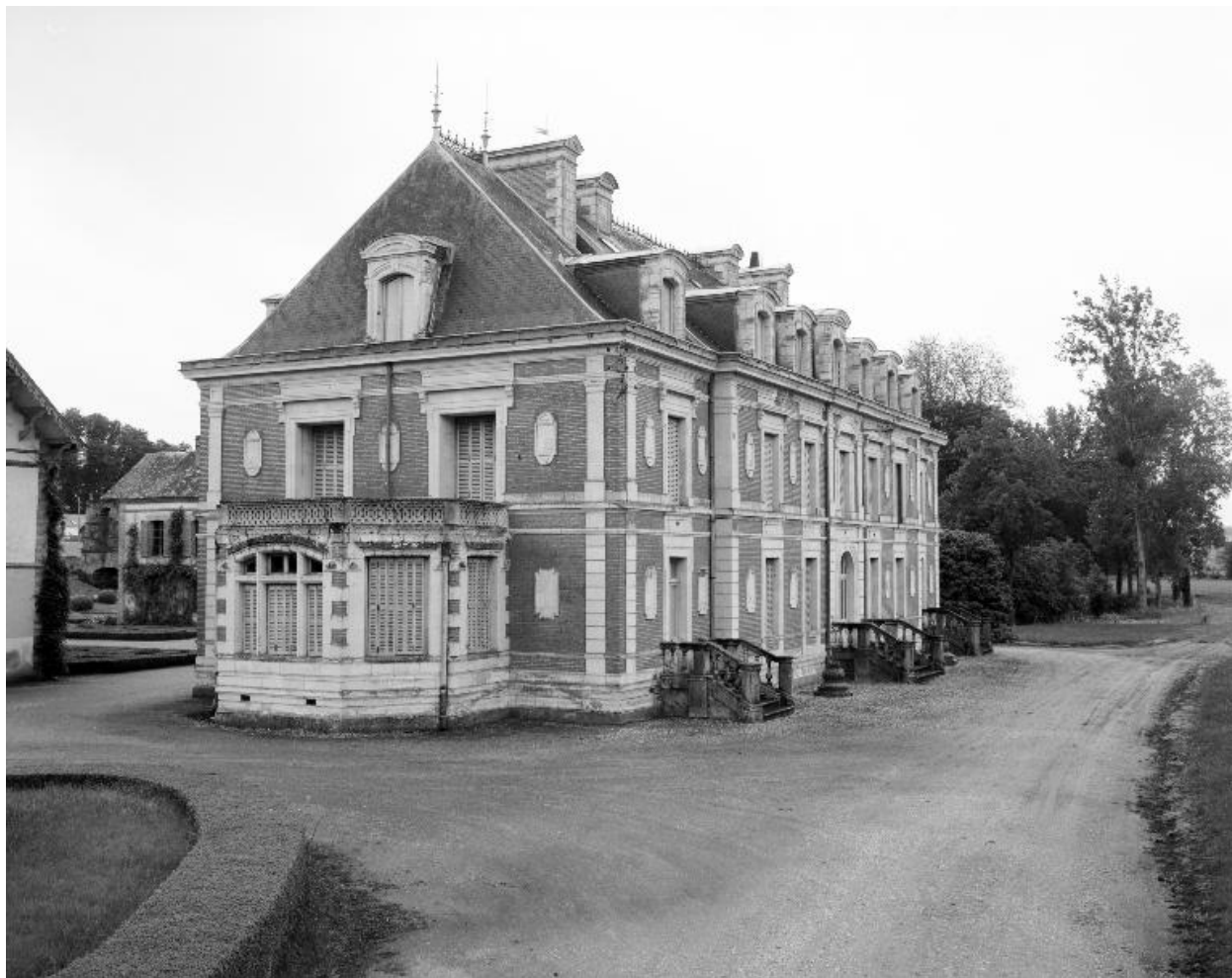
Château : vue générale prise du nord-ouest