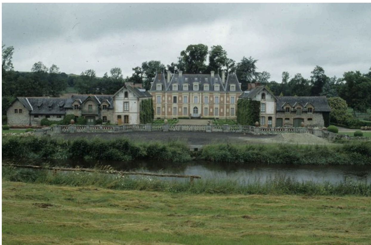
Vue de situation prise de l'est