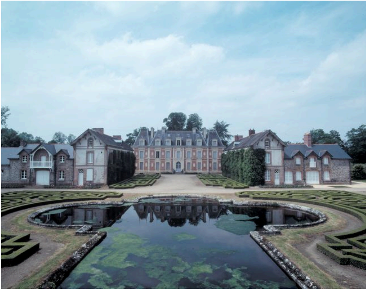
Château et dépendances : vue générale prise du sud-est