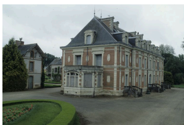
Château : vue générale prise du nord-ouest IVR53_19915600485X