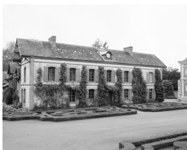
Dépendance sud : vue générale prise du nord IVR53_19915600474X