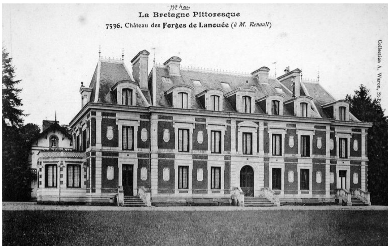
Le Château des Forges de Lanouée (à M. Renault). Carte postale, 1er quart 20e siècle (A. D. Ille-&-Vilaine, 6 Fi)