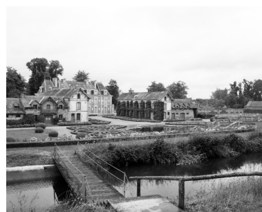
Château : vue d'ensemble sud-est du château et des dépendances IVR53_19915600480X