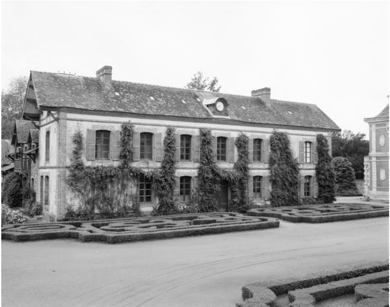
Dépendance sud : vue générale prise du nord