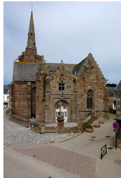
Perros-Guirec. Chapelle Notre-Dame de la Clarté. Vue du front sud IVR53_20072200249NUCA