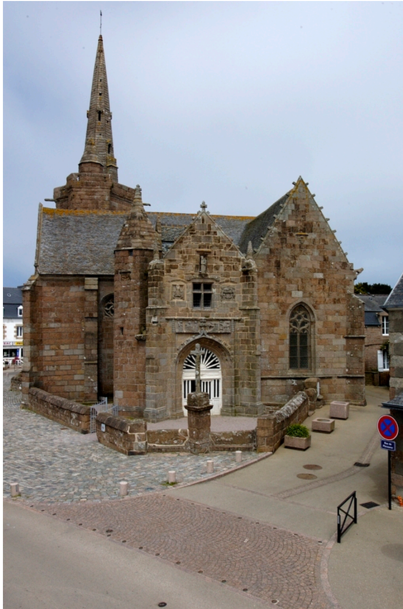
Perros-Guirec. Chapelle Notre-Dame de la Clarté. Vue du front sud