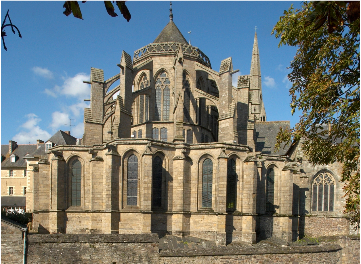
Redon. Ancienne abbatale Saint-Sauveur. Vue du chevet et de ses chapelles rayonnantes