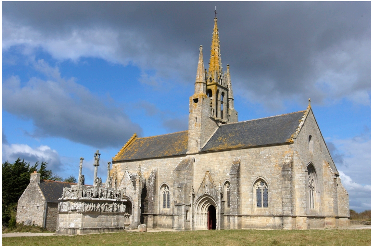
Saint-Jean-Trolimon. Chapelle Notre-Dame de Tronoën. Vue générale depuis le sud-est