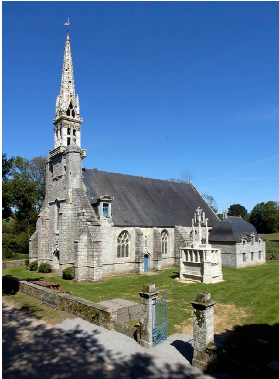
Ergué-Gabéric. Chapelle Notre-Dame de Kerdévot. Vue générale depuis le sud-ouest