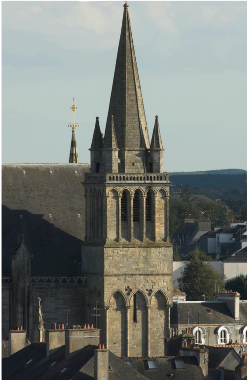
Vannes. Cathédrale Saint Pierre. Partie supérieure de la tour nord-Ouest