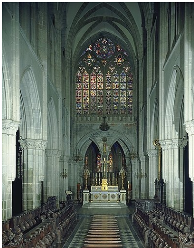
Dol-de-Bretagne. cathédrale Saint-Samson. Vue du chœur IVR53_19923500338VA