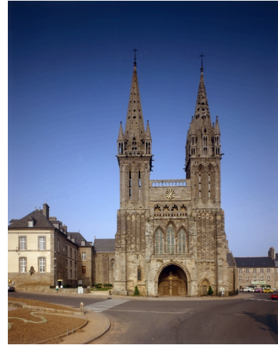
Saint-Pol-de-Léon (29). Cathédrale Saint Pol Aurélien; Vue générale de la façade occidentale