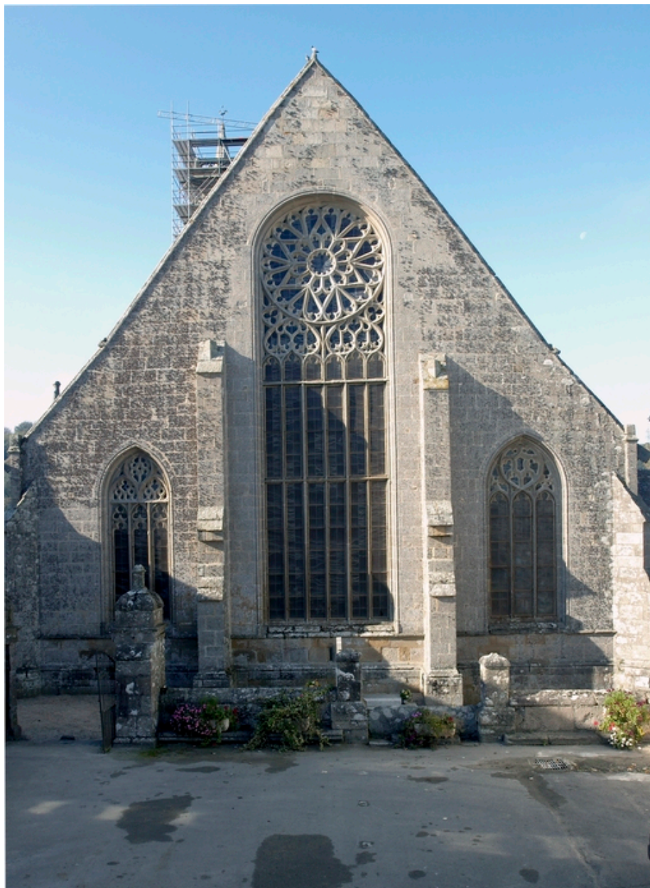
Saint-Jean-du-Doigt. Eglise Saint-Jean-Baptiste. Vue du chevet