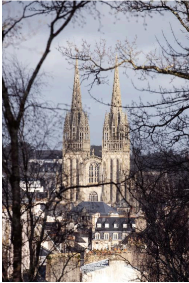
Quimper. La cathédrale vue depuis les hauteurs du mont Frugy IVR53_20192900253NUCA