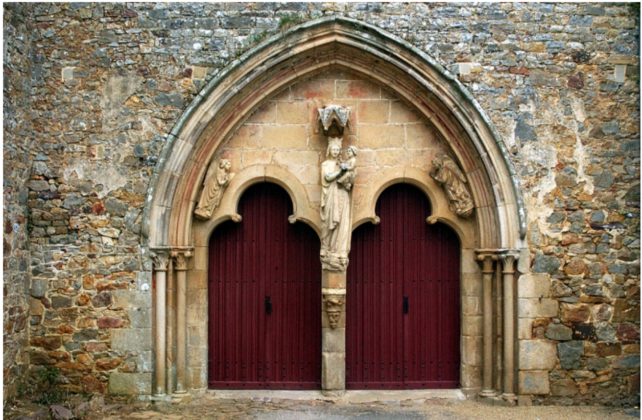
Paimpont. Eglise abbatiale Notre-Dame; Vue du portail ouest