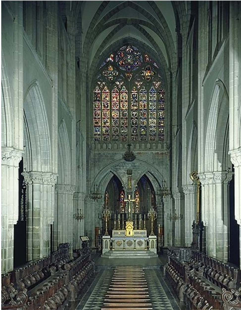
Dol-de-Bretagne. cathédrale Saint-Samson. Vue du chœur