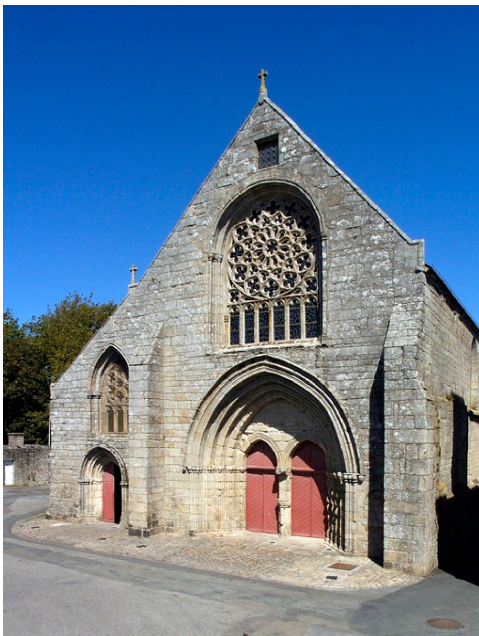
Pont L'Abbé. Eglise Notre Dame des Carmes. Vue de la façade ouest.