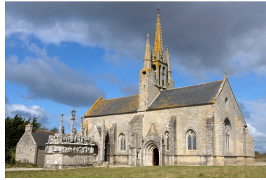
Saint-Jean-Trolimon. Chapelle Notre-Dame de Tronoën. Vue générale depuis le sud-est IVR53_20072900211NUCA