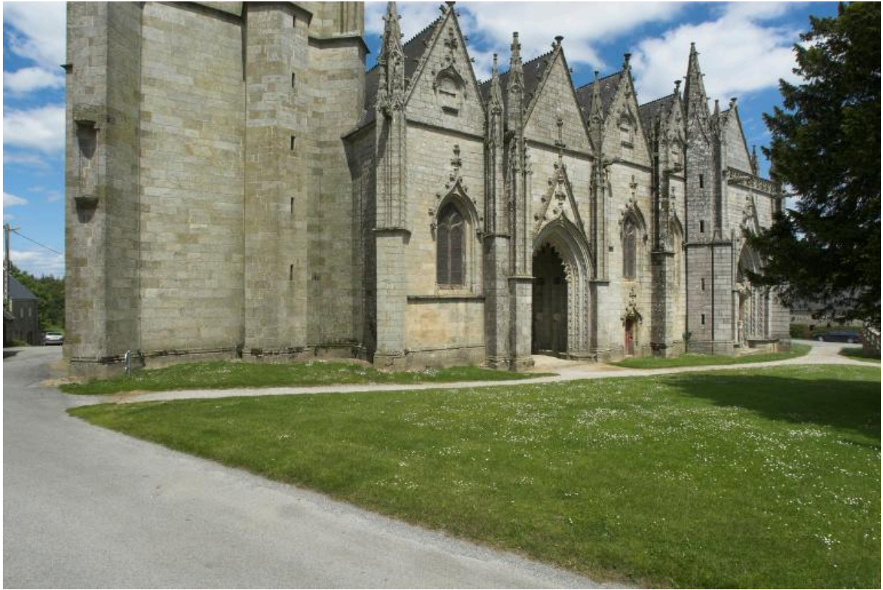
Guern. Chapelle Notre-Dame de Quelven. Vue partielle du front sud