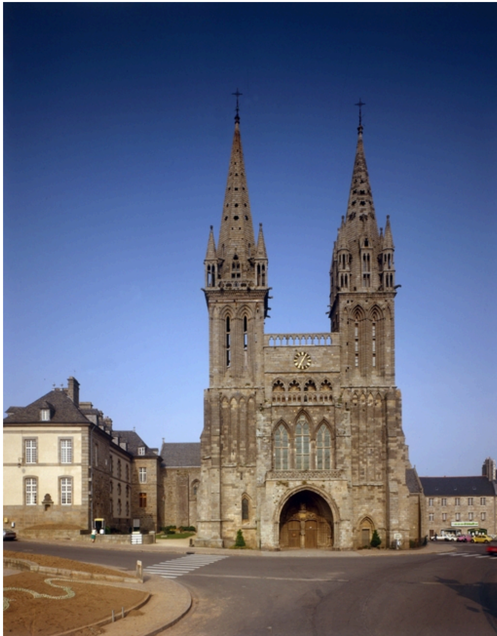
Saint-Pol-de-Léon (29). Cathédrale Saint Pol Aurélien; Vue générale de la façade occidentale