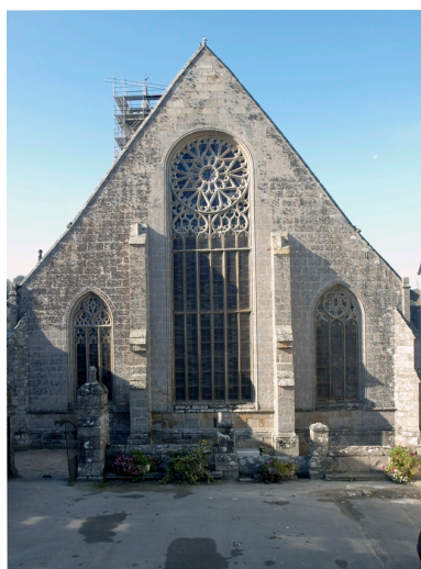
Saint-Jean-du-Doigt. Eglise Saint-Jean-Baptiste. Vue du chevet