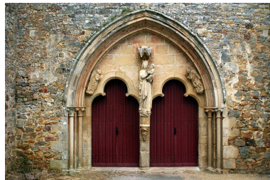
Paimpont. Eglise abbatiale Notre-Dame; Vue du portail ouest IVR53_20023502924NUCA