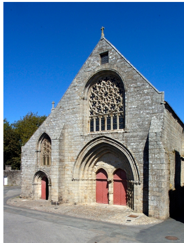
Pont L'Abbé. Eglise Notre Dame des Carmes. Vue de la façade ouest.