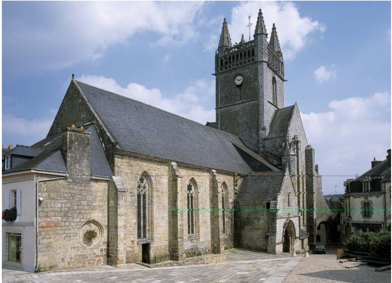
Quimperlé. Eglise Notre-Dame et Saint-Michel. Vue générale depuis le sud-ouest