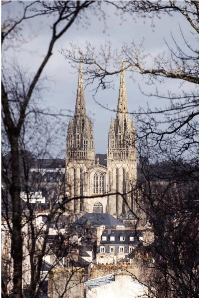
Quimper. La cathédrale vue depuis les hauteurs du mont Frugy