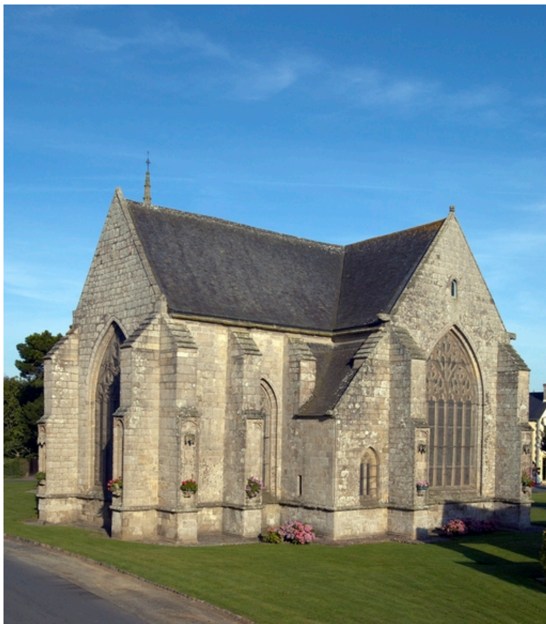
Lantic. Chapelle Notre-Dame de la Cour. Vue du chevet et du bras sud