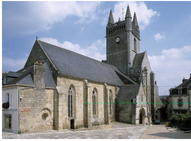
Quimperlé. Eglise Notre-Dame et Saint-Michel. Vue générale depuis le sud-ouest