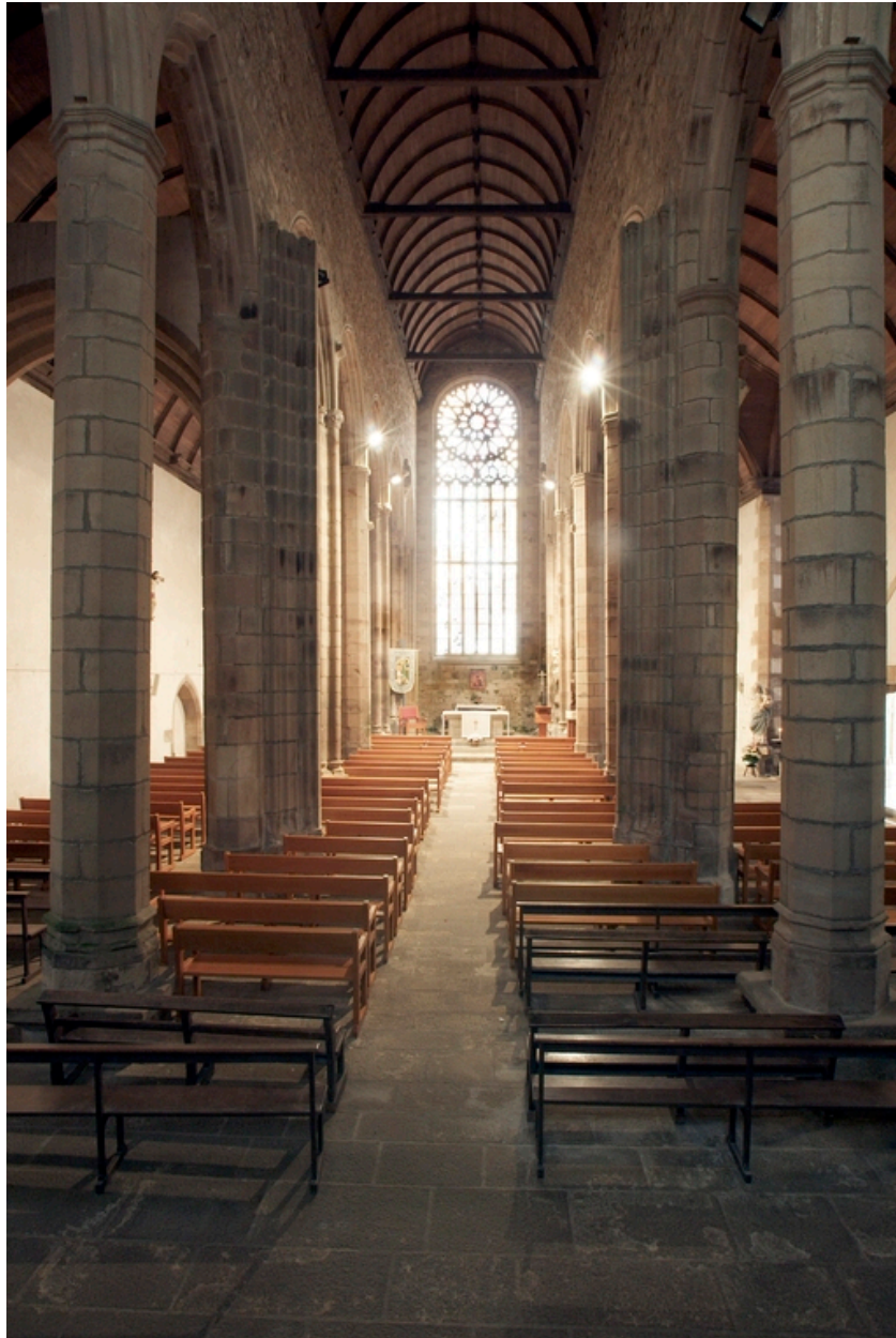
Saint-Jean-du-Doigt. Eglise Saint-Jean-Baptiste. Vue de la nef vers le choeur