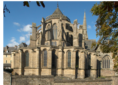
Redon. Ancienne abbatale Saint-Sauveur. Vue du chevet et de ses chapelles rayonnantes