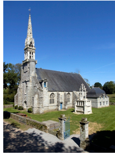
Ergué-Gabéric. Chapelle Notre-Dame de Kerdévat. Vue générale depuis le sud-ouest