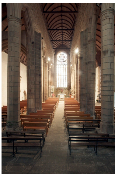
Saint-Jean-du-Doigt. Eglise Saint-Jean-Baptiste. Vue de la nef vers le chœur IVR53_20082900188NUCA