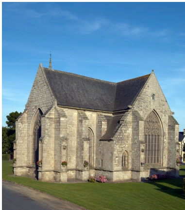
Lantic. Chapelle Notre-Dame de la Cour. Vue du chevet et du bras sud IVR53_20072200182NUCA