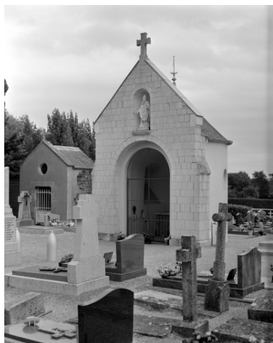
Élévation principale : vue générale