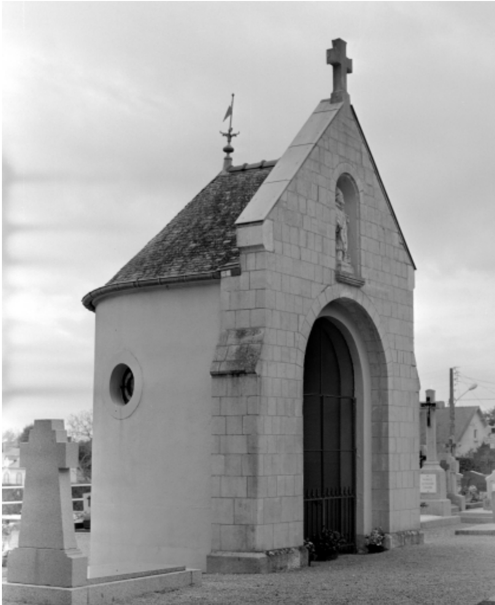
Elévation latérale : vue générale