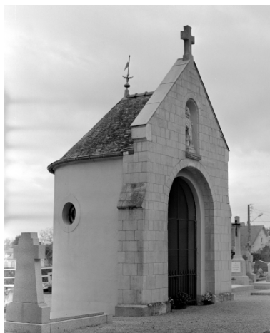
Élévation latérale : vue générale IVR53_19953500491X