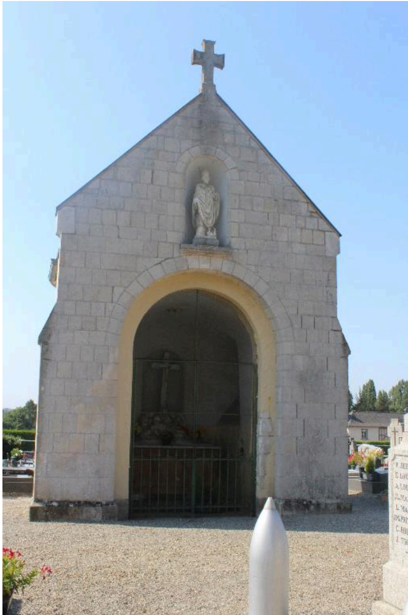
Façade principale : vue générale