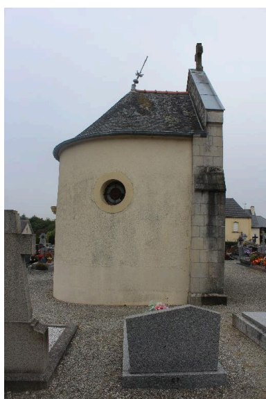
Côté est : vue générale IVR53_20163505758NUCA