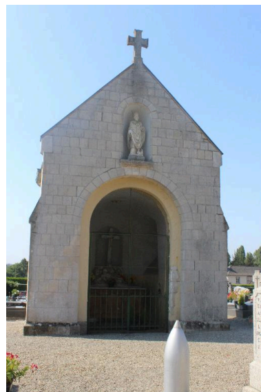
Façade principale : vue générale IVR53_20163505757NUCA