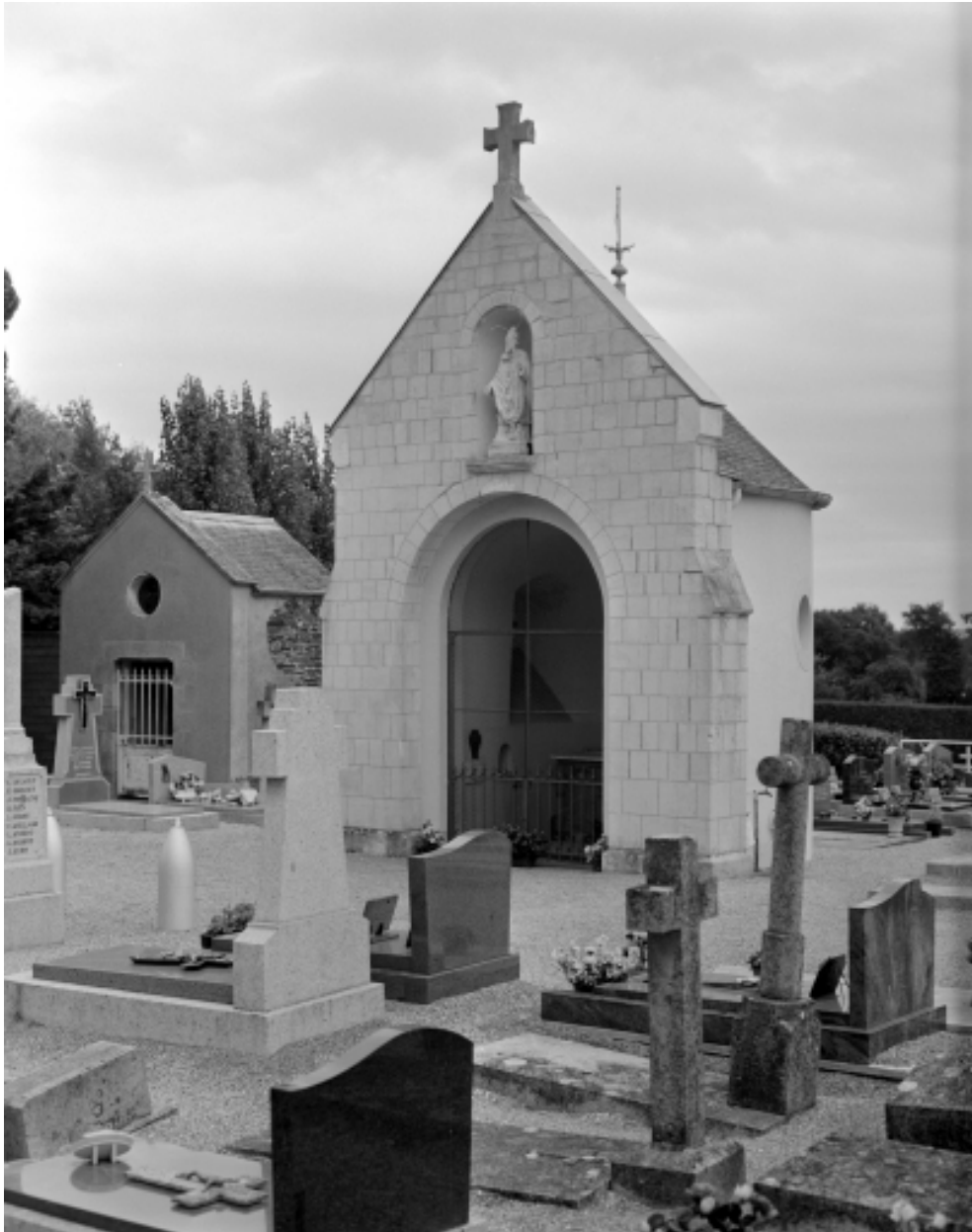
Elévation principale : vue générale