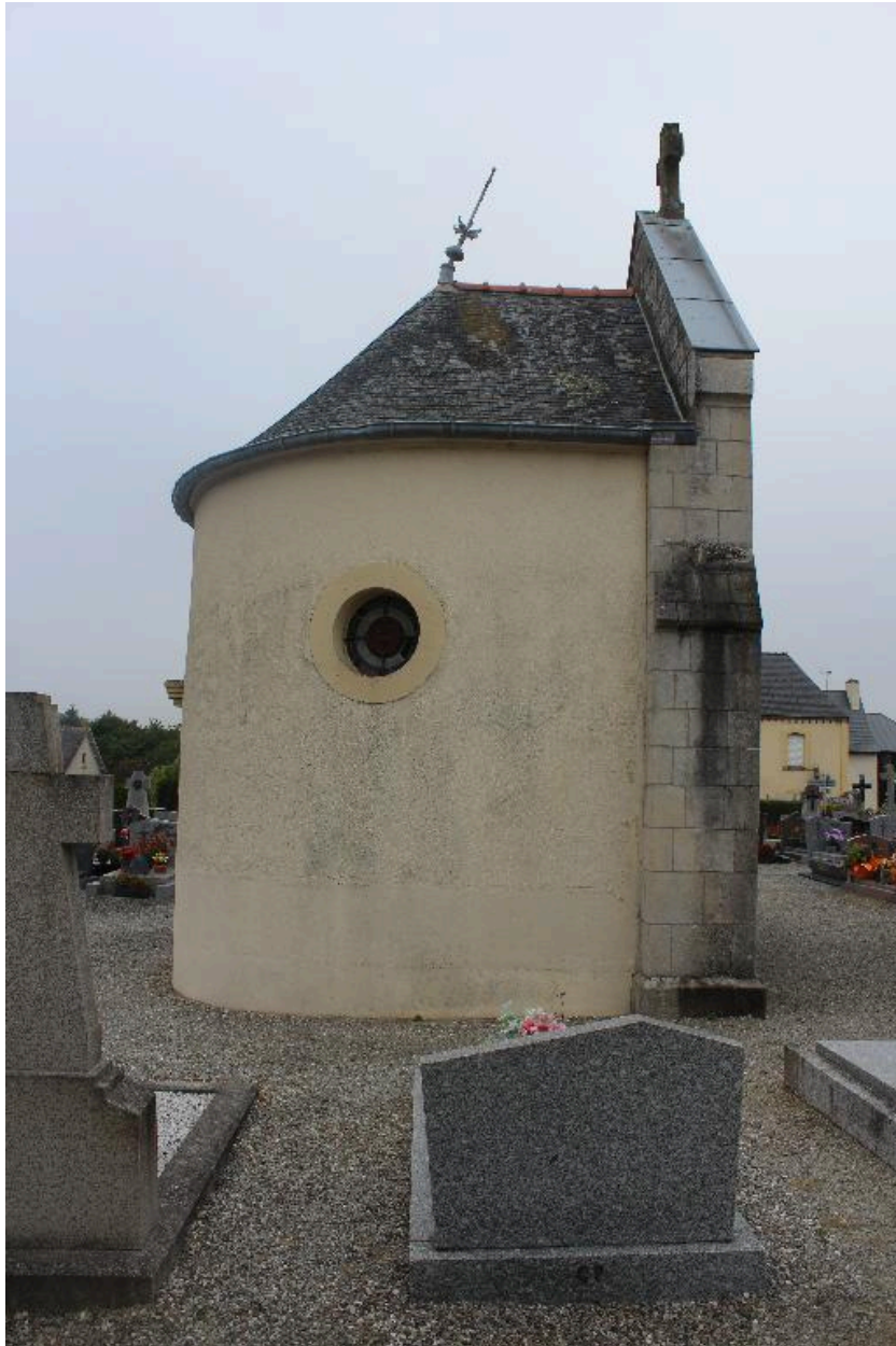
Côté est : vue générale