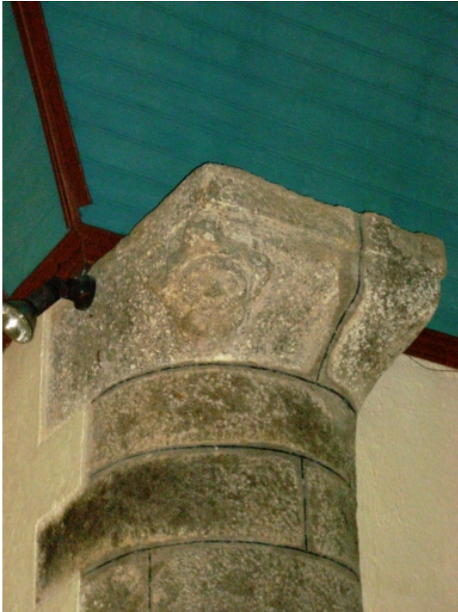
Détail colonne engagée à l'angle nord-ouest.