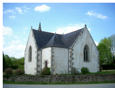
Vue générale sud-est. IVR53_20082905825NUCA