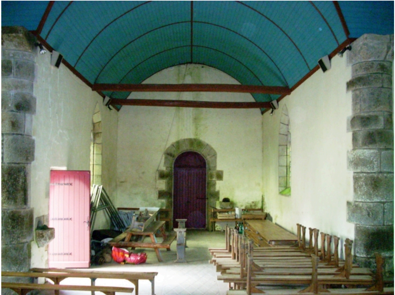
Vue axiale ouest.