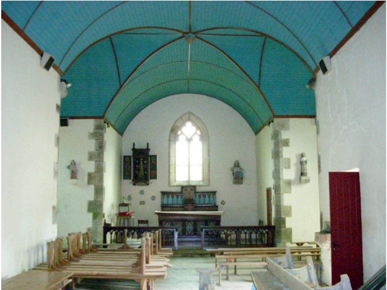
Vue axiale est.