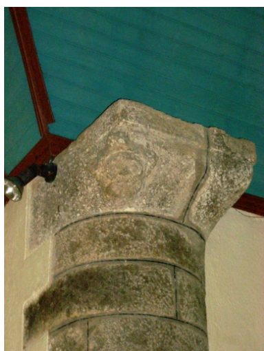
Détail colonne engagée à l'angle nord-ouest. IVR53_20082905829NUCA