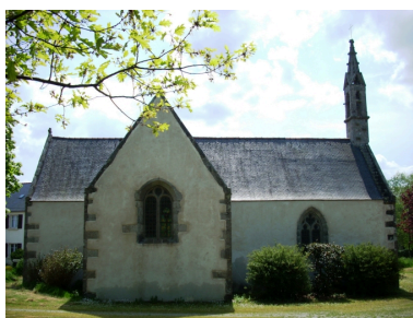
Elévation nord.