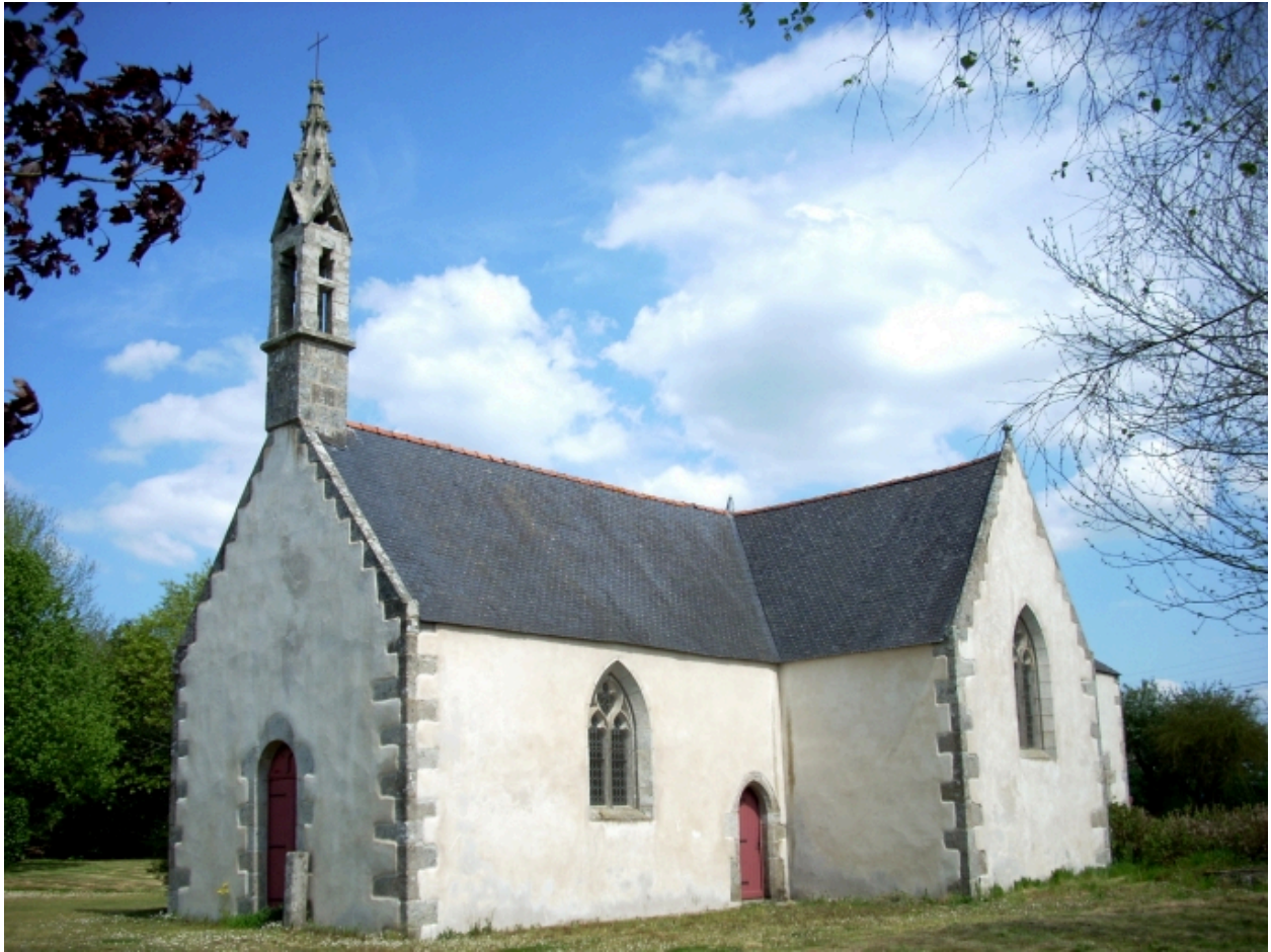
Vue générale sud-ouest.