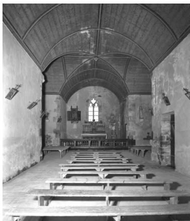
Vue générale intérieure d'ouest en est IVR53_19672900219V