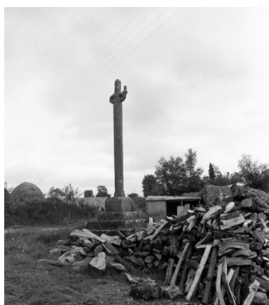
Croix, vue générale prise de l'ouest IVR53_19672900560Z