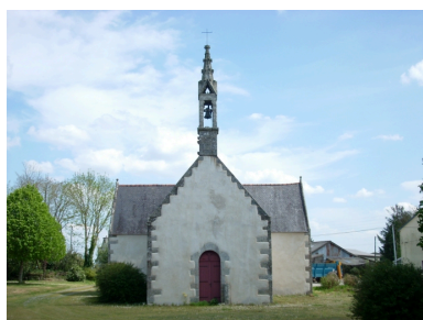
Elévation ouest.