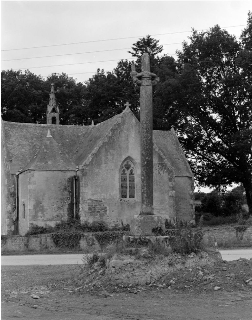
Calvaire, vue générale de face