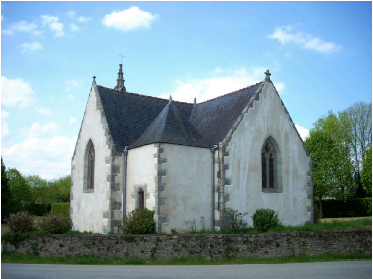
Vue générale sud-est.