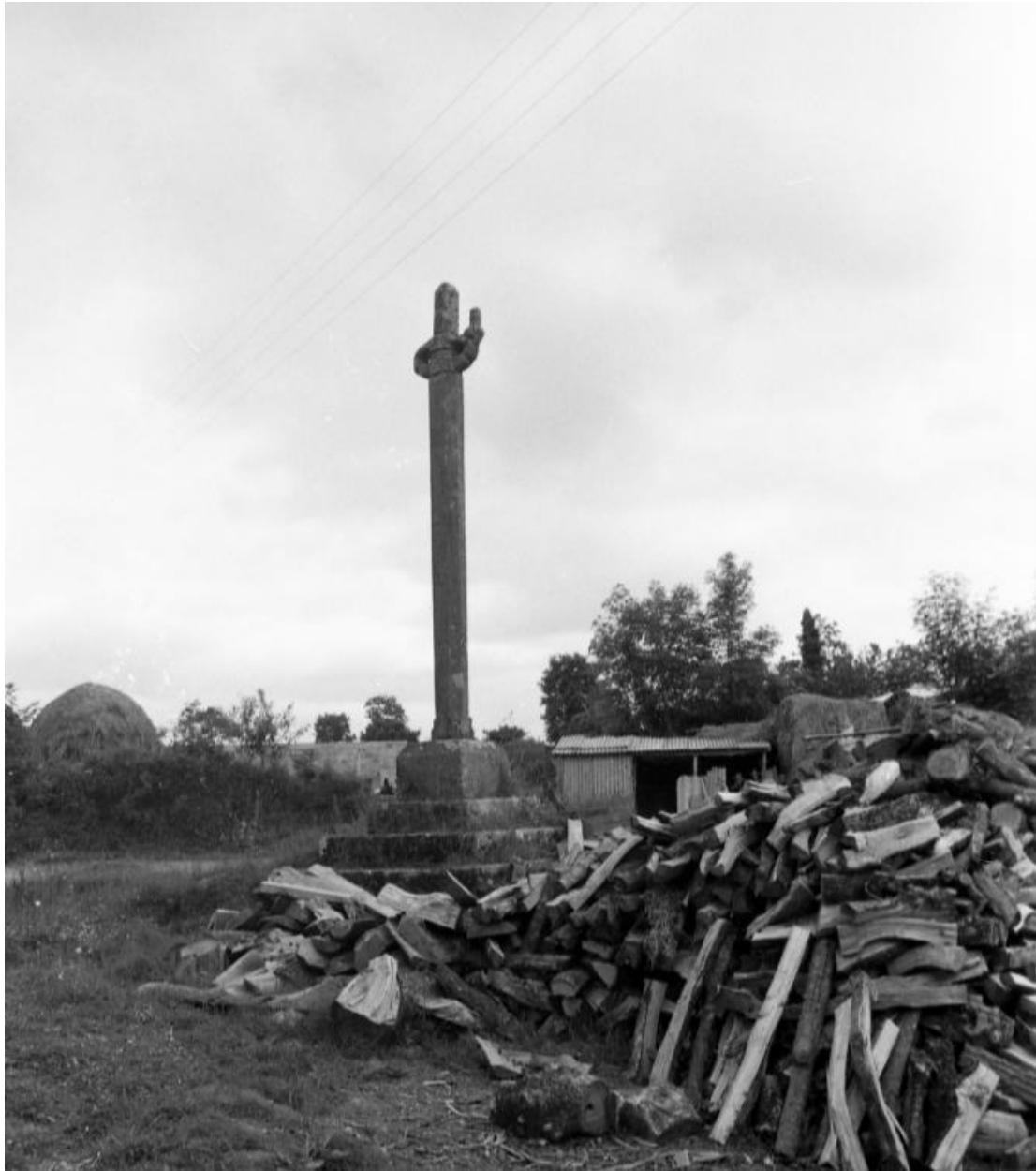
Croix, vue générale prise de l'ouest