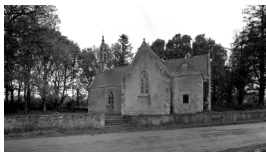
Vue générale sud IVR53_19672900220V