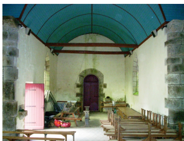
Vue axiale ouest.