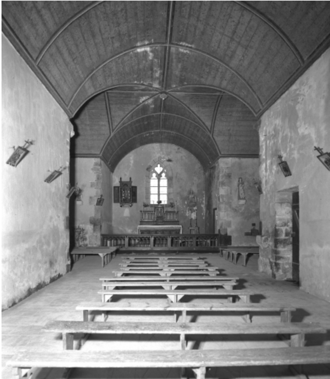
Vue générale intérieure d'ouest en est