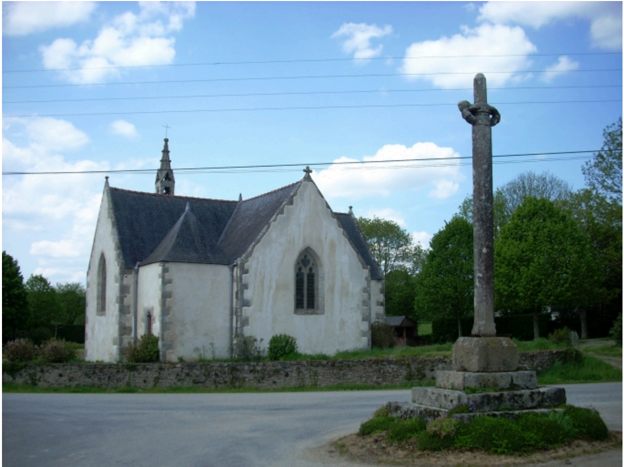
Vue générale sud-est.