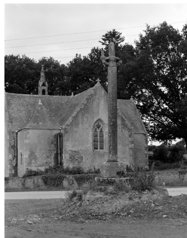
Calvaire, vue générale de face IVR53_19732900279X