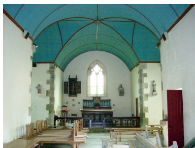
Vue axiale est. IVR53_20082905826NUCA