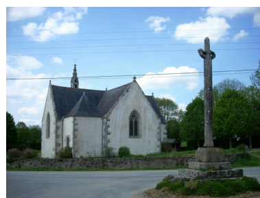
Vue générale sud-est. IVR53_20082905822NUCA