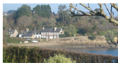
Vue générale du site d'échouage de Pont-Scorff IVR53_20072908943NUCA