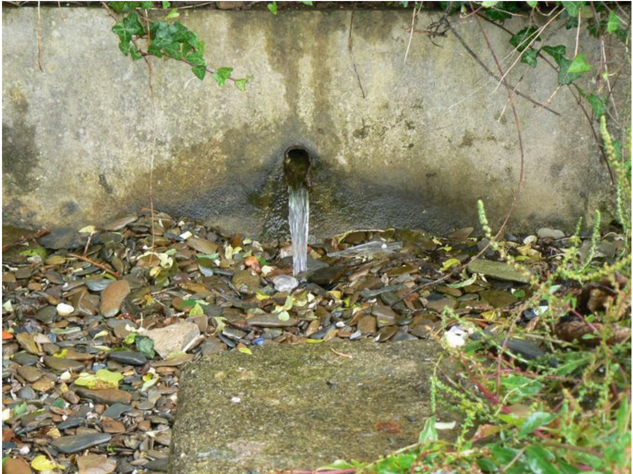
Fontaine de Pont-Scorff