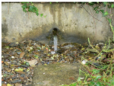
Fontaine de Pont-Scorff IVR53_20072908940NUCA