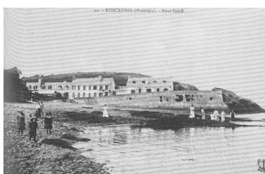
Carte postale : Pont-Scorff