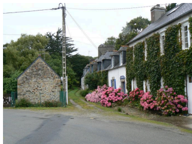
Edifice logistique de la Marine devenu auberge de jeunesse IVR53_20072908939NUCA