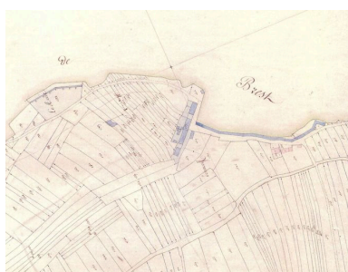
Extrait du cadastre de 1831 IVR53_20082908498NUC