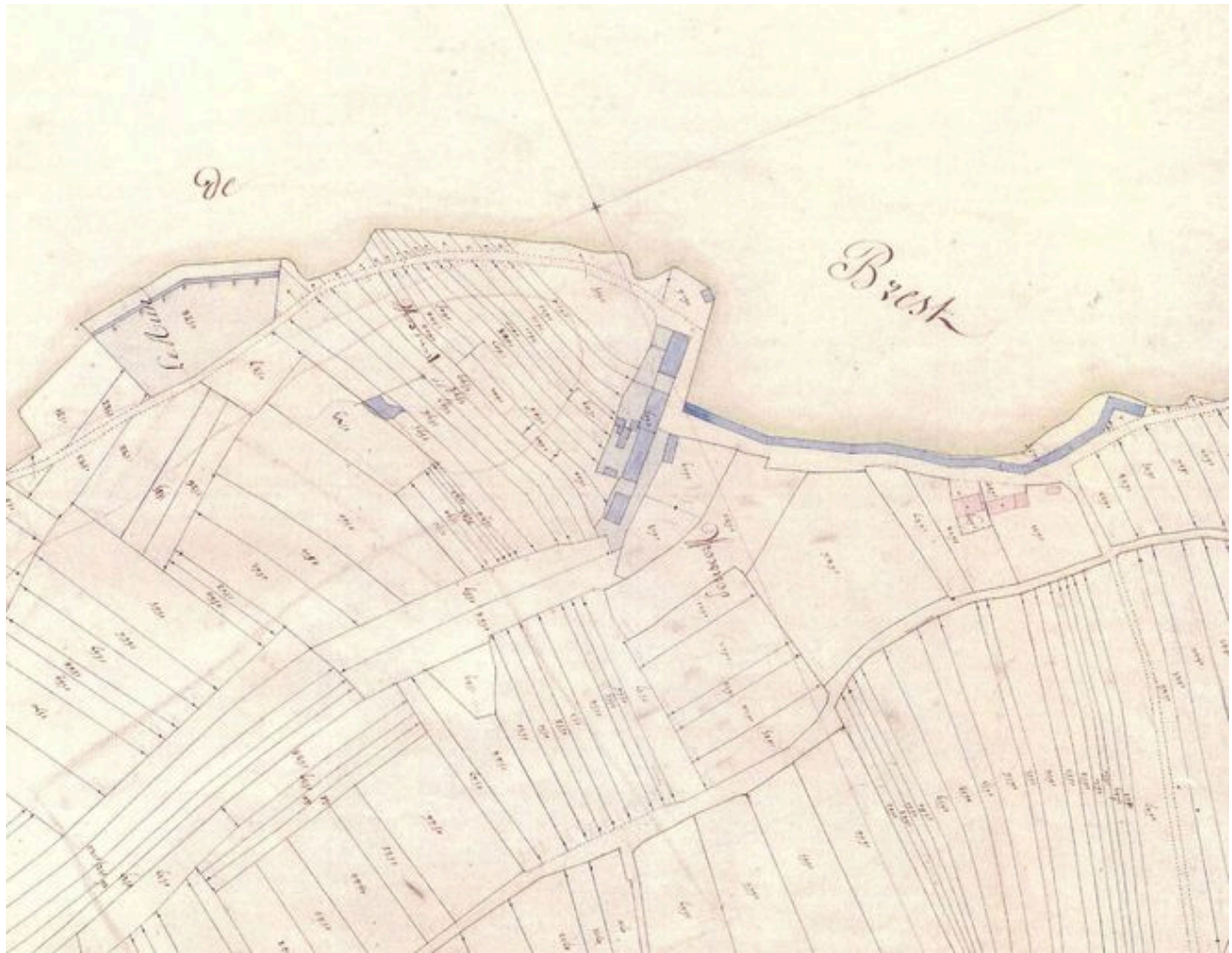
Extrait du cadastre de 1831