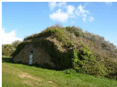
Batterie de Pont-Scorff IVR53_20082908398NUCA