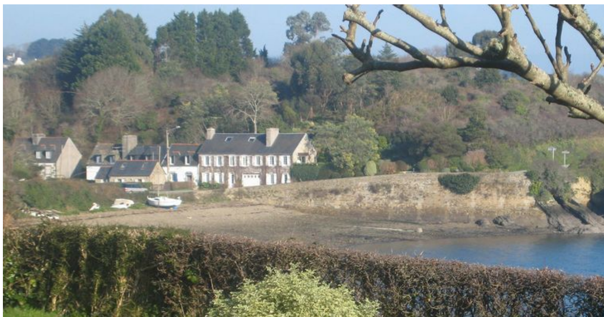
Vue générale du site d'échouage de Pont-Scorff