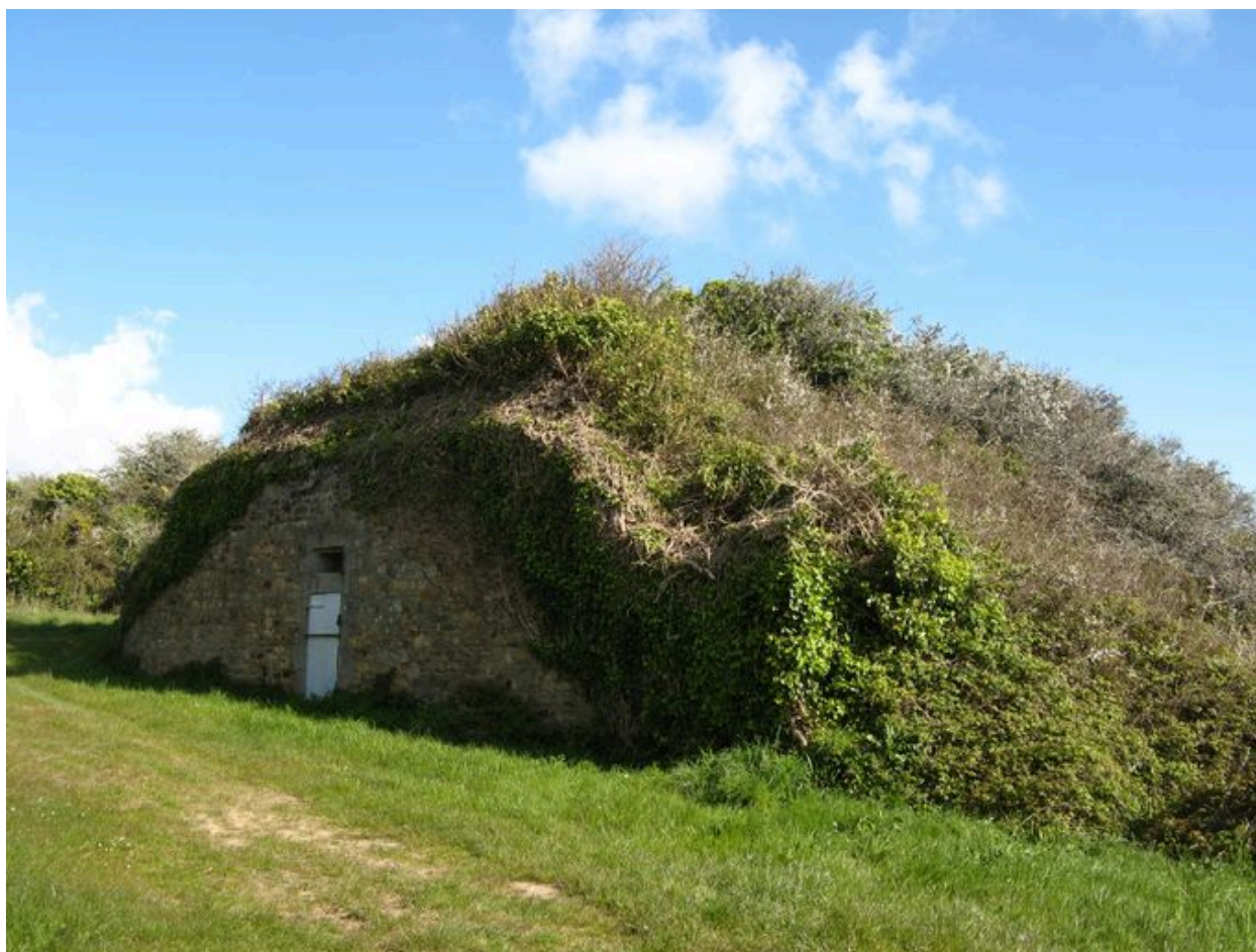
Batterie de Pont-Scorff