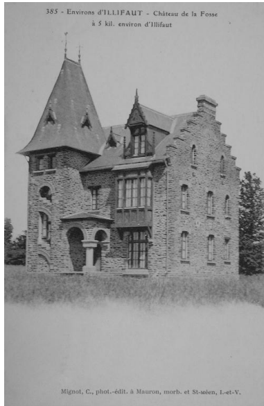
Vue générale (carte postale ancienne)