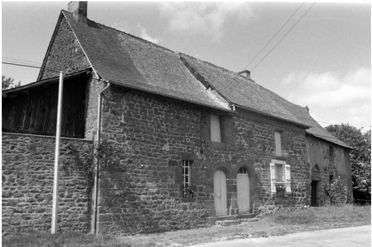
Vue sud-est en 1975