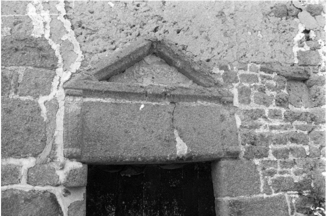
Détail du fronton triangulaire