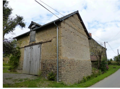
Grange vue générale sud ouest IVR53_20243531219NUCA