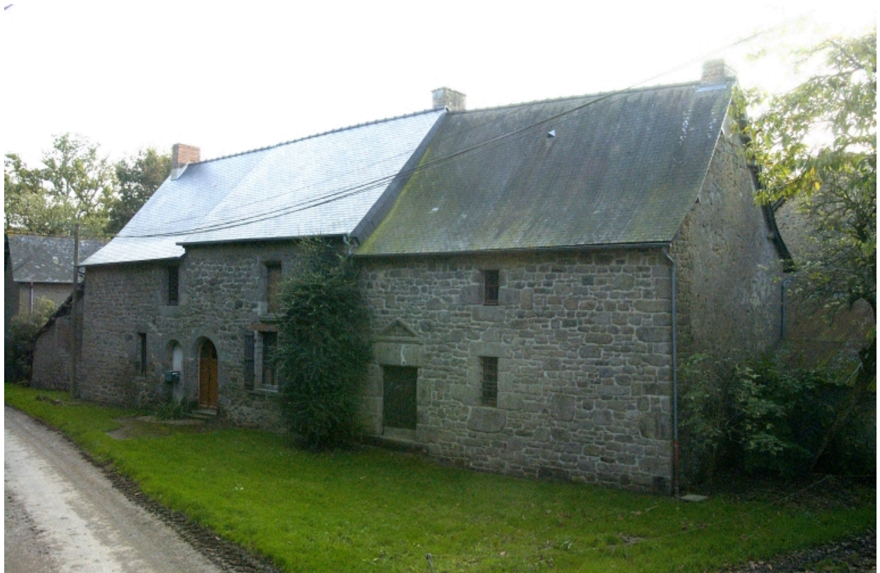
Vue générale nord-est