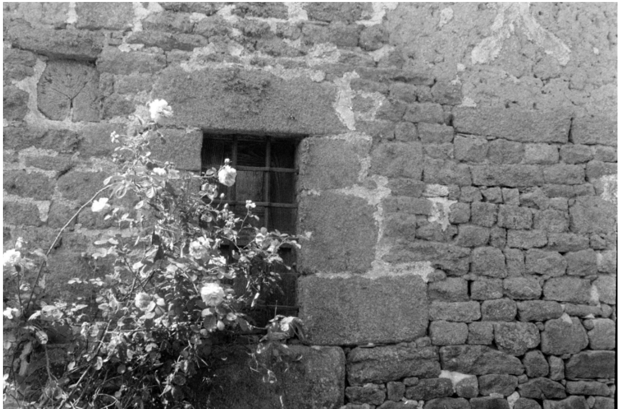
Détail d'une fenêtre