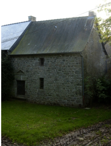
Partie nord IVR53_20053502964NUCA