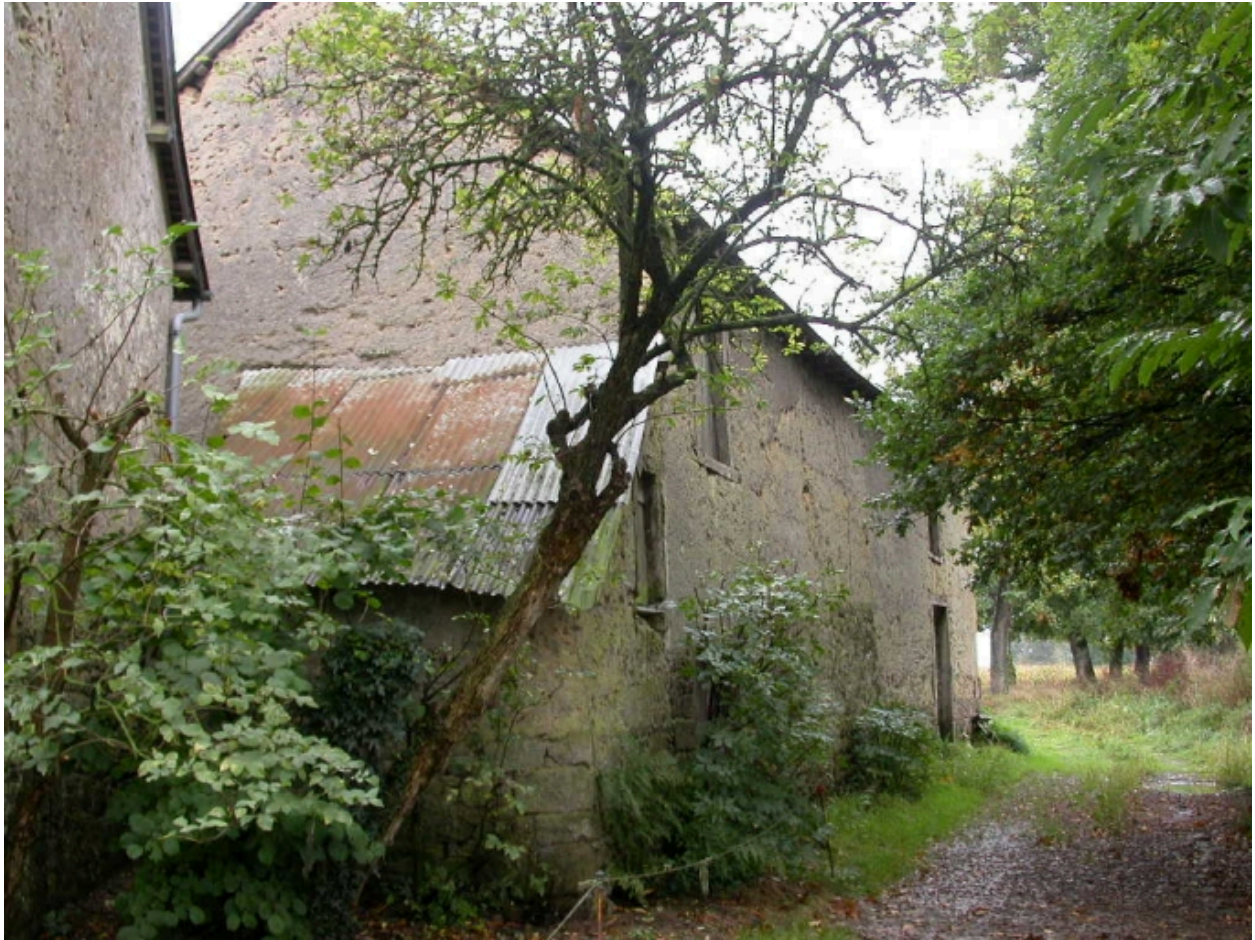
Les dépendances situées au nord-ouest