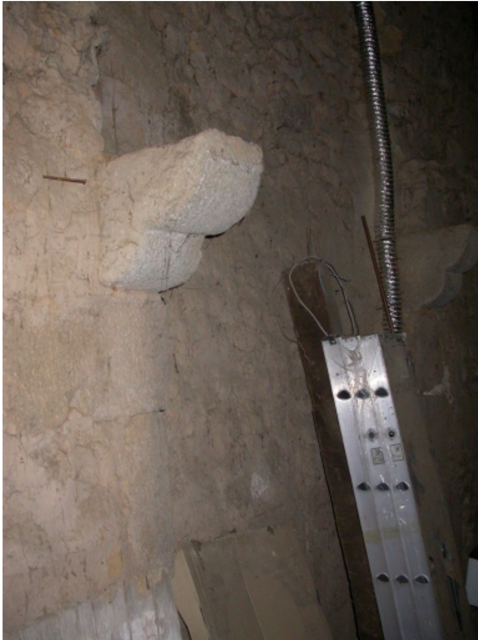
Corbeau de la cheminée de l'étage