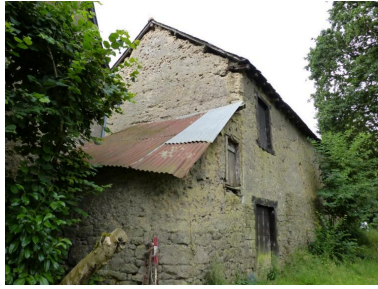
Vue générale du bâtiment au nord