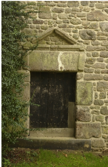
Détail de la porte surmontée d'un fronton IVR53_20053502965NUCA