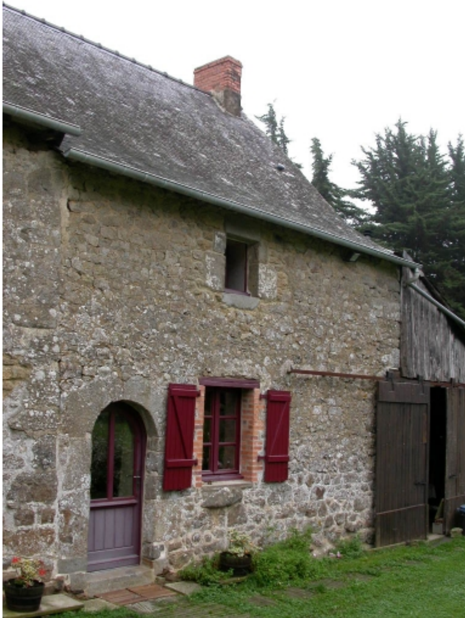
Façade postérieure de la partie sud