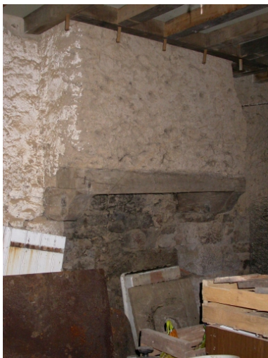
Cheminée du rez-de- chaussée, pignon nord IVR53_20053518880NUCA