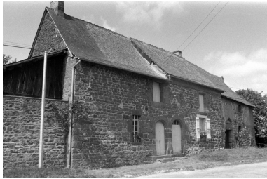
Vue sud-est en 1975