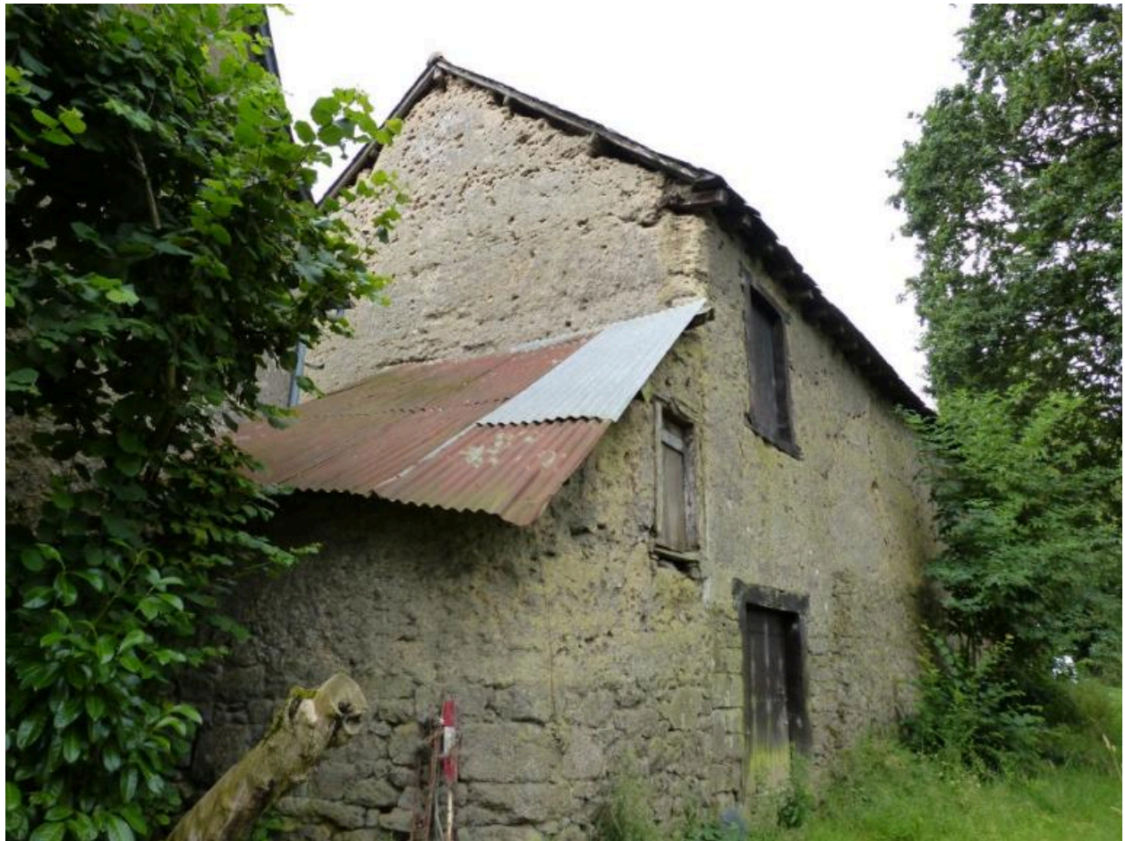
Vue générale du bâtiment au nord