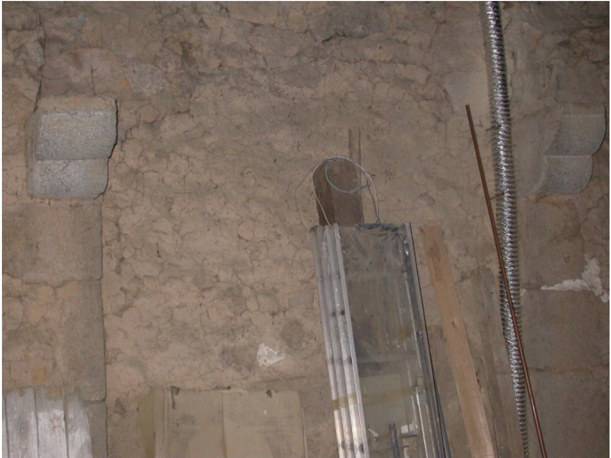
Cheminée de la pièce à feu de l'étage