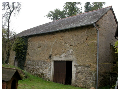
L'ancienne étable IVR53_20053518881NUCA