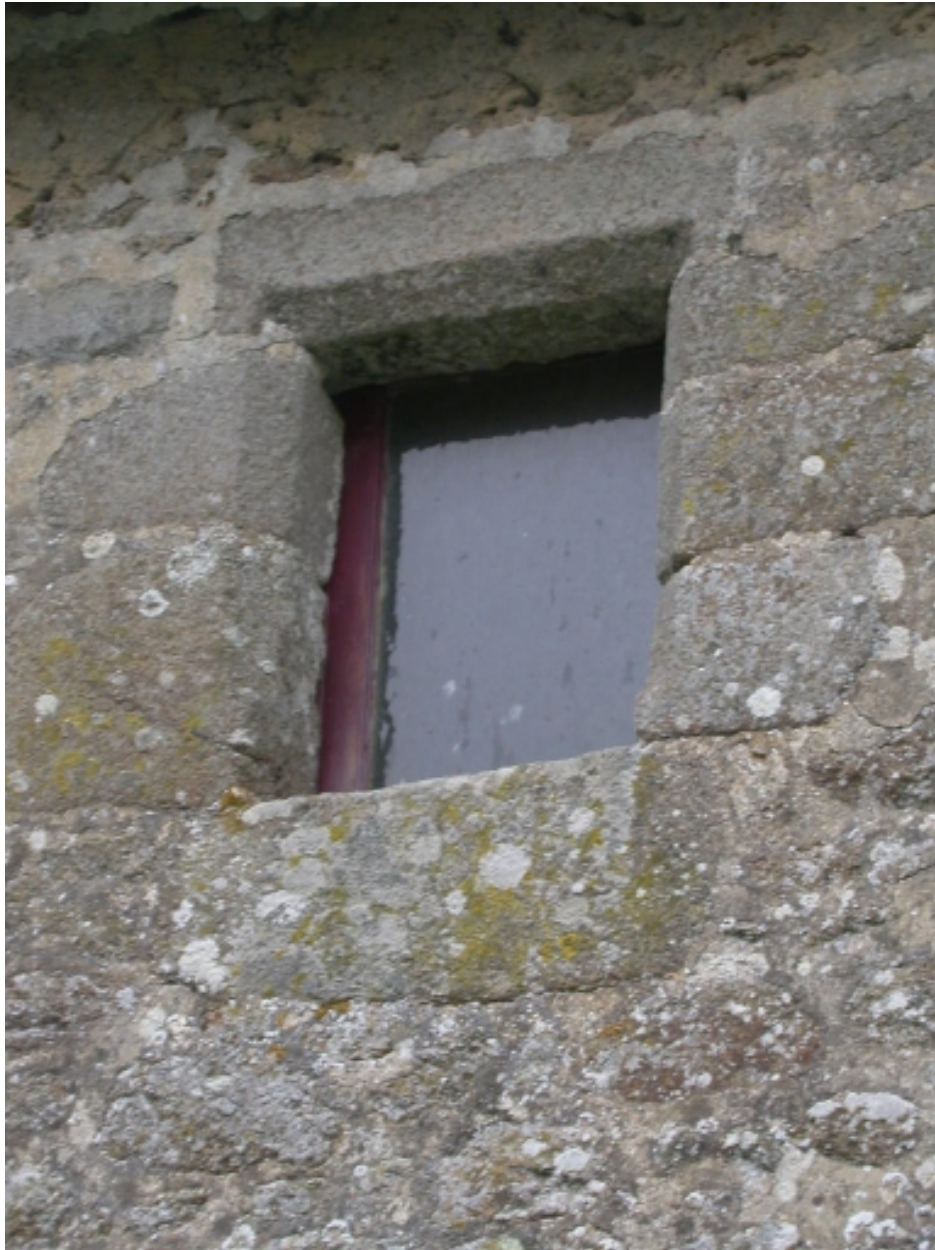
Fenêtre en façade postérieure de la pièce à feu de l'étage