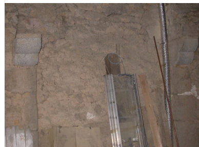
Cheminée de la pièce à feu de l'étage IVR53_20053518877NUCA