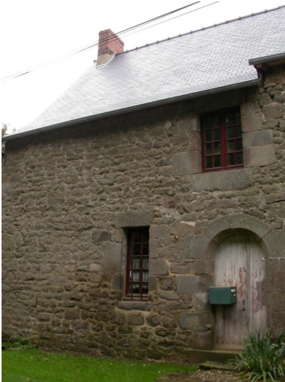
Partie sud du bâtiment