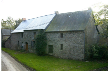
Vue générale nord-est IVR53_20053502963NUCA