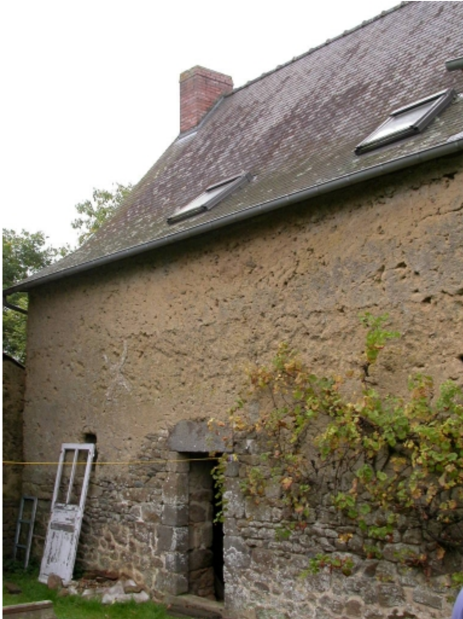
Façade postérieure de la partie nord