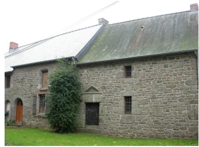
Partie nord