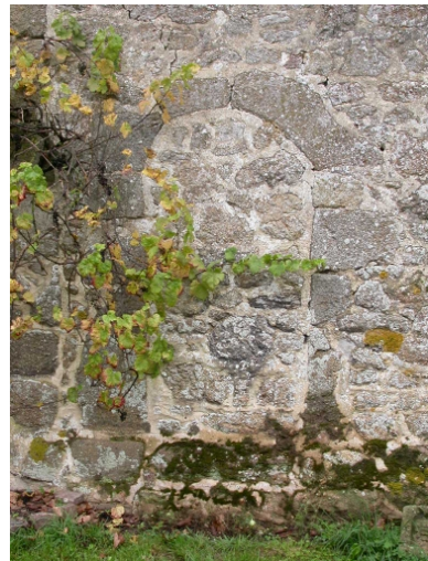
Porte en plein cintre murée en façade postérieure de la partie centrale IVR53_20053518875NUCA