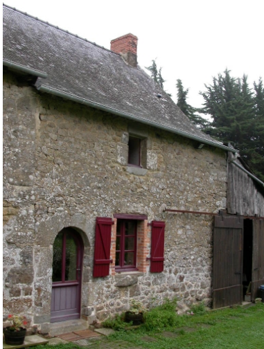
Façade postérieure de la partie sud