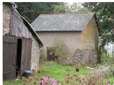
La grange IVR53_20053518882NUCA