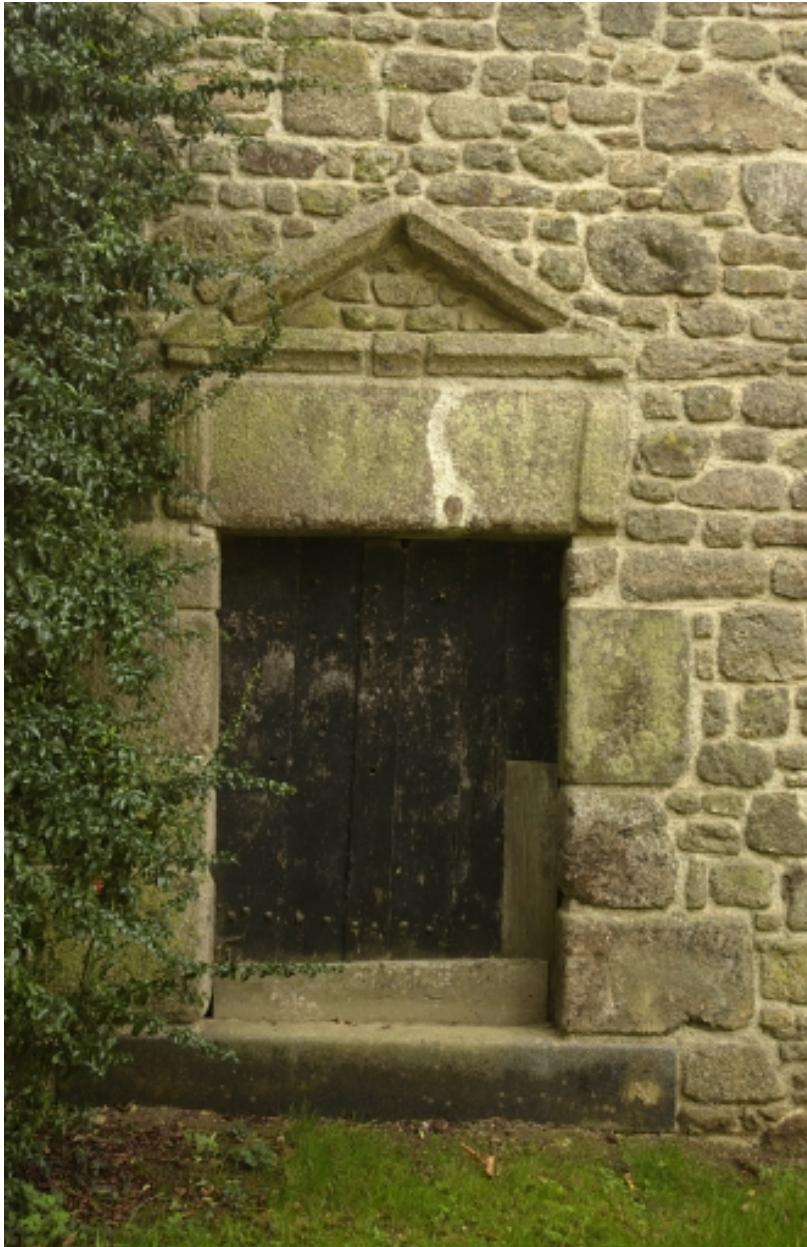
Détail de la porte surmontée d'un fronton