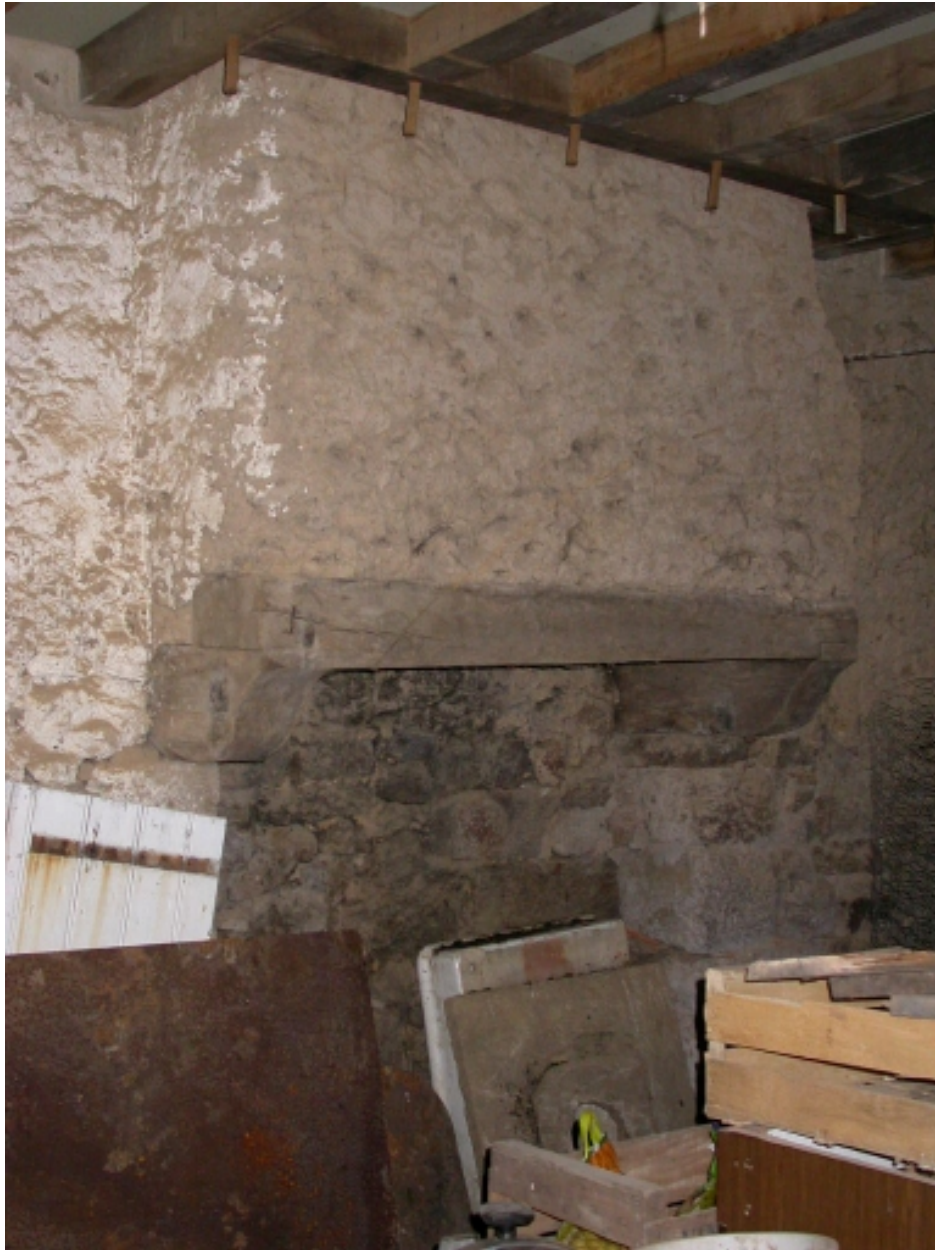
Cheminée du rez-de-chaussée, pignon nord