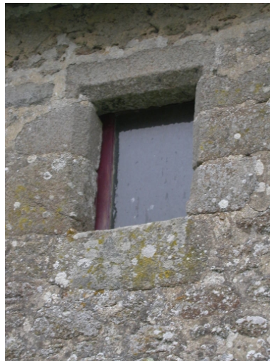
Fenêtre en façade postérieure de la pièce à feu de l'étage IVR53_20053518876NUCA