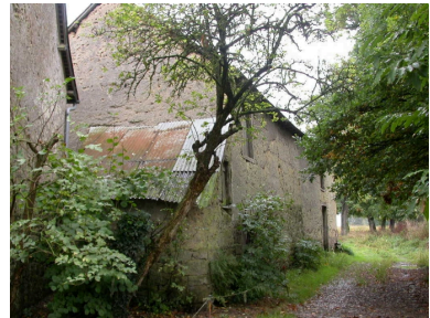
Les dépendances situées au nord-ouest IVR53_20053518870NUCA