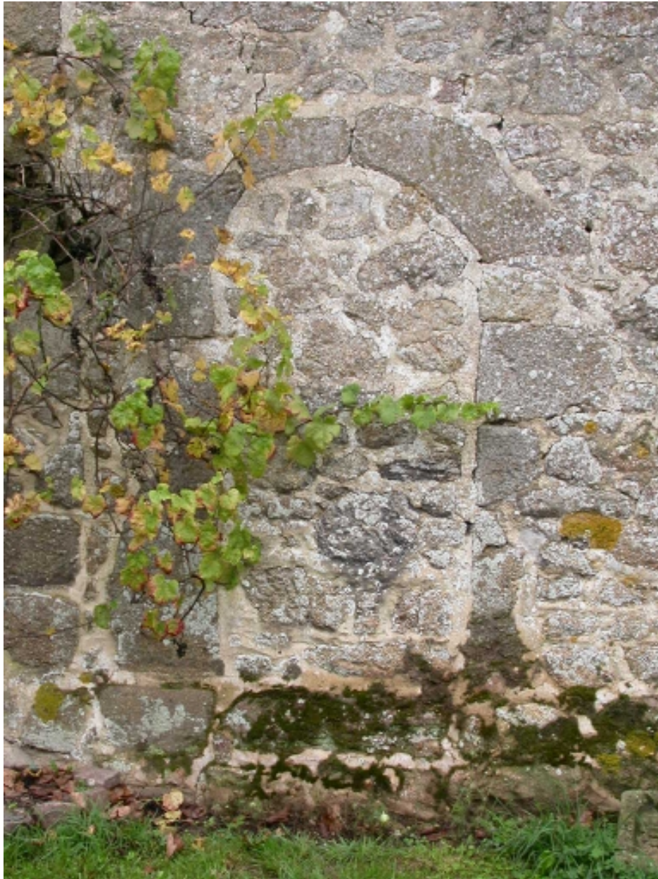
Porte en plein cintre murée en façade postérieure de la partie centrale