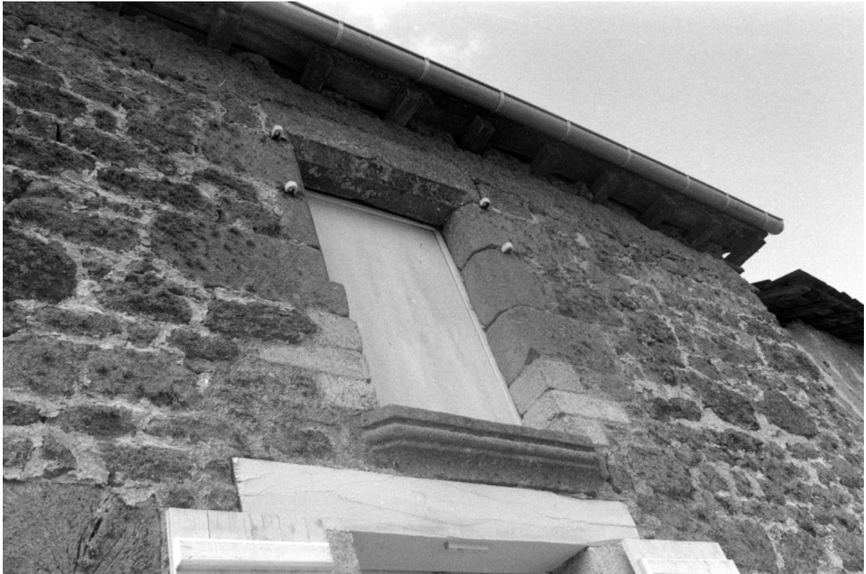
Détail d'une fenêtre de l'étage