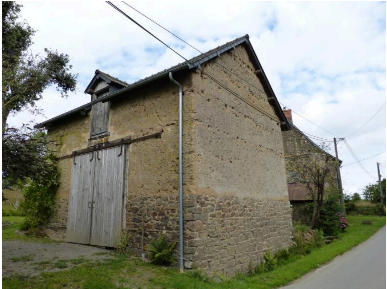
Grange vue générale sud ouest