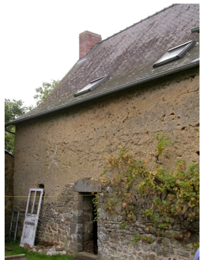
Façade postérieure de la partie nord IVR53_20053518873NUCA