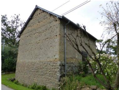
grange vue générale nord ouest