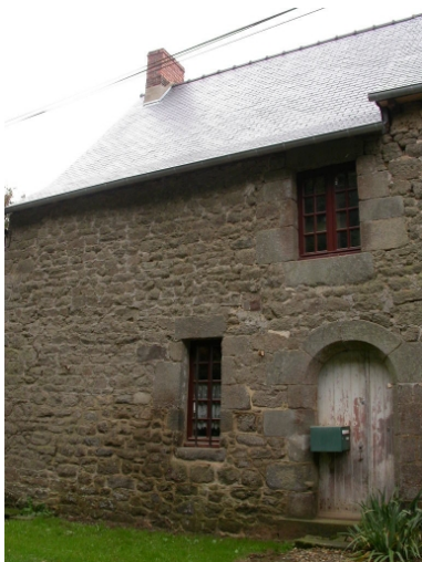
Partie sud du bâtiment