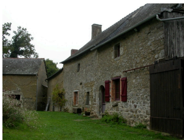
Façade postérieure