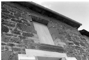
Détail d'une fenêtre de l'étage