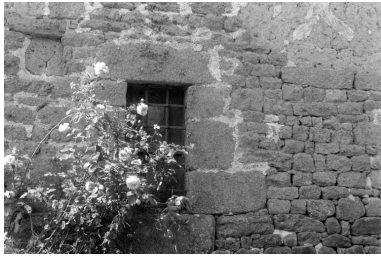
Détail d'une fenêtre