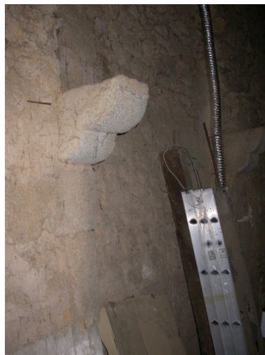
Corbeau de la cheminée de l'étage