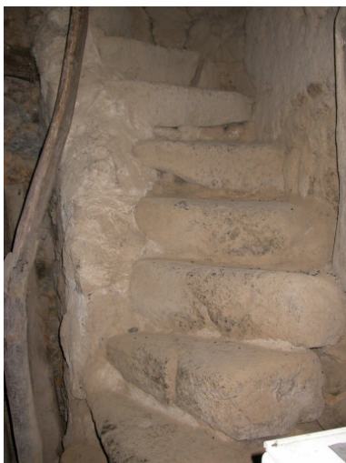
Escalier en vis