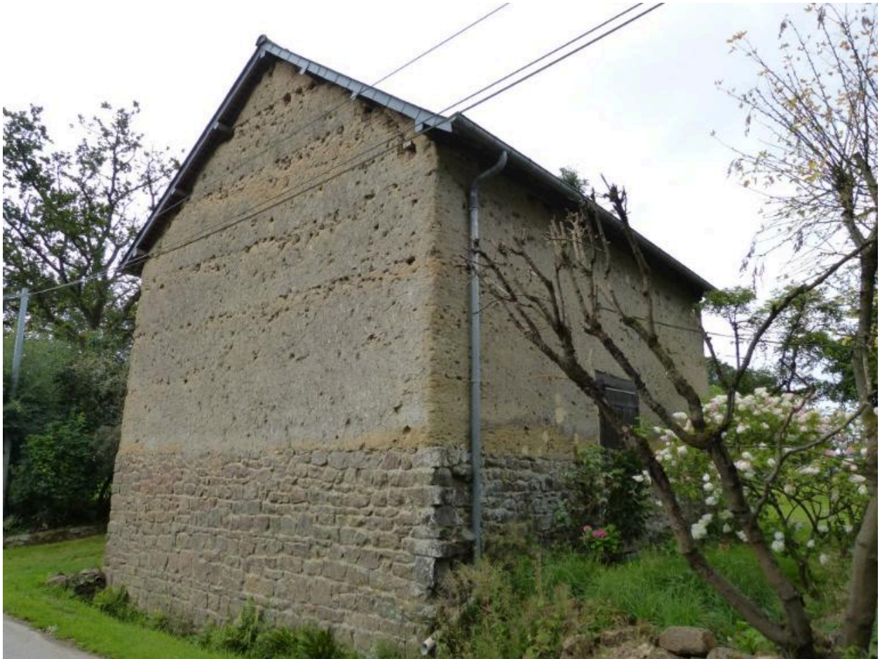
grange vue générale nord ouest