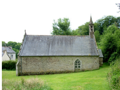
Bohars, chapelle de Loguillo : élévation nord IVR53_20082906389NUCA