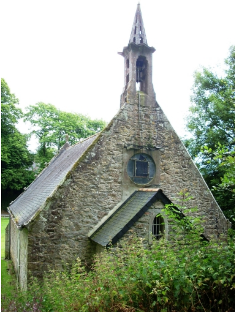
Bohars, chapelle de Loguillo : vue générale nord-ouest