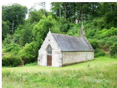
Bohars, chapelle de Loguillo : vue générale nord-est