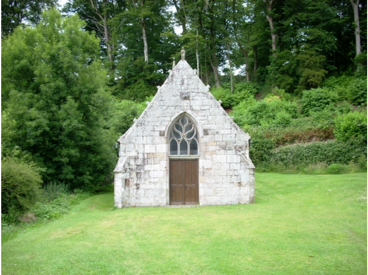
Bohars, chapelle de Loguillo : élévation est