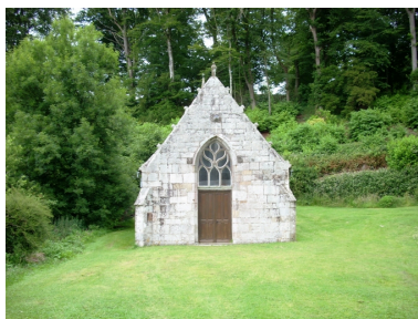
Bohars, chapelle de Loguillo : élévation est