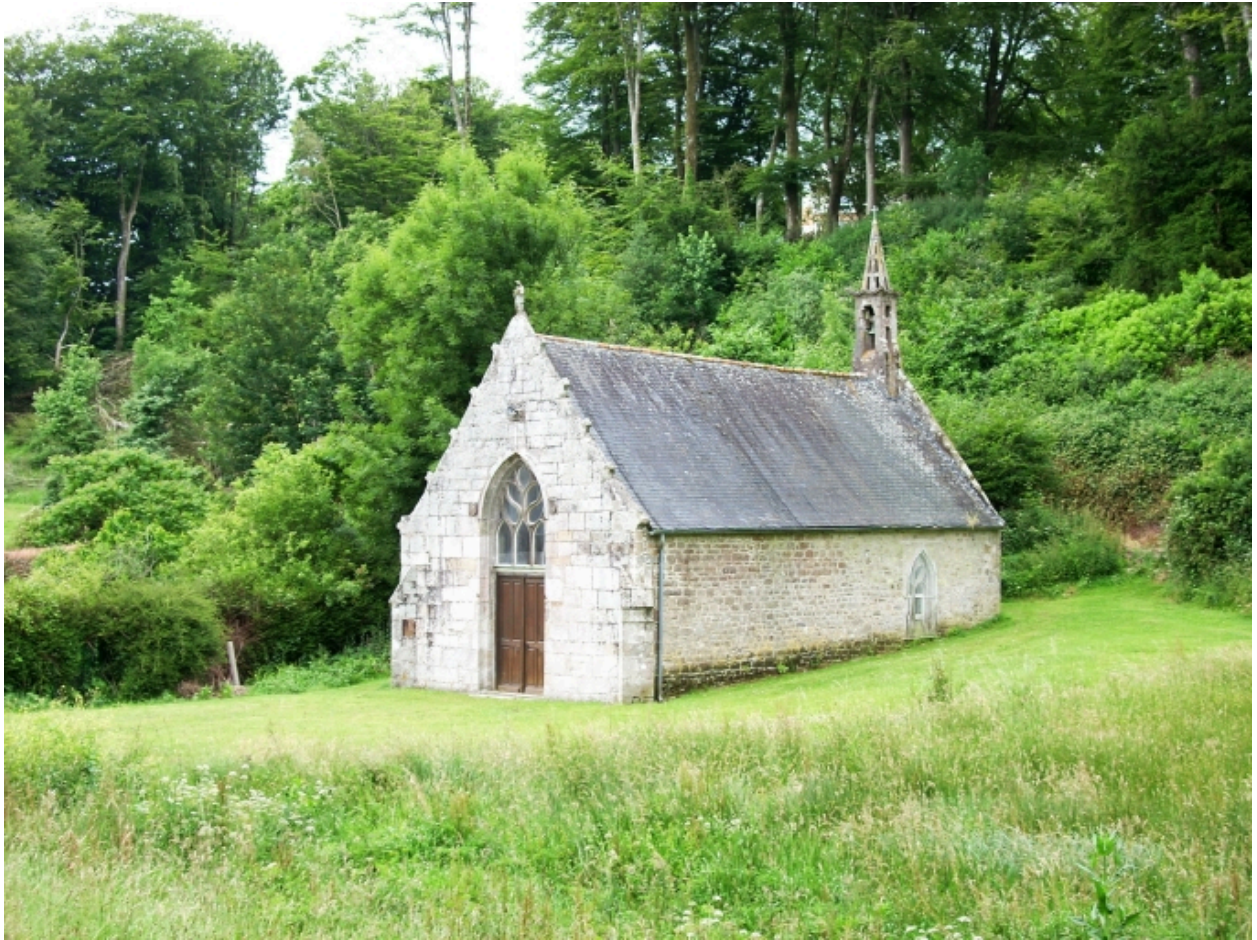
Bohars, chapelle de Loguillo : vue générale nord-est