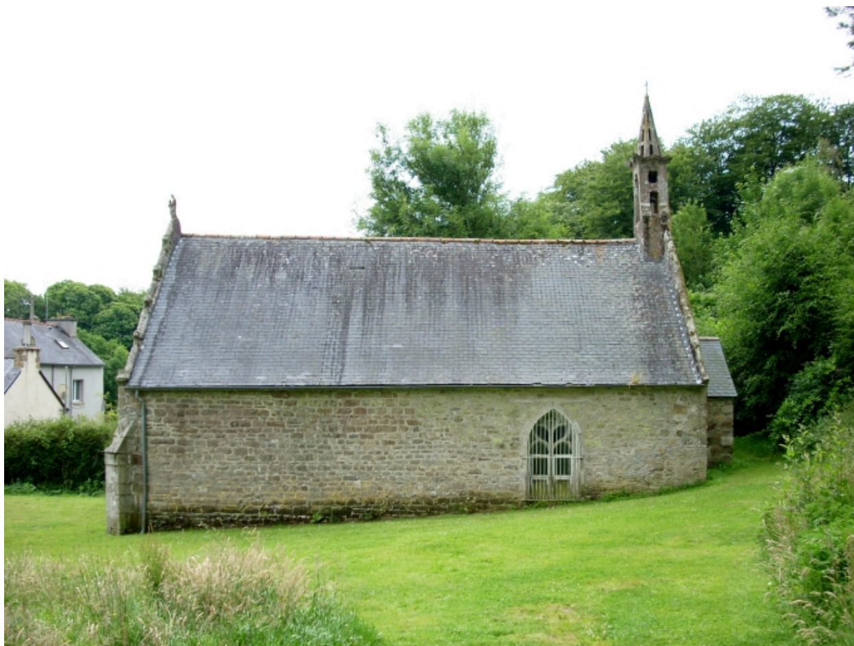
Bohars, chapelle de Loguillo : élévation nord