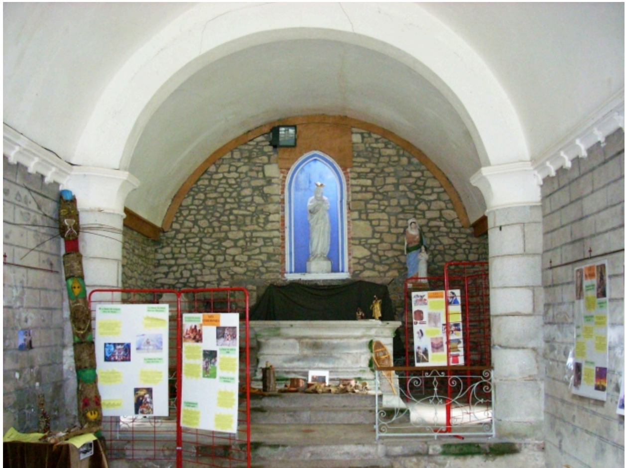
Bohars, chapelle de Loguillo : vue axiale ouest