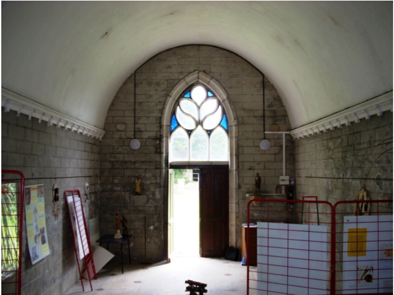
Bohars, chapelle de Loguillo : vue axiale est