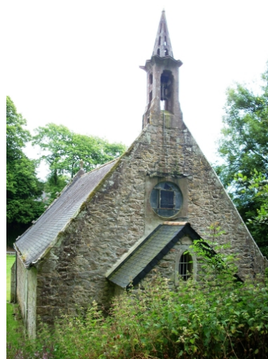
Bohars, chapelle de Loguillo : vue générale nord-ouest IVR53_20082906388NUCA