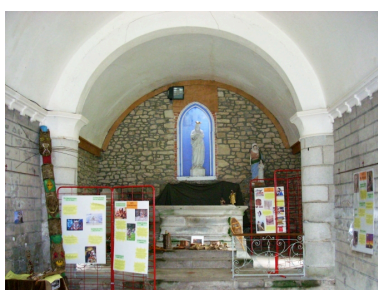
Bohars, chapelle de Loguillo : vue axiale ouest IVR53_20082906390NUCA